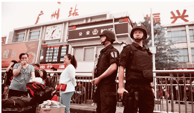
Полиция на вокзале г. Гуанчжоу, 6 мая 2014 г.

6 мая на вокзале города Гуанчжоу, провинция Гуандун, ножевые ранения получили шесть человек. То есть если раньше целью уйгурских террористов были госслужащие, а также государственные объекты, то теперь целью стали гражданские лица и объекты. Гуанчжоу расположен еще дальше,