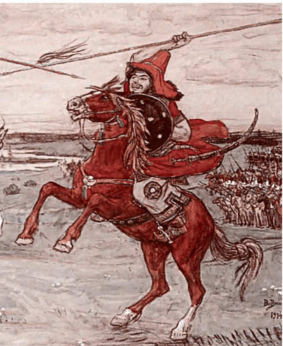
В. Васнецов. Поединок Пересвета с Челубеем

Когда я вижу листовки и наклейки с призывом «Русский русскому помоги», у меня возникает целый рой вопросов. Во-первых, что делать, если увидишь нуждающегося в помощи явно нерусского человека? Проходить мимо, экономя энергию и средства для нуждающегося соплеменника? И как определить, что это стопроцентно твой соплеменник? — спрашивать паспорт и фамилии родственников хотя бы до третьего колена? Но, допустим, ты как-то разобрался — и вдруг видишь, что этому человеку уже готов помочь... ну, допустим, сердобольный узбек. Нужно ли его с возмущением оттолкнуть, чтобы не лез не в свое дело — иначе бог вест, сколько еще искать «правильный» объект для помощи?