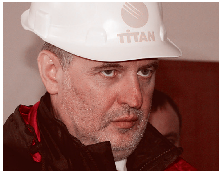
Миллиардер Дмитрий Фирташ

Первой жертвой крупного «отжима» стал Дмитрий Фирташ, хозяин телеканала «Интер», а также производств аммиака, азотных удобрений, титанового концентрата и много чего еще. Сначала Киев объявил его в розыск в Интерпол