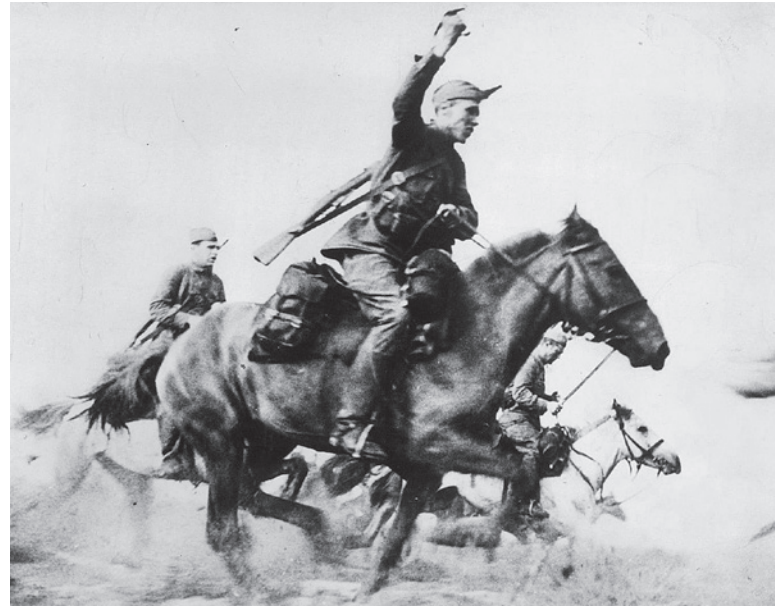
Советские кавалеристы в сабельной атаке, 1941 г.

Поразительным образом всё это происходило под лозунгом движения в сторону осовременивания музейного дела. Мол, в связи с отсталостью России надо ускоренно создавать современные музеи. Именно этого требуют, по мнению бизнесменов-музейщиков типа Гельмана, креаклинные россияне. Предложение осчастлививать креаклов за счет частных пожертвований, а не щедрых бюджетных вливаний, господ типа Гельмана яростно отвергали.