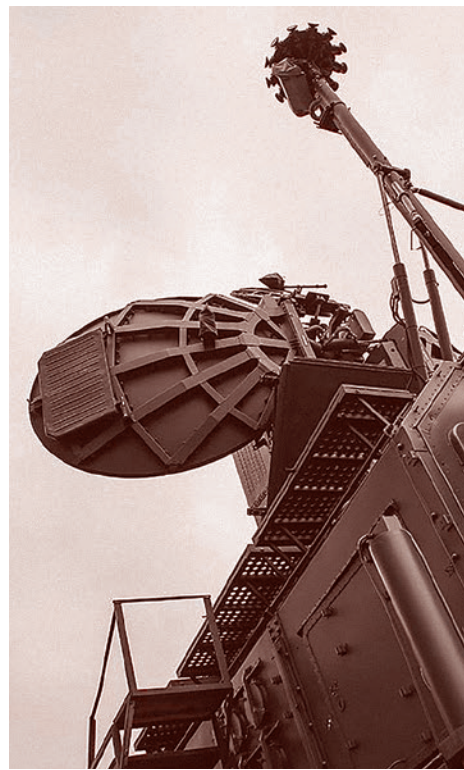
Комплекс радиоэлектронной борьбы «Красуха-4»

По словам Ходорковского, вопрос власти в России не будет решен путем демократических выборов, и об этом можно забыть. В настоящий момент только 12% россиян поддерживают идею правительства по западному образцу, уточнил Ходорковский, однако он считает, что в Москве таких людей, вероятнее всего, около 30%. Так как российская политика вершится в крупных городах, эти 30% могут оказать серьезное влияние, подчеркнул Ходорковский. По его словам, «Открытая Россия» постарается установить каналы связи с этими людьми и объединить их для выполнения определенных задач, одной из которых он назвал поддержку кандидатов на парламентских выборах 2016 года.