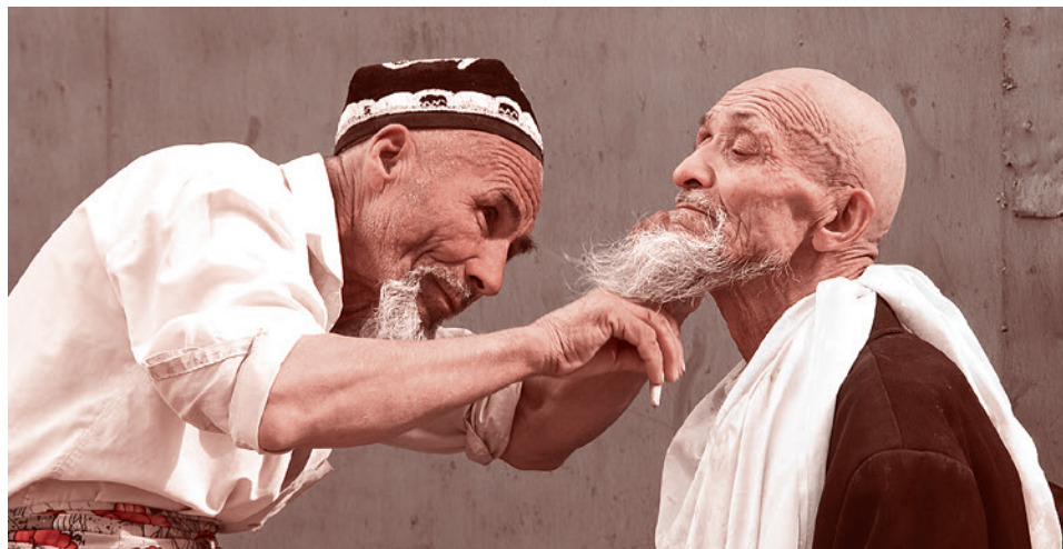
Цирюльник в Кашгаре

Синьцзян-Уйгурский автономный район (СУАР) населяют 47 национальностей. Но титульной нацией автономного района являются уйгуры. И именно на них ориентирована политика КНР в этом районе. Определяющим же в этой политике является сегодня тот факт, что значительное число уйгуров исповедует ислам. А также то, что ислам уйгуров с каждым годом становится всё более радикальным. Дополнительное напряжение в этой ситуации создает то, что значительное число уйгуров проживает не в КНР, а на юге Киргизии, где они относятся к радикально настроенной части мусульман этой страны. И именно эти обстоятельства, судя по всему, в самое ближайшее сыграют решающую роль в попытках дестабилизации Китая. А положение в Гонконге показывает, что попытки дестабилизации уже начались. Так что остается не так уж много времени на то, чтобы уяснить себе, что такое уйгурская проблема в Китае.