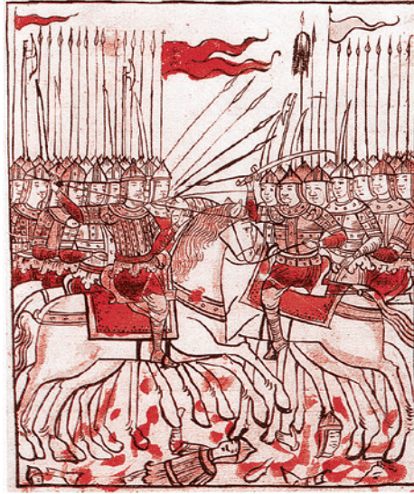
Битва на Куликовом поле в 1380 г. Из рукописи «Сказание о Мамаевом побоище», XVII век

Сейчас многие, вслед за Львом Гумилевым, утверждают, что татарское иго на Руси практически не было: ведь татары не держали в русских городах гарнизонов,