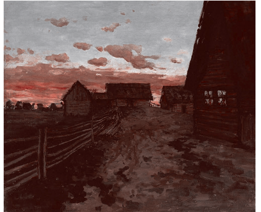
Избы. После захода солнца. 1899 г.

Чаще всего они вовсе уходят от сущностной проблематики пейзажного искусства, занимаясь иными, более нейтральными и политкорректными, не требующими духовных усилий «мейнстримными» аспектами: сведениями о заграничных связях художника, чисто внешними, формально интерпретируемыми стилевыми привязками его к модернизму XX века, вспоминают якобы забытые (а в действительности, в силу периферийности «отодвинутые» прежними исследователями) моменты его