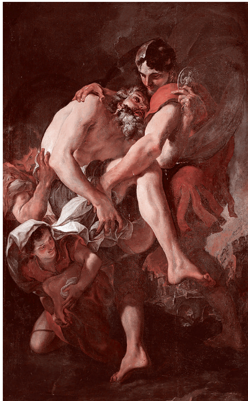
Раоло Пагани. Эней выносит Анхиза из горящей Трои

Тут ведь, знаете ли, одно из двух. Или ты читаешь книги, вырываясь из того болота невежества, в которое тебя посадили конспирологи и пропагандисты. Или ты остаешься маленьким мальчиком, которого пугают Бабой-ягой масонства и сатанизма. Маленьким мальчиком, не способным освоить реальность и кричащим «чур меня!». Ну и как этот мальчик может принять вызов современного Запада, насквозь проникнутого сложным и злым началом? Понятное дело — никак. Ну и кто же тогда те, кто отчуждает патриотическую публику от реальности, пугая ее разного рода чудовищами? Кто эти люди, которые препятствуют взрослению представителей патриотических кругов нашего общества? «Наверное, это и есть злоешие масоны», — скажут мне. Да не тянут они