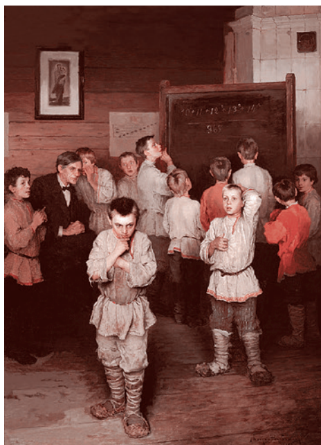
Богданов-Бельский. Устный счет. 1895 г.

После перечисления недостатков в постановке школьного образования на селе в документе для преодоления этих недостатков предлагается строить в сельской местности школы, обеспечивать регулярный и бесплатный подвоз школьников,