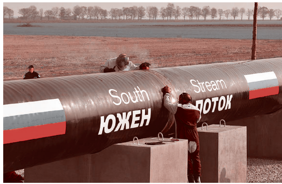
Начало строительства «Южного потока» в Болгарии

24 сентября замглавы «Нафтогаза» А. Тодийчук объявил, что не исключено решение правительства о повышении цен на газ до единого уровня для всех промышленных и бытовых потребителей (то есть для населения это будет означать рост цен в 4 раза). И что якобы, по социологическим данным, патриотичное большинство граждан Украины готово такую цену платить. Однако массовые реакции на это заявление Тодийчука показывают, что, похоже, опрашивали не те социологи, и не так, и не тех граждан.