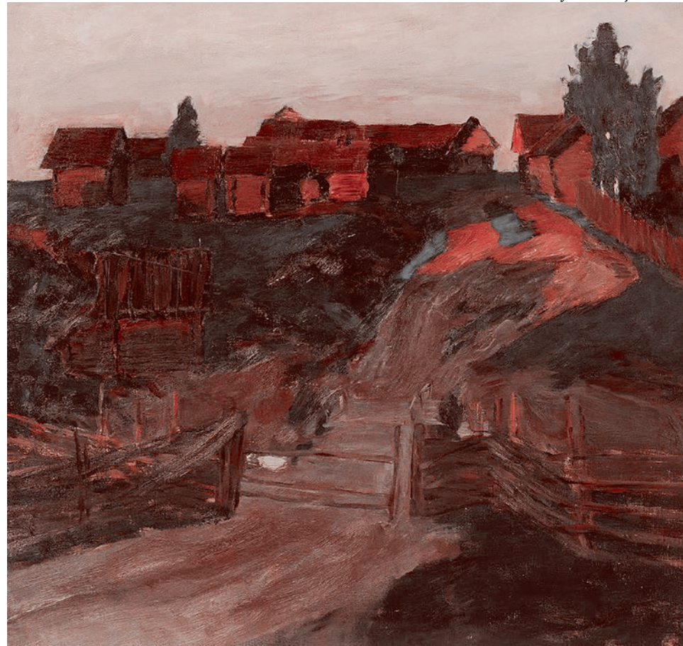
Последние лучи солнца. 1899 г.

органическую вписанность в живописнейший ландшафт волжских берегов, слияние с музыкой речного пространства и тихую простоту быта — качества, некогда вдохновлявшие Левитана, а за ним и других русских художников.