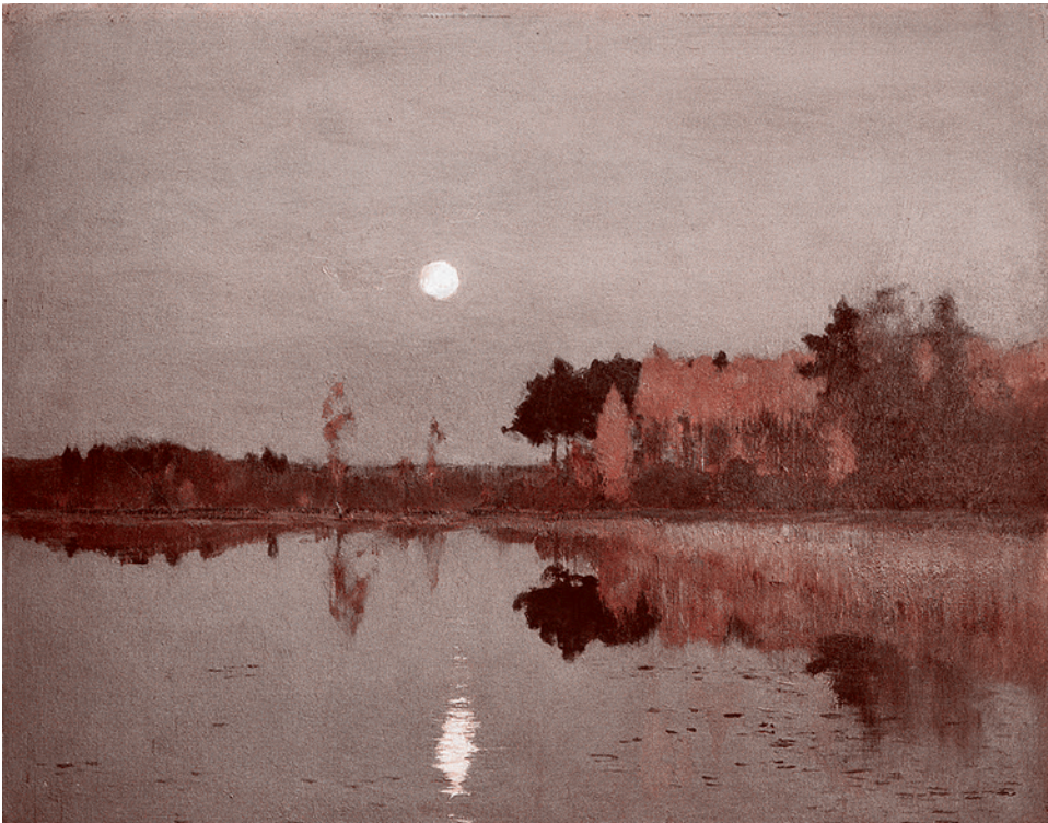
Сумерки. Луна. 1898 г.