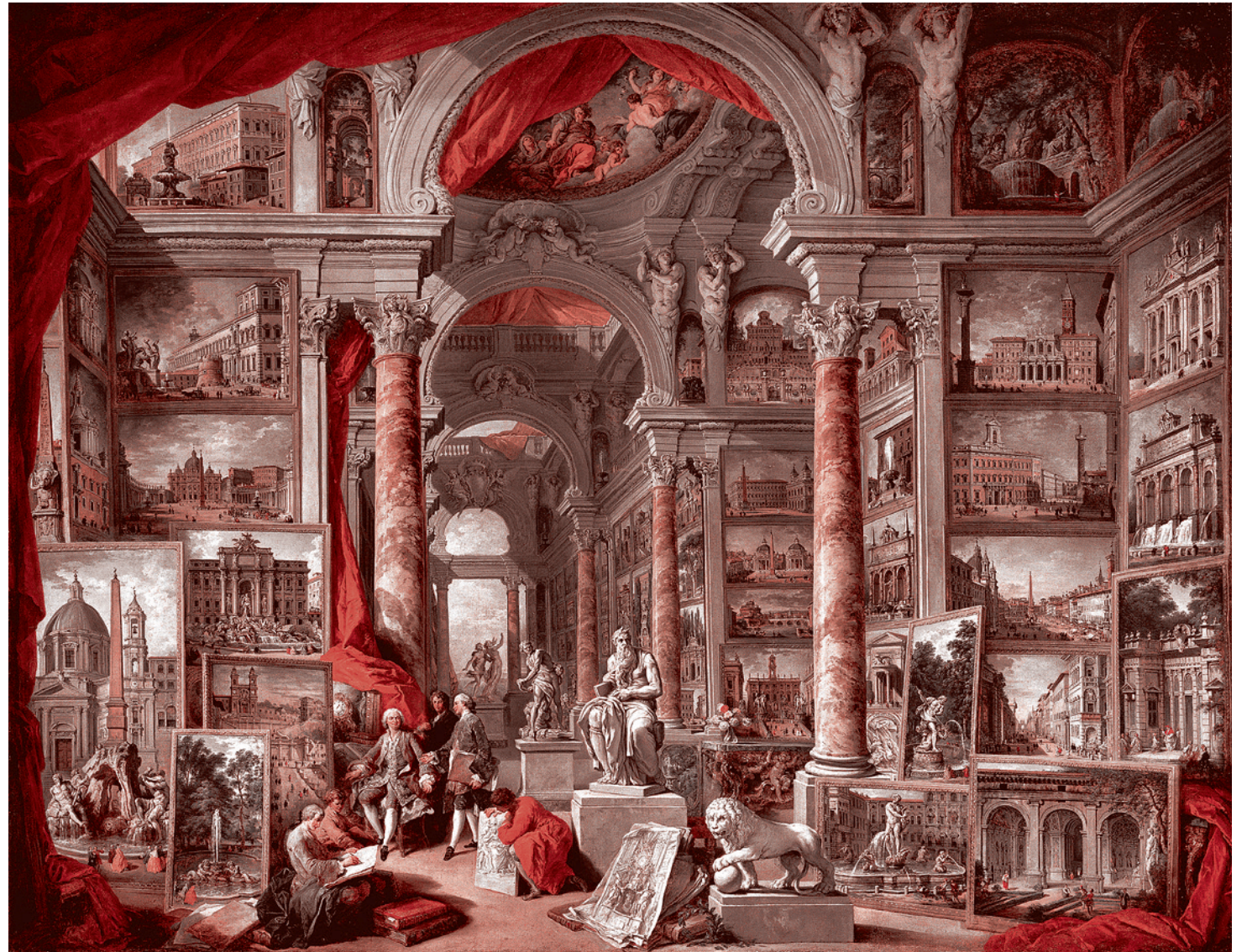
Пиранини. Галерея видов Древнего Рима (1757)

Итак, я написал, что Анхиз явным образом посвящает Энея в некое таинство, — и улетел в Донецк. И вот только теперь у меня есть возможность вернуться к теме, которая при всей ее кажущейся отвлеченности является, пожалуй, наиболее животрепещущей и масштабной. Запад навязывает человечеству дегуманизацию. Он делает это и в силу каких-то существенных своих особенностей, и потому, что предложенная им же самим модель классического гуманизма оказалась исчерпана. Коль скоро мы хотим и далее быть людьми, нам нужен новый гуманизм. А всё, что связано с новым гуманизмом, так или иначе утыкается в Красную идею, советский коммунистическо-социалистический проект, крах этого проекта, возможность выдвижения нового проекта и так далее. Не будет нового гуманизма — старый рухнет через пару десятилетий. Одновременно окажется окончательно оформленной — причем именно по инициативе Запада — предельно антигуманистическая модель существования человечества. Эта модель либо будет навязана миру (в том числе и военным путем), либо... Либо сопротивление реализации этой модели обернется мировой войной, причем войной ядерной. Но самое главное, что, в отличие от предыдущей войны с фашизмом, война с этим новым фашизмом (а фашизм и есть предельная дегуманизация — это, и только это) окажется войной, в которой противники фашизма будут сражаться за нечто