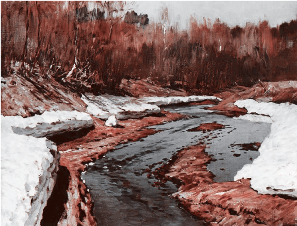
Весна. Последний снег. 1895 г.