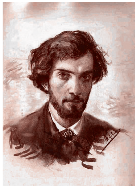
Исаак Левитан. Автопортрет. 1880 г.

Юбилей Левитана показал также, что плохо обстоит дело и с «материальной памятью» о художнике, с историко-художественными объектами, связанными с Левитаном. Едва ли не погибает мастерская Левитана в Москве, где ныне находятся реставрационные мастерские Академии художеств. Здание мастерской находится в столь плачевном состоянии, что, как говорят, «едва выдерживает громоздкую мемориальную доску». Еще в советское время возникла идея открытия Музея-мастерской Левитана в Москве, но она, к сожалению, так и не была реализована. Тем