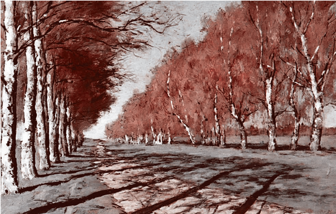
Большая дорога. Осенний солнечный день. 1897 г.