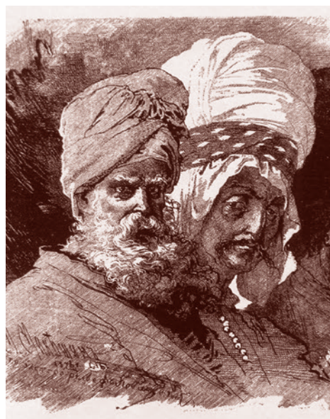
Микешин. Титы и выды Кавказа и Малой Азии (фрагмент). Курды-езиды. 1876 г.

Здесь курдский сюжет подходит к одному из наиболее трагических эпизодов — расправе исламистов над курдами-езидами в Шангале в начале августа 2014 года.