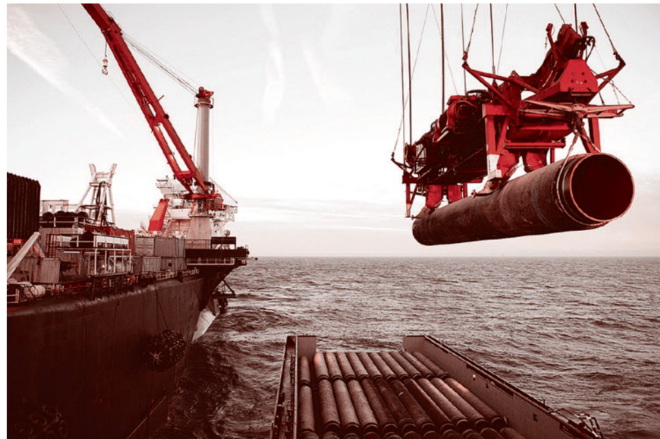
Прокладка «Северного потока»

Между тем, долг перед «Газпромом» у Киева накопился огромный. Не оплачено более 11 млрд куб. м поставленного газа. По максимуму (с учетом обязательства «бери или плати», которое Киев не выполнял, отбирая гораздо больше газа, чем оговорено в контракте) это около $11 млрд. По минимуму (если