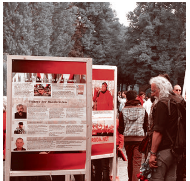
Берлин, 9 мая

Следующим важным событием в жизни нашего бюро была конференция в Европарламенте. Если в 2013 году, когда там на встрече с представителями европейских левых движений выступал Сергей Ервандович, «Суть времени» пришла в зал Европарламента в качестве слушателей, то в 2014 году, благодаря Татьяне Аркадьевне Жданок, депутату Европарламента, мы сами приняли участие в русском европейском молодежном форуме по вопросам семьи и нравственности. Формат форума предусматривал, что его участниками должны были быть молодые люди, которые живут в европейских странах и для которых главный язык — русский. От нас было 4 человека.