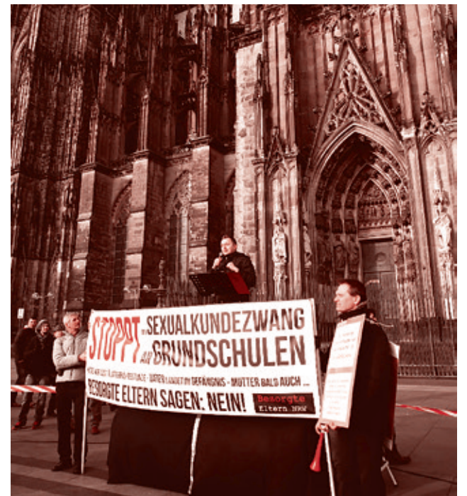
Кёльн, протест против сексобразования

выйти. И в итоге шествие они сорвали, а полиция бездействовала. Понятно, что это всё согласовано с кем-то — и провокация ЛГБТ-активистов, и бездействие полиции. Вот так борются с родительскими движениями в Германии. А последний митинг этого движения (оно называется «Besorgte Eltern» — «Обеспокоенные родители») был во Франкфурте, и там уже полторы тысячи человек собралось. Это очень много для Германии. Но родители уже боятся оповещать открыто, они и нам сказали буквально за несколько часов до мероприятия. То есть, они не создают событий или групп в Фейсбуке, нигде не распространяются о митинге. Они боятся провокаций. Вы представляете, полторы тысячи — это только те, кто вышли (вопрос, еще в том, сколько не вышло), — они боятся. Они созваниваются накануне друг с другом и говорят «Завтра выходим, завтра выходим». И выходят. Мы тоже с ними выходим и будем дальше вместе с ними бороться. А они очень нас благодарят, все российские СМИ, и нас в особенности, потому что мы об этом рассказываем правдиво и потому что мы сами с этим боремся.