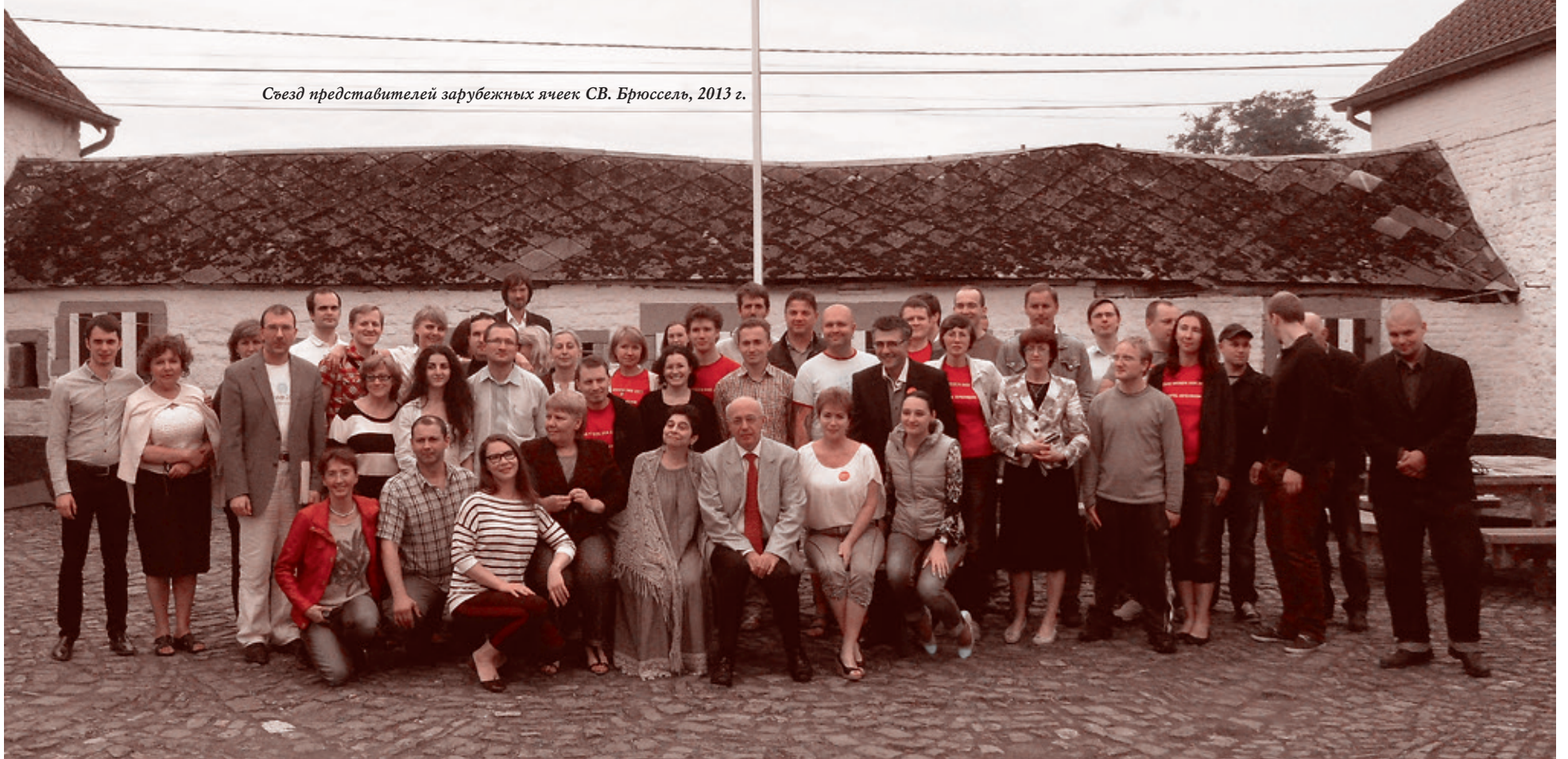
Съезд представителей зарубежных ячеек СВ. Брюссель, 2013 г.