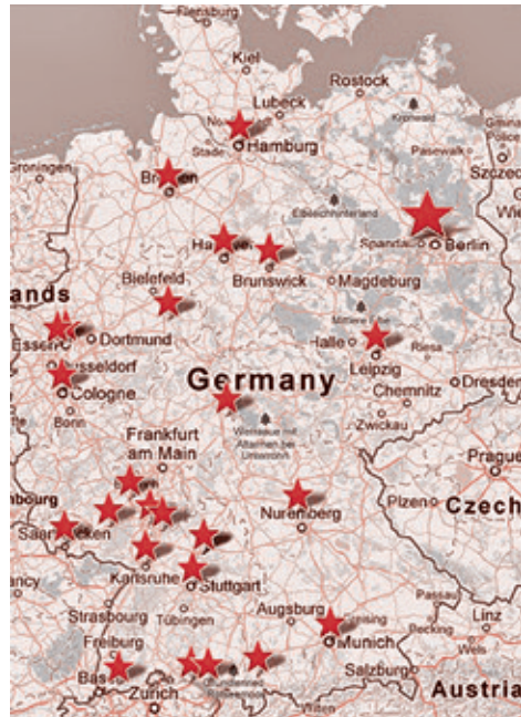
Места жительства членов немецкой ячейки СВ