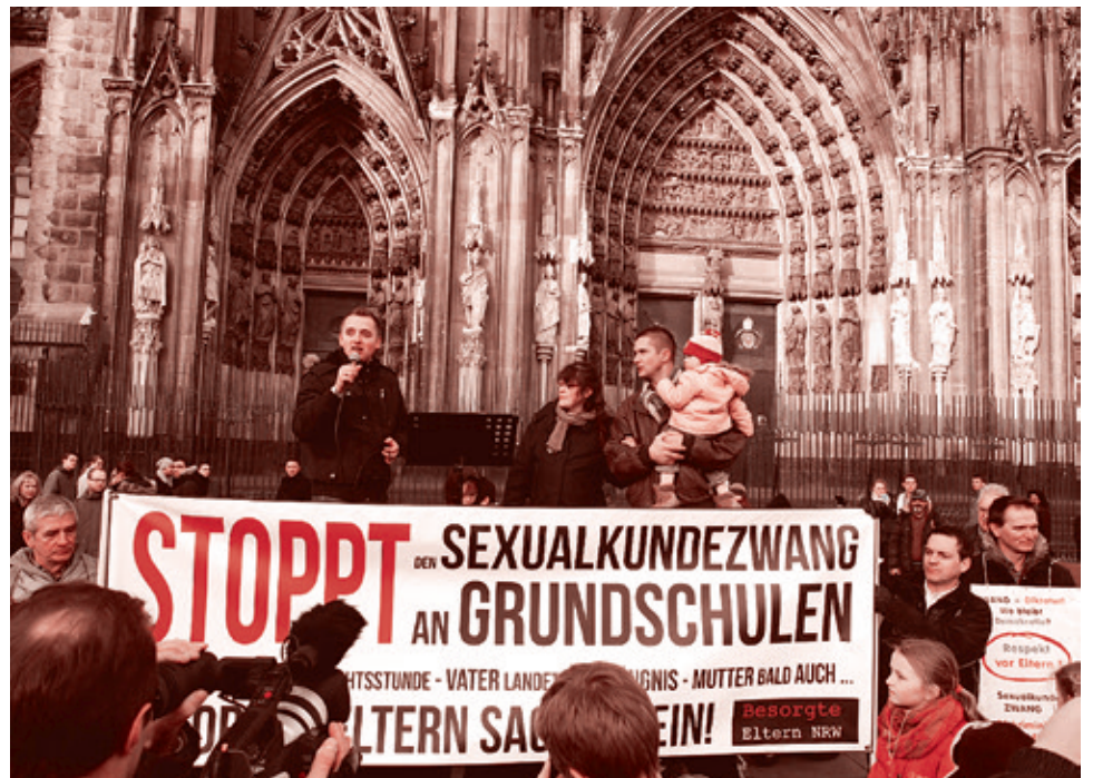
Кельн, протест против секспросвета

Еще одно из направлений нашей деятельности — это борьба с ювенальной юстицией, с секспросветом. Мы этой темой начали заниматься с 2012 года. Первым событием был марш в шести городах Германии. Мы во всех этих городах вышли вместе с немецкими родителями. Митинги были немногочисленные, человек 20–40 в зависимости от города (в Берлине было больше всего). Почему так мало? Люди боятся выходить, во-первых, открыто показать себя. Во-вторых, они просто думают, что если они будут протестовать, то и детей не вернут, и еще больше проблем навлекут на себя. Ну и вообще,