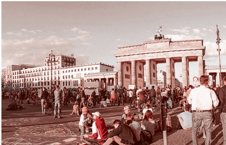
Один из митингов «За мир». Берлин

понимали, какая война и на каком уровне ведется. И мы заметили, что эти активисты стали более раскованными, и в своих выступлениях тоже начали оперировать теми же самыми терминами.