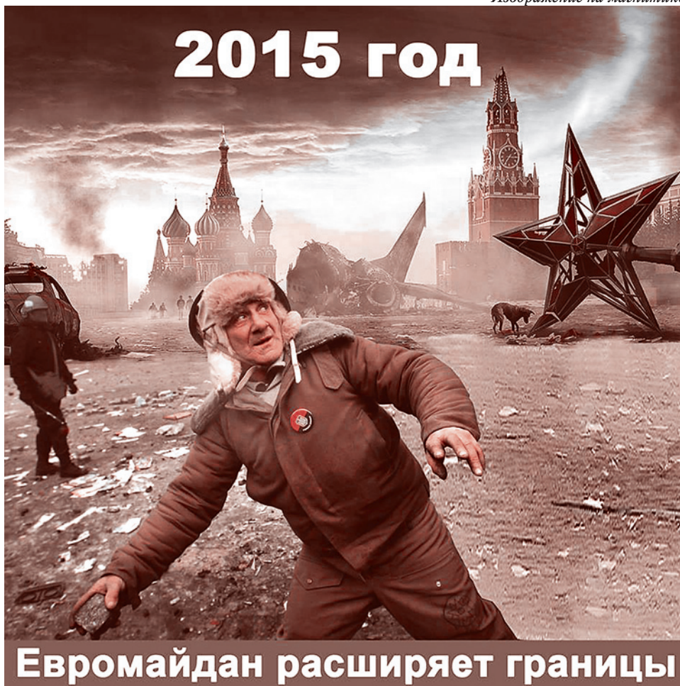
Изображение на магнитике

А премьеру я морду бить не могу. Правда же? Есть ведь жанр?