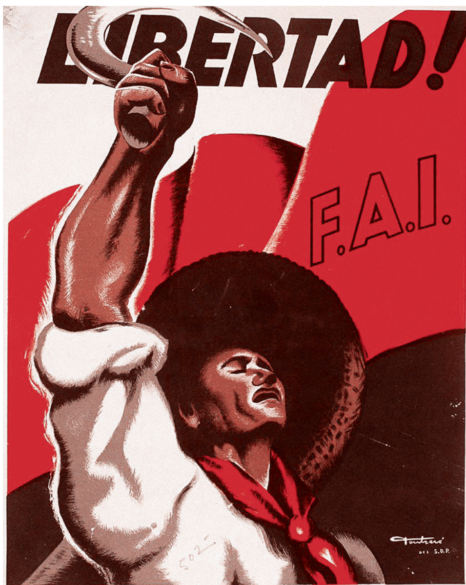
Испанский плакат времен гражданской войны

Так вот, мы должны устраивать национализацию элиты. Разумеется, не так, как в 1937 году. Гораздо более гибко, гораздо более спокойно. Но утром — национализация элиты, при которой нету трагической коллизии, что семья где-нибудь за рубежом и надо туда летать, а тут надо