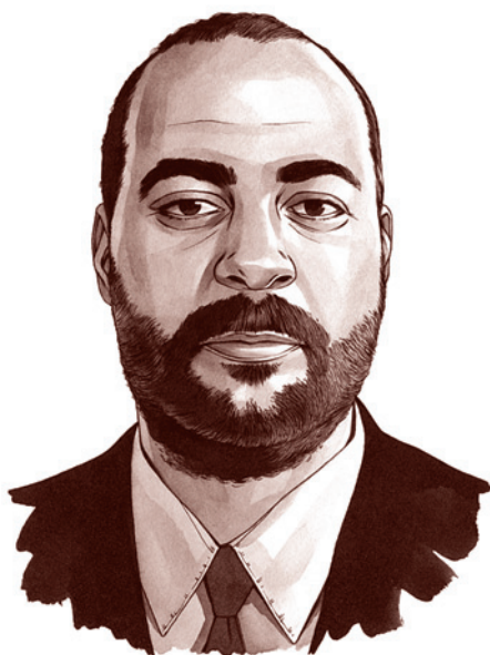
Абу Бакр аль-Багдади. Иллюстрация в журнале TIME

Этот союз явился логичным завершением длительного развития отношений между иракскими и иорданскими экстремистами. Иранское издание «Java» подчеркивает, что одновременно с известными заявлениями Обамы о намерении США бороться с ИГИЛ звучат «признания некоторых иорданских официальных лиц о том, что члены ИГИЛ были обучены американскими специалистами на одной из секретных баз в Иордании». Так, пишет «Java», «имеются свидетельства того, что в 2012 году десятки членов ИГИЛ прошли обучение в небольшом городе Ас-Сафави в пустынном регионе