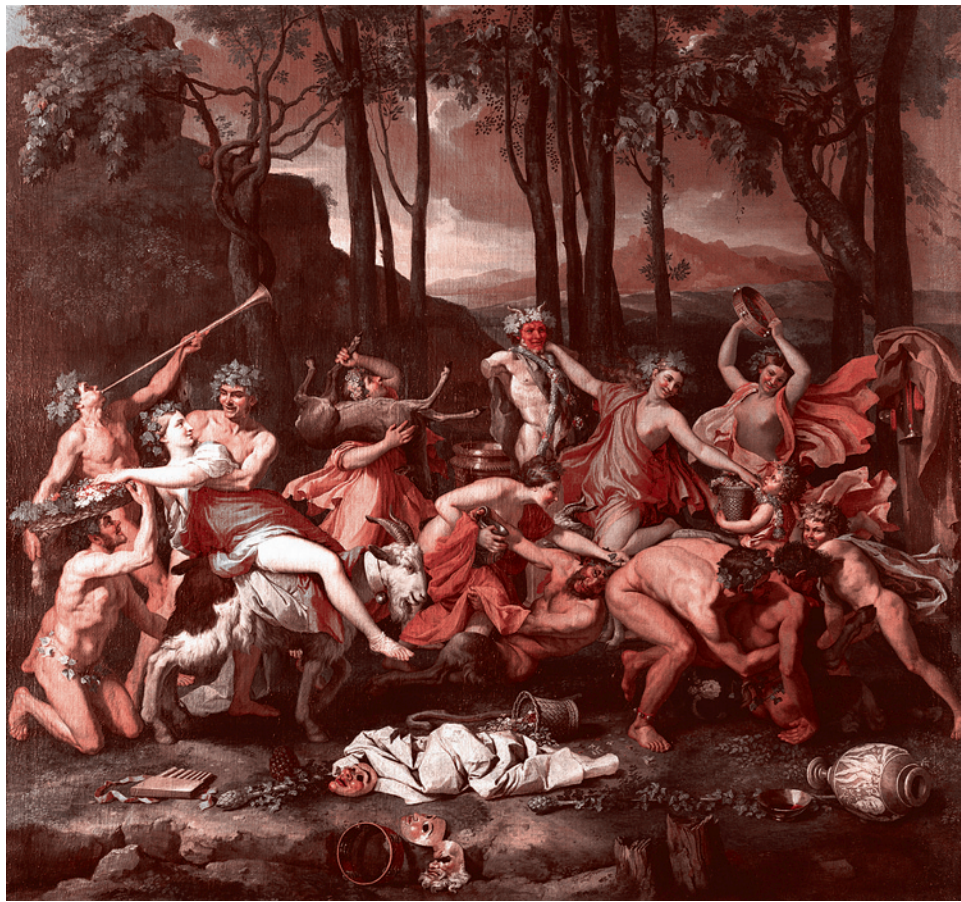
Никола Пуссен. Триумф Пана (1635)

О том, что из Малой Азии Кибела была перенесена в Грецию. Кем? Не вернувшимся ли в Аттику малоазийским Двенадцатиградием?