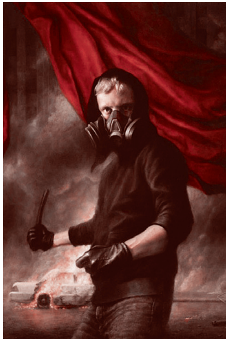
Рисунок, использованный в плакатах националистов для сбора людей на первомайские мероприятия 2014 г.

Возникла идея, которая получила прямо-таки массовую поддержку. Создание университета, такой своеобразной кузницы кадров для всего постсоветского пространства СНГ, а, может быть, и всей Восточной Европы... Здесь можно растить новую элиту, на которую у общества вот в таких вот случаях, подобных украинскому, оказывается, есть «социальный заказ». При смене власти эта новая элита приходила бы уже подготовленной, с планом действий, чтобы не было необходимости опираться на старые кадры».