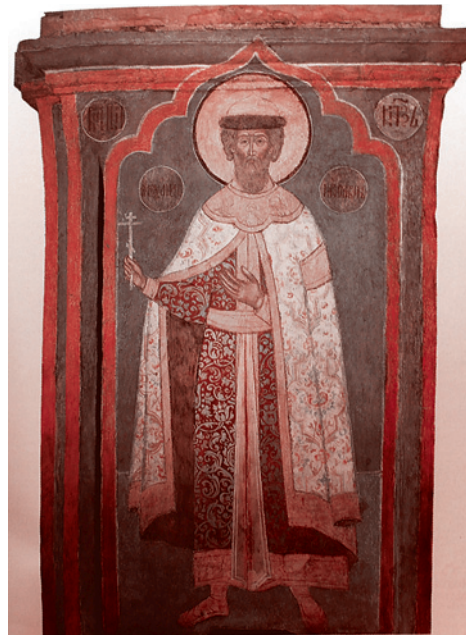
Святой Александр Невский. Фреска, 1666 г., Москва, Кремль

В 1240 году в новгородские пределы вторгся флот шведского короля Эрика Эриксона. Целью похода был захват Невы с прилегающими землями и крепости Ладоги, чтобы лишить новгородцев выхода к Балтийскому морю и установить свой контроль над северо-западным участком водного пути «из варяг в греки». А прикрывалась эта акция разговорами о необходимости насадить среди русских «истинное христианство» — католичество. Историки полагают, что поход шведов был согласован с Орденом, чьи войска в том же году предприняли наступление на Псков