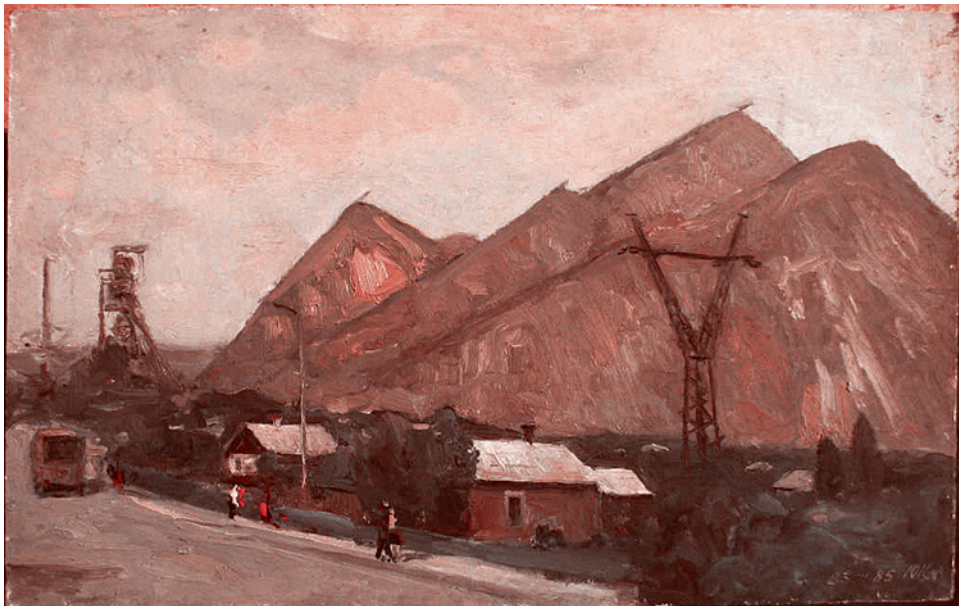
Юрий Целов «Шахта имени XXII парт. звезда», 1983 г., холст, масло

Ну, насчет целей сгона с земель — всё более или менее, «как у всех». «Этническая чистка» называется. Освобождение преступного государства от нежелательного, компактно проживающего и не комплиментарного ему населения. Для последующего занятия освобожденного пространства «своими». Однако и тут, в этой давно отработанной схеме, есть в нашем случае своя дополнительная изюминка. Второй и главной целью сгона русскоязычных с Украины, конечно, является стремление США к уничтожению России. Посредством национальных