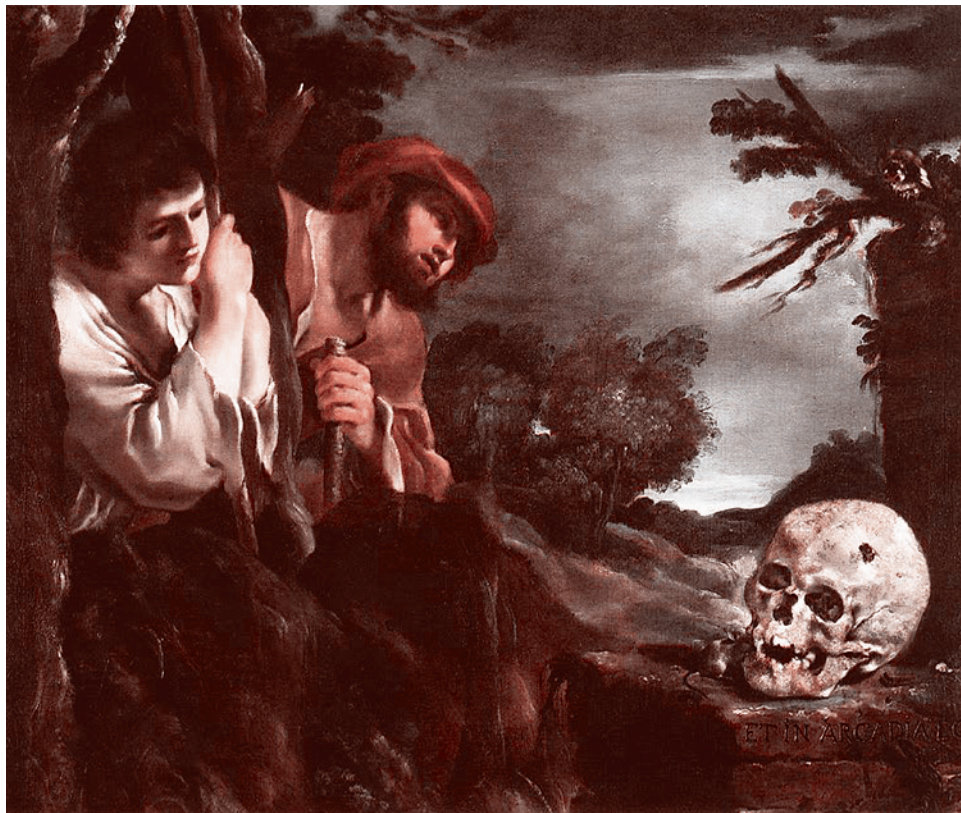
Гверчино. Et in Arcadia ego (1622)

Однозначного ответа на этот вопрос нет и не может быть. Как не может быть однозначного ответа на вопрос о том, был ли соответствующий подтекст в стихотворении «Я люблю тебя, жизнь». Притом, что стихотворение было написано человеком, достаточно образованным для того, чтобы гипотеза о наличии подтекста могла быть отнесена в разряд правдоподобных. Но ведь именно как гипотеза, правда же?