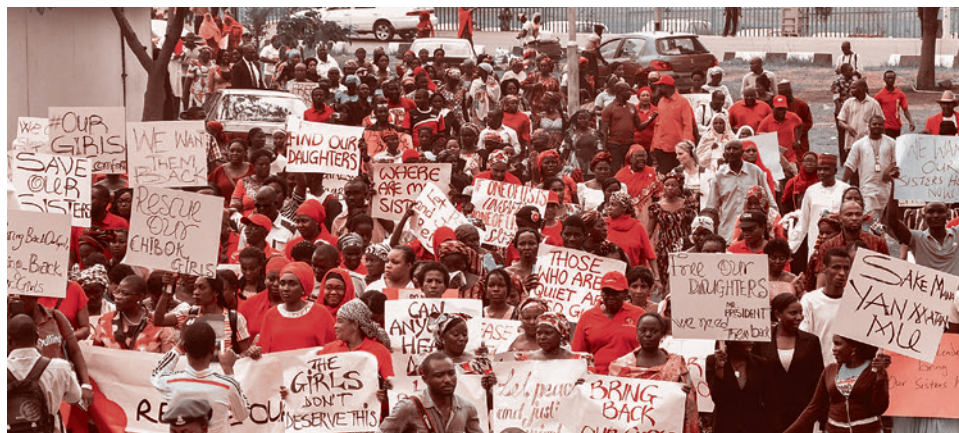
Митинг против преступлений «Боко харам» в Нигерии

16 марта. Не менее 100 человек погибли в центральной части Нигерии от рук боевиков, напавших на три деревни. Напавшие принадлежали к народности фулани (фульбе). Именно эта нигерийская народность, наряду с народностью хауса, в значительной степени и составляет этнический костяк «Боко харам».