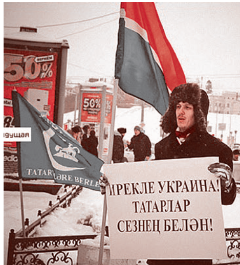
Пикет в Казани. Надпись: «Свободная Украина! Татары с вами!»

В отношении поддержки со стороны «славян, принявших ислам» стоит обратить внимание на то, что «Евромайдан» поддержала немалая часть той русской