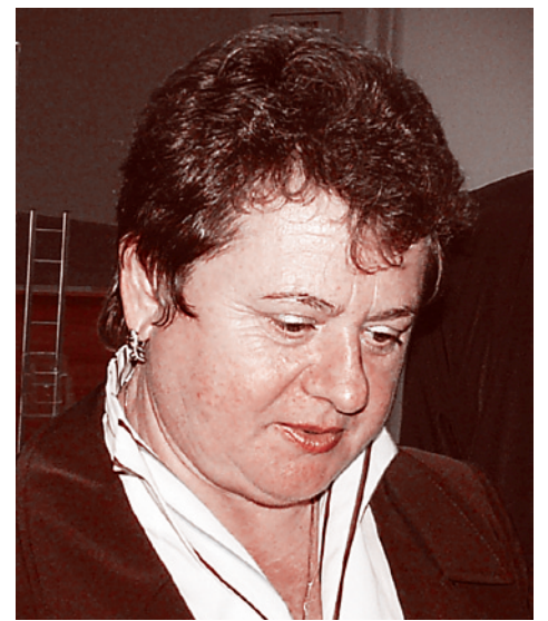
С.Ю.Орлова, заместитель Председателя Совета Федерации, президент «Национального комитета поддержки материнства и детства»

Прежде всего, идет подготовка ведомственных кадров. По заказу и при поддержке ЮНИСЕФ Фондом был разработан комплект информационных и методических материалов для руководителей и специалистов учреждений здравоохранения, социальной защиты и органов опеки и попечительства.