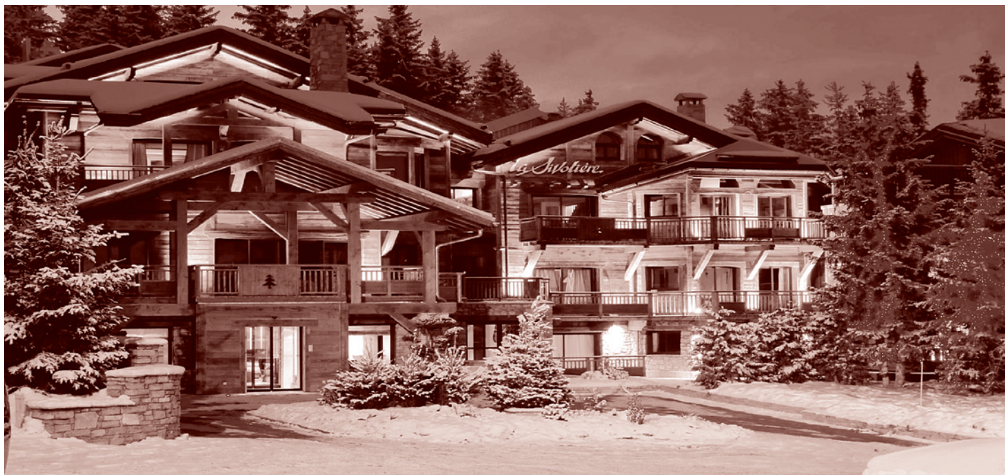
Здесь отдыхают «бедные» российские чиновники. Куршевель – самый дорогой в мире горнолыжный курорт

в Министерстве обороны? И уж совсем никак не объяснимы различия в зарплате региональных чиновников. Почему в Волгоградской области получают в 2 раза больше, чем в Астраханской (на всякий случай — находящейся рядом, на той же Волге, которая впадает в Каспийское море, — как раз там, где впадает).