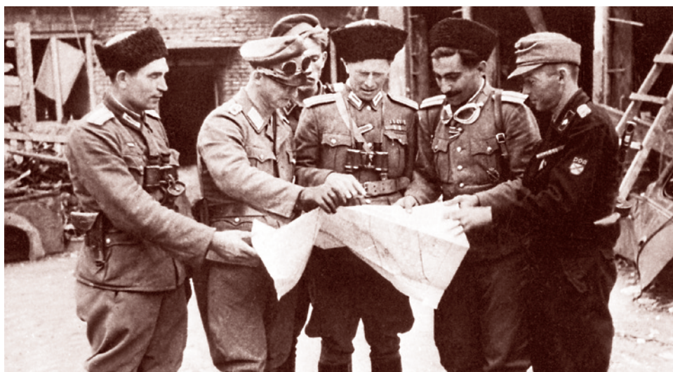
Варшава, 1944 г. Офицеры РОА и РОНА

То есть речь — об «общерусской этничности» как скрепе, подлежащей разрушению именно за то, что она СКРЕПА. И — о той самой смене цивилизационного ядра личности, о которой как о первоочередной «необходимости» давно было заявлено