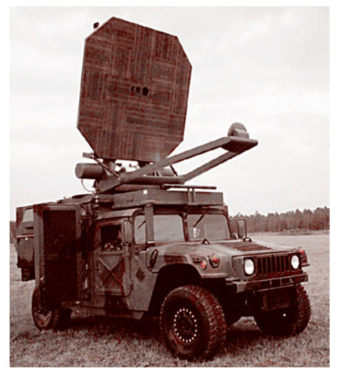
Система активного отбрасывания — Active Denial System. Главный поражающий фактор — КВЧ-электромагнитное излучение, вызывающее у человека непереносимые болевые ощущения.

До определенного момента Александер, Джанет Моррис и другие поборники нового вида оружия действовали хоть и при поддержке отдельных групп в армии и спецслужбах США, но, так сказать, в самодеятельном порядке. Но с начала 90-х годов уже