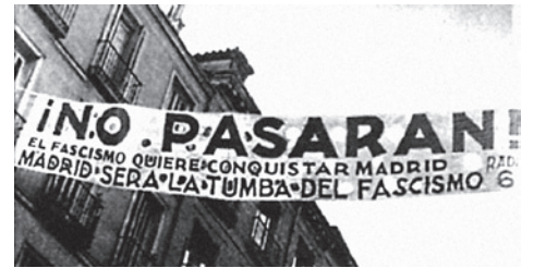
1936 г. Транспарант на улице Мадрида: «Они не пройдут! Фашисты хотят завоевать Мадрид. Мадрид станет могилой фашизма!»