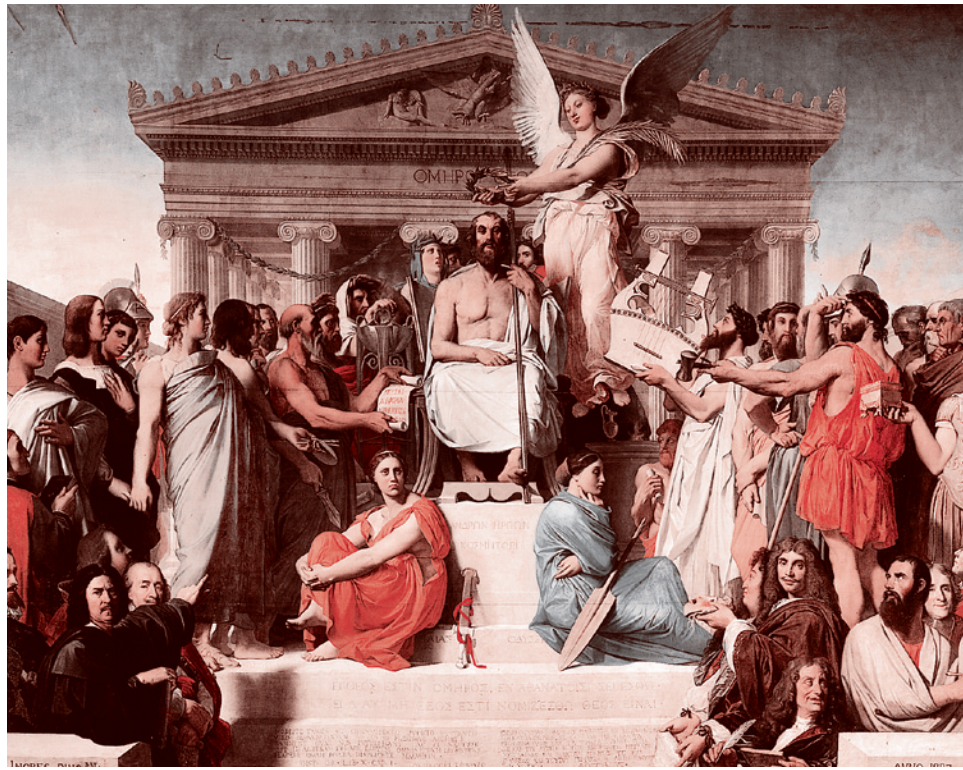
Ж.О.Д. Энгр. Апифеоз Гомера, 1827 г.

Это абсолютная художественная революция. Ахилл в своем праве. Он мстит за Патрокла. И вот приходит враг. Отец человека, который убил его друга. И что же? Ахилл, превратившийся в зверя, обуреваемого яростью (а, по-видимому, еще и чувством вины), вдруг приходит в себя, увидев горе отца. Подчеркну еще раз — отца чужого для него человека. И не просто чужого — враждебного.