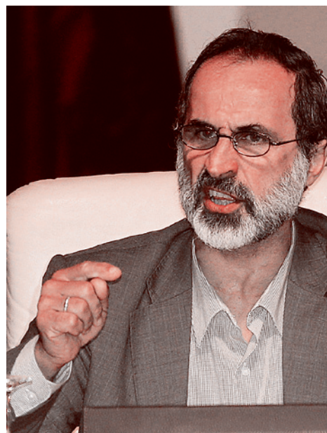
Ахмед Муаз аль-Хатиб, глава «Национальной коалиции сирийской оппозиции и революционных сил», бывший имам знаменитой мечети Омейядов в Дамаске, бежавший из Сирии летом этого года

В новом органе широко представлен Сирийский национальный совет, на базе которого в значительной степени и создано новое объединение. В нем присутствуют также представители отдельных региональных комитетов. Кроме того, в НКССР участвует «Всеобщая комиссия сирийской революции», которая представляет собой сеть местных координационных комитетов. Помимо этих групп, в НКССР вошли представители «Сирийской демократической платформы», буквально за пару дней до подписания соглашения категорически отказывавшиеся от участия. А также Курдский национальный совет, поддержавший оппозицию на Стамбульской конференции. Штаб-квартиру НКССР планируется разместить в Каире.