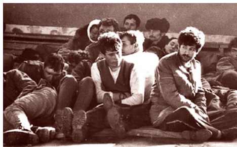
Румыния, 1989 г. Бойцы Секуритате, арестованные военными, перешедшими на сторону повстанцев.

Чем больше сил Противник присоединяет к своей борьбе, тем менее ясным становится вопрос о том, кто ведущий, а кто ведомый. Если у всех подключаемых Противником сил свои цели и свой автономный потенциал, то кто такой для них этот Противник? С помощью чего он может сохранить контроль над этой клубящейся стихией?