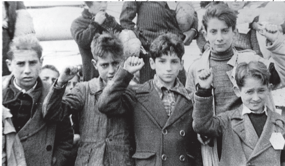
Дети республиканской Испании перед эвакуацией из Мадрида