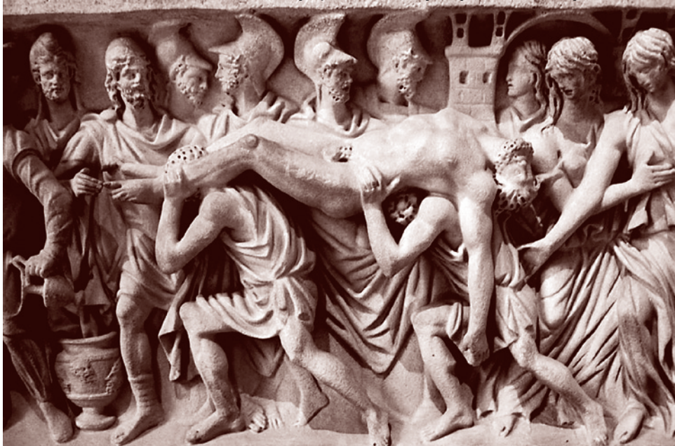
Возвращение тела Гектора в Трою. Римское надгробие, 240 г. д.н.э.