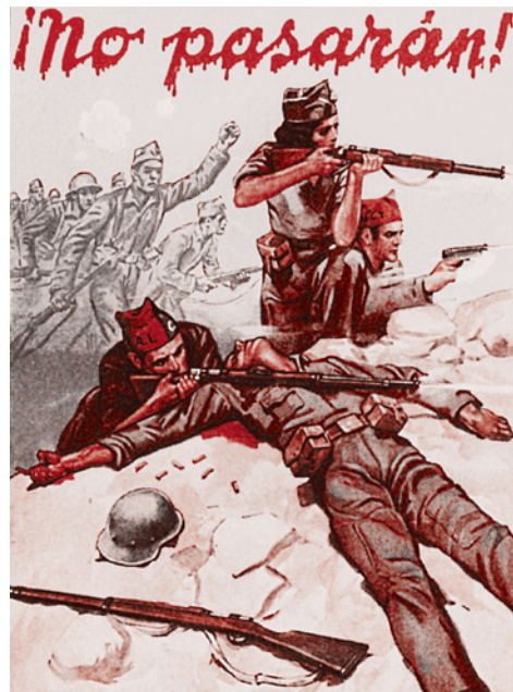
Республиканский плакат времени гражданской войны в Испании

Ситуации, когда «воробьями» (то есть существами второго сорта, на которых не распространяются нормы сочувствия, солидарности, национального единства и так далее) оказываются не просто испанские коммунисты, а дети этих коммунистов, кажутся особо вопиющими. Становится ясно, что на «детей войны», то есть на жертв франкистского режима, элементарным образом наплевать. Что эти дети, будучи сопричастными коммунизму, а точнее даже антифашизму (в СССР вывозили детей очень разных антифашистов-республиканцев), являются «детьми второго сорта». Иначе —