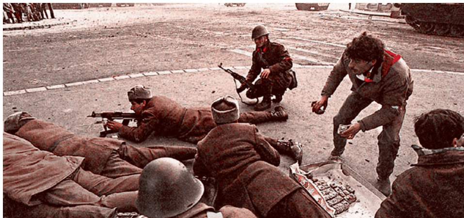
Румыния, 1989 г. Повстанец угощает тифозными военными, ведущих бой с Секуритате.

ОО №2 — Противника могут поддержать хорошо организованные слои населения, обладающие возможностью переводить созданный политический кризис в то, что называется коллапсом или параличом экономики. Классическим вариантом подобного рода поддержки является всеобщая политическая забастовка. Если власть не может подавить эту забастовку, заменив забастовщиков спецвойсками или штрейкбрехерами, то она проигрывает, даже если на ее стороне вся мощь силовых структур государства. Поэтому что силовики не могут передвигаться в условиях абсолютного паралича на транспорте. Потому что... Словом, вряд ли со-