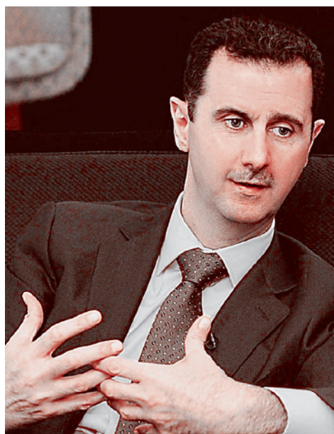
Башар Асад, Президент Сирии

В начале ноября 2012 года президент Сирии Башар Асад, отвечая на вопросы канала Russia Today о возможности военной интервенции в Сирии, сказал: «Цена подобной интервенции, если она случится, будет неподъемной для всего мира. Сирия — последний оплот секуляризма, стабильности и мирного сосуществования в нашем регионе. Если в Сирии начнутся проблемы, пойдет ценная реакция, которая затронет все страны от Атлантического до Тихого океана и вообще весь мир».