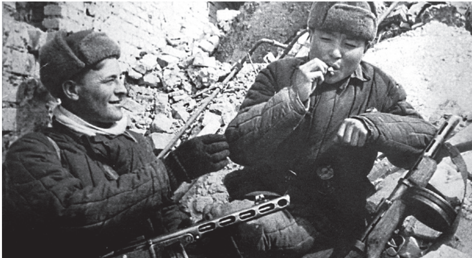
Фронтные друзья. Сталинград, 1942 г.

Г лавная цель информационно-психологической войны — сломить способность противника к сопротивлению.