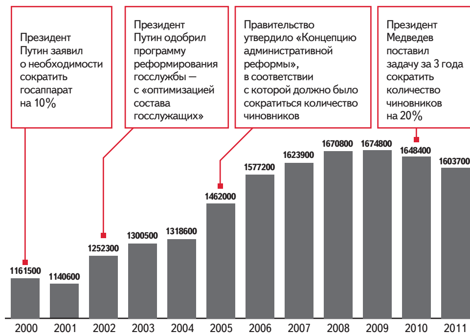
ЧИСЛЕННОСТЬ РАБОТНИКОВ ГОСУДАРСТВЕННЫХ ОРГАНОВ И ОРГАНОВ МЕСТНОГО САМОУПРАВЛЕНИЯ РОССИЙСКОЙ ФЕДЕРАЦИИ, ПО ДАННЫМ РОССТАТА. (Рис. 3)