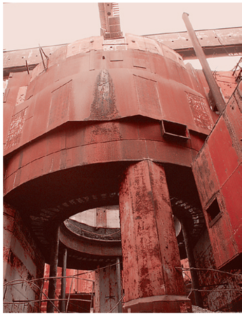
Заброшенная Крымская АЭС

В отличие от углеводородной, ядерная энергетика еще очень молода — ей чуть более полувека. Но первая эйфория ядерного «детства» человечества, соприкоснувшегося с новым источником гигантской энергии, уже прошла. Как в результате осознания неразделимости развития мирного и военного атома (синдром Хиросимы и повседневное ощущение угрозы возможного ядерного апокалипсиса в эпоху холодной войны), так и в ходе осмысления трагедий Чернобыля и Фукусимы.