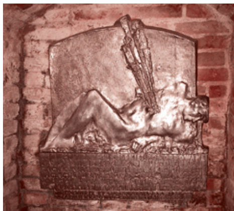
Доска в память жертв Волынской резни в церкви Святой Бригитты в Гданьске

Мы окружили 5 польских сел и на протяжении ночи и следующего дня сожгли эти села и всё население от мала до велика вырезали — в общей сложности более двух тысяч человек.