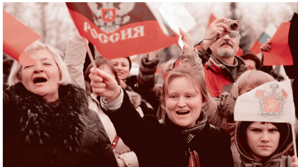
Крым проголосовал за присоединение к России