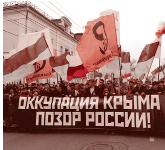
Пятая колонна на марше