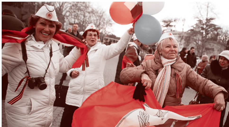
Севастополь проголосовал за присоединение к России