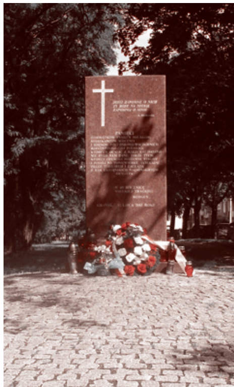
Гданьск. Памятник полякам, уничтоженным ОУН-УПА на Волыни и в восточной Польше в 1943-1945 годах

В октябре 1942 года во Львове была собрана первая военная конференция ОУН (Б), по итогам которой было решено подготовить программу военной деятельности организации...