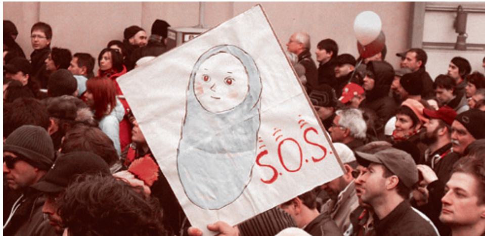
Марш мира. Москва, 15 марта 2014 года

13 марта Верховная Рада приняла закон о создании Национальной гвардии Украины. Было заявлено, что целью создания Национальной гвардии является поддержка милиции и армии Украины в кризисных ситуациях. И в самом деле, поддержка этим структурам нужна. Об украинской армии мы уже сказали — ни по численности, ни по вооружению она не в состоянии противостоять российским войскам. А милиция после революции в Киеве настолько деморализована, а ее руководство до такой степени не определилось, кому служить, что МВД в большинстве ситуаций предпочитает вообще не вмешиваться в происходящие политические события.