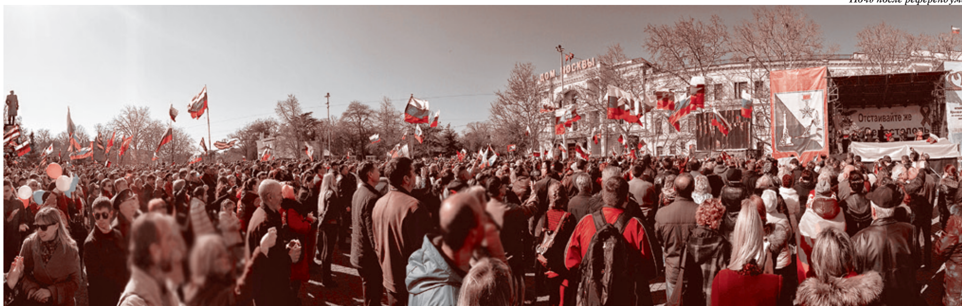
Севастополь смотрит трансляцию обращения В.В.Путина 18 марта 2014 года.