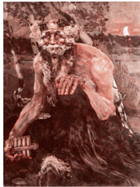
М. Врубель. Пан (1899)

И не является ли этот господин Ничто (он же Пан) выразителем того начала, на которое, по мнению Шарлотты Шиллер, сделала ставку и великий Гёте, и весь классический гуманизм?