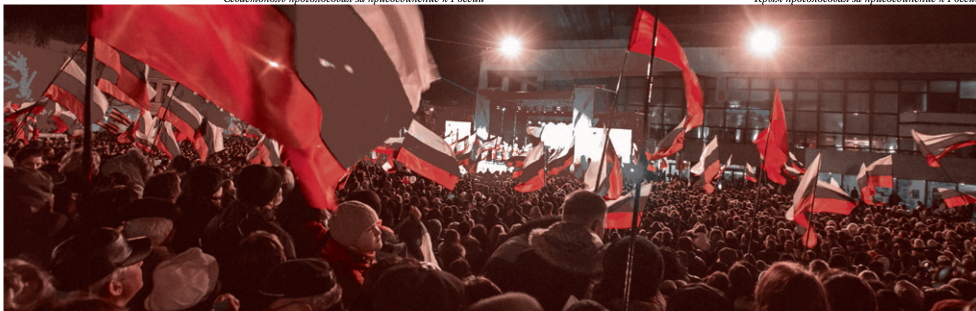
Ночь после референдума