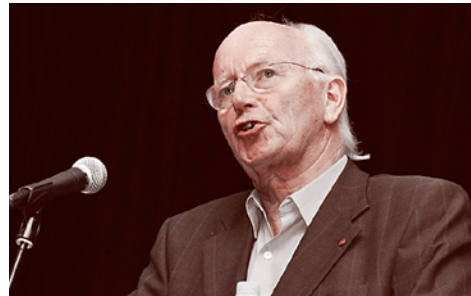
Торвальд Столтенберг - бывший министр обороны и бывший глава МИД Норвегии.

ров» занимает свое почетное место. Речь идет о международном сотрудничестве в рамках «Баренцева евро-арктического региона» (БЕАР). Сразу отметим, что одним из инициаторов этого проекта во второй половине 80-х годов был «отец перестройки» М. Горбачев. Тогда под лозунгами «усиления общеевропейской интеграции» и «расширения межрегиональных контактов» происходил распад СССР. Позже под этими же лозунгами испытывалась на прочность и территориальная целостность России.