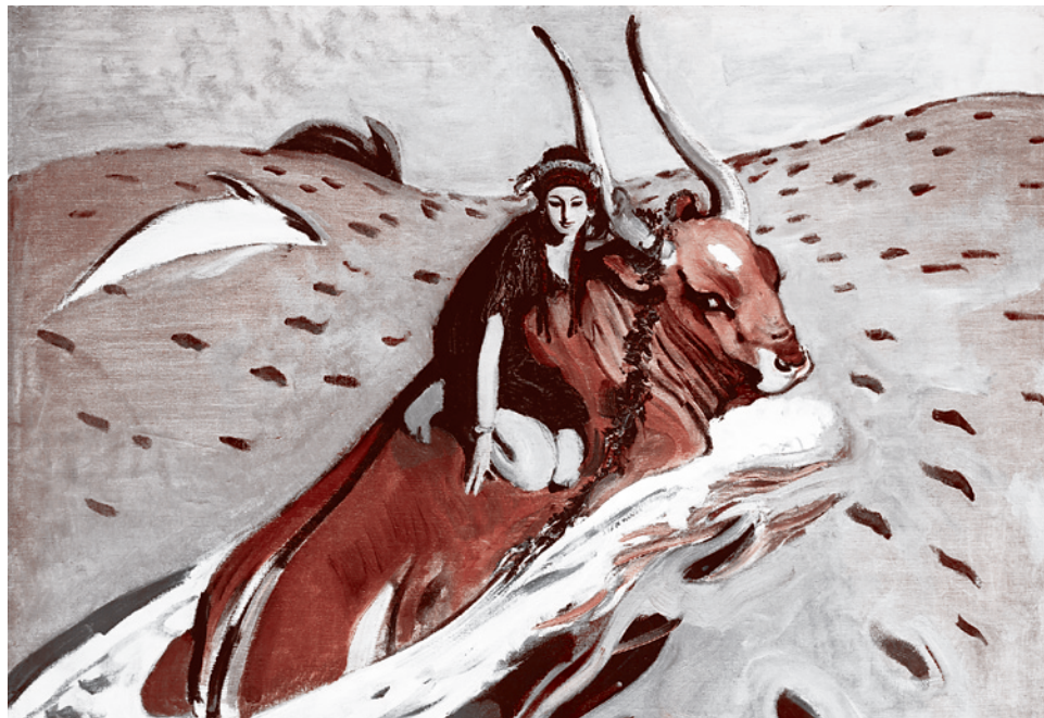
В.Серов. Похищение Евроты. 1910 г.

15 ноября 2012 года палата представителей Конгресса США приняла закон Магнитского. Считается, что до конца ноября этот закон будет одобрен Сенатом. И до Нового года будет подписан президентом США Барак Обама. И теперь, перефразировав знаменитое «С кем вы, мастера культуры?», можно задать вопрос: «С кем вы, обитатели политического Олимпа?»