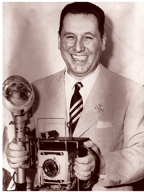
Хуан Перон – президент Аргентины с 1946 по 1955 гг. и с 1973 по 1974 гг.

Когда параллели нужны, а корректные параллели невозможны, то нужны параллели некорректные. Если они позволяют что-то понять, а иного способа не просматривается, то что поделаешь?.. Тут главное – соблюдать особую осторожность, не увлекаться. Соблюдая эту осторожность и никоим образом не увлекаясь, я сейчас попытаюсь ответить самому себе на вопрос о том, почему нашим радикальным либералам так не нравится Путин.