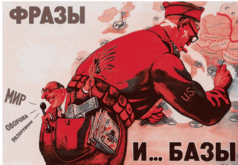
Советский плакат времен холодной войны. В.Говорков. Фразы... и базы. 1952 г.

Наконец, наибольшее внимание с некоторых пор США уделяют бывшим средне-