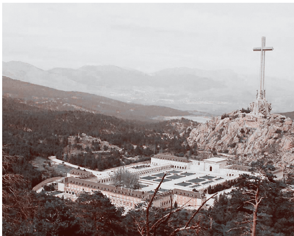
Испания, Долина Павших

Чтобы правильно оценить значение канонизации Святым престолом священников, надо вспомнить, что с просьбой о канонизации погибших в республиканской зоне священнослужителей в свое время к Ватикану обращался лично Франсиско Франко. Тогда, столкнувшись с негативной реакцией като-