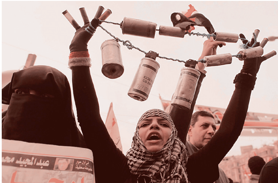
Площадь Тахрир 2012. Цепь из банок из-под слезоточивого газа, которым разогнали протестующих.

16 июня 2012 года (то есть еще до объявления итогов выборов президента) египетский парламент был распущен на основании