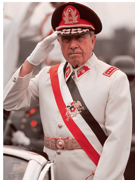
Аугусто Пиночет – президент Чили с 1974 по 1990 гг.

Потому что им нужен Пиночет. Повторяю, опять-таки сравнение не вполне корректное. Ибо Пиночет как-никак ассоциировал себя с каким-то чилийским патриотизмом и т.п. Но пусть те, кто доверяет моей аналитической интуиции, попытаются вместе со мною понять, в чем полезность проводимого безусловно некорректного сравнения. Болотная и Сахарова, подвывая о демократии, на самом деле вопили: «Долой Перона, мы хотим Пиночета!» Если это ощутить (сделав поправку на все возможные некорректности), то, как ни странно, станет ясным многое из того, что категорически не было ясно очень многим в ходе событий зимы 2011–2012 годов.