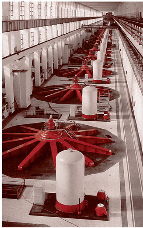
Турбинный зал Волжской ГЭС

пективы пока видятся только в отношении приливных ГЭС (прилив наполняет специальное водохранилище, а на трубопроводах приливного и отливного водотока устанавливаются турбины и электрогенераторы). Другие разработки из этой сферы еще не вышли за рамки экспериментов и отдельных «опытных» станций. Причем получаемая электроэнергия оказывается существенно дороже, чем энергия любых «традиционных» типов электростанций.