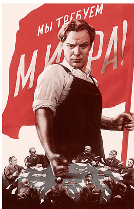
Советский плакат времен холодной войны

Статья «Хиллари Клинтон защитит музейные ценности. Вывоз российских коллекций в США может возобновиться». Суть такова: В октябре 2010 года американское еврейское религиозное движение «Агудас Хасидей Хабад» обвинило Российскую государственную библиотеку и Российский военный архив в «незаконном присвоении» знаменитой «коллекции Шнейерсона», насчитывающей 12,5 тыс. книг и потребова-