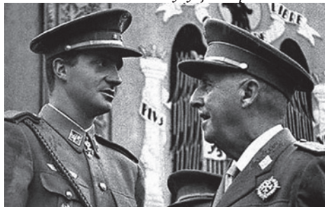
Франко и Принц Астурийский Хуан Карлос, будущий король Испании

тех преступлений, которые в годы гражданской войны совершали республиканцы.