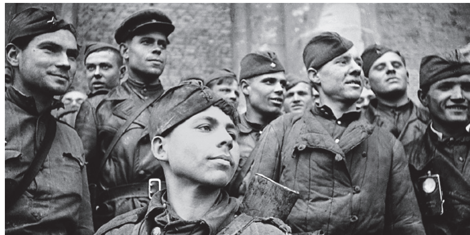
Берлин, май 1945-го. Солдаты, штурмовавшие Рейхстаг (взвод разведки 674 стрелкового полка 150-й стрелковой Идрицкой дивизии). Вот это – «народ-завистник»?

И тем более приятно подтвердить, что в этой милый, широкой, полусвободной стране уже начинают понимать, что не вся Россия состоит из подрячков Мещовского уезда Калужской губернии.»