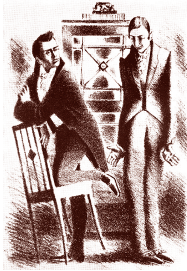
Самохвалов А.Н. Иллюстрация к комедии «Горе от ума» (1935)