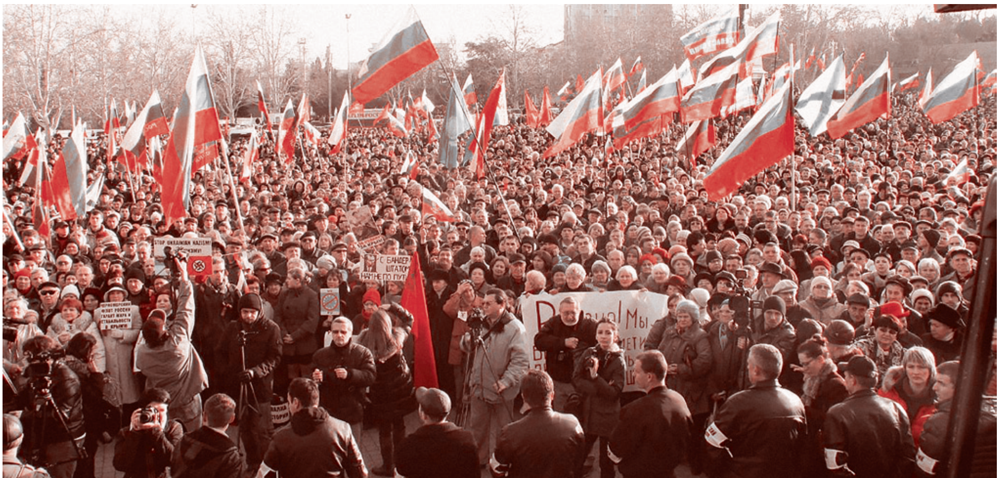
Севастополь, 23 февраля