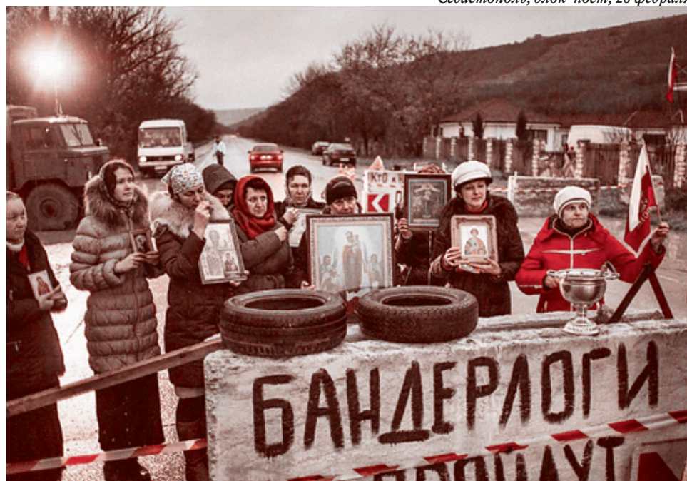
Севастополь, блок-пост, 28 февраля