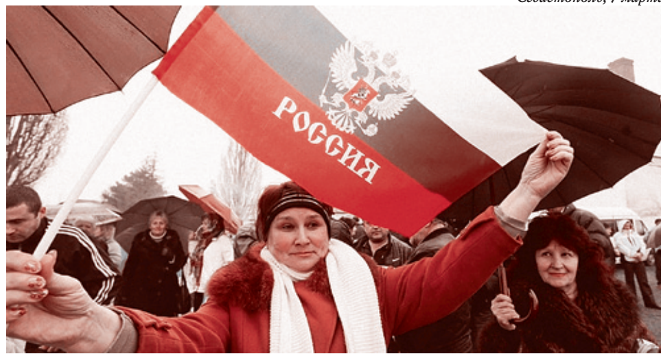
Севастополь, 7 марта