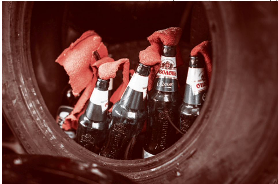
Киев, 24 января 2014 года

Наконец, поздно вечером 7 февраля в Сочи, на открытии Олимпиады, прошла встреча В. Януковича и В. Путина. Детали не сообщаются.