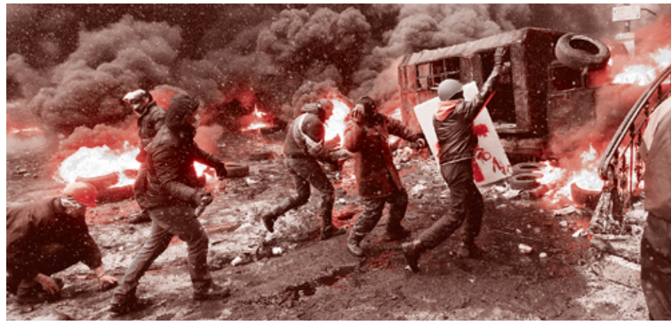
Киев, 22 января 2014 года