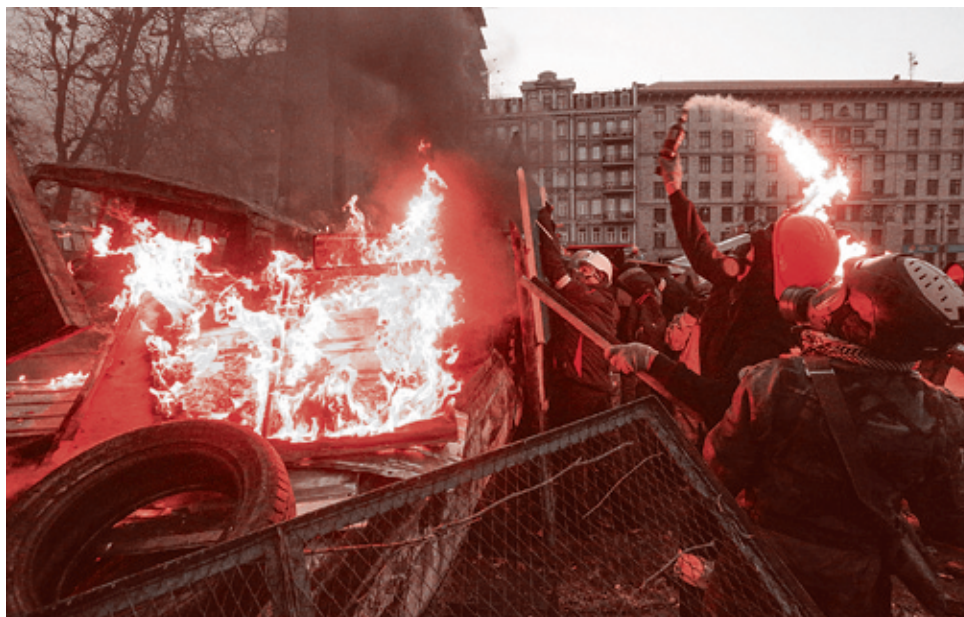
Киев, январь 2014