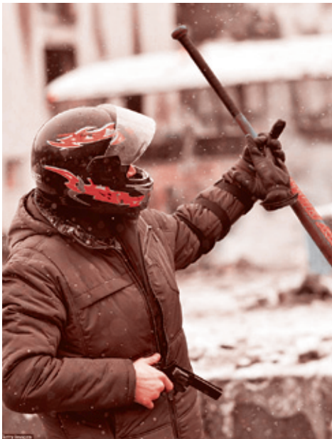
Киев, 22 января 2014