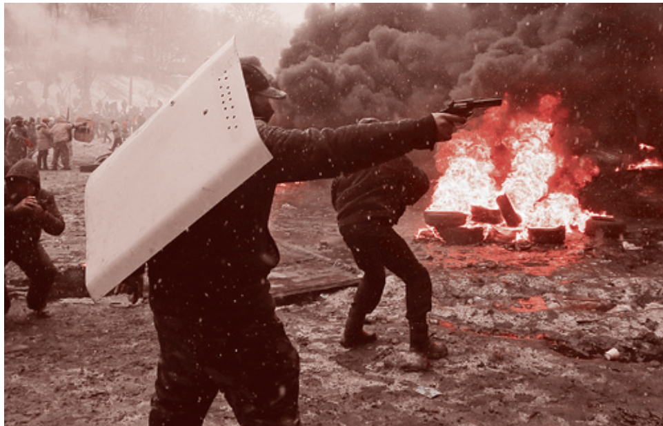
Киев, 22 января 2014 года