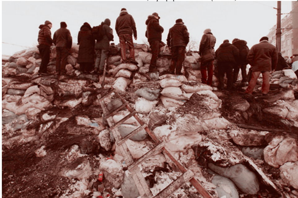
Киев, 4 февраля 2014 года