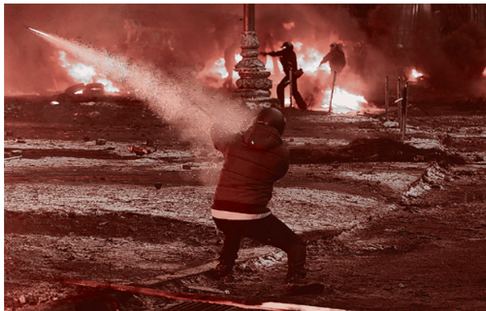
Киев, январь 2014

возвели символическую баррикаду из ящиков из-под бананов как символ того, что Украина — не «банановая республика».