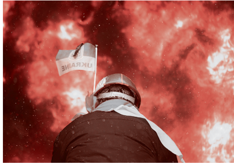
Киев, январь 2014 (Мстислав Чернов)

Именно и прежде всего в кооперации с Украиной Россия реально способна — причем уже сейчас, почти с «низкого старта», — начать выполнять намеченные огромные технологические и оборонно-промышленные программы в аэрокосмосе, судостроении, точной механике, электронной промышленности и т.д.