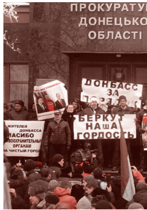
Донецк. 8 февраля 2014.

6 февраля по инициативе Компартии Украины был создан «Антифашистский народный фронт города Киева».