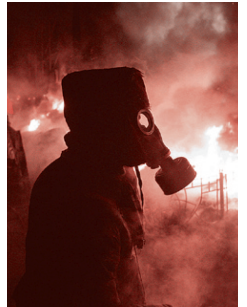
Киев, 25 января 2014 года

Налицо явные признаки попыток перейти к «ливийскому сценарию». Хотя пока «нелигитимной» объявляет украинскую власть только оппозиция, Запад на это еще не решился