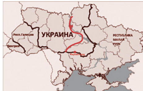
Карта раздела Украины с посвященного Майдану украинского сайта (Редакция красным цветом добавила Кировоград и реальную языковую границу)

Здесь следует отметить, что политика выдачи Румынией паспортов жителям Черновицкой и Одесской областей осуществляется давно. И что, если верить президенту Румынии Траяну Бэеску, паспорта получили уже свыше 100 тысяч человек.