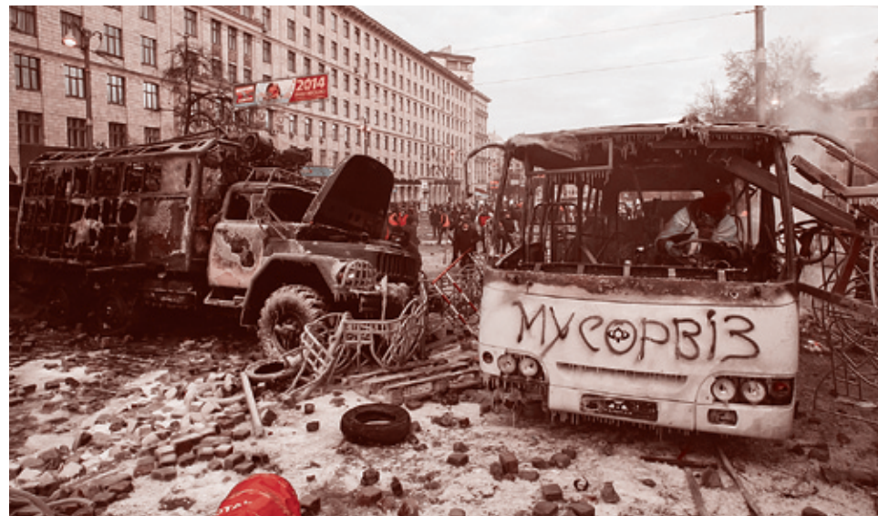
20 января 2014 г.