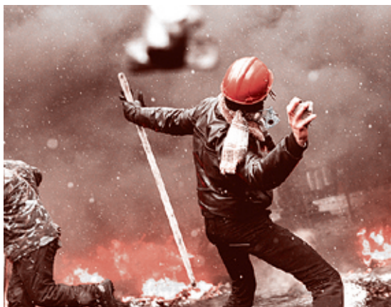
Сергей Сутинский/АФП, 22 января 2014 г.