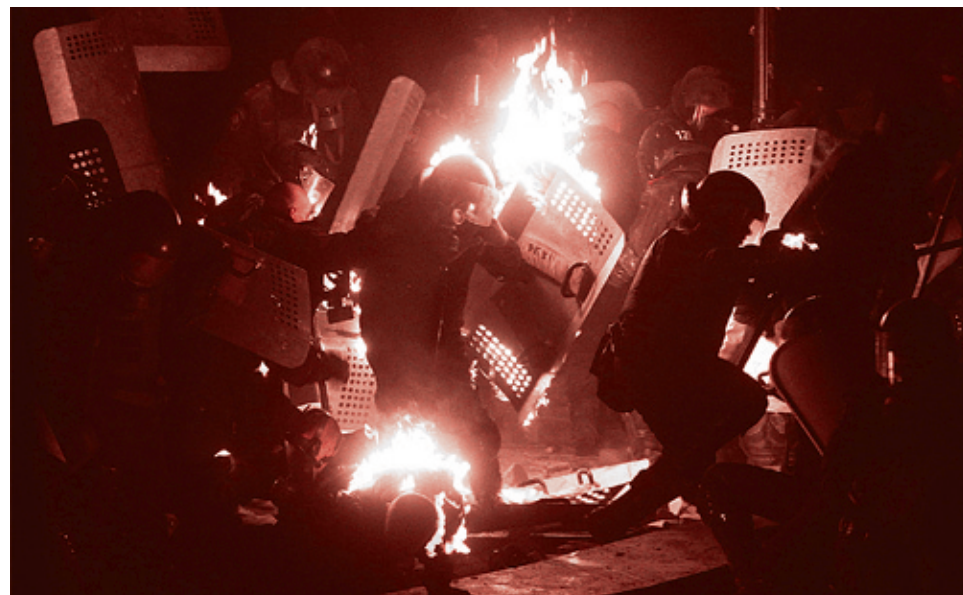
Внештатный корреспондент/Рейтер, 19 января 2014 г.

Глава Минюста Украины Елена Лукаш в эфире телеканала «Интер» заявила, что появление законов 16 января «спровоцировал ненадлежащий уровень поведения граждан, которые камуфлировали свои действия под мирный протест. На самом деле... они запугивали людей, препятствовали деятельности правоохранительных органов, государственных учреждений, блокировали пути сообщения, работу чиновников, совершали другие действия, которые подпадают под признаки уголовных преступлений». И далее Лукаш сказала главное: что статьи принятых 16 января законов, которые могут ограничивать права граждан Украины, будут отменены.