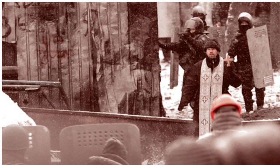
Дарко Воинович/Ассошиэйтед Пресс, 22 января 2014 г.