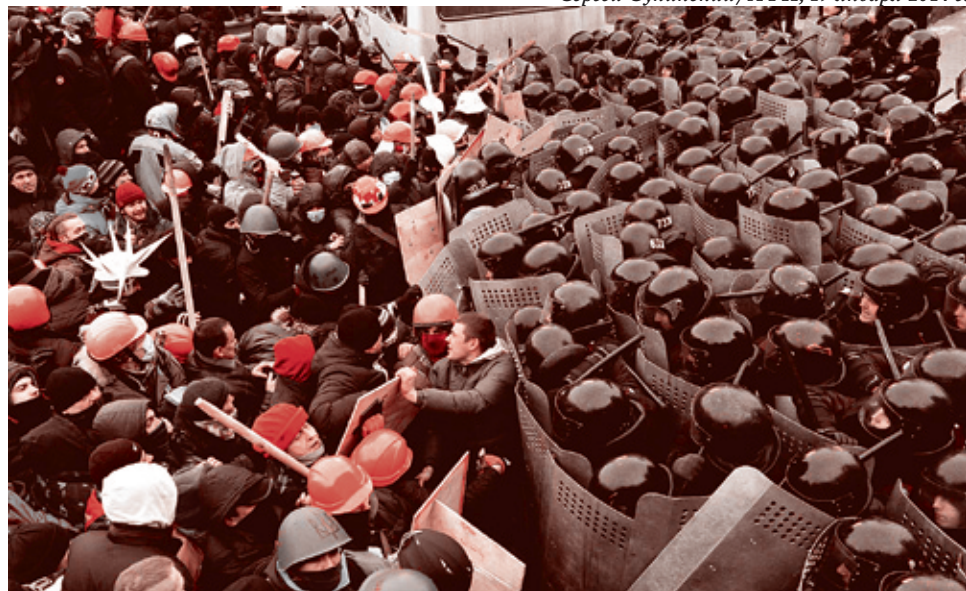
19 января 2014 г.