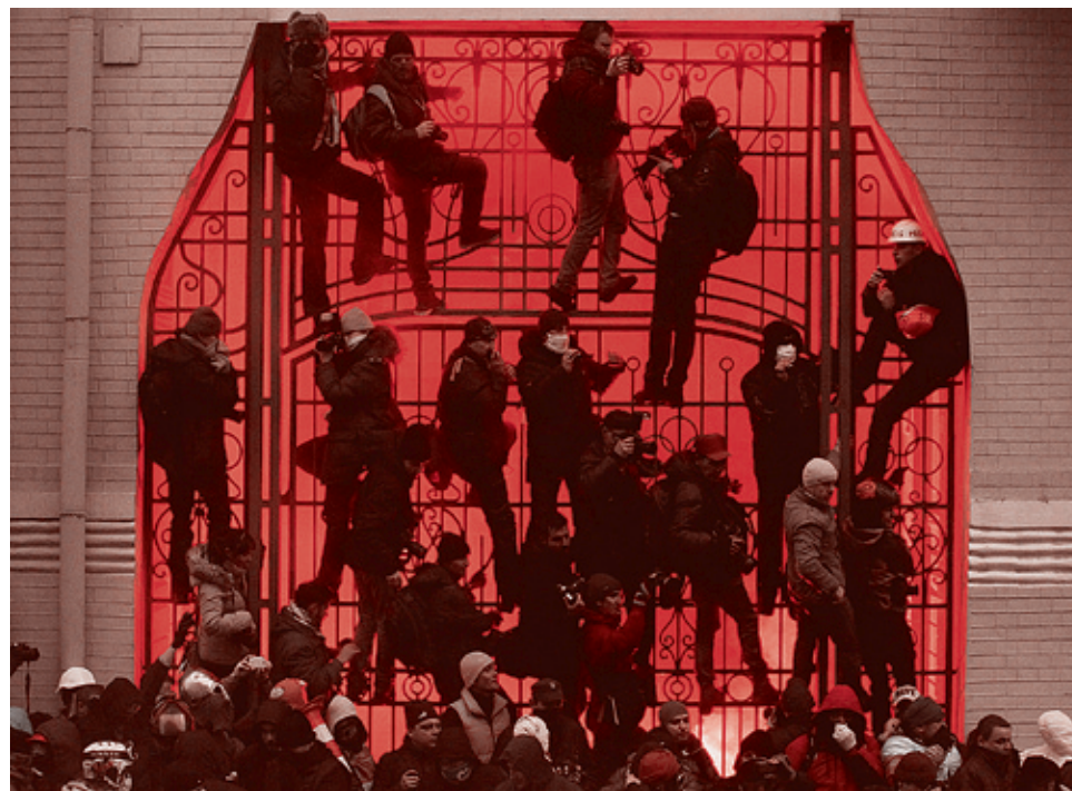
1 декабря 2013 г.

И в этот же день один из лидеров «Батькивщины», бывший глава МВД Ю. Луценко, заявил о начале революции.