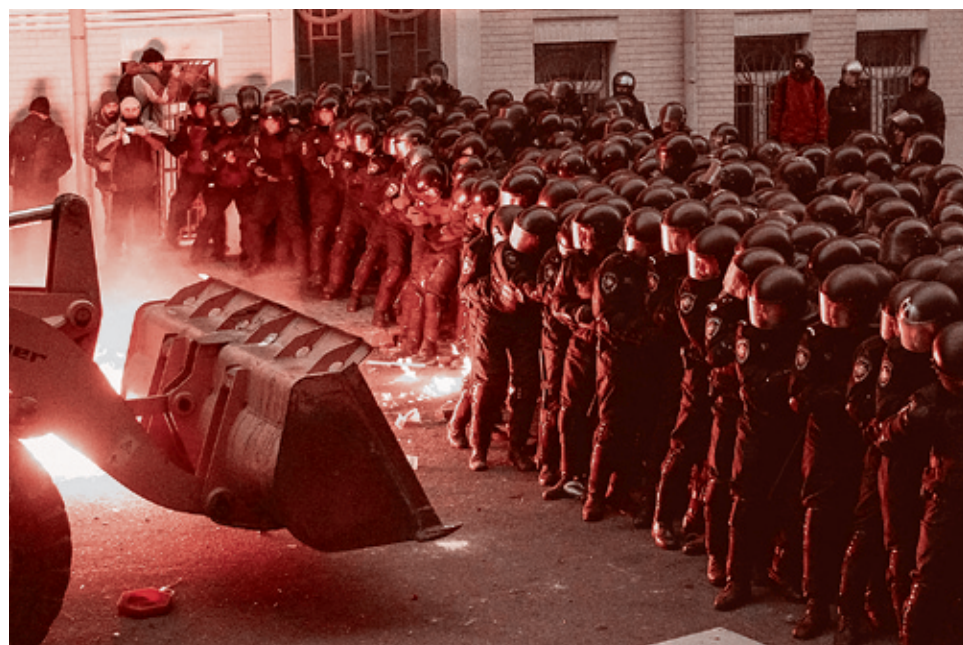
Глеб Гаранич/Рейтер, 1 декабря 2013 г.