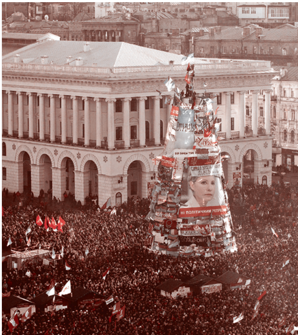
22 декабря 2014 г.

Глава МИД Германии Ф. Штайнмайер заявил: «Вызывает возмущение то, как российская политика использовала экономический кризис в Украине».