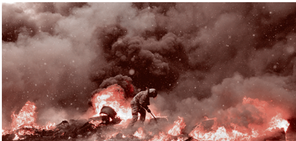
Сергей Сутинский/АФП, 22 января 2014 г.

обнаружен труп мужчины с двумя огнестрельными ранениями (в голову и грудь). При нем были найдены паспорт и личные вещи. Кроме того, около 9 часов утра в помещении библиотеки был выявлен еще один мужчина с огнестрельными ранениями, который находился без сознания. Последний погиб».