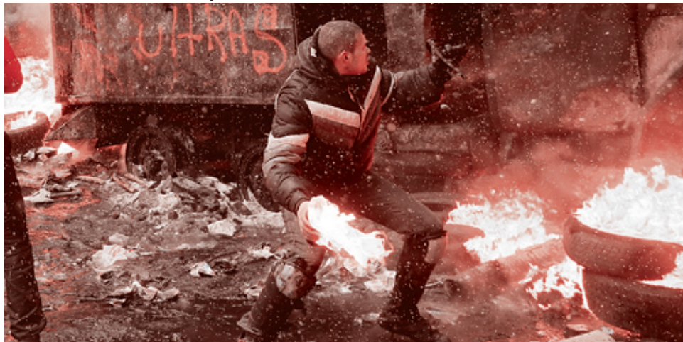
22 января 2014 г.