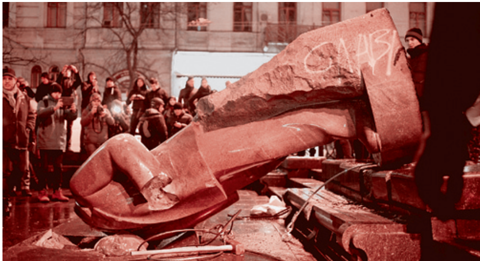
8 декабря 2013 г.