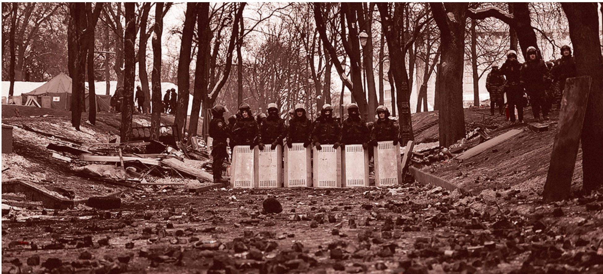
28 января 2014 г.