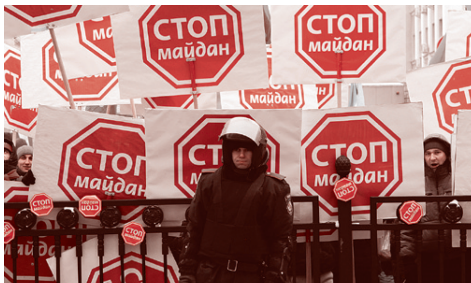
28 января 2014 г.

Но раз нет достоверных данных Государственного избирателя, то досрочные выборы, о возможности которых сказал Янукович, проводить законным и легитимным образом, скорее всего, не получится!