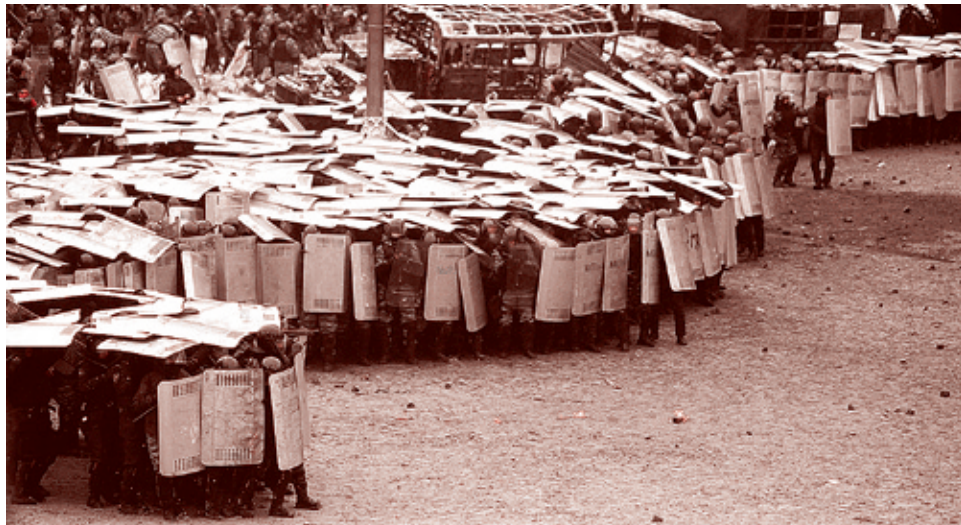
Макс Левин/Рейтер, 22 января 2014 г.

Далее Генпрокуратура сообщает о событии, которое переводит киевские эксцессы на качественно новый уровень: «Утром в 06.25 правоохранителям позвонил неизвестный и сообщил, что в библиотеке Национальной академии наук находится труп мужчины. Звонивший рассказал, что труп сначала принесли в Дом профсоюзов, а затем — в библиотеку. На указанный вызов выехали сотрудники органов милиции... В холле библиотеки, на столе, был