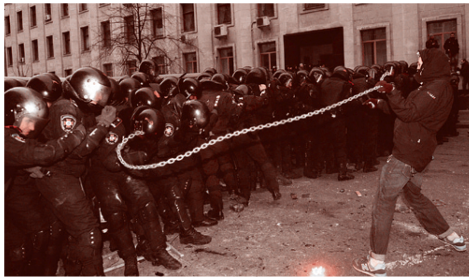
1 декабря 2013 г.