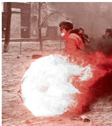
Василий Федосенко/Рейтер, 22 января 2014 г.