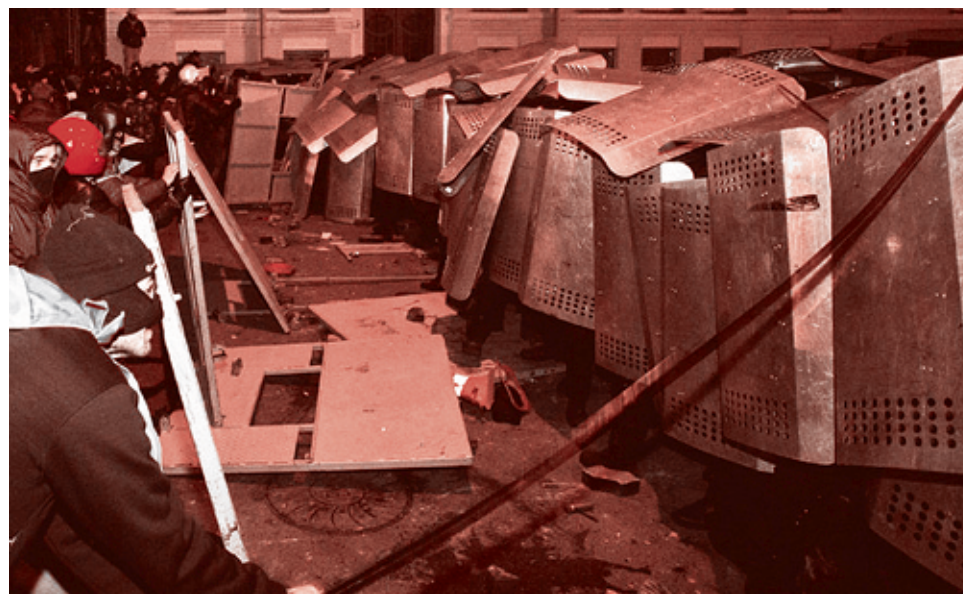
1 декабря 2013 г.