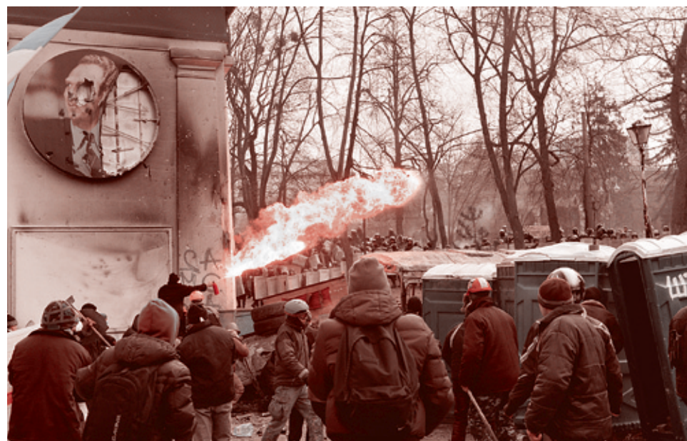
Сергей Сутинский/АФП, 20 января 2014 г.