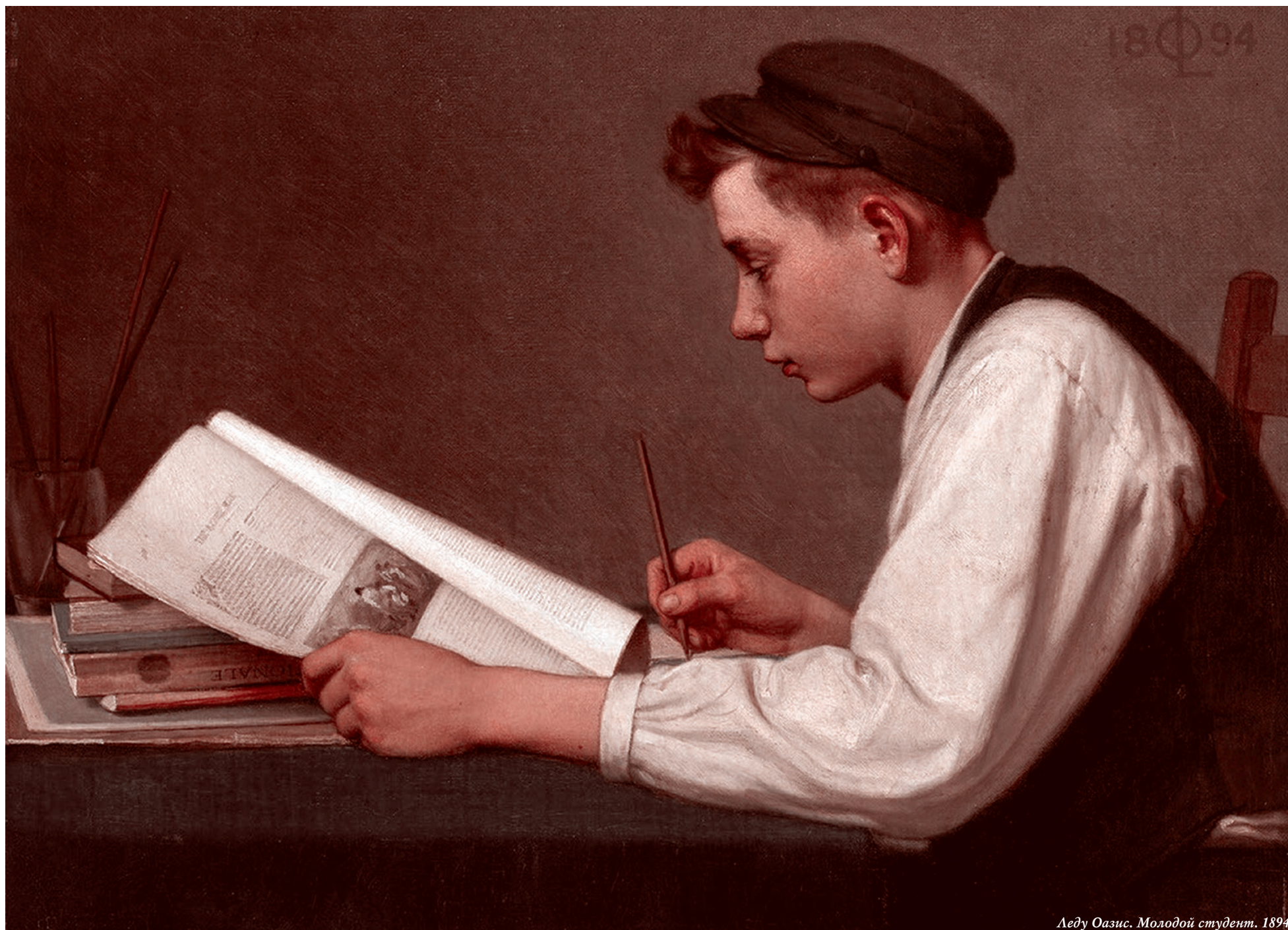
Леду Оазис. Молодой студент. 1894

В начале этого года группа депутатов внесла на рассмотрение в Государственную думу законопроект № 820310–8 «О проведении эксперимента по расширению доступности среднего профессионального образования». Этот законопроект получил одобрение правительства и профильного комитета Госдумы по просвещению.