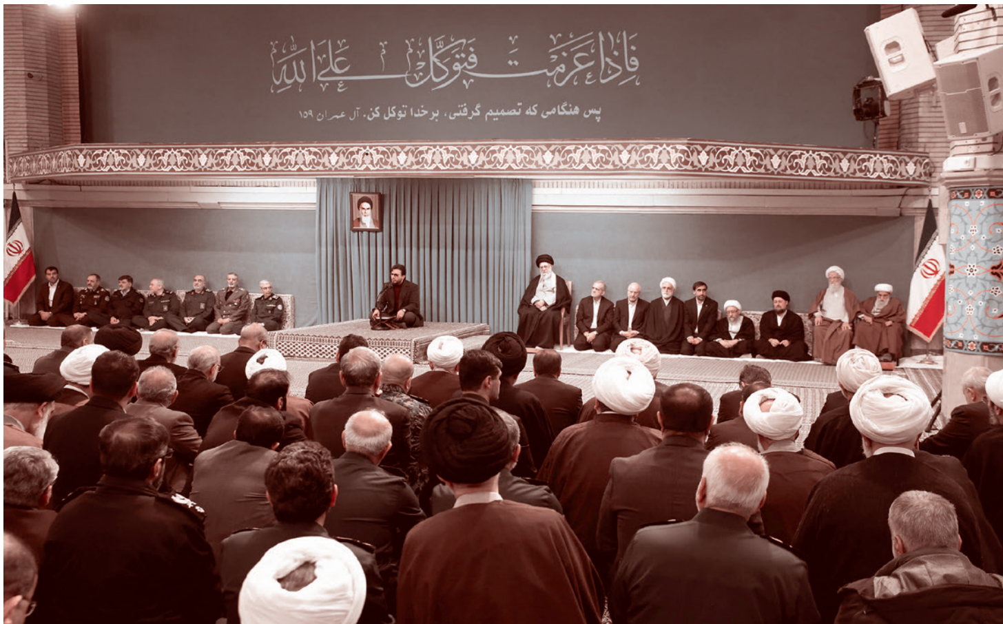
Встреча Хаменеи с правительством, руководством КСИР, парламентариями и членами Ассамблеи экспертов. 8 марта 2025 года

Трамп обещает снова сделать Америку великой. Но как воплотить этот план в жизнь, не перестраивая всей современной американской жизни и не переделывая современное, отвыкшее от нагрузок, американское население? Вероятно, это достижимо только путем устройства в мире такого хаоса — желательно с ядерными инцидентами, — чтобы на его фоне США приподнимались. Понятно, что все эти факторы говорят только о том, что «хорошая сделка» Ирану не светит.