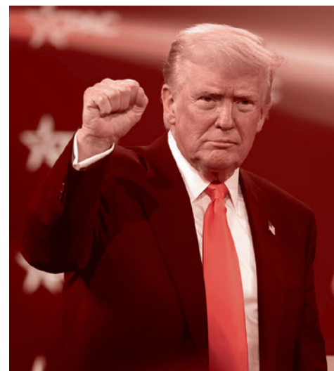
Дональд Трамп. 2025

— Они сняли ядерные боеголовки и уничтожили средства доставки. Но сами боеголовки где-то лежат. Поэтому тут, в об-