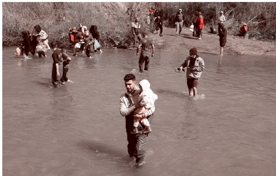
Сирийские алавиты бегут в Ливан. 11 марта 2025

Понимаете, для того чтобы уехать, даже если ты бедный, и начать совсем-совсем оголтело воевать, нужно же иметь мотив. Мотив создавали исламистские мечети