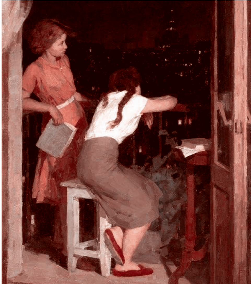
Карл Фридман. «На балконе». 1956

Чтобы понять мотивы депутатов, которые внесли законопроект в Госдуму, необходимо рассмотреть социальный контекст