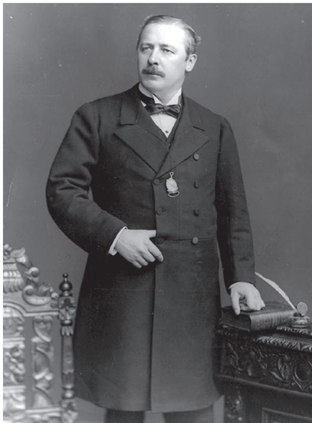
Лорд Эвелин Бэринг Кромер

Знаете, еще десять лет назад термин «глубинное государство» означал, что это маргинальные конспирологи что-то там такое «шьют» великой западной системе. Теперь это говорит император Запада по фамилии Трамп. Он еще много что говорит, вспоминает своего дядю, известного ученого. Можно было бы отдельно поговорить, как именно этот дядя занимался вещами, которые долгое время считались маргинальными и конспирологическими,