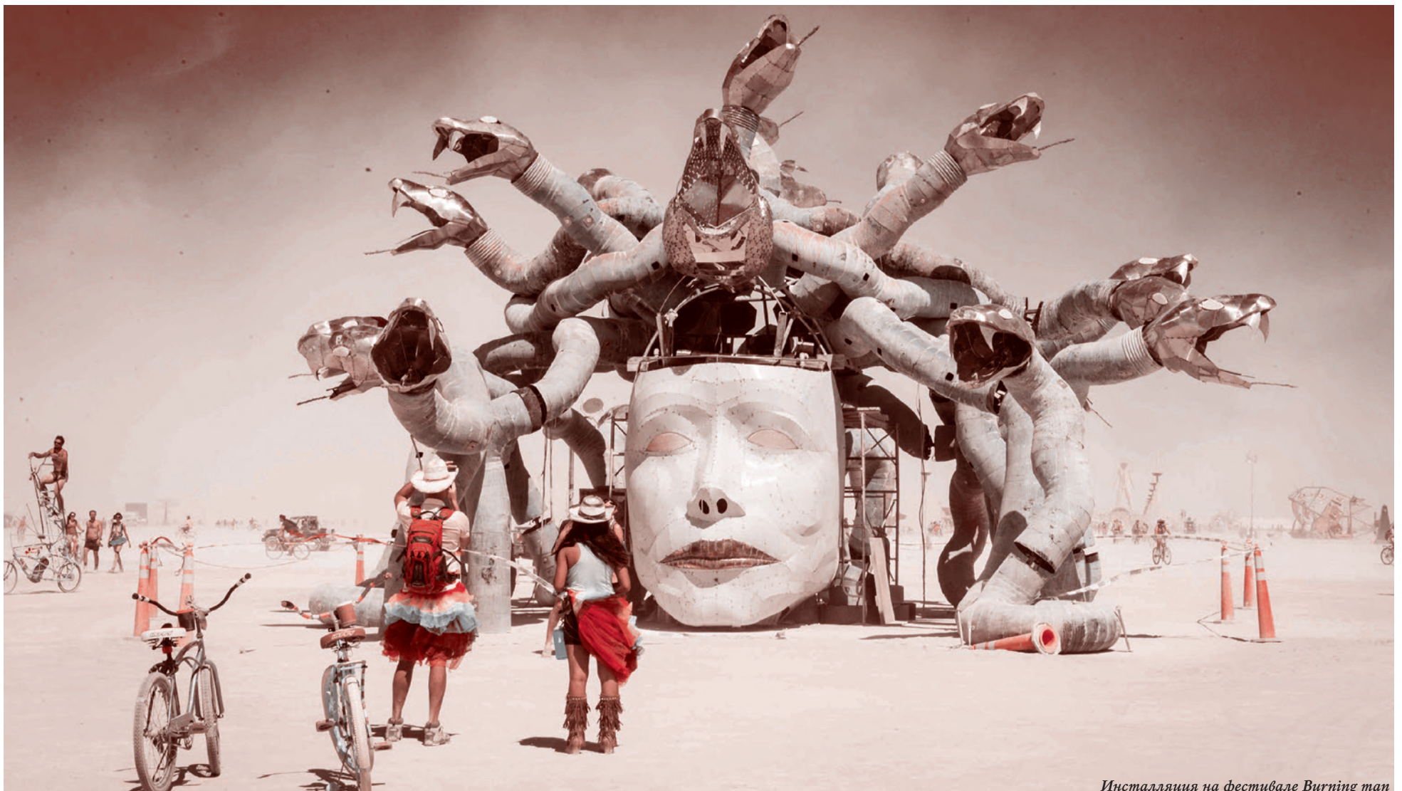
Инсталляция на фестивале Burning man