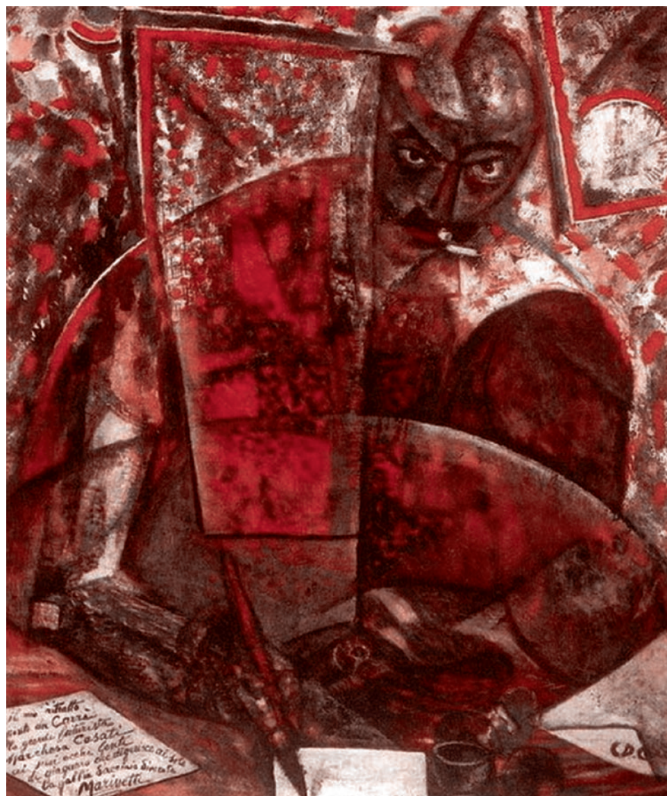
Карл Карра. Портрет Маринетти. 1910

«Новые технократы нарочито используют язык, апеллирующий к ценностям Просвещения — разуму, прогрессу,