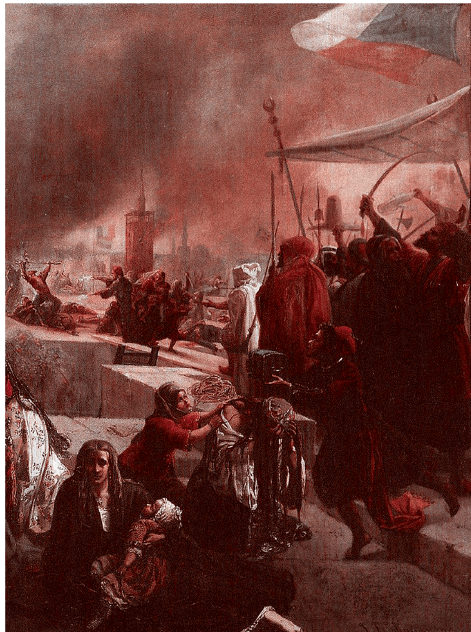
Жан-Батист Гюисманс. «Абд аль-Кадир аль-Джазири спасает христиан от смерти во время антихристианских беспорядков в Дамаске в июле 1860 года». 1861

Передача «Разговор с мудрецом» на радио «Звезда» от 17 марта 2025 года