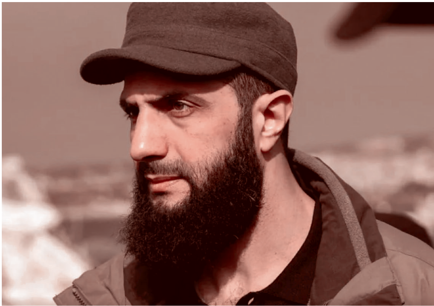
Лидер Сирии Абу Мохаммад аль-Джулани

* — организация, деятельность которой запрещена в РФ.