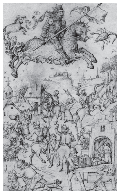
Марс и его дети. Иллюстрация из средневековой германской книги. 1480

Сергей Кургинян: Тут вопрос заключается в том, что нельзя обсуждать «трампизм» без обсуждения того, что ему противостоит. Нужно с глубоким прискорбием признать колоссальную деградацию демократического западного движения, — колоссальную, невиданную; и колоссальную деградацию левого движения.