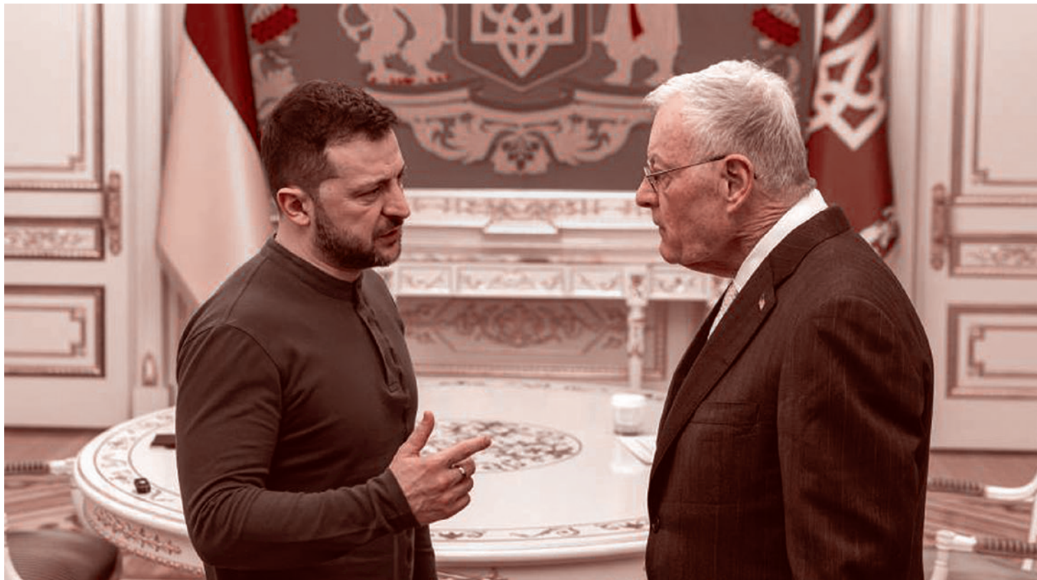
Спецпосланник президента США Дональда Трампа Кит Келлог во время встречи с президентом Украины Владимиром Зеленским