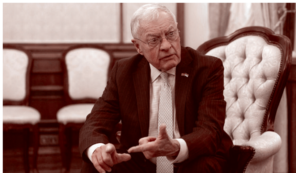
Спецпосланник президента США Дональда Трампа Кит Келлог

«Чего мы не хотим делать, так это вступить в большую групповую дискуссию», — сказал он. По его словам, за столом переговоров будут российская