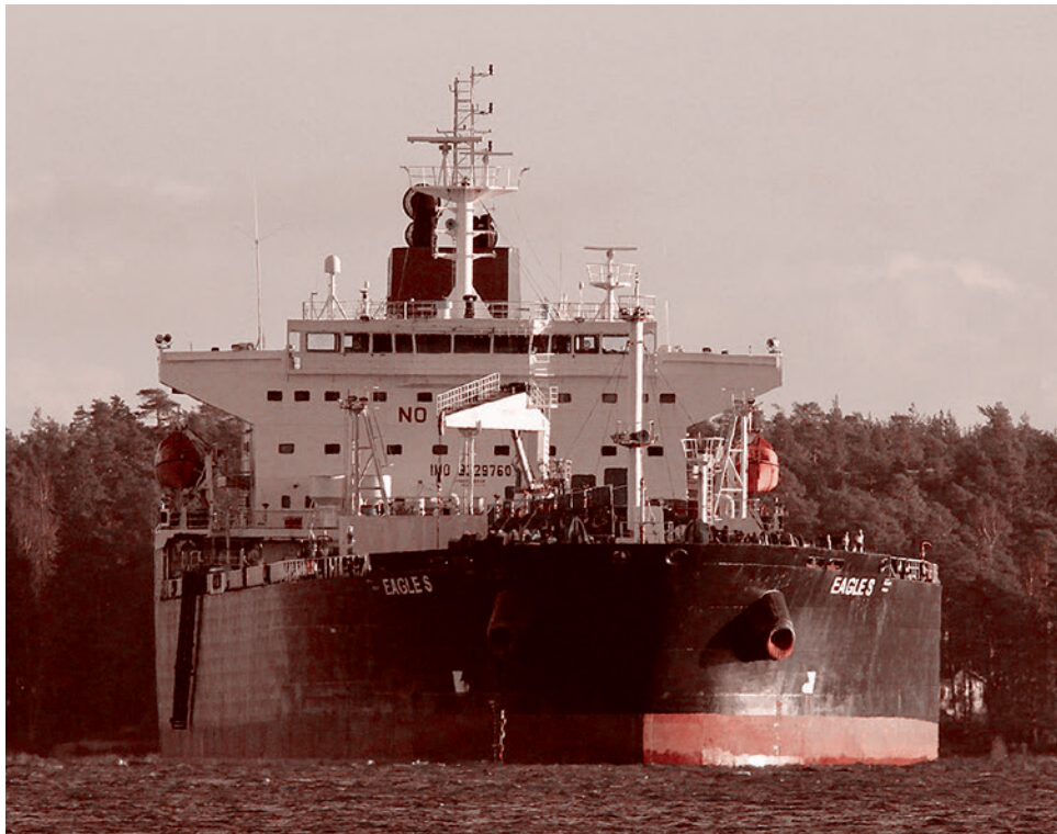
Танкер Eagle S

Газета «Суть времени» зарегистрирована Федеральной службой по надзору в сфере связи, информационных технологий и массовых коммуникаций (Роскомнадзор) Свидетельство ПИ № ФС77-50554 от 9 июля 2012 года