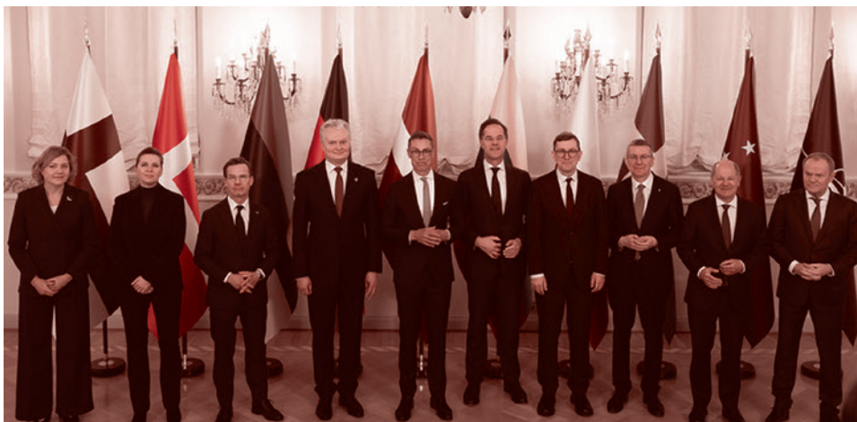
Саммит НАТО в Хельсинки

Стратегическая цель этих действий очевидна: максимально осложнить исполь-