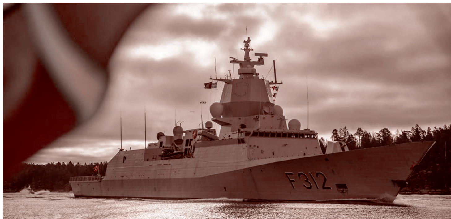
Учения НАТО Baltic Sentry

И 14 января в Хельсинки прошел неформальный саммит НАТО, куда финский