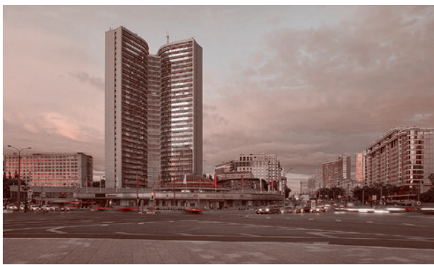
Правительство Москвы на Новом Арбате