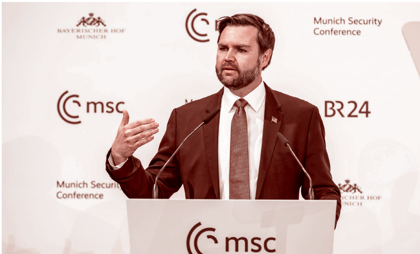
Вице-президент США Дж. Вэнс на Мюнхенской конференции по безопасности