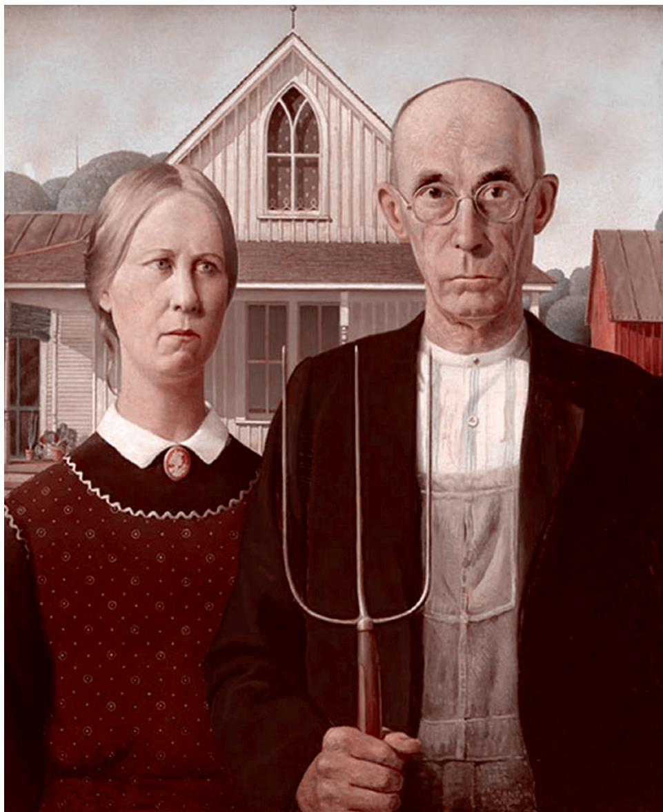
Грант Вуд. Американская готика. 1930

Сергей Кургинян: Было, было. Мы ликвидируем, потому что суверенитет Пакистана очень относителен. Мы с «Аль-Каидой»* так поступали, и тут будем так. Но «Аль-Каида»* — террористы. Значит, американцы уже наезжают на Пакистан. Индийцам это нравится. Но тогда Пакистан отруливает окончательно к Китаю. Они его отпугнут туда. Дальше Пакистан начинает соответствующие действия в Афганистане. Там весь юго-восточный котел, который они запускают. Они действуют как слон в посудной лавке. Но это же не посудная лавка, где в итоге будут лежать только обломки. Они запускают процессы. Очень большие процессы. При этом Трамп все время говорит: «Я люблю Си Цзиньпина. У меня с ним глубокое понимание». Но здесь же вопрос не в том, какое у него понимание, какая у