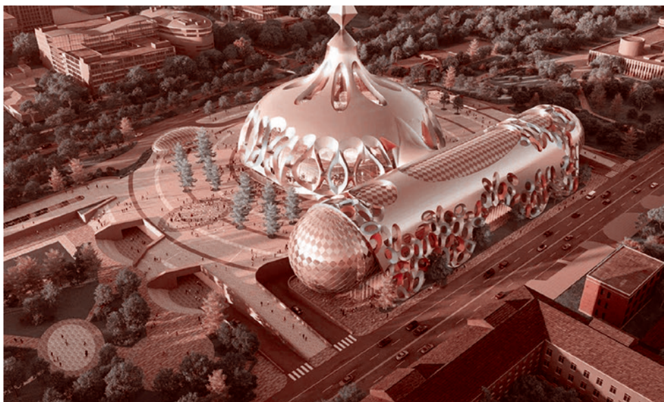
Новый проект цирка на проспекте Вернадского в Москве

Качели посреди Триумфальной площади — это же такой диссонанс. В центре площади стоит памятник Маяковскому, а тут у нас качели-карусели. Может еще