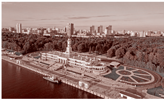
Северный речной вокзал в Москве