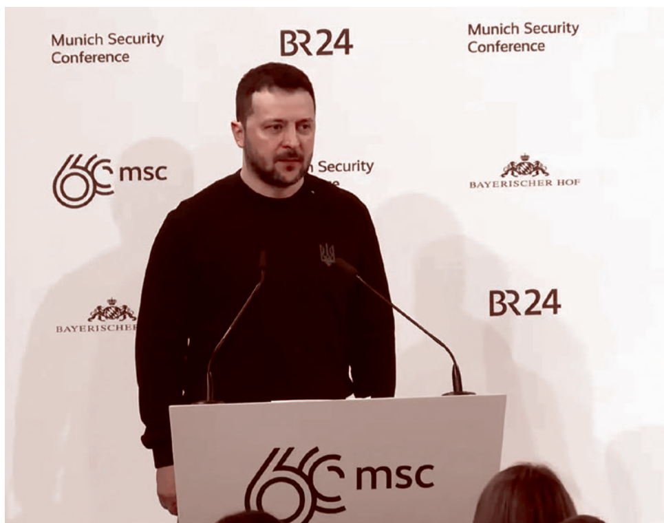
Зеленский на пресс-конференции в Мюнхене

США настаивают, что сделка по ископаемым обеспечит американское присутствие на Украине, которое станет сдерживающим фактором для России. Отмечается, что украинская сторона обеспокоена расплывчатостью этой формулировки, которая может означать лишь экономическое присутствие американских компаний. В документе также оговаривается, что споры сторон должны будут решаться в судах штата Нью-Йорк, однако в Киеве считают, что те не обладают необходимой для рассмотрения таких вопросов юрисдикцией.