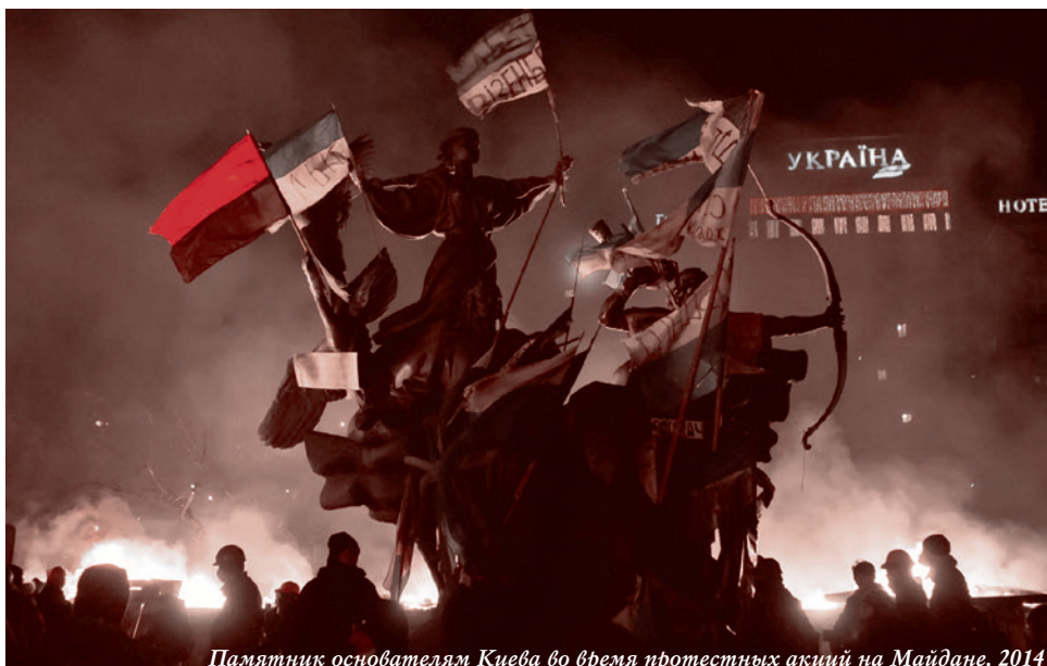
Памятник основателям Киева во время протестных акций на Майдане. 2014