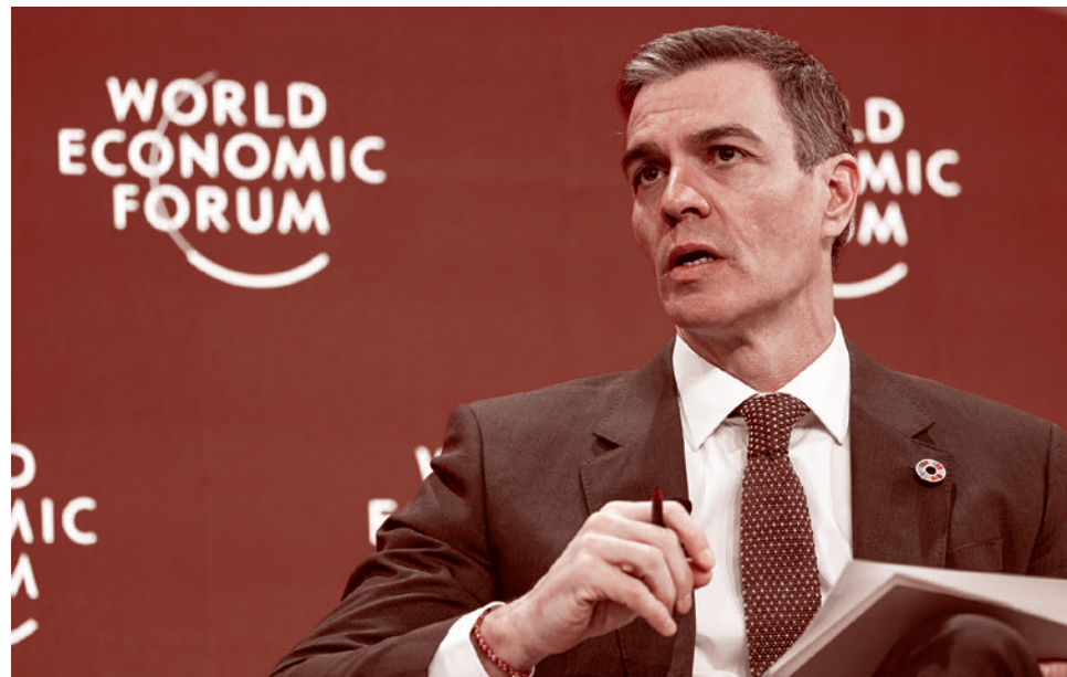
Премьер-министр Испании Педро Санчес на форуме в Давосе. 2025