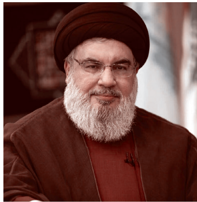
Бывший лидер движения Хезболла Хасан Насралла

Сирийский кризис переопределил международные отношения Турции. Способность Асада удерживать власть — во многом благодаря России, Ирану и «Хезболле» — сблизил Анкару, Москву и Тегеран, особенно после попытки переворота в Турции в 2016