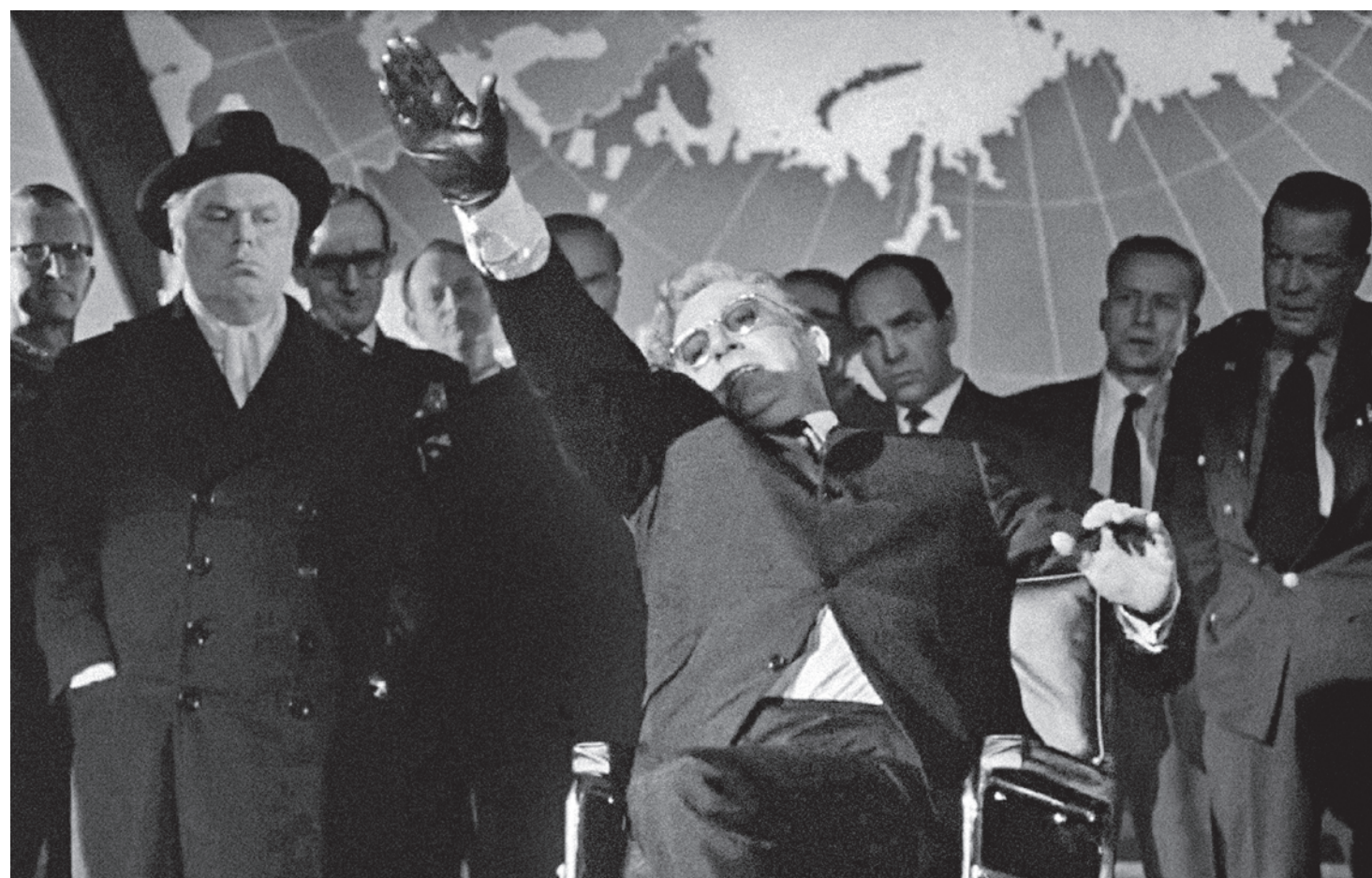
«Доктор Стрейнджлав, или Как я научился не волноваться и полюбить атомную бомбу». Реж. Стэнли Кубрик. США