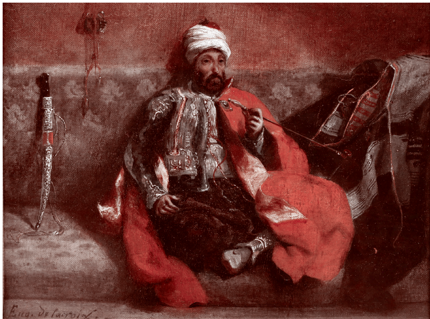
Эжен Делакруа. Турок, курящий на диване. 1834

«Убийство Насраллы хотя и стало ударом по «Хезболле», несомненно, при-