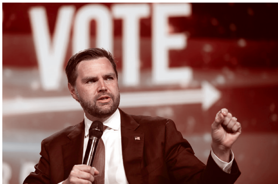
Вице-президент США Вэнс