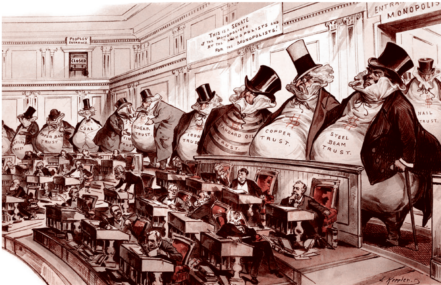
«Боссы в сенате». Карикатура Джозефа Кенлера. США. 1889

если эту «Омегу» подпустили к власти, то нечто имеется в виду.