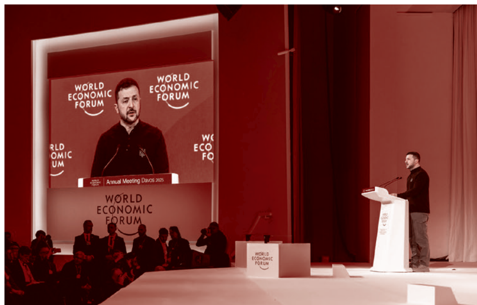
Президент Украины Владимир Зеленский на форуме в Давосе. 2025

Но пока в Европе больше занимались болтовней и продолжали пользоваться дешевыми российскими углеводородами, лидером по части возобновляемой энергии неожиданно стал Китай, который продолжает успешно развиваться и окутывать своими экономическими щупальцами остальную мир.