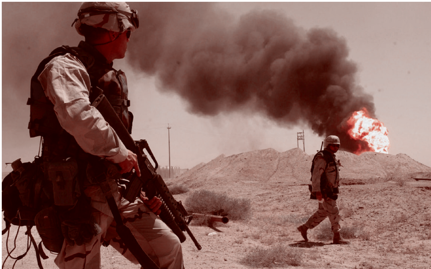
Американские военные на Ближнем востоке

Все вышеуказанное выглядело так, словно ХТШ* — проект, поддерживаемый где-то на Западе. В прошлых статьях цикла мы отмечали, что панисламистские и пантюркистские проекты Турция реализует при поддержке международных структур и иностранных спецслужб: ЦРУ и британской разведки М16. М16 сегод-