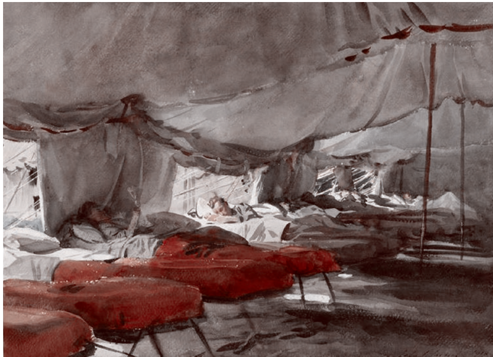
Джон Сингер. Интерьер больничной палатки. 1918

При завершении необходимых организационных дел по своей службе в моем полку и с разрешения моего командира чести полковника С., не без участия капитана медслужбы Б., я был прикомандирован к 15-й омедб 3-й мсд в качестве врача ане-