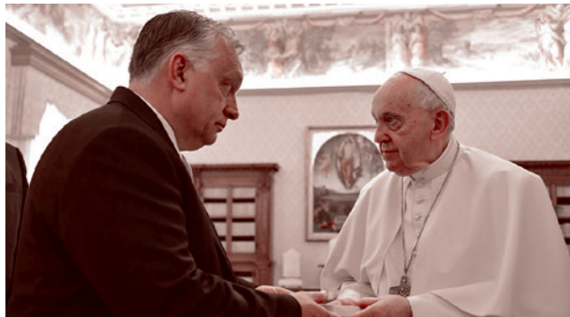
Виктор Орбан и папа римский Франциск

Конечно, прежде всего Венгрия нужна Трампу как европейская страна с сильными правыми уклоном, готовая к сотрудничеству с США для раскола Европы на «старую» (брюссельские демократы) и «правую». Виктор Орбан регулярно говорит о приближающемся «новом мироустройстве», в котором он намерен занять достойное место. Обеспечить новый миропорядок, по словам Орбана, должны «патриоты», не желающие отдавать власть тем, кто разжигает конфликт на Украине, растлевает детей и наполняет Европу мигрантами. Под патриотами он подразумевает членов коалиции «Патриоты за Европу» — объединения правых и ультраправых партий Евросоюза. В их число вошли правящая в Венгрии партия «Фидес», «Австрийская партия свободы», греческий «Голос разума», испан-