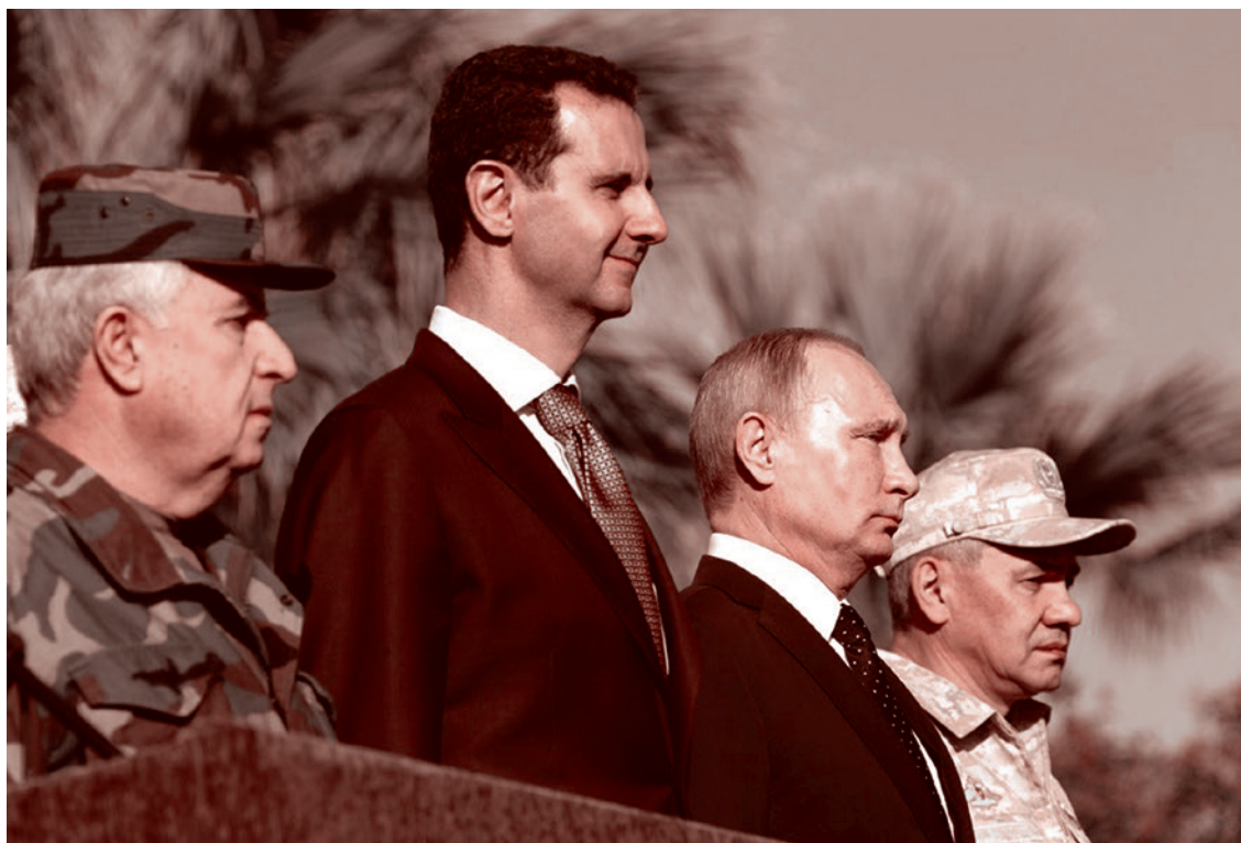
Президент РФ Владимир Путин с президентом Сирийской Арабской Республики Башаром Асадом (слева) и министром обороны РФ Сергеем Шойгу (справа) во время посещения авиабазы Хмеймим в Сирии. 2017