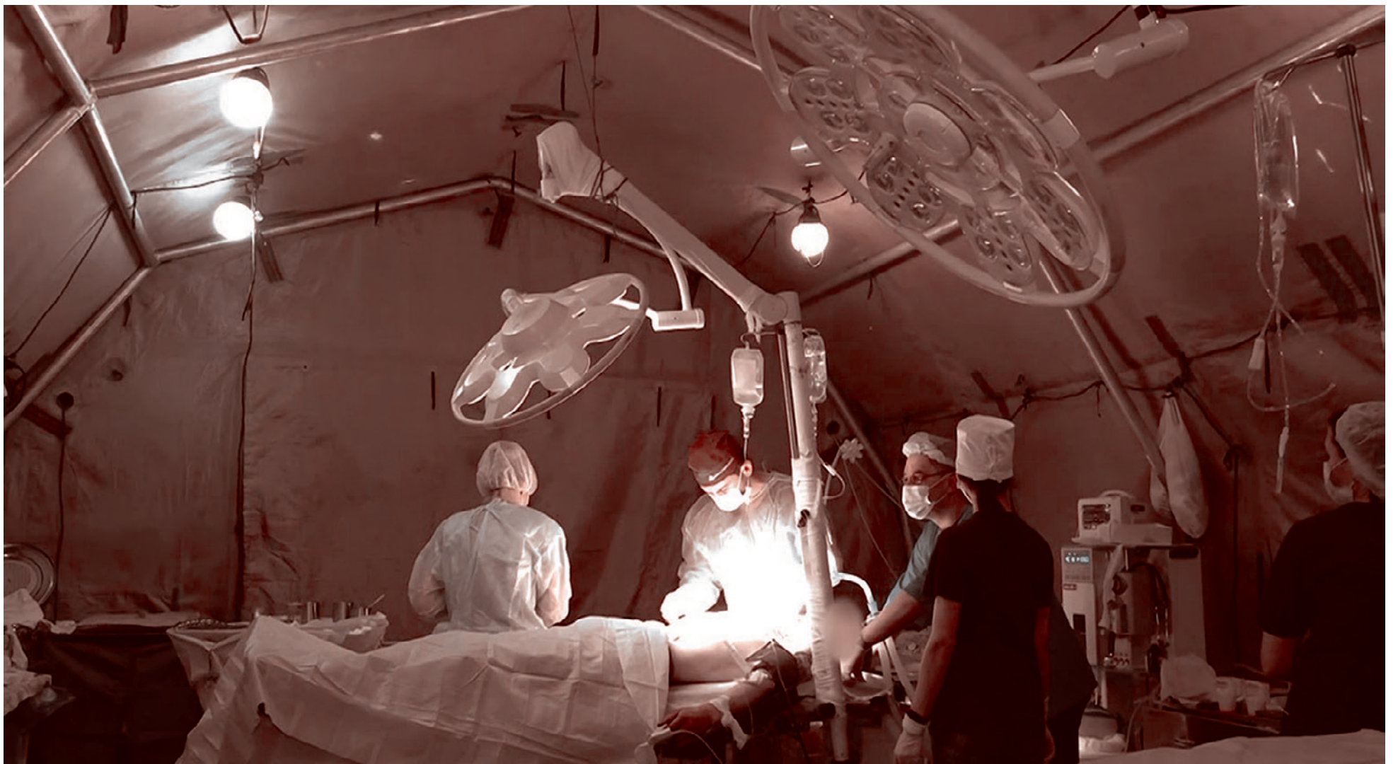
В полевом госпитале

Да, в условиях СВО Главное военно-медицинское управление Министерства обороны внесло изменения в структуру