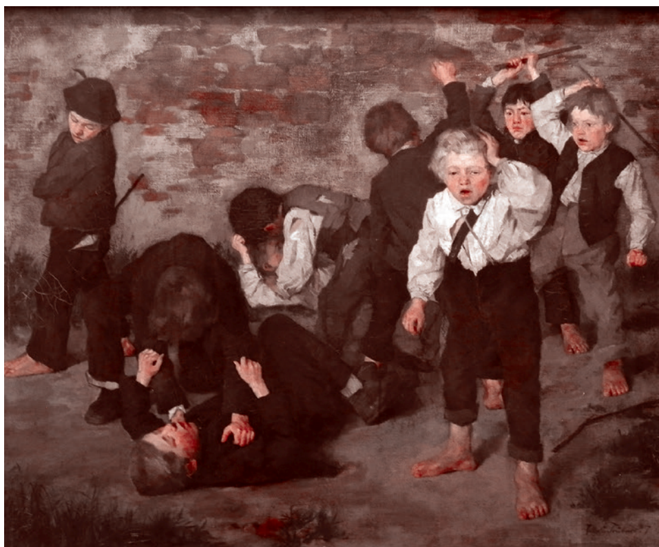
Вильгельм Трюбнер. Ссорящиеся мальчики. 1872

Но судя по нашему опыту, непригодность изменений, предлагаемых законопроектом, не только в этом. Например, сомнительным является вводимый законопроектом запрет на травлю детей педагогами и другими работниками образовательных организаций. Это известный ход: попытка взять под контроль закона то, что раньше регулировалось моралью. И это, как правило, плохо работает, особенно в обществах, где жива традиция (а мы, согласно Конституции, традицию вроде как оберегаем).