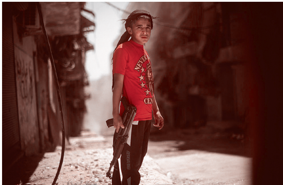
Сирийский мальчик с АК-47 стоит в районе Шейх Масуд

Вспомним, что группировка «Исламское государство Ирака и Леванта» сложилась на основе группировки «Исламское государство Ирак». Которая, в свою очередь, возникла с опорой на те организационные принципы,