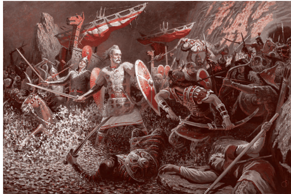
Б. М. Ольшанский. Битва дружины Святослава на Днепро-ских порогах

Потому и нет в русской истории великих побед, одержанных лишь одним каким-либо славянским племенем. Хотя из греческой истории, например, мы знаем победы отдельно спартанцев или афинян. А на Руси есть лишь победы, одержанные русскими в целом. Вот такая особенность.