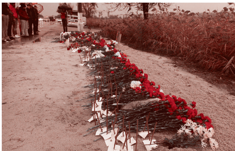
Цветы на месте теракта в Волгограде

Три террористические атаки всего за два месяца в Волгограде (с десятками жертв и сотней раненых). Мощный взрыв у здания ГИБДД в Пятигорске 27 декабря (трое погибших). Убийство в начале января 2014 года на Ставрополье пятерых водителей с подложенными у брошенных машин бомбами. Таков неполный перечень последних преступлений террористического подполья. Теракты явно нацелены на нагнетание страха и паники у населения накануне зимней Олимпиады, а также на обострение межконфессиональных отношений в стране.