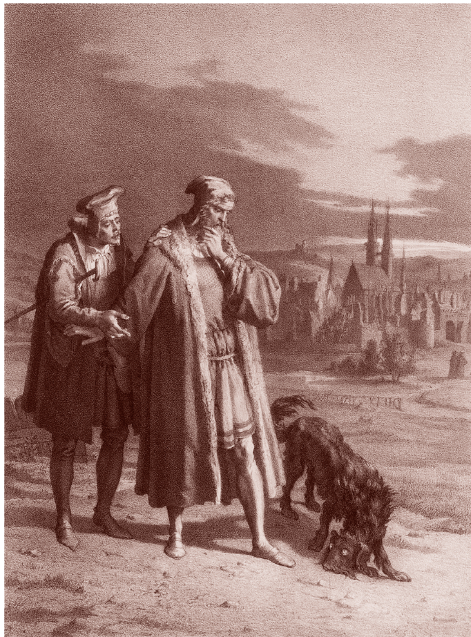
Ф. Г. Шлик. Фауст и Вагнер на прогулке.

Итак, Фауст падает. Это падение посвященного, не справившегося с большой мистерией. И вот после того, как Фауст с этой мистерией не справляется... после этого колоссального фиаско и встречи с занудой Вагнером, то есть с тем, что должен будет являть собой он, Фауст, за вычетом посвящения в большую мистирию, Фауст решается на мистирию малую, гораздо более слабую. Она же мистирия Мефистофеля.