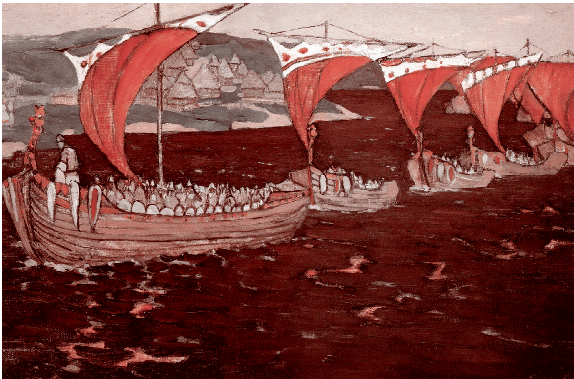
Николай Рерих. Заморские гости . 1902

Передача «Разговор с мудрецом» на радио «Звезда» от 28 октября 2024 года