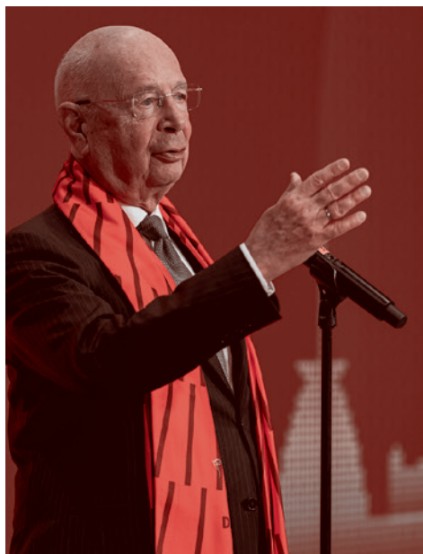
Основатель и исполнительный председатель Всемирного экономического форума Клаус Шваб

предсказание все еще «поразительно точно»: к 2027 году 50% рабочих мест исчезнут. Ожесточенная реакция против ИИ неизбежна, поскольку многие ощущают себя брошенными в результате этого перехода».