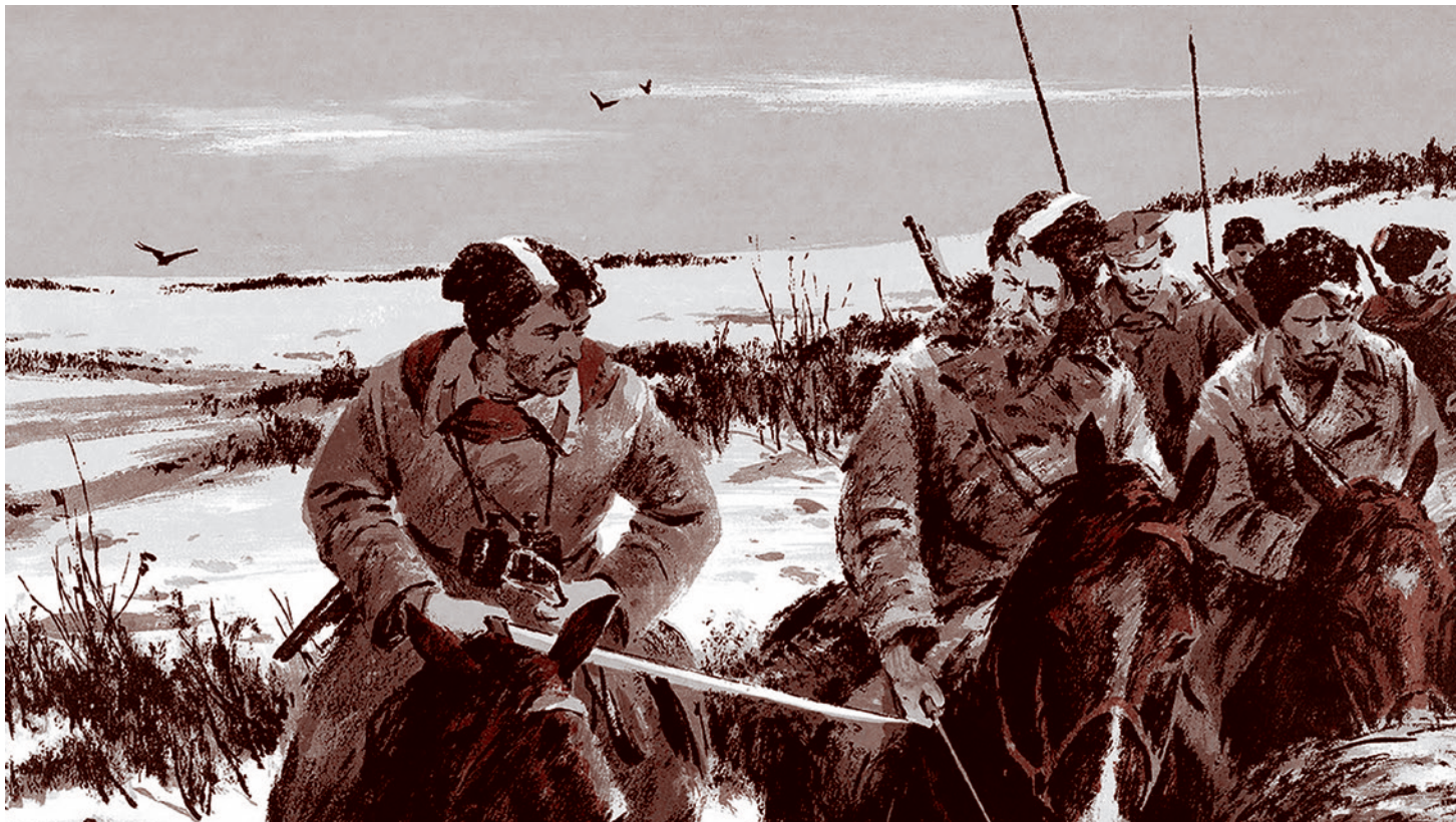
Юрий Ребров. Иллюстрации к роману Михаила Шолохова Юрий «Тихий Дон»

Газета «Суть времени» зарегистрирована Федеральной службой по надзору в сфере связи, информационных технологий и массовых коммуникаций (Роскомнадзор) Свидетельство ПИ № ФС77-50554 от 9 июля 2012 года