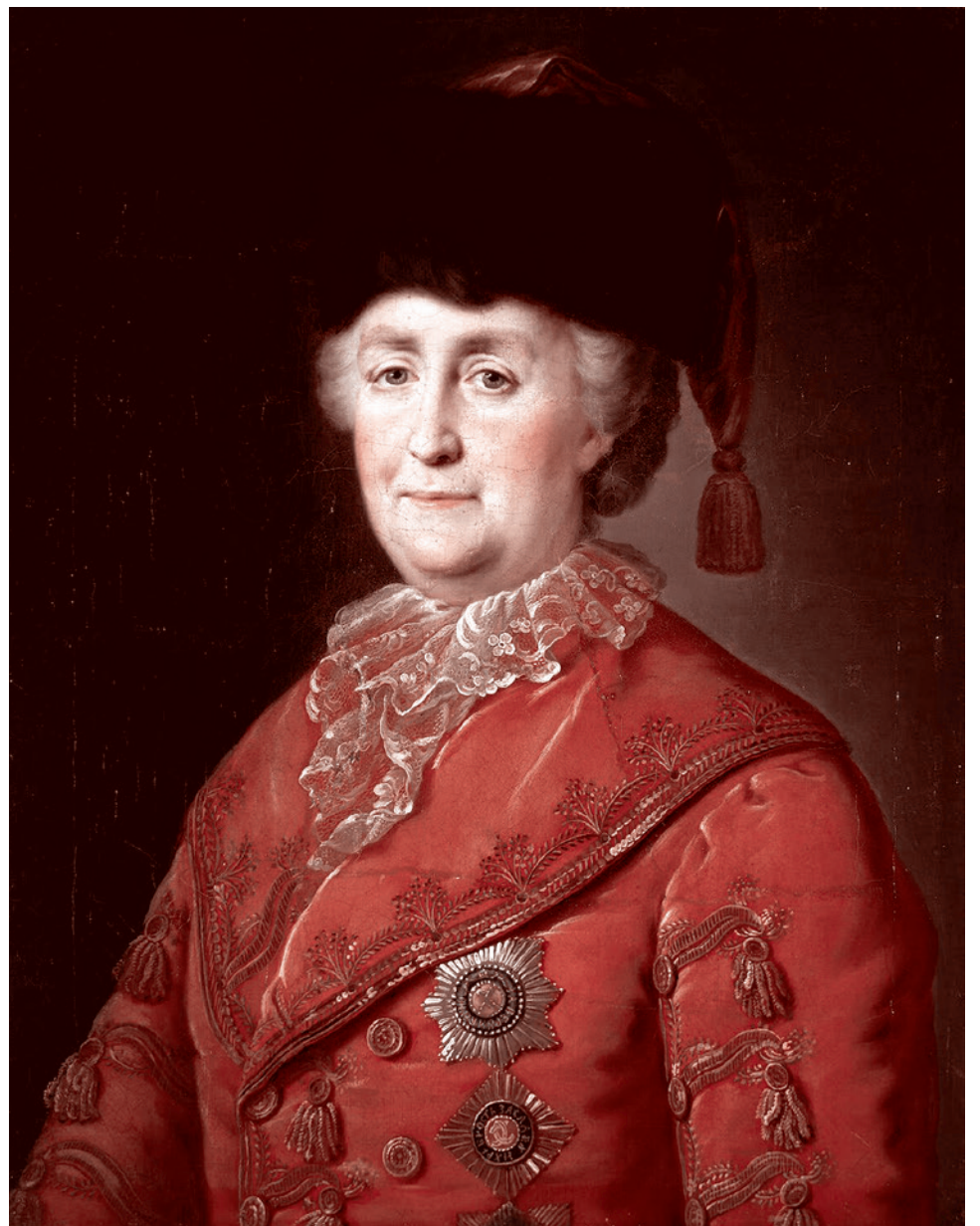
Михаил Шибанов. Екатерина Вторая в дорожном костюме. 1787

Так же и здесь. Пусть бы эти группы на равных выяснили отношения. Почему другую группу просто затыкают? Чем и кому опасна сейчас версия Ломоносова — Рыбакова? Почему она должна находиться на