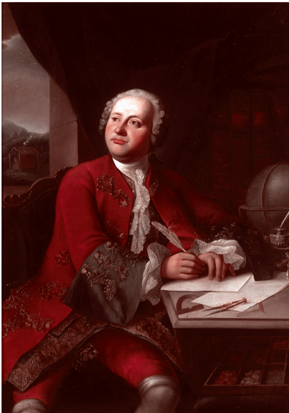
Неизвестный художник. Копия с оригинала Г.К.И. фон Преннера. Портрет Михаила Ломоносова. Середина XIX века

кая история тягостная... Что, собственно, во мне тебя не устраивает? Чем я тебя оскорбил? Ну скажи, должна же быть какая-то причина».