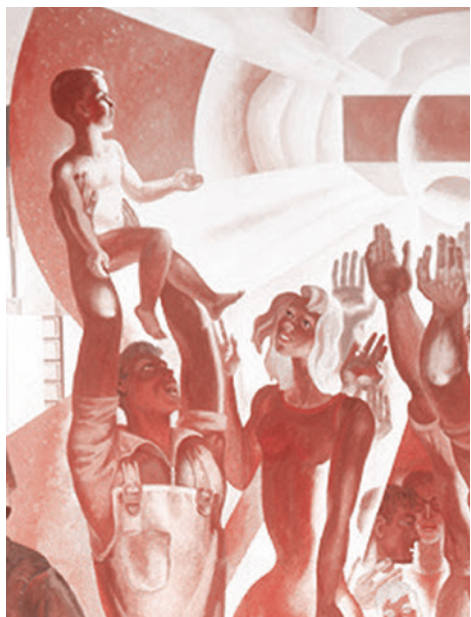
Юрий Королёв. Страна Советов. Роспись. Фрагмент

С праздником 7 Ноября! С праздником годовщины Великой — подлинно великой — Октябрьской социалистической революции!