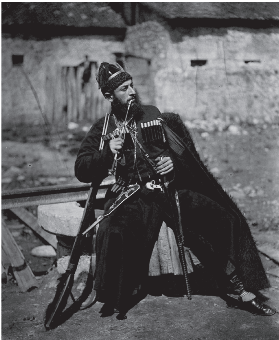
Жан Рауль. Мегрел (Альбом народных типов России). 1878

Второе. У нашей огромной территории должен быть держатель. Никакого другого