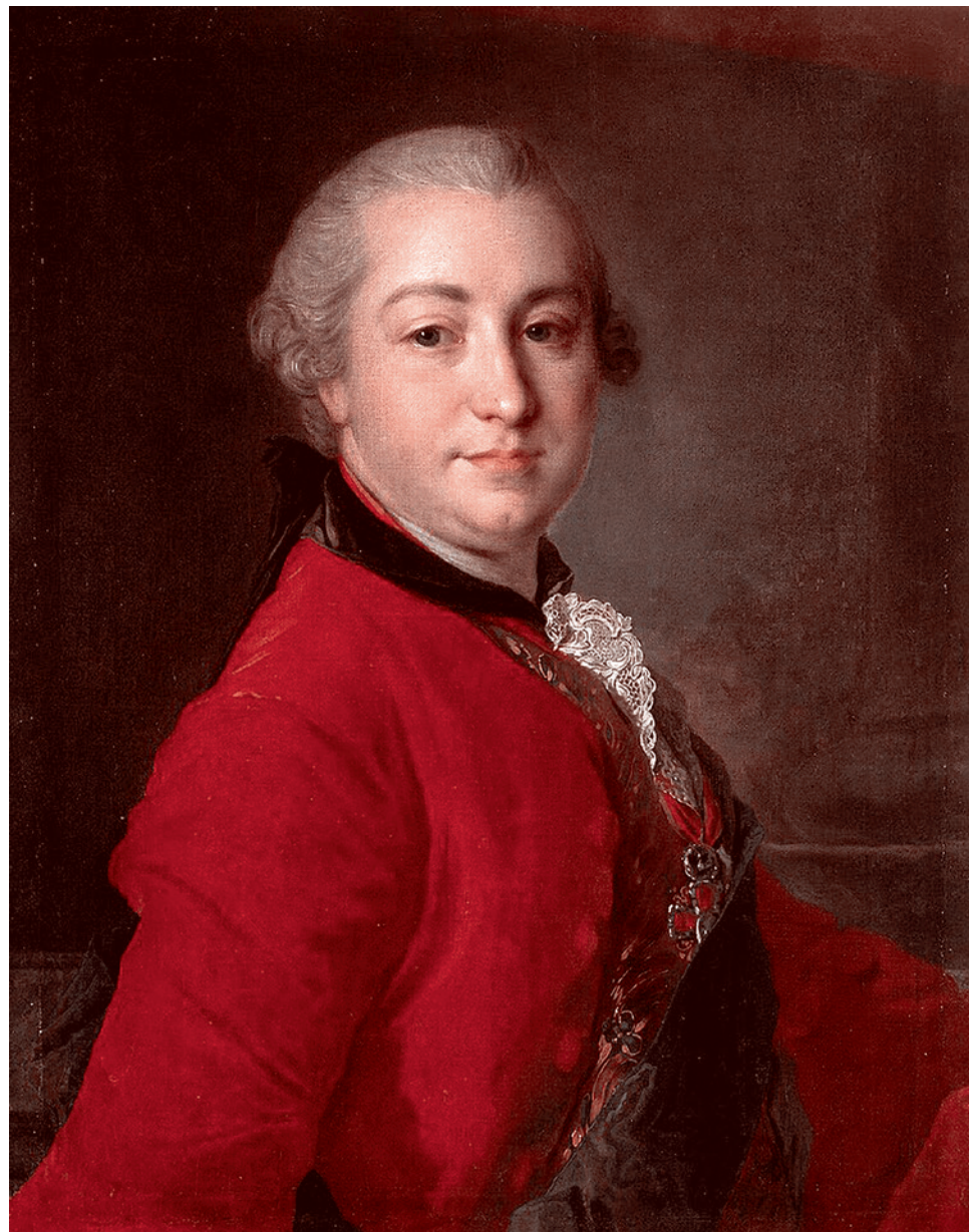
Фёдор Рокотов. Портрет Ивана Шувалова

Сергей Кургинян: А вот никто это не может объяснить, почему она доминирует. Так вот, борьба с нею шла всегда. Она вечна в каком-то смысле. Сколько есть Русь, столько идет борьба норманнской и антинорманнской теорий. Но норманнская теория победила при Екатерине и дальше, поскольку династия стала совсем уж немецкая, и это было ей выгодно. А при Елизавете очень большая группа (Шувалов, Разумовский, Воронцов — все эти люди, концентрировавшиеся в том числе вокруг Академии наук) считала своим долгом и необходимостью создать антинемецкую теорию.