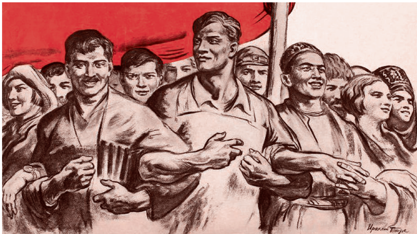
Ираклий Тондзе. Да здравствует дружба и братство народов СССР!