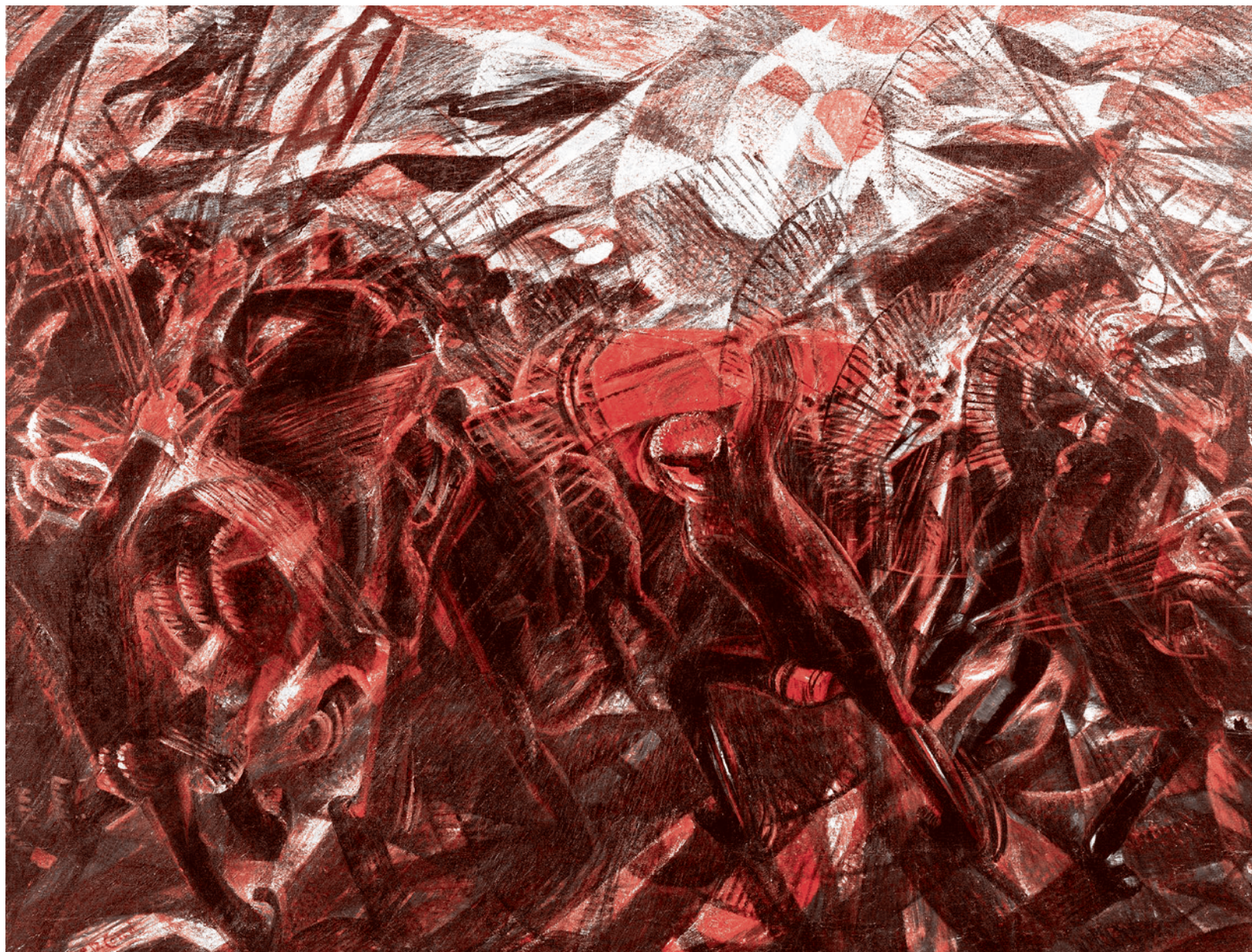
Карло Карпа. Похороны анархиста Галли. 1911