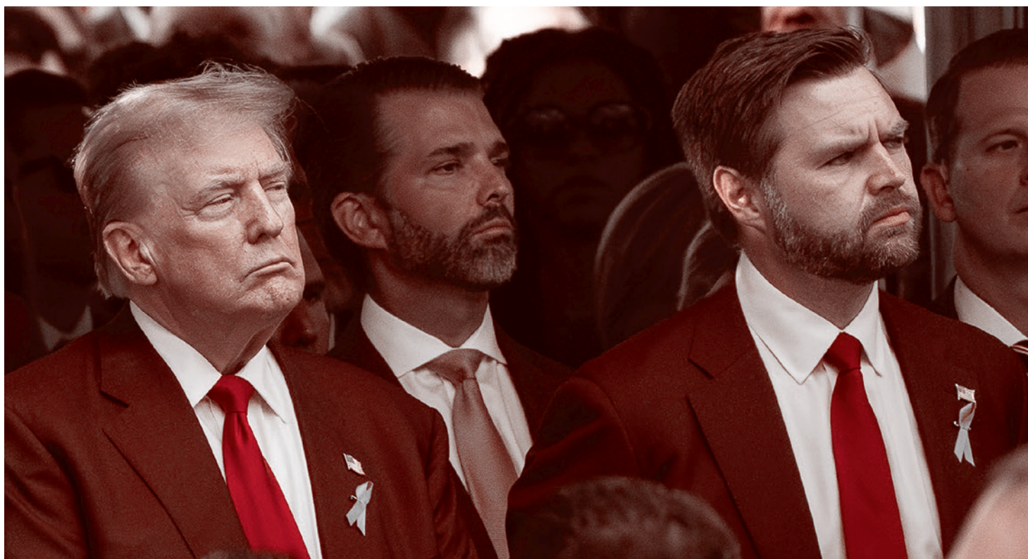
Дональд Трамп и Джеймс Д. Вэнс на церемонии, посвященной годовщине теракта 9/11 в Нью-Йорке. 2024