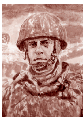
Лэй Чжу. Портрет

которые сейчас решают судьбу нашей страны, — захотелось дать какой-то срез современного общества. Кроме них есть и другие — я изобразила группу людей, среди них Зеленского, и ЛГБТ*-сообщество. И поставила их всех перед Богом. Мне захотелось, чтобы зритель тоже заглянул в эти лица и почувствовал разницу между хирургом, который держит пинцетом неразорвавшийся снаряд, и женщиной в татуировках, которая пьет свой кофе. Такой страшный у нас мир сейчас, с такими жуткими контрастами — собственно, та же идея, что и в «Атлантах». Но я пыталась максимально убрать литературу, чтобы были только портреты. Стоят они на фоне храма в селе Богородичном в Донбассе. Там было две церкви как символы России и Украины: один храм разбомбили мы, другой — они. Мне рассказывали, что монахини под обстрелами выносили оттуда иконы, они тоже здесь изображены — эти матушки.