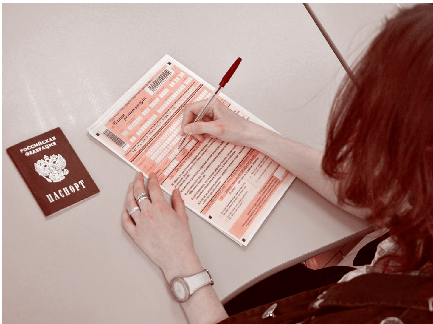
На сдаче ЕГЭ

«объеме», а не о «минимальном объеме» работы.