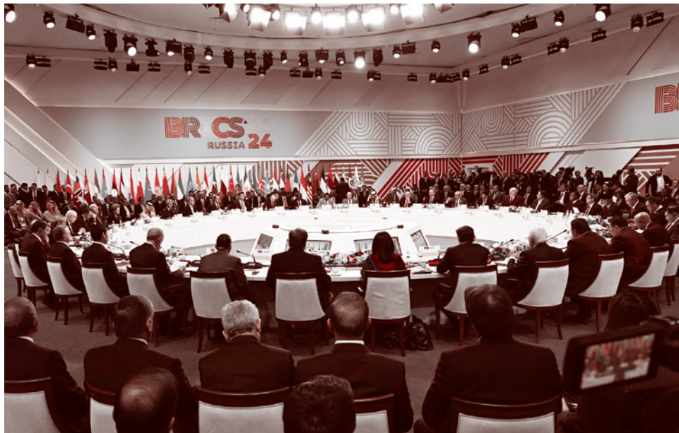
Саммит БРИКС. Казань. 2024

«Большинство фортификационных сооружений я видел лично и был в них. Если их нормально эксплуатировать, то это неприступные крепости. Это километры подземных коммуникаций, закрытых полностью либо плитами, либо бревнами. Там была установлена профессиональная система видеонаблюдения, чтобы бойцы видели, что происходит в нескольких сотнях метров», — рассказал депутат. В рамках подряда «Сизми» выкапывала ров для «КТК Сервис», а также продала ей часть троса, закупленного в большем количестве, чем требовалось по собственному контракту.