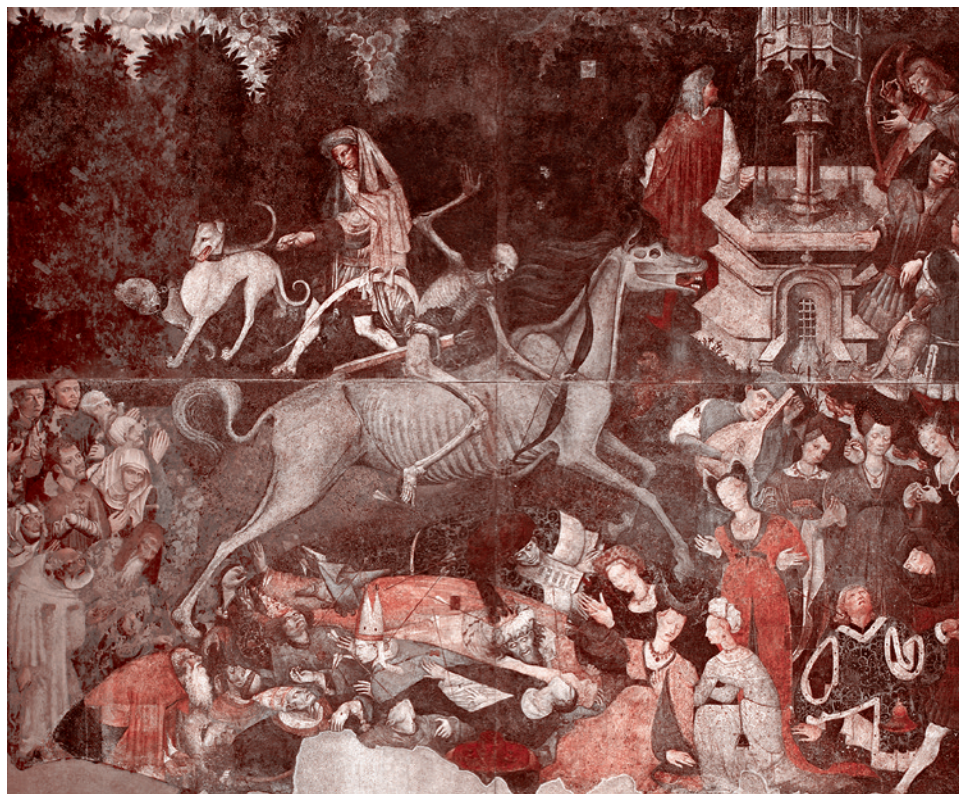
Неизвестный художник. Триумф смерти (фреска). XV век

Поэтому с момента каждого занятия нашей героической армией какого-нибудь села (нам еще предстоит взять Часов Яр — и это произойдет), сумасшествие будет наращаться. Это будет эскалация амбиций: «Нас не принимают в БРИКС и куда-то еще? Так мы такое устроим, что всем вашим мало не покажется».