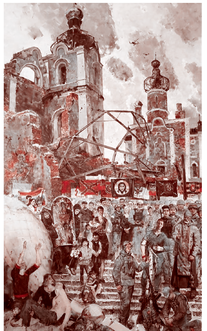
Ксения Чжу. Страшный суд