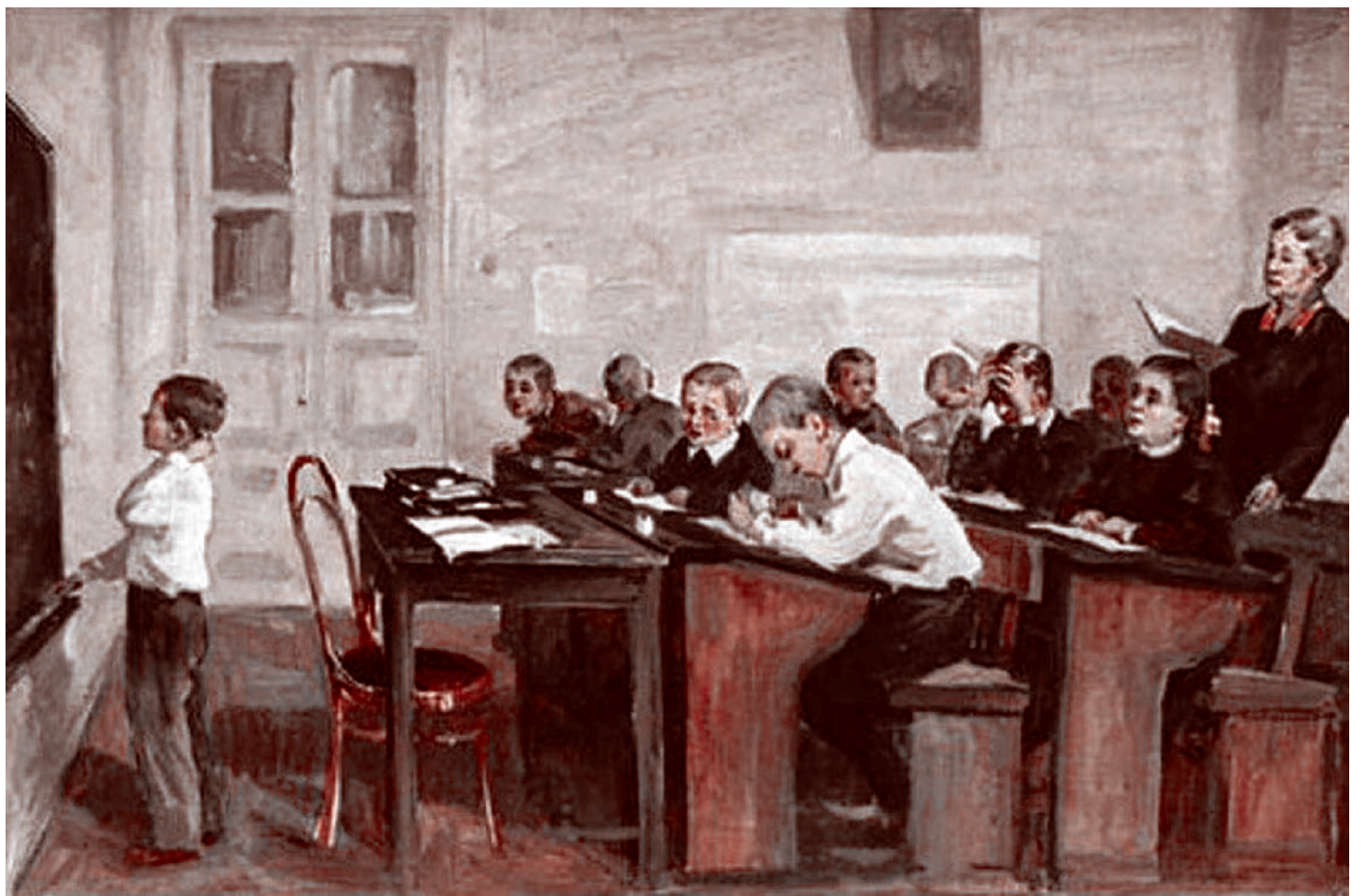
Иван Тихий. Экзамен. 1957

Прокомментируйте сформулированную проблему. Включите в комментарий два примера-иллюстрации из прочитанного текста, которые, по Вашему мнению,