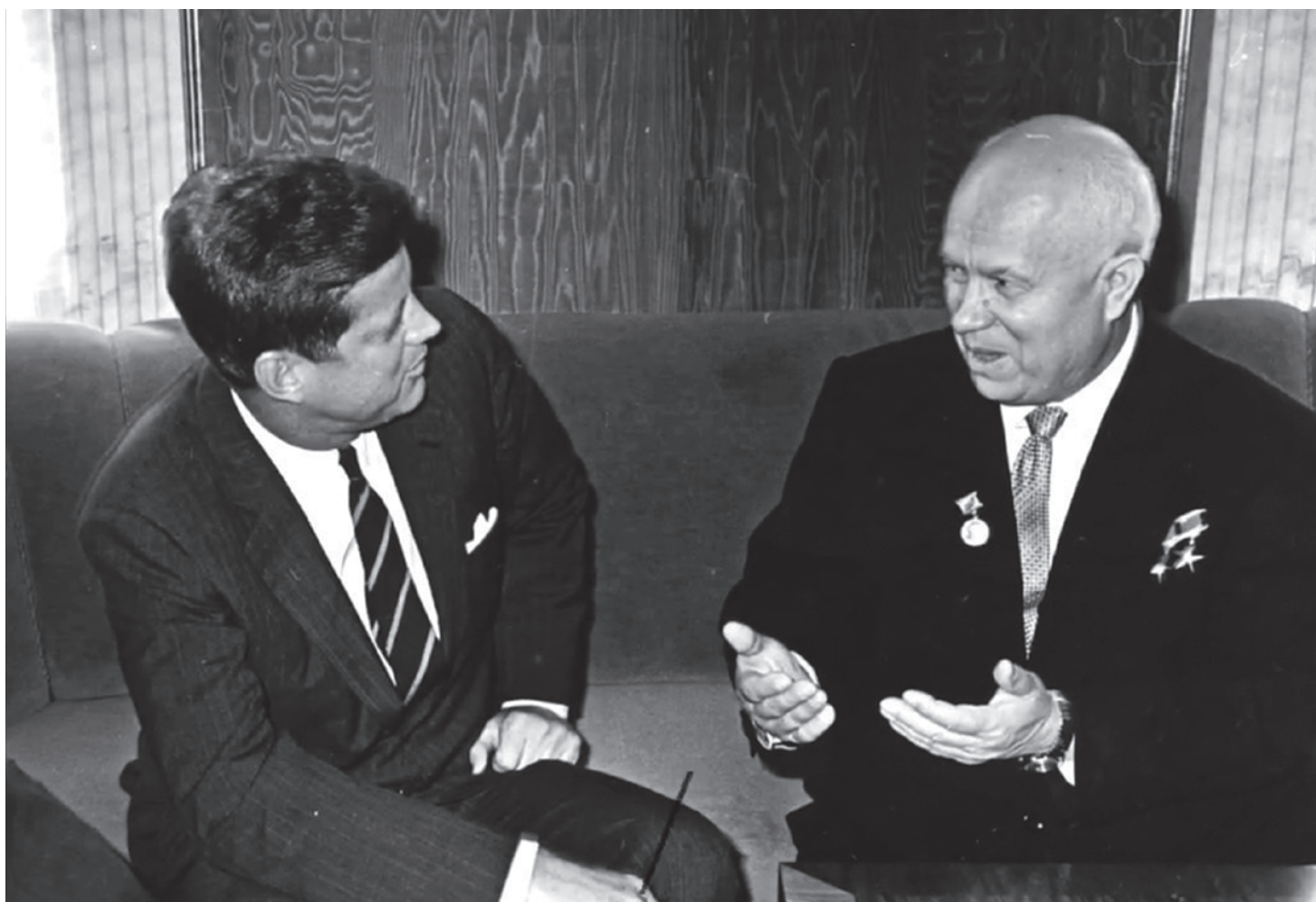
Джон Кеннеди и Никита Хрущёв

тельным образом, но на самом деле только гигантская гонка вооружений, которую Соединенные Штаты устроили, вступив в войну с Германией, смогла что-то сделать, и Рузвельт организовал эту гонку и нашел людей для производства атомного оружия. Это был человек во всем выдающийся, незаурядный.