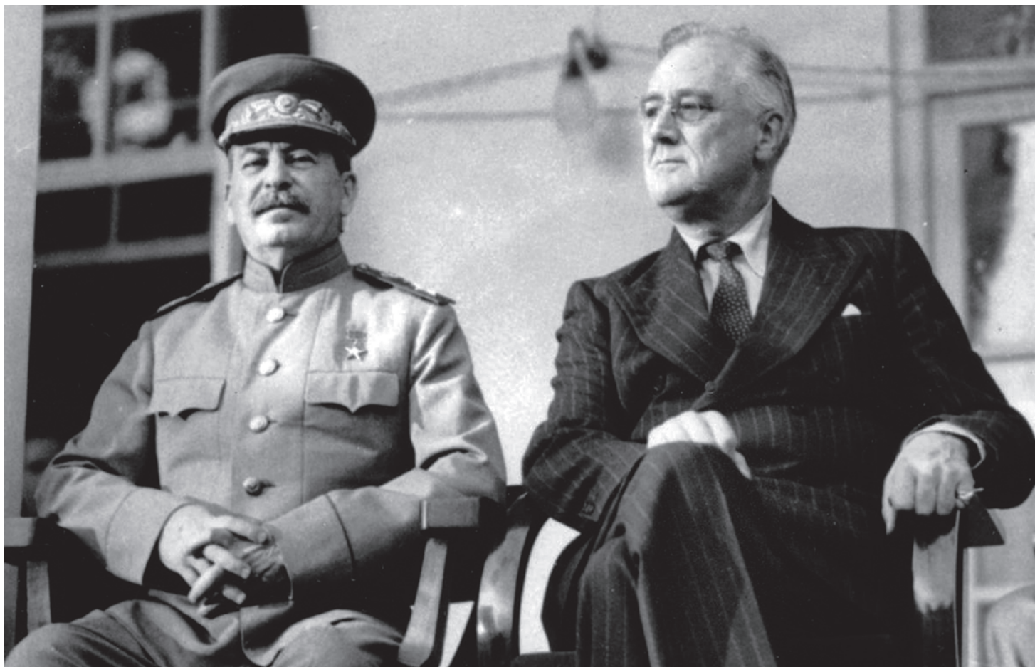
Иосиф Сталин и Франклин Делано Рузвельт на Тегеранской конференции