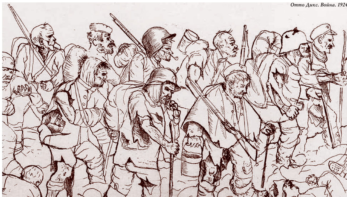
Отто Дикс. Война. 1924

Однако украинские аналитики и лидеры общественного мнения, являющиеся рупорами тех или иных элитных украинских групп, трезво отдают себе отчет в том, что