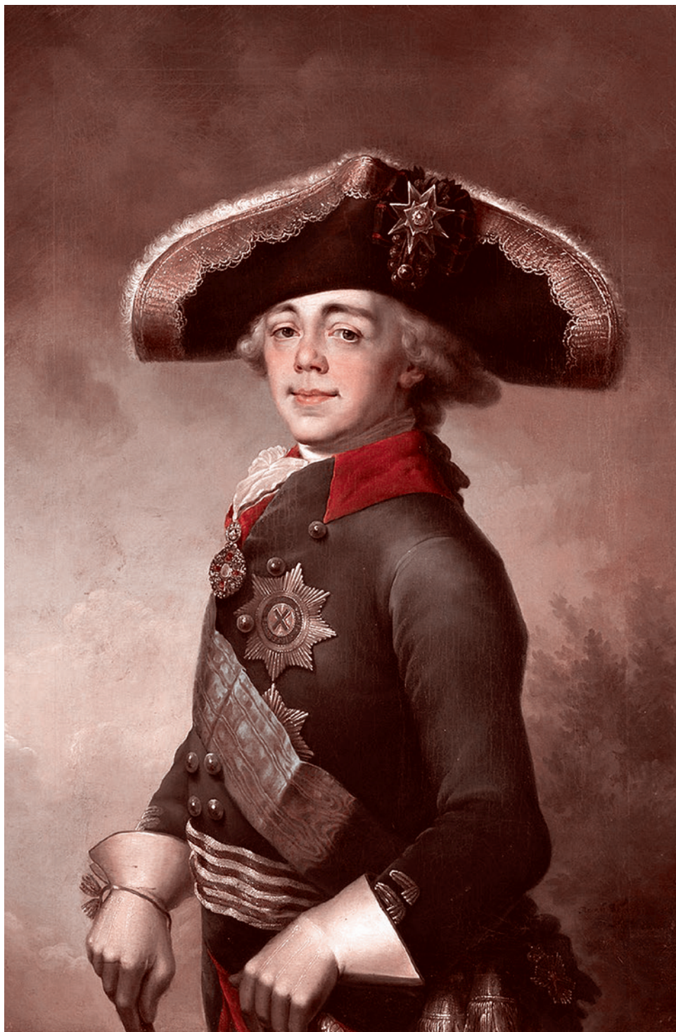
Владимир Боровиковский. Павел I. 1796

Рузвельт для меня человек огромного масштаба. Кеннеди на самом деле малоприятная личность в моральном и не только отношении. Абсолютизировать семейство Кеннеди: «Ах, Бобби-Бобби, Роберт Кеннеди, он из семейства Кеннеди, перешедший грань и убитый!» — конечно, мож-