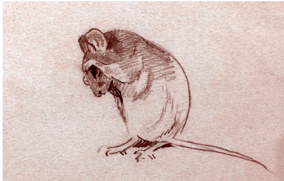
Арчибальд Торбёрн. Мышь