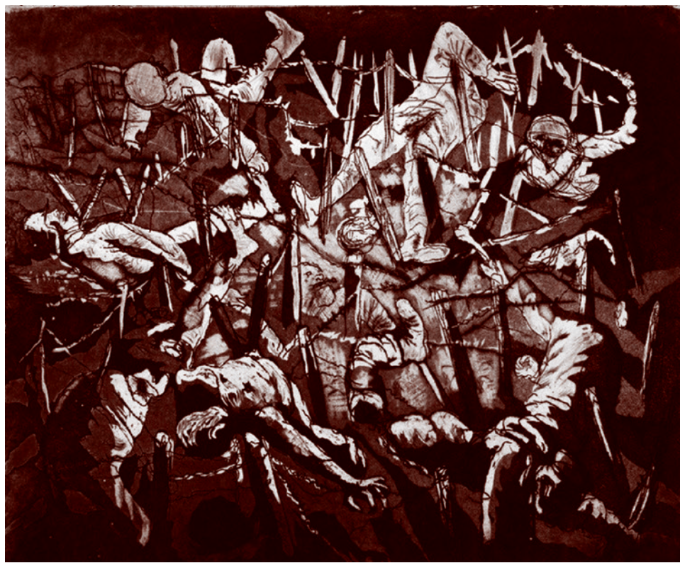
Отто Дикс. Танец смерти 1917. 1924

Разумеется, изъятие из экономики всего этого людского ресурса и отправка его