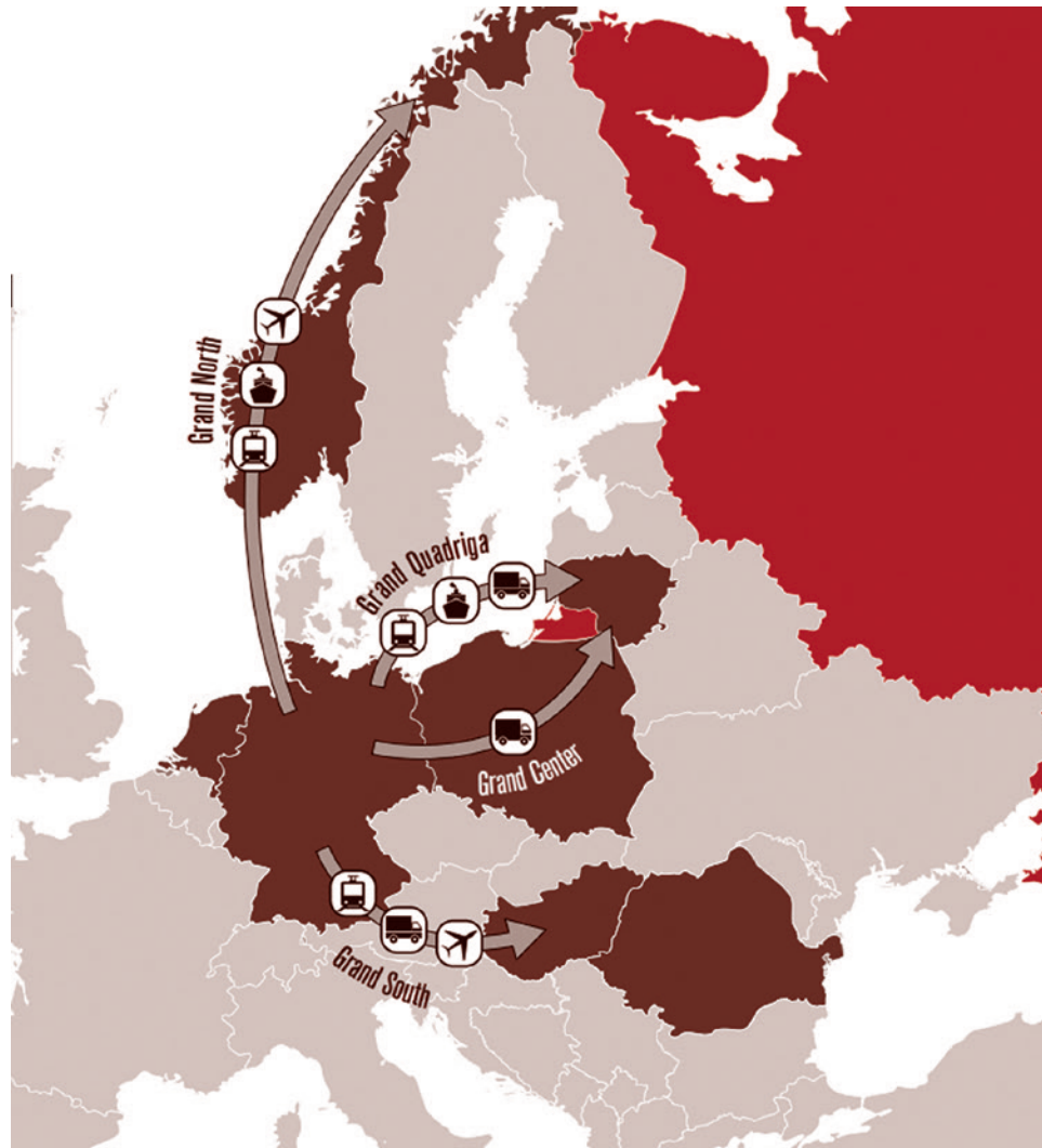
Маневры «Квадрига» в рамках учений НАТО Steadfast Defender 2024

Правда, есть нюанс. До сих пор США вполне эффективно реализуют стратегию в варианте «Америка дает оружие, ЕС за него платит, а умирают на поле боя украинцы». Пока у США есть возможность находить и использовать тех, кто готов умирать за интересы Вашингтона, проблема нехватки солдат далеко не так остра, как может показаться.