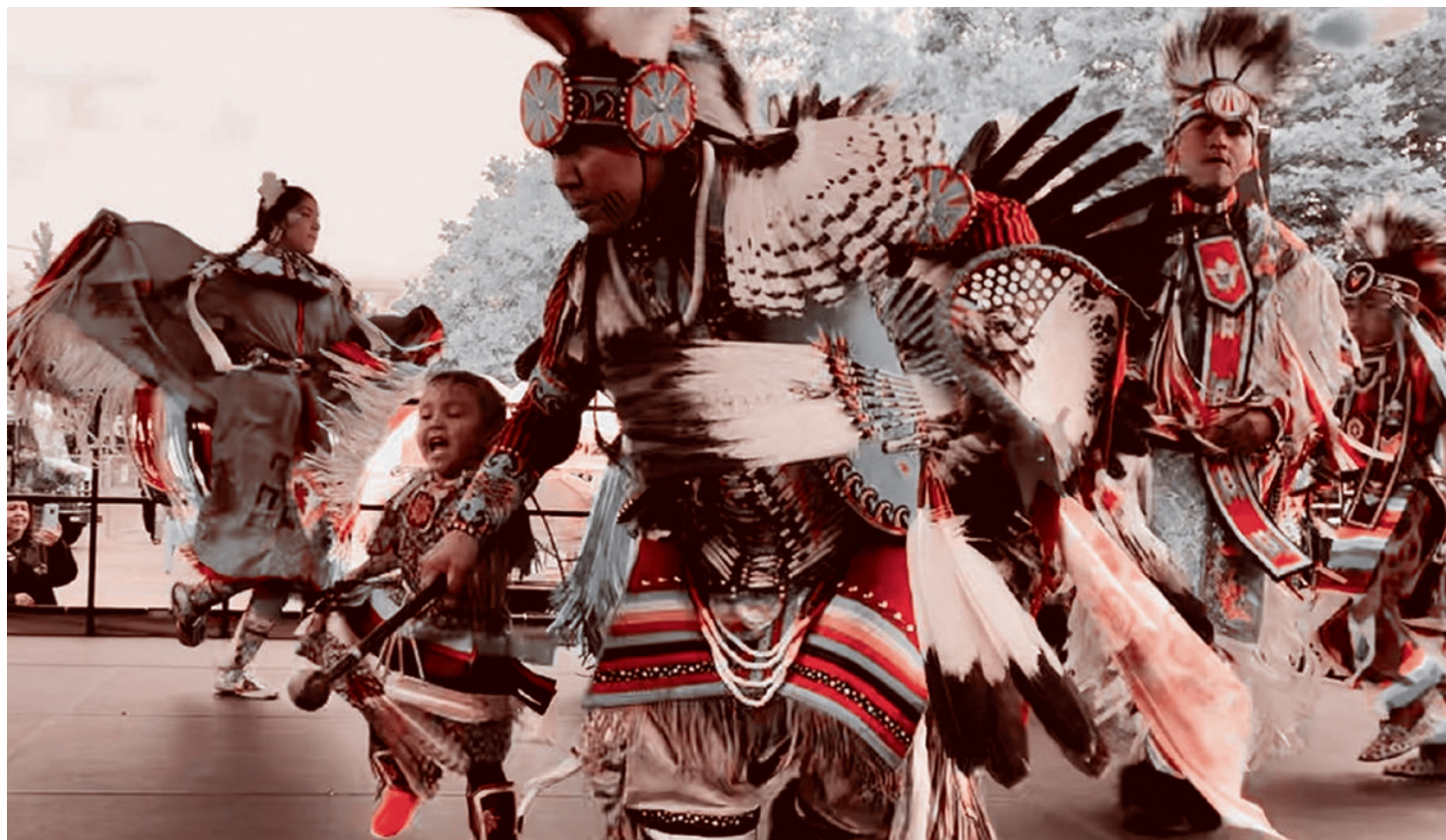
Танец Прибрежных Салишей. Ванкувер. 2000