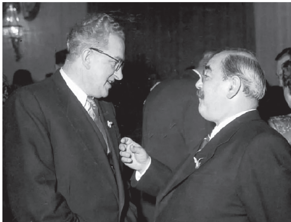
Советский посол в Будапеште Юрий Андропов (слева) с председателем Совета министров Венгерской Народной Республики Имре Надем на торжественном приеме. 1954

Поэтому я лично считаю, что понятие сложности, барьер сложности — это одна из осевых проблем России вообще. Нельзя упрощать, нельзя потакать упрощению. Нельзя пытаться всё происходящее перевести в «два притопа, три прихлопа» и сразу же после этого переходить на конспирологические построения, в которых, если начинаешь распутывать, ты точно понимаешь, что всё со всем и всеми связано. А это тупик. Нужно где-то остановиться и пытаться массированно, напряженно вклиниваться в мировую сложность, которая