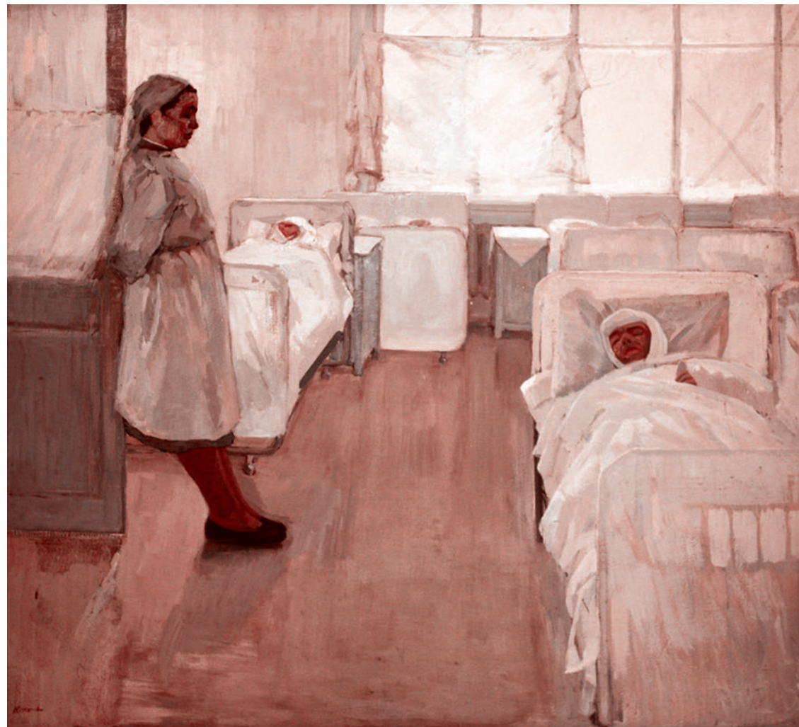
Виталий Кокачев. В госпитале. 1965

Цель системы ОМС — обеспечить доступную и бесплатную медицинскую помощь гарантированного объема и качества при рациональном использовании имеющихся ресурсов здравоохранения, как сказано в Федеральном законе от 29.11.2010 № 326-ФЗ (ред. от 25.12.2023) «Об обязательном медицинском страховании в Российской Федерации» (с изм. и доп., вступ. в силу с 01.01.2024), на первый взгляд, благая, — финансирование практического здравоохранения. В 2024 году бюджет ОМС превысил 4 триллиона рублей. Цифра большая, и кажется, что это очень много, однако в пересчете на отдельного российского гражданина получается сумма в 27 369 рублей, или $313,5 (по оценке Росстата, на 1 января 2024 года в России проживало 146 150 789 постоянных жителей, курс доллара ЦБ РФ на дату подготовки статьи 1.07.2024 г. составил 87,3 рубля). Для сравнения — в других странах на человека тратят в десятки раз больше: США — $9540; Швейцария — $9820; Норвегия — $7950; Швеция — $5600;