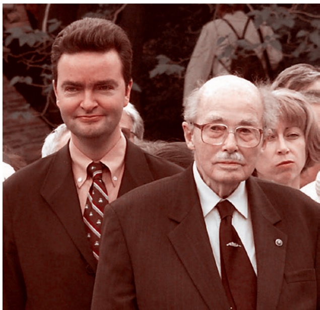
Эрцгерцог Георг и его отец Отто фон Габсбург. 2006

очевидный участник того кипения, которое происходит в мировой политике в связи с предстоящими выборами в Соединенных Штатах.