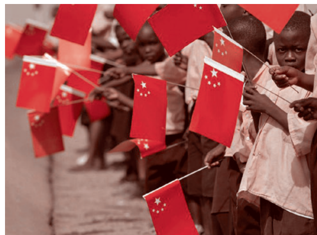
Африканские дети встречают китайскую делегацию

Представители КНР в связи с этим проектом «заваливали деньгами» Нигер