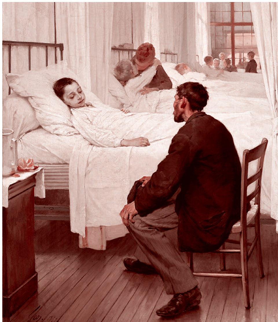
Генри Жюль Жан Жоффруа. День посещения в больнице. 1889

Симптом третий (3-й механизм отъема денег от здравоохранения). Прежде чем его описать, нам необходимо рассказать о тарифах на оплату деятельности медицинских учреждений, которые должны определяться «Методикой расчета тарифов на оплату медицинской помощи по обязательному медицинскому страхованию». Эта методика не содержит в себе конкретных положений и потому особенных критических замечаний не вызывает. Но что касается самих тарифов (например, на стоимость хирургических вмешательств), то логика их разработчиков не поддается человеческому пониманию, возможно, ее просто не было. Непонятно