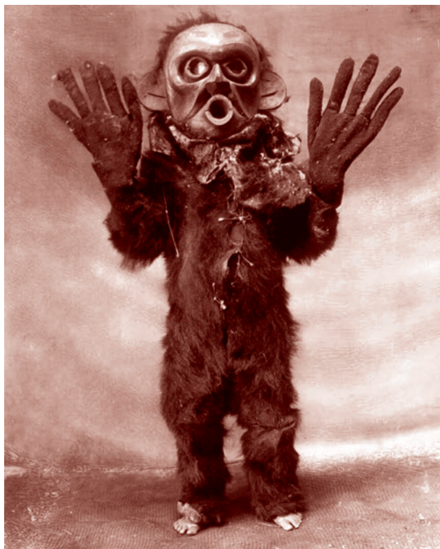
Индеец из племени коскимо, одетый в меховой костюме и маске Хами во время церемонии Нумлим. 1914

обряд неопит впервые приобретает способность к духовному танцу.