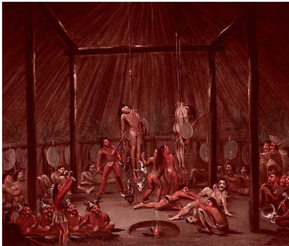
Джордж Кэтлин. Окина — инициация юношей у манданов. 1832

В большинстве случаев первый шаг инициации требует множественного воздействия. Неопита подбрасывают в воздух и тащат. Его колотят и обжигают. Его утомляют бегом, а затем бросают в ледяную воду, держат его голову под водой. На неопита воздействуют и через звуки, в том числе с помощью множества (до 50) барабанов, на которых выстукивается быстрый ритм в диапазоне тета-волн на электроэнцефалограмме (4–8 ударов в секунду). И последнее воздействие по порядку, но отнюдь не по значению — это сам факт того, что над неопитом работает не только сам шаман, но множество его соплеменников. И он знает, что их объединяет одна цель — помочь ему обрести духа-хранителя и получить силу от него. В ходе этого