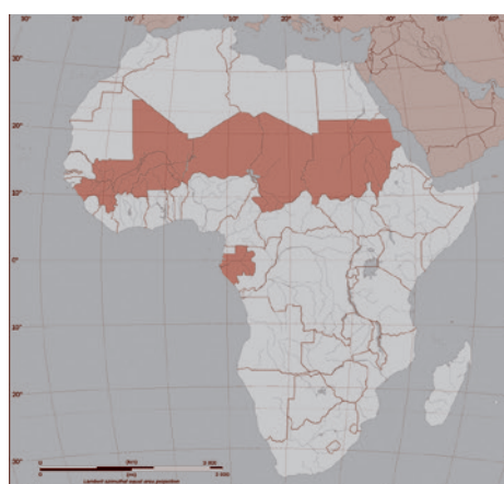
«Пояс переворотов» в Африке — страны континента, в которых совершены перевороты с 2020 по 2023 гг. (Гвинея, Мали, Буркина-Фасо, Нигер, Чад, Судан, Габон)

На сотрудничество с Россией и Китаем переориентировалась традиционно входившая в сферу французских интересов Центрально-Африканская Республика. В охваченном гражданской войной Судане военные Абделя Фаттаха аль-Бурхана и мятежники Мохамеда Хамдана Дагло,