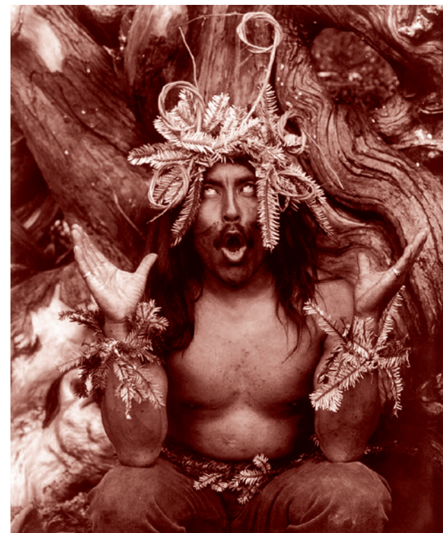
Шаман квакиутлей проводит религиозный ритуал. 1914

В качестве поясняющего примера из западной культуры можно обратить вни-