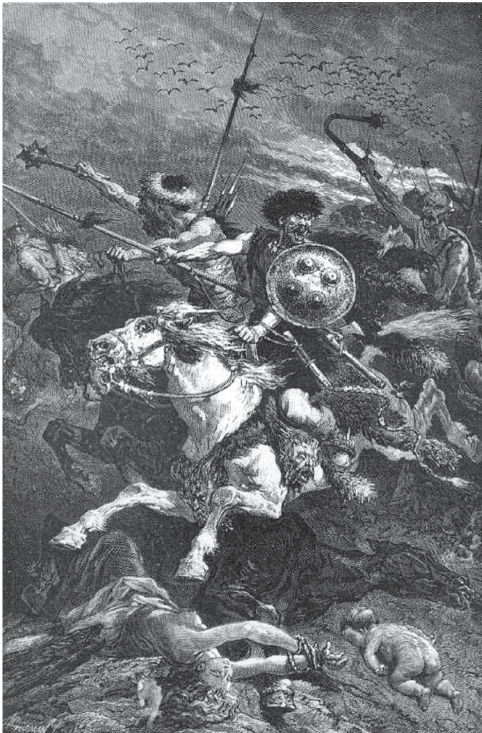
Альфонс де Невиль. Гунны. между 1872–1875

му с ней сейчас связанному... Называть эту позицию, как любят на Западе, да и у нас, «друг Путина» — как-то странно и глубоко неверно.