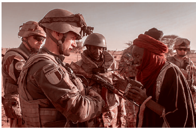
Французские военные в Мали

первый взгляд является «бегством» или «провалом». На самом деле действия США в Африке в течение нескольких лет имеют далеко идущие последствия для всего мира — прежде всего для основных геополитических конкурентов Америки.