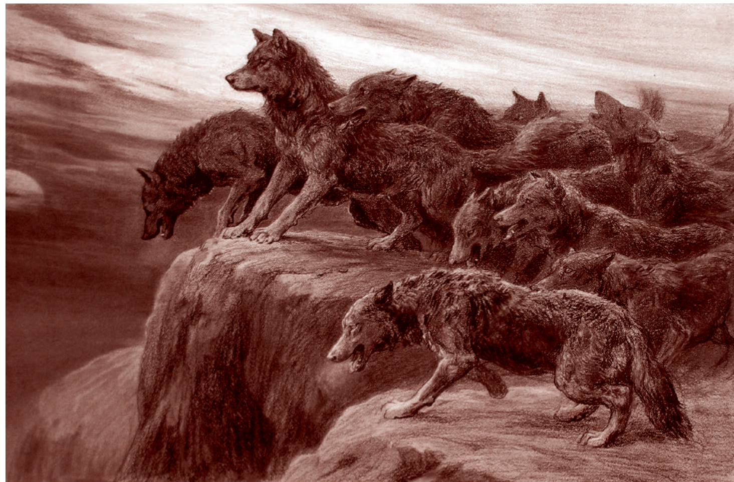
Герберт Томас Дикси. Стая волков, воющих на луну. 1908