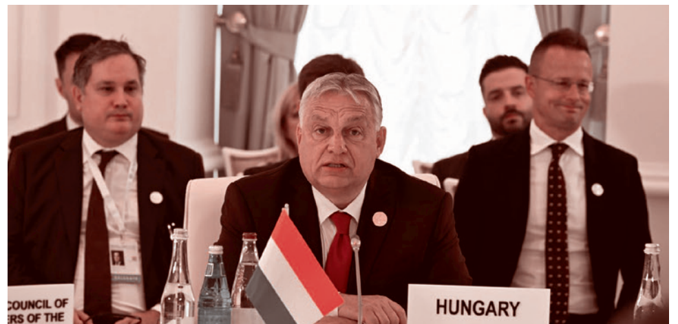
Премьер-министр Венгрии Виктор Орбан на саммите глав государств Организации тюркских государств в Шуше

И тогда возникает следующий вопрос: а что, собственно говоря, так для Орбана лакомо в Ватикане? Мы ведь не только вынуждены вести в рассмотрение такие факторы, как Москва, Украина, Шуша (то есть Турция), мы же еще должны Ватикан и Китай ввести в систему уравнений.