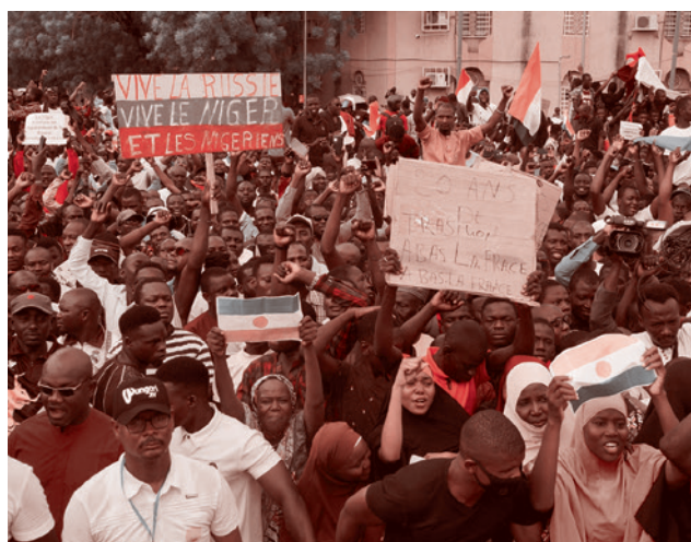
Митинг в поддержку военных в Нигере, 2023