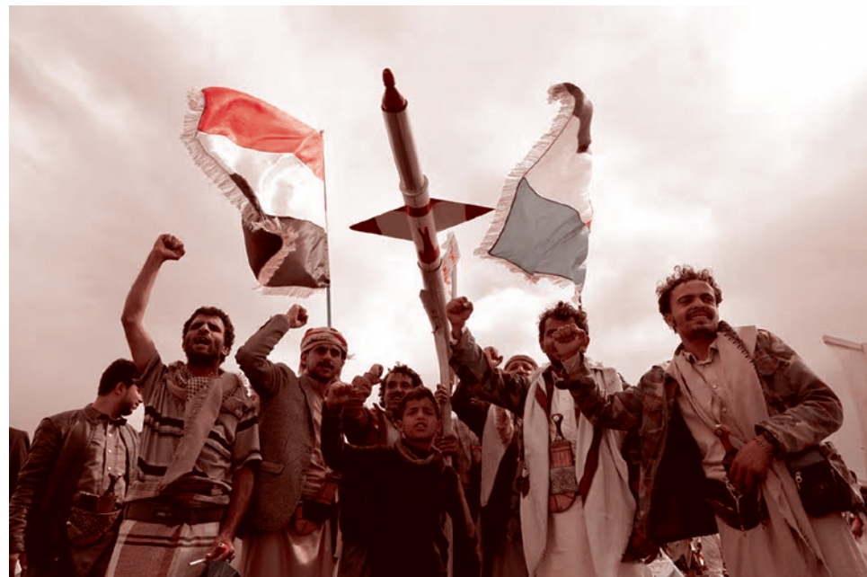
Митинг хуситов в Санае, 8 марта 2024 года

Информацию об ударе по Pimba США не комментировали. А вот в ЦАХАЛ отчитались, что утром 21 июля система ПРО успешно перехватила около Эйлата