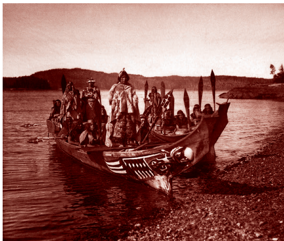
Индейцы квакиутль в каноэ. 1914