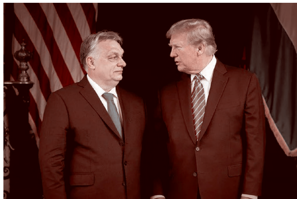
Виктор Орбан и Дональд Трамп

Совершенно очевидно, что Орбан совершил мировое турне не личному почину, а по поручению старых европейских элит — тех же Габсбургов, веками мечтавших объединить Европу под своим владычеством и принимавших самое активное участие в создании Евросоюза. А поскольку текущая политика США стремительно уничтожает ЕС и в экономическом, и в политическом плане, то европейские элиты стали искать выход. Отсюда ставка на Трампа, который, скорее всего, оставит Европу в покое, и Китай — как на противовес и замену американским инвестициям. Плюс дешевые российские энергоресурсы, на которых и поднялась в прежнее время европейская промышленность.