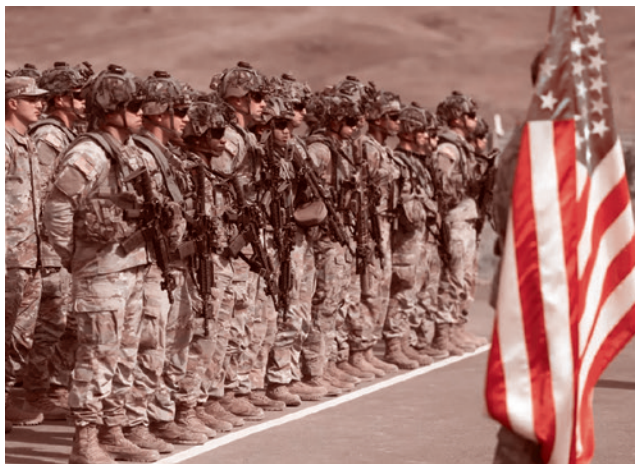
Церемония открытия армяно-американских учений Eagle Partner 2023

в Ереване сенатор объявил Армению чуть ли не главным партнером США в регионе, а также призвал Азербайджан быть осторожным в отношениях с «большим русским медведем». Другими словами, пересмотреть свои приоритеты.