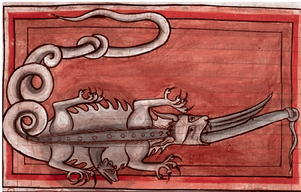
Средневековое изображение крокодила. Британская библиотека. Около XIII века

Сергей Кургинян: Да, об этом. Мы принимаем все мирные предложения с вежливой, усталой улыбкой, с огромной приветливостью. Садитесь, пожалуйста, да, очень интересно, мы всячески за, а как же другая