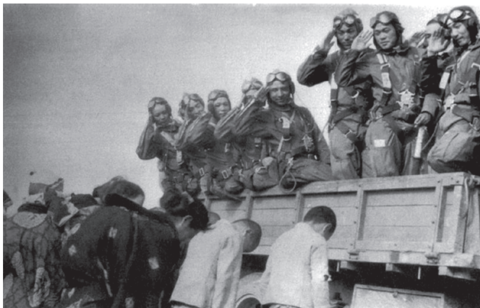
Японские женщины и подростки провожают армейских летчиков камикадзе

И, наоборот, при вытравливании из народного духа такой готовности к самопожертвованию можно попытаться «сломать ему хребет», повредить или уничтожить внутреннюю готовность к сопротивлению, отстаиванию суверенного бытия. Одним из хрестоматийных примеров подобного сло-