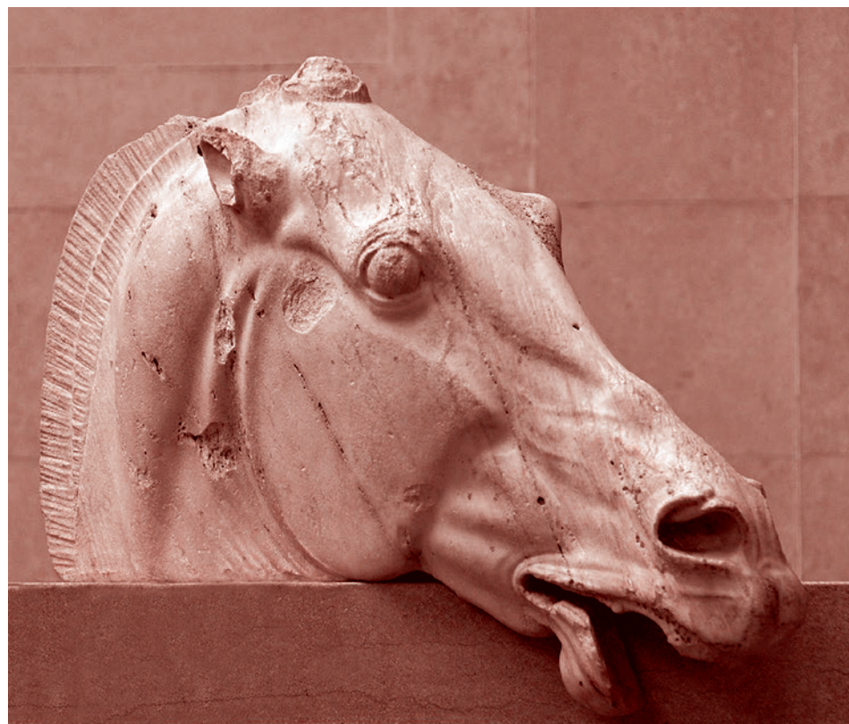
Голова лошади из колесницы Селены

«Если мы сегодня возьмем лист бумаги, напишем что-нибудь и не подпишем определенным образом, если там