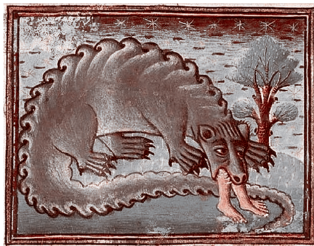
Бестиарий. Крокодил. Около 1450 года

Сергей Кургинян: Да, я ценю его. Я в Опеле приехал, когда его там уже не было, он уехал, как только социалистическая Польша перестала быть социалистической. Уехал, по-моему, на север Италии, в ваку-