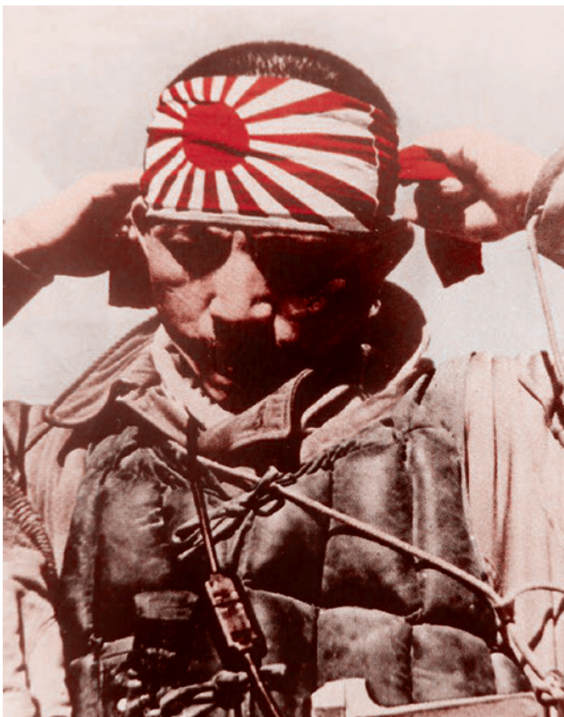
Японский летчик надевает повязку перед боевым вылетом. 1942

Синтоизм, таким образом, на практике представлял собой форму высшей легитимации императорской власти на землях Японии в глазах населения.