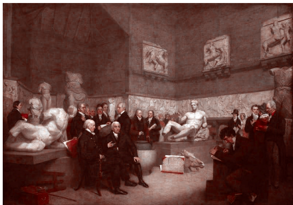
Портрет, изображающий мрамор Элгина во временной комнате Элгина