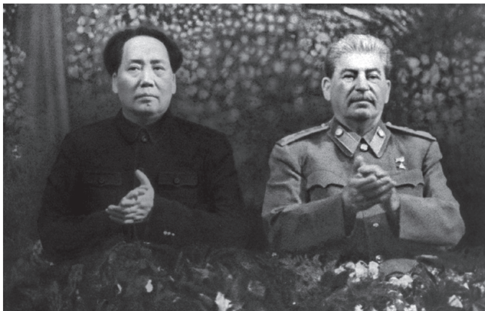
Иосиф Сталин и Мао Цзэдун. 1949

Конечно, если представить себе мир, где все сидят и говорят «мы уважаем интересы друг друга, национальные культуры, их самобытность, пути развития», — при такой картине можно расплакаться от счастья. Но я думаю, что все понимающе, что такой картины не будет, что в сущности многополярный мир, неизбежный в силу ослабления Соединенных Штатов и странной политики, которую эта стра-