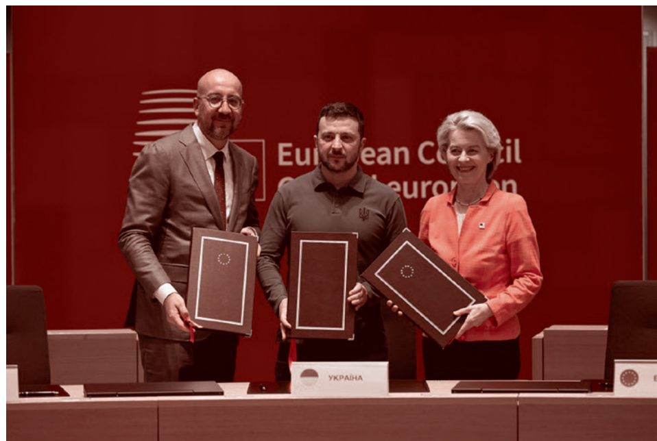
Председатель Евросовета Шарль Мишель, глава Еврокомиссии Урсула фон дер Ляйен и президент Украины Владимир Зеленский

Как указывал глава дипломатии ЕС Жозеп Боррель, соглашение в том числе