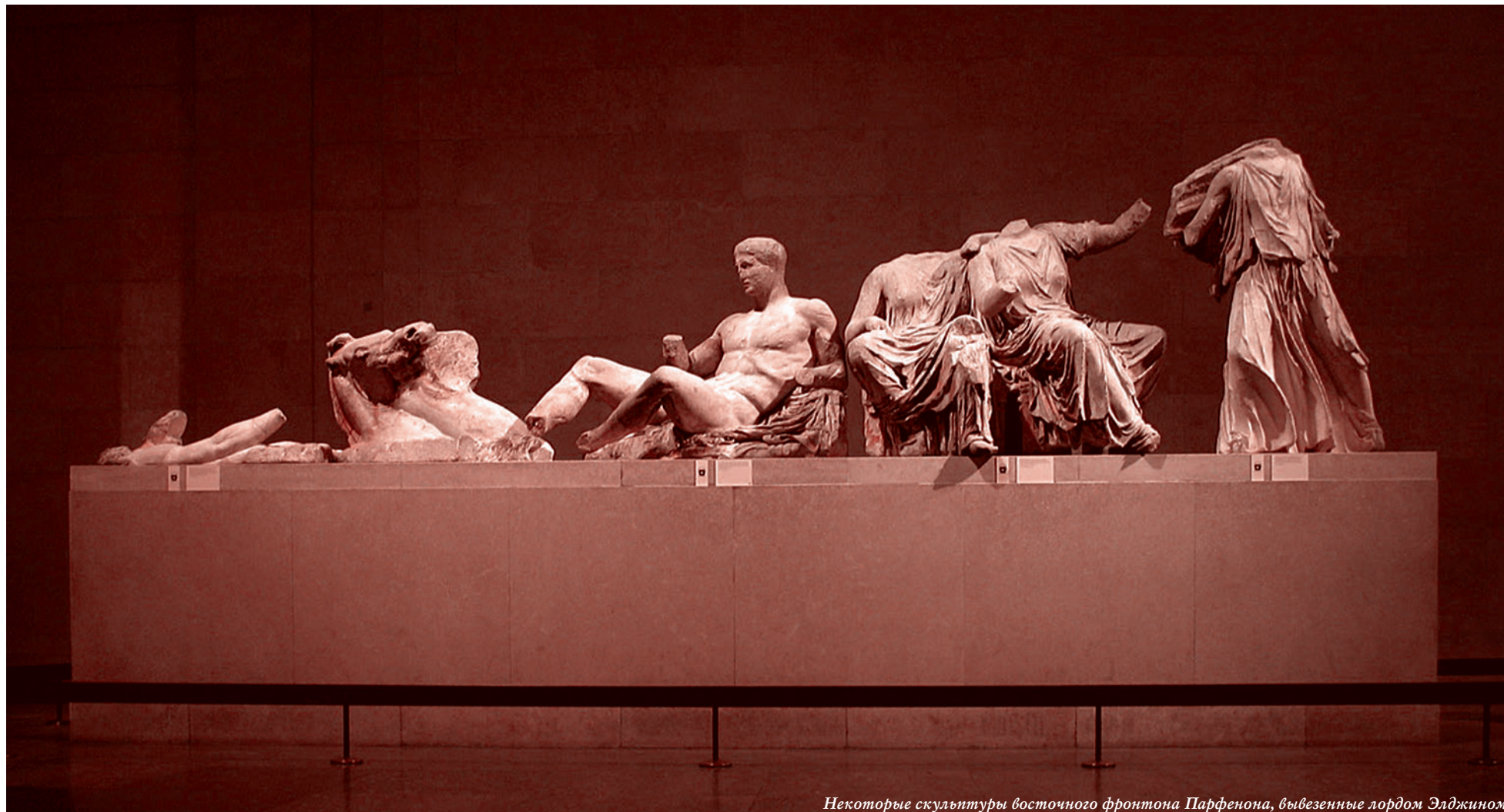
Некоторые скульптуры восточного фронтона Парфенона, вывезенные лордом Элджином

На 24-м заседании межправительственного комитета ЮНЕСКО по возвращению культурных ценностей представитель Турции Зейнеп Боз заявила, что Турции не известно каких-либо документов Османской империи, которые подтверждают права Британии на вывезенные из Акрополя в 1801–1812 годах лордом Элджином мраморы Парфенона, выставляемые ныне Британским музеем и известные как «мраморы Элгина». Выступление представителя правопреемника Османской империи фактически разбило главный довод Британии, согласно которому она обладает мраморами на основании официального разрешения. Особую остроту выступлению придало то, что на заседании комитета — впервые — присутствовал представитель Британии.