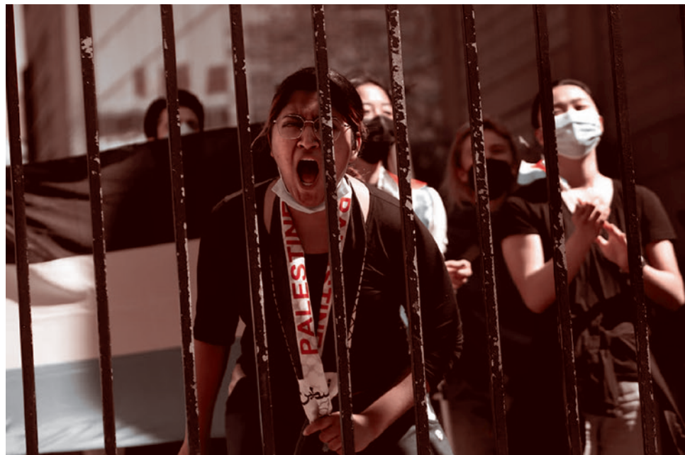
Студенческие протесты в США в поддержку сектора Газа весной 2024

Вместе с этим газета приводит слова полковника морской пехоты США в отставке Гранта Ньюшема, который указал на