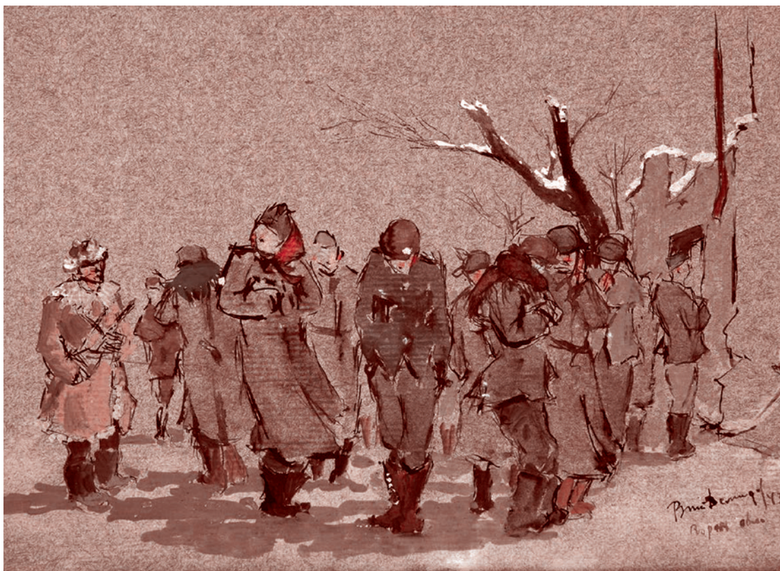
Виталий Демидов. Пленные. 1943

Газета «Суть времени» зарегистрирована Федеральной службой по надзору в сфере связи, информационных технологий и массовых коммуникаций (Роскомнадзор) Свидетельство ПИ № ФС77-50554 от 9 июля 2012 года