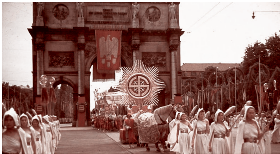
Фестиваль немецкого искусства в Мюнхене. 1939

Уже в Польше вермахт начал широко применять способ ведения «тотальной» войны нового типа, включающий прочесывание из пулеметов и осыпание бомбами колонн беженцев, беспощадные бомбежки городов и проведение массовых казней военнопленных и гражданских лиц. Солдаты описывали всё это в своих письмах, не выражая ни малейшего сомнения в том, что все средства хороши для быстрого и полного уничтожения сил противника. Они писали о ходивших в армейской среде слухах о «снайперах», «партизанах», «бандитах» и прочих гражданских из числа «нерегулярных» отрядов, которые якобы действовали в тылу у немцев, не приводя при этом никаких конкретных подробностей.