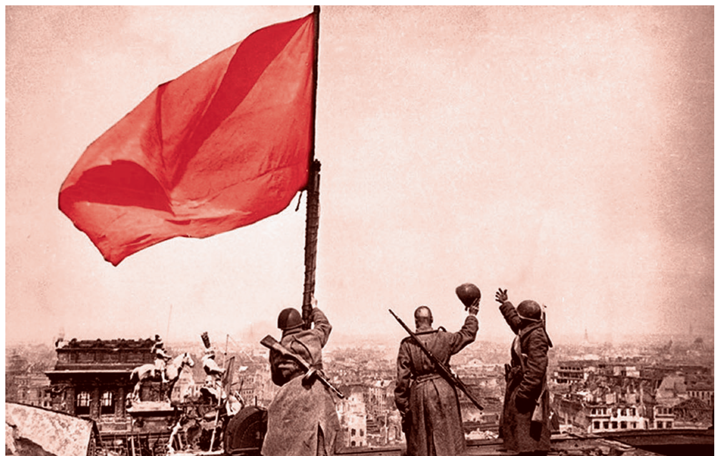
Красное знамя установленное на крыше Рейхстага, на фронтоне главного входа в здание. 2 мая 1945