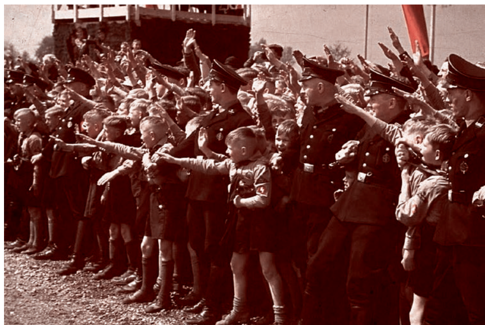
Хуго Йегер. Дети встречают Гитлера. 1930-е

Уже через неделю после вторжения в Польшу берлинский ежедневник Deutsche Allgemeine Zeitung опубликовал посвященную международным законам войны статью, в которой утверждал, что Германия имеет полное право «прибегать к жестким, но действительным мерам», оставаясь при этом в признанных рамках международного права. В эти меры, по мнению еженедельника, вполне укладывалось применение подразделений вермахта жесточайших карательных акций против гражданского населения в ответ на несколько выстрелов со стороны польских солдат, сделанных в попытках держать оборону на каком-нибудь хуторе или в деревушке. Германские солдаты простодушно рассказывали об этом в своих письмах, оправдывая действия германских солдат «звериним поведением противника». Они искренне считали: «Что бы ни творили немцы в действительности, поляки бы точно превзошли их в этом». Цензура не находила ничего предосудительного в этих письмах.