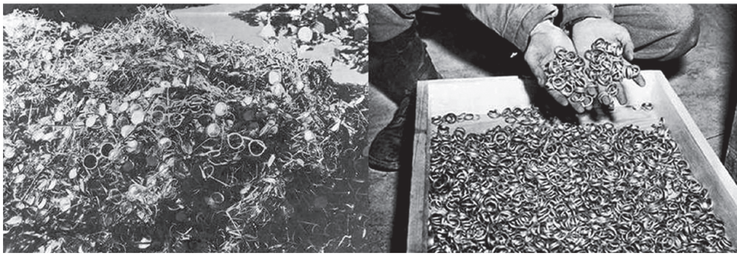
Очки и золотые кольца, принадлежавшие убитым узникам концлагеря Освенцим. 1945

Вплоть до последних лет войны, когда перед многими отчетливо встала неизбежность поражения Германии, картины геноцида евреев и русских отражались в письмах бесстрашно, безоценочно, и только к концу войны немцы начинают осознавать весь ужас войны не только с точки зрения собственных страданий. Можно как типичную привести цитату из письма германского офицера, ветерана Первой мировой войны, посланного жене в марте 1945 года: «Человечество, которое ведет такую войну, сделалось безбожным. Русское варварство на востоке Германии, кошмарные налеты британцев и американцев, наша борьба с евреями (стерилизация здоровых женщин, расстрелы всех от детей до старух, отравление газом евреев целыми вагонами!)» В этом письме нацист на одну доску ставит мифическое варварство советских солдат, авианалеты союзников и геноцид еврейского народа. Немцы к концу войны начинают осознавать преступный характер их отношений к евреям,