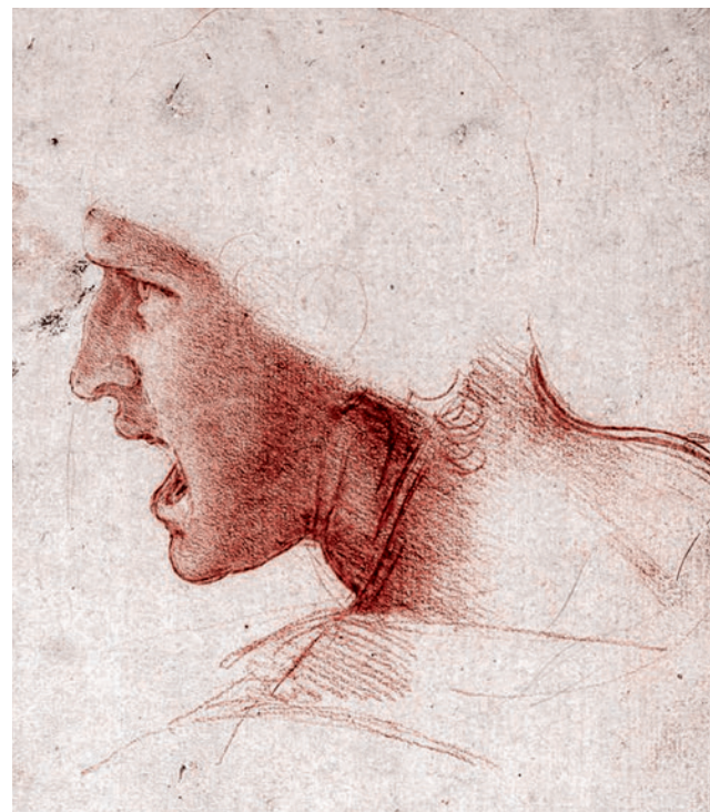
Леонардо да Винчи. Профиль кричащего человека. Около 1504

У меня есть знакомые, чьи родственники работали с Луначарским. И эти родственники рассказывали, что Луначарский, выступая перед деятелями культуры — кинематографистами, художниками, — гово-