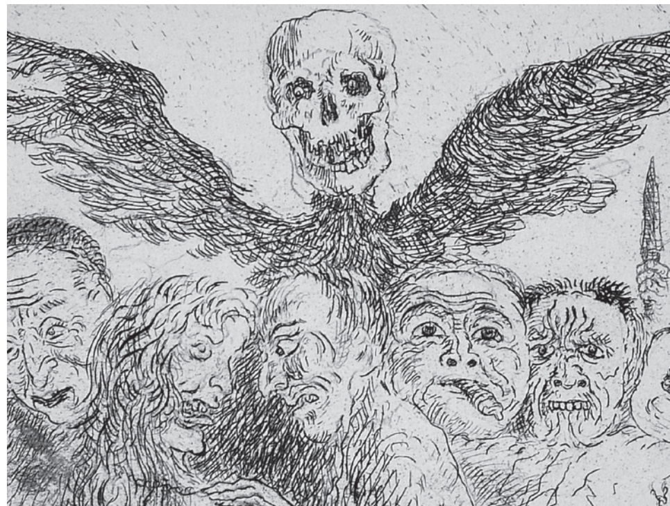
Джеймс Энсор. Смертные грехи (фрагмент). 1904

Это и многое другое говорит мне о том, что в основе идеи нового мира лежит плата сроком жизни. Чем дальше будет развиваться наука в условиях этого мегатренда, тем более враждебной человечеству силой она будет становиться. И тем быстрее будет происходить расслоение на элиту, которая живет абсолютно по-другому и считает себя новым рабовладельческим слоем, представляющим собой единственно полноценное человечество, и на все эти массы, которые будут низведены до уровня хиликов, или скотов. Эти массы можно будет уничтожать сколько угодно, ими можно будет беспределно управлять.