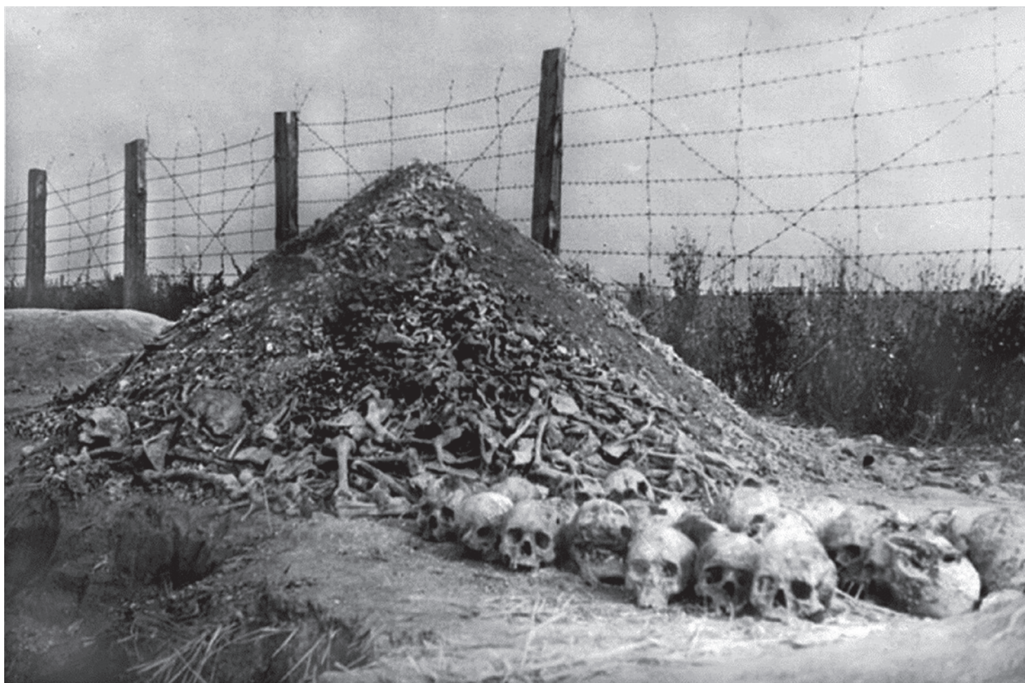
Человеческие останки в нацистском лагере смерти Майданек. 1945

Самая кровавая операция, организованная айнзатцкомандами, была проведена 29–30 сентября 1941 года недалеко от Киева. В эти два страшных дня в овраге Бабий Яр усиленные двумя полицейскими батальонами фанатики из зондеркоманды «4а» айнзатцкоманды «С», которой руководил штандартенфюрер СС Пауль Блобель, расстреляли более 33 тысяч евреев.