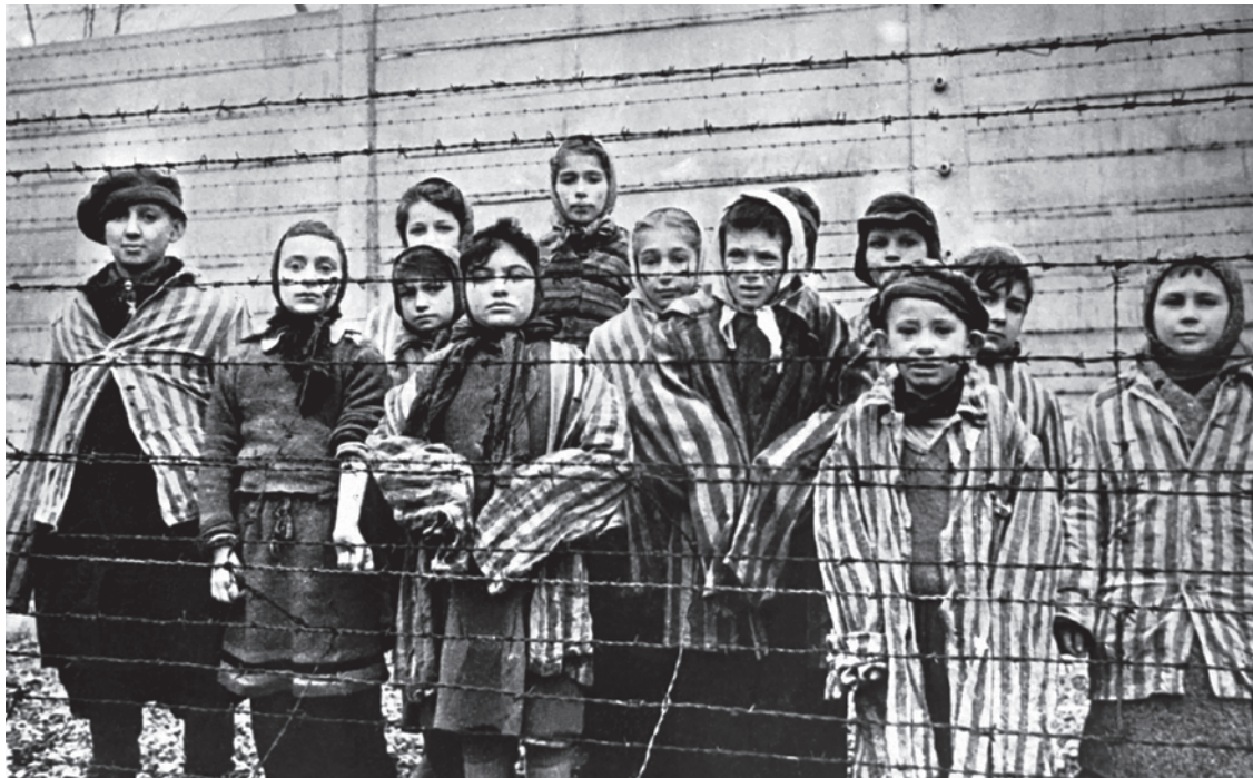
Дети, освобожденные из Освенцима. 1945