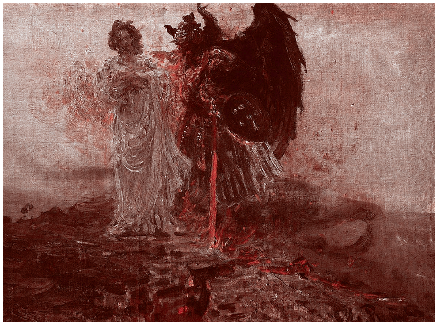
Илья Репин. Иди за мной, Сатано. 1895

Сегодня хотелось бы поговорить про то самое Пандемическое соглашение. В частности, может быть, затронуть тему цифрового концлагеря. Всё это части одной картины. Странам предлагается подписать соглашение и де-факто сдать серьезную часть собственного суверенитета. Потому что, если вдруг ты не будешь справляться в тот момент, когда ВОЗ объявил какую-нибудь очередную пандемию, то будешь обязан, подписав это соглашение, обратиться за помощью к ВОЗ, к ООН и открыть дверь для вмешательства во внутренние дела. Что происходит? Давайте поговорим.