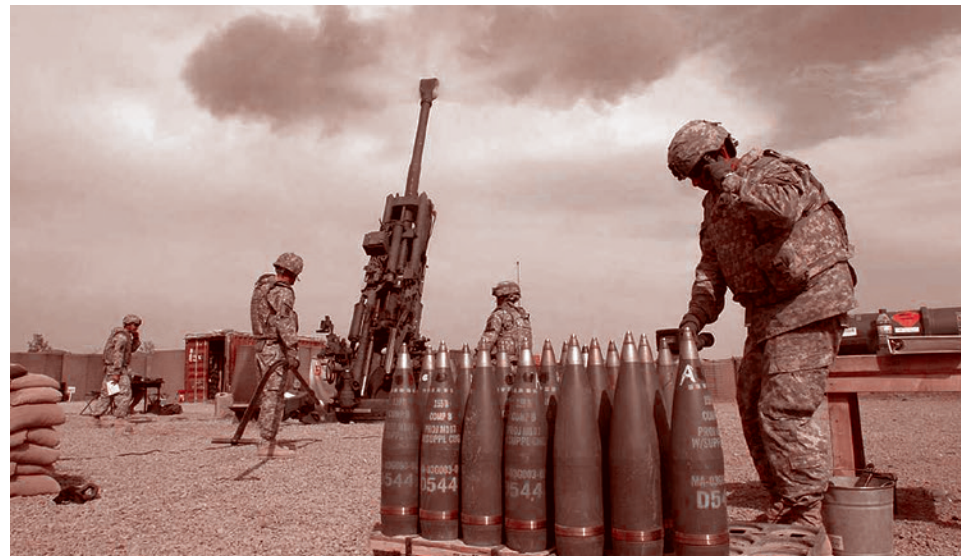
Артиллерийские снаряды НАТО калибра 155-мм

Несмотря на подобные сообщения, мобилизационный потенциал Украины еще очень далек от исчерпания.