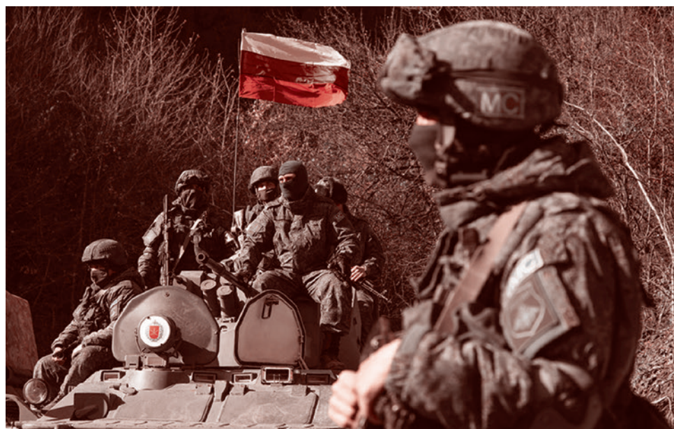
Российские миротворцы в Нагорном Карабахе

В декабре минфин США объявил, что наложит вторичные санкции на банки и финансовые организации, которые содействуют сделкам, в рамках которых Россия закупает полупроводники, шарикоподшипники и другое оборудование, необходимое для ее Вооруженных сил, даже если они не в курсе, что делают это. После этого ряд китайских банков ввел ограничения на прием платежей от российских клиентов.