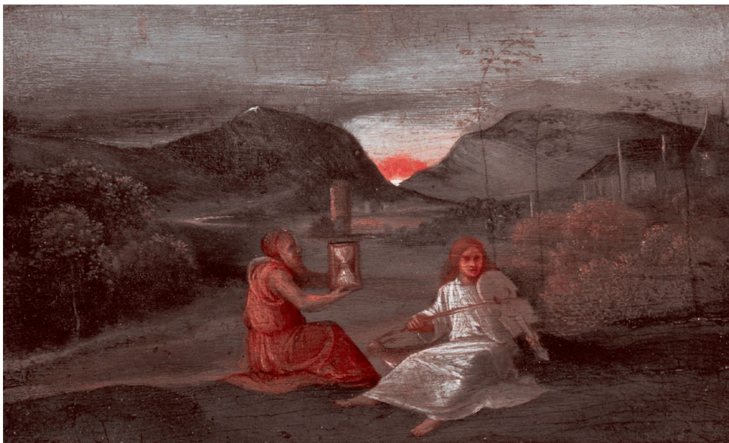
Джорджоне. Песочные часы. 1500

В ремя — достаточно таинственное понятие. В школьной физике не объясняется, что это такое и откуда берется, школьникам постулируется, что это нечто, измеряемое часами, и так это и надо понимать.