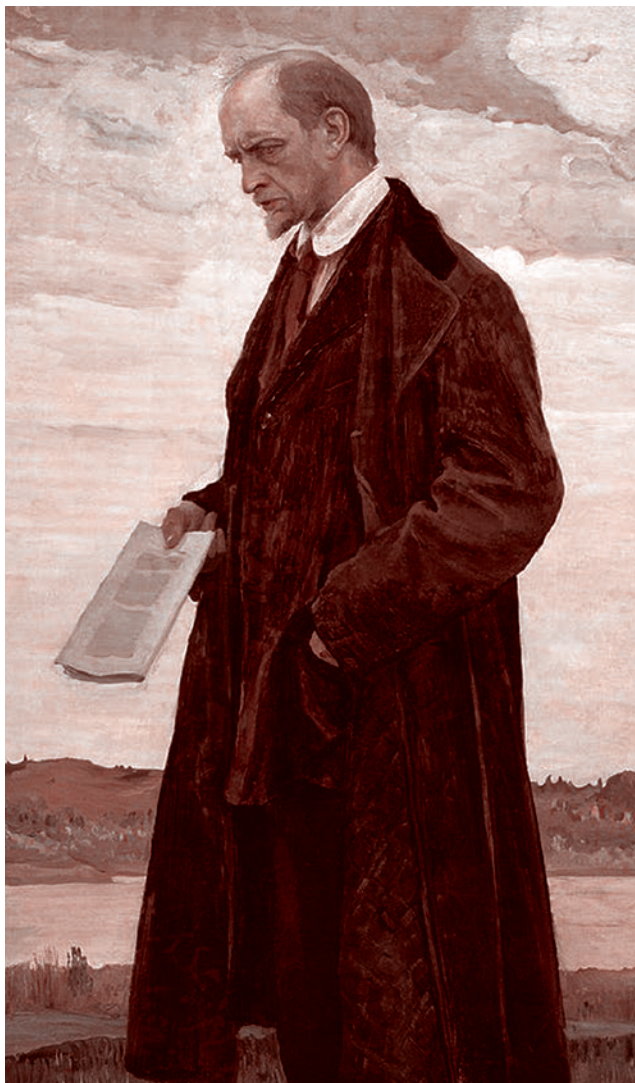
Михаил Нестеров. Мыслитель (портрет философа И. Ильина). 1922

Ильин занимал очень серьезное место в ядре тех аналитических и политических стратегических структур, которые входили