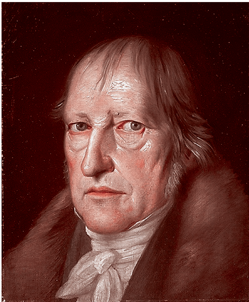
Якоб Шлезингер. Георг Вильгельм Фридрих Гегель. 1831