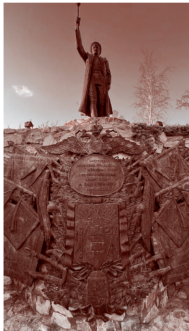
Памятник генералу Краснову и герб Войска Донского

шой комментарий: в нем он ссылался на решение суда 2009 года о том, что памятник совсем «не связан с Красновым», а является «изображением собиравшего образ».