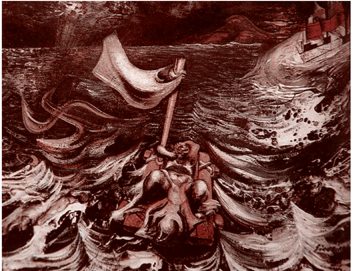
Давид Альфаро Сикейрос. Рождение фашизма. 1936