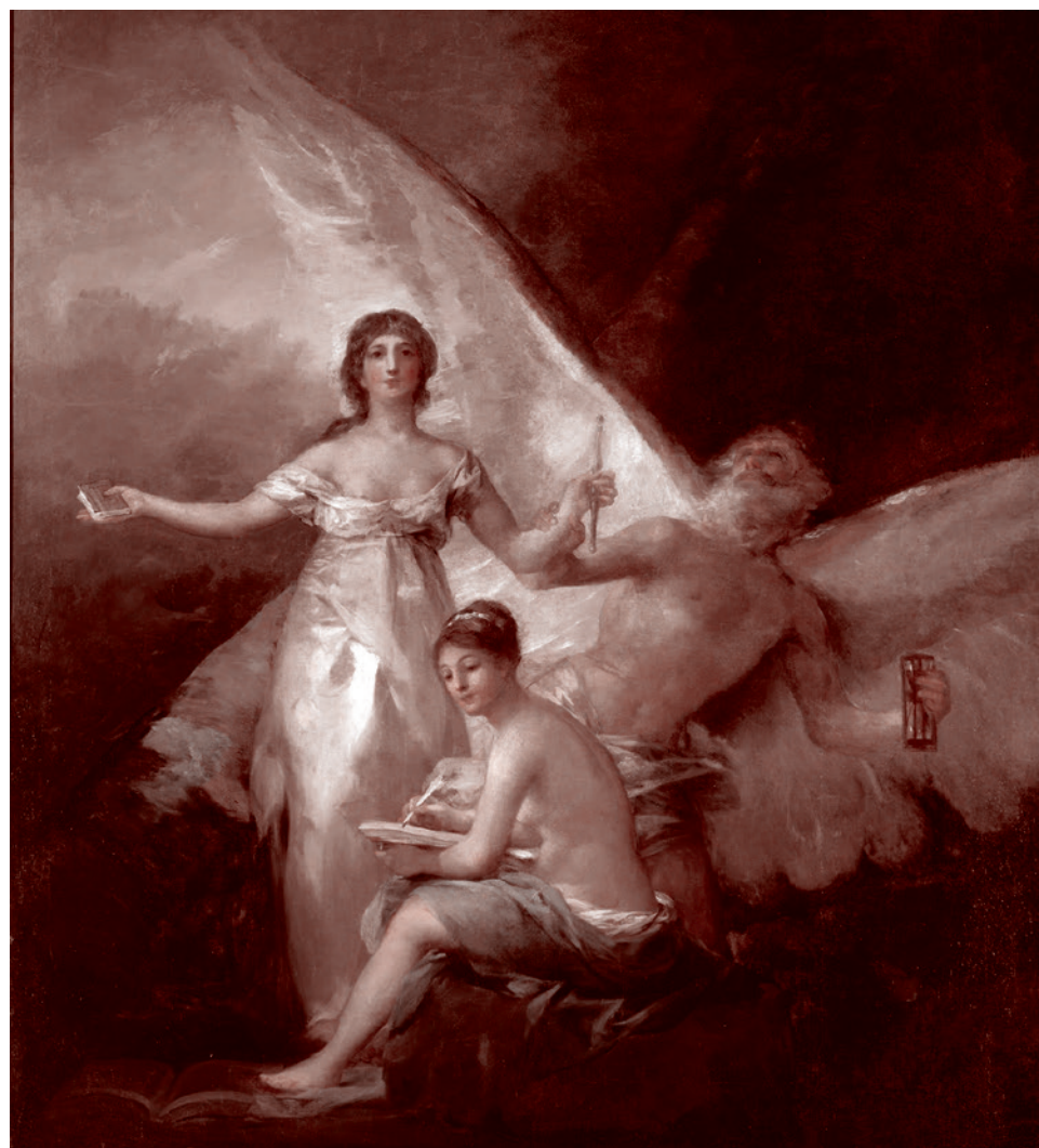
Франсиско Гойя. Правда, Время и История. 1808