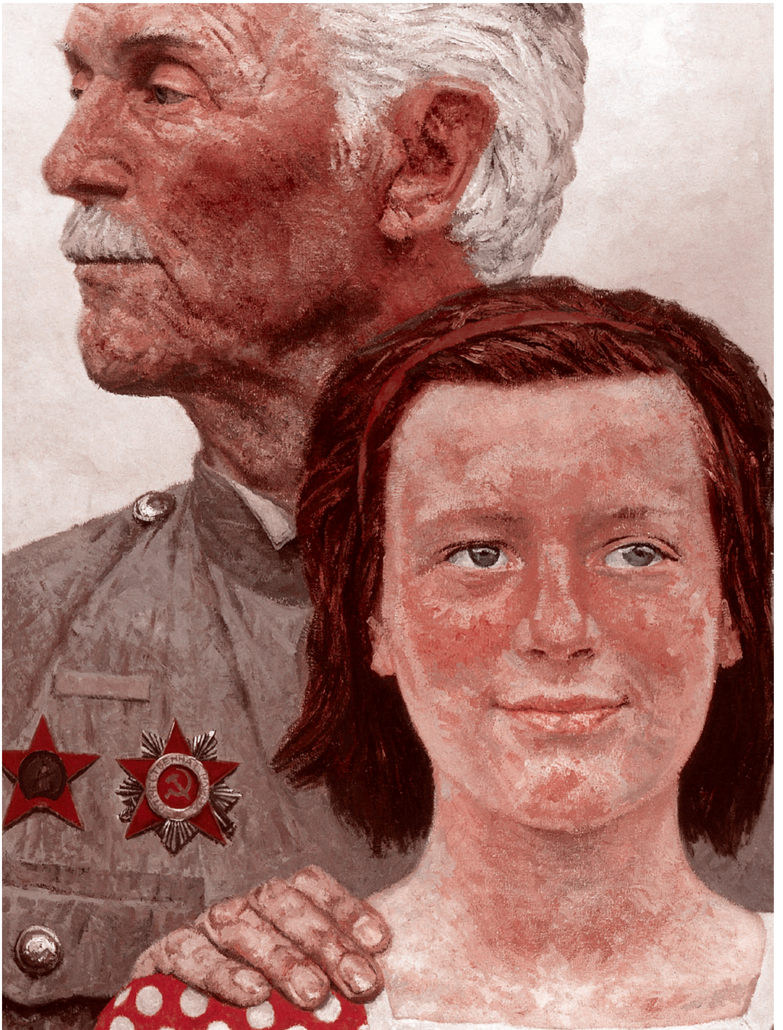
Гелий Коржев. Тревога. 1968

Газета «Суть времени» зарегистрирована Федеральной службой по надзору в сфере связи, информационных технологий и массовых коммуникаций (Роскомнадзор) Свидетельство ПИ № ФС77-50554 от 9 июля 2012 года