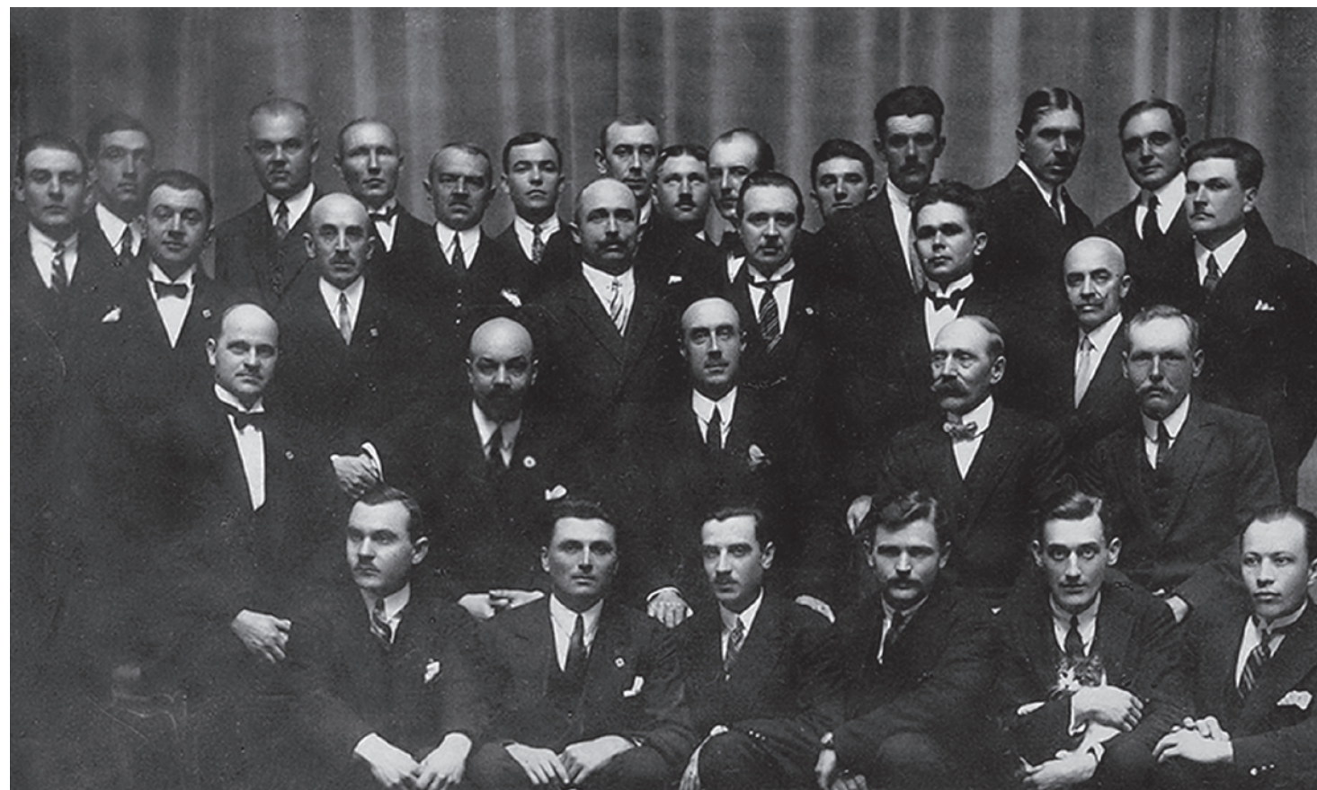
Члены Русского офицерского союза и его основатель, генерал П. Н. Врангель (в центре во втором ряду). 1927

...если на одну чашу весов положить то, что мы потеряли, она с лихвой перевесит