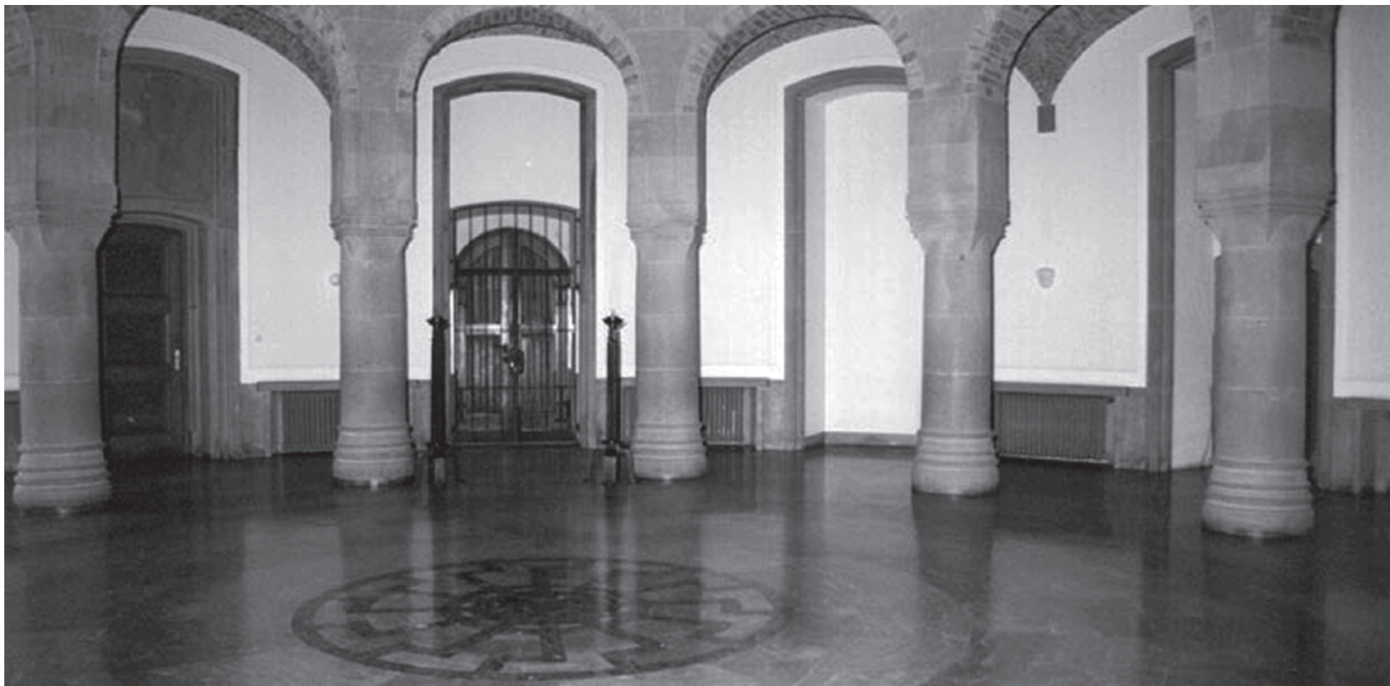
Зал обергруппенфюреров в замке Вевельбург

еврейским богом Яхве, который на самом деле не бог, а злой демиург, отвратительное существо, с которым надо бороться. За что? За бегство из проявления. Куда? В Черное солнце.