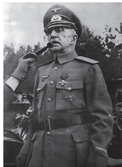
Генерал Петр Краснов в форме Вермахта. 1943

ине, а также выступали против воссоединения Крыма с Россией. А ультраправых боевиков «Правого сектора»*** этот почитатель Краснова называл «качественно улучшенными украинцами», которые «освободились от коррупции» и «советского духовного яда».