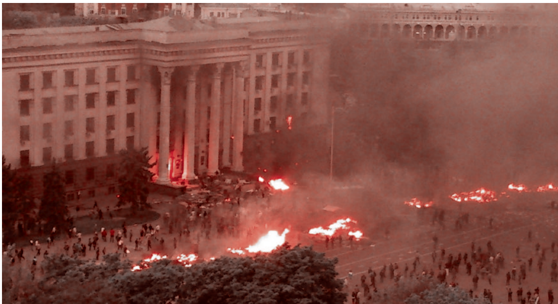
Горящий дом профсоюзов в Одессе. 2 мая 2014