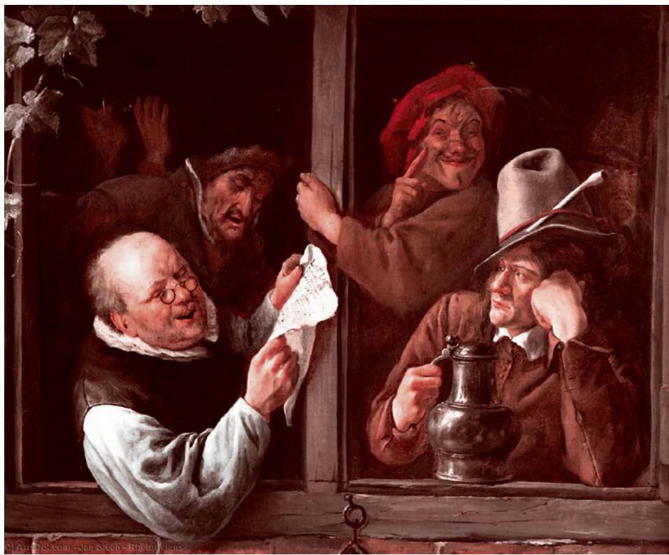
Ян Стен. Болтуны у окна. 1665

Что происходит вообще с культурой секретности? Существует ли она? Если она существует, то что находится в мозгу у этих людей? Кто эти люди? Они же высшие офицеры — их не учили тому, как разговаривать на секретные темы? Они не получали инструкций? Они все, находясь в разных городах, напились до положения риз или нанюхались? Что знаменует собою неслыханная экстравагантность данного эпизода?