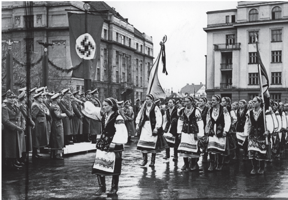
Генерал-губернатор Ганс Франк принимает парад украинской молодежи. Станислав. Октябрь 1941

дит до Ла-Манша. События, описанные в романе, отличались от того, что произошло на самом деле через два года после его публикации не только тем, что в романе Красная Армия громит захватчика «одной левой». Но и тем, что второй фронт в поддержку действий советских войск открывают в романе не Соединенные Штаты с Великобританией, а германские рабочие, восставшие против нацистской власти, вслед за чем бунтуют и поднимают на штыки своих буржуев пролетарии всех стран.