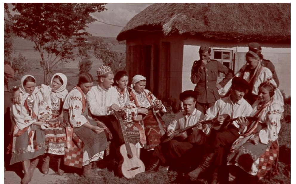
Жители украинской деревни под Полтавой встретили наступающих немцев народными песнями. Лето 1941