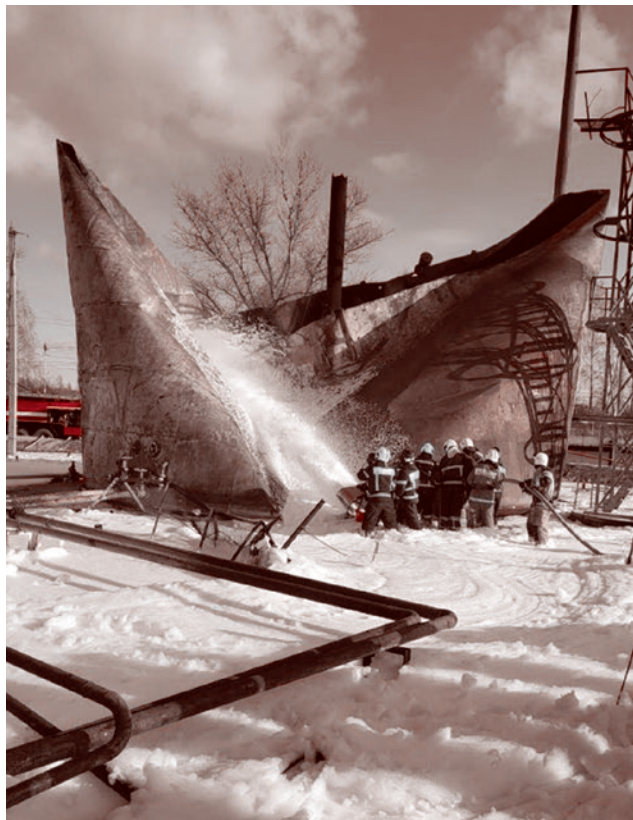
Последствия пожара ГОКа в Железнодорожске