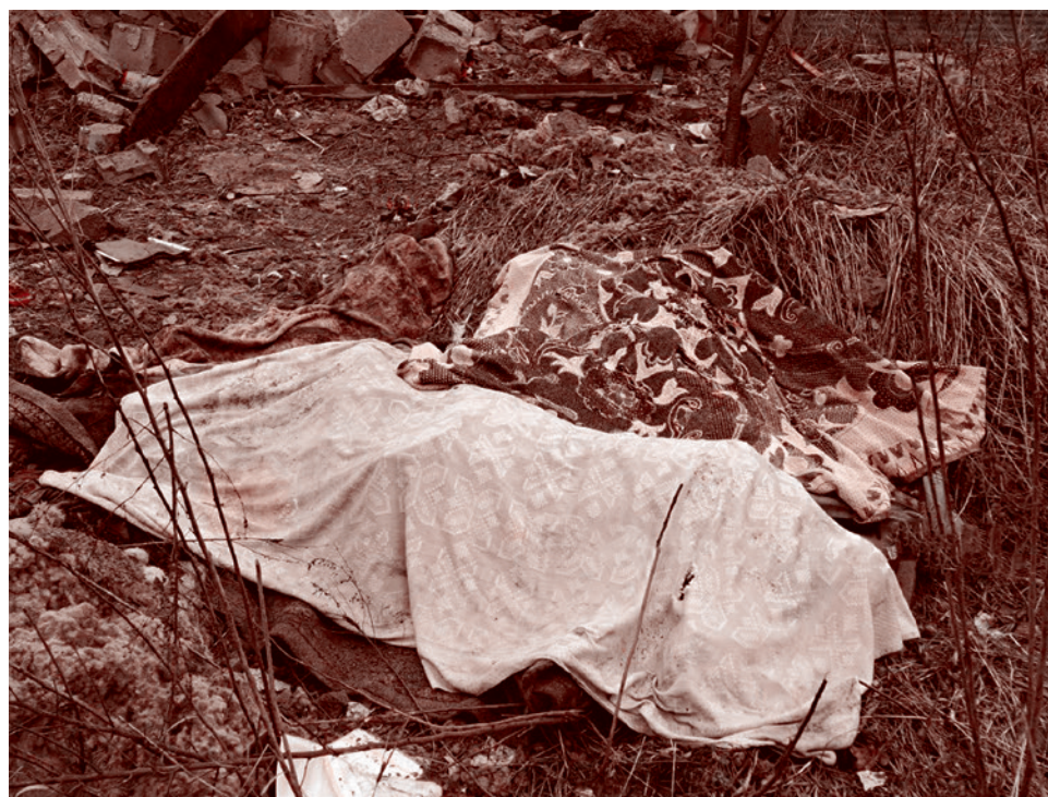
Трое детей, погибших в Донецке. Лежат возле своего разбитого дома. Две сестры и брат. Мать воспитывала их одна после того, как Украина убила ее мужа

Параллельно обстрелам были предприняты попытки прорвать границу в районе грайворонского села Сподарюшино. Как рассказали в Министерстве обороны, российские подразделения сорвали попытку «упреждающими действиями». Судя по опубликованному видеочету ведомства, тяжелая техника противника была поражена авиационными и артиллерийскими ударами. По данным министерства, украинские военнослужащие потеряли до 195 человек, 5 танков, 4 бронированные машины, 3 самоходные реактивные установки разминирования УР-77 и 3 инженерные машины разграждения.