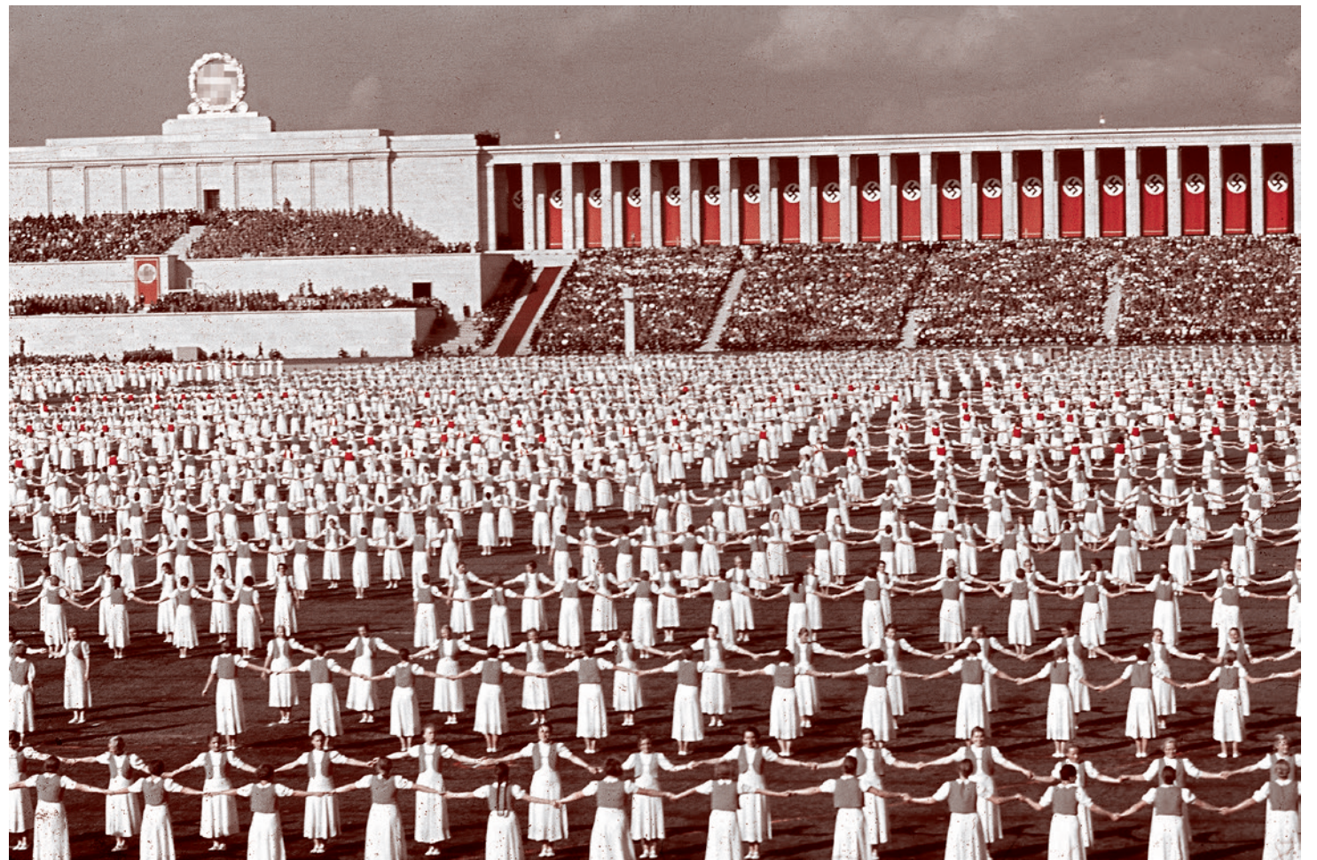
Члены «Лиги немецких девушек» танцуют во время съезда нацистской партии на стадионе Zeppelinfeld в Нюрнберге. 1938

ной хунте, сложить оружие, идти домой и не мешать российской армии разделиться с нацистами.