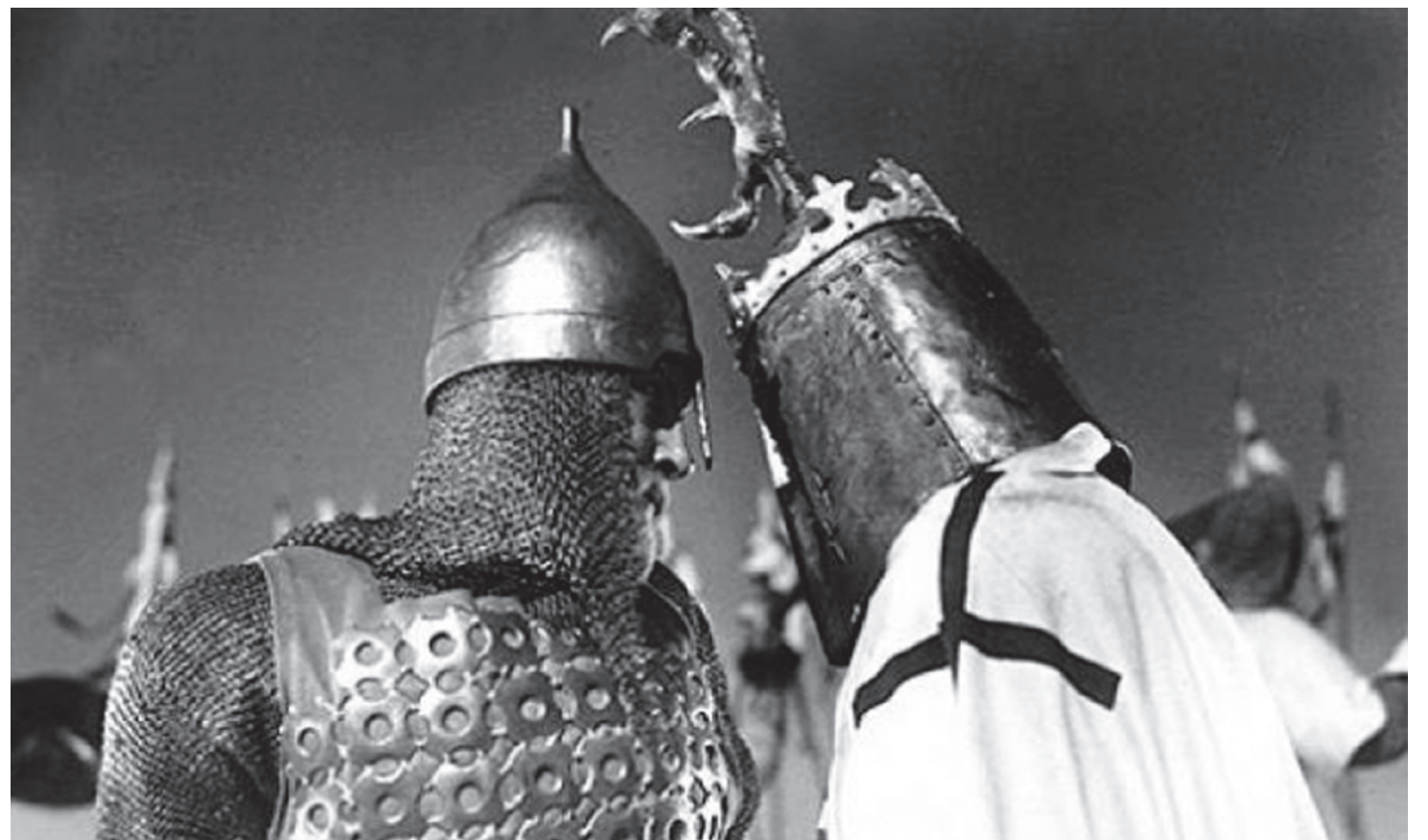
Противостояние. Цитата из к/ф Александр Невский. Реж. Сергей Эйзенштейн. 1939. СССР