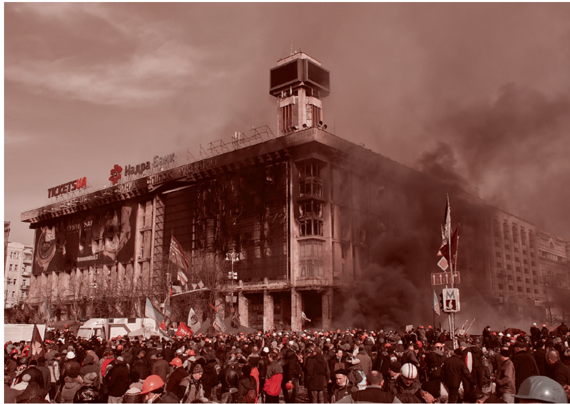
Майдан в Киеве. 19 февраля 2014

Люди со «слепым пятном» в конце 2013 года вообще не зафиксировали в своем сознании те митинги, что начались на киевских площадях после того,