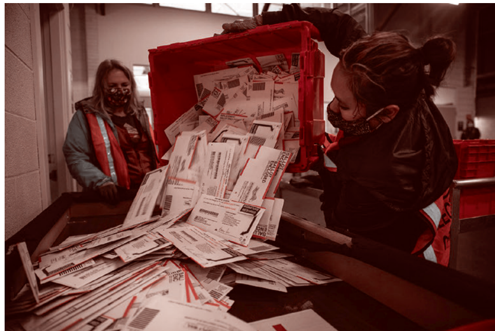
Избирательный участок в США

Далее делегаты на съезде партии выбирают того, кто станет кандидатом в президенты. При этом нет никаких законов, которые обязывали бы их голосовать за