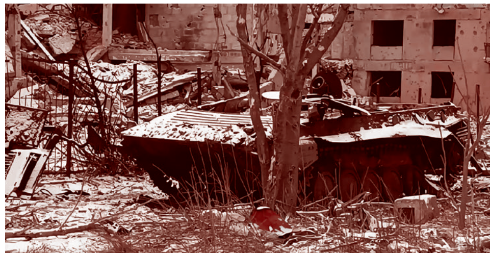
Уничтоженная техника в Авдеевке. Февраль 2024

А вот усилия Вашингтона для скорейшего окончания войны «предоставят Украине лучшие возможности для сдерживания будущего российского вторжения».