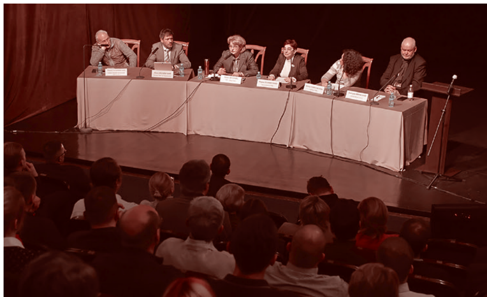
Круглый стол о политической проблеме «Слова пацана» и не только. 28 января 2024

Создатели сериала и те, кто его навешивает, постоянно говорят о том, что «в фильме показана правда жизни». Но на самом деле они исказили картину мира. Они не показали, что есть другая сила — светлая сила, добрая сила. В русской культуре сильный человек — это всегда тот, кто защищает слабых. Начиная с былин, в которых богатыри, как только они обретают