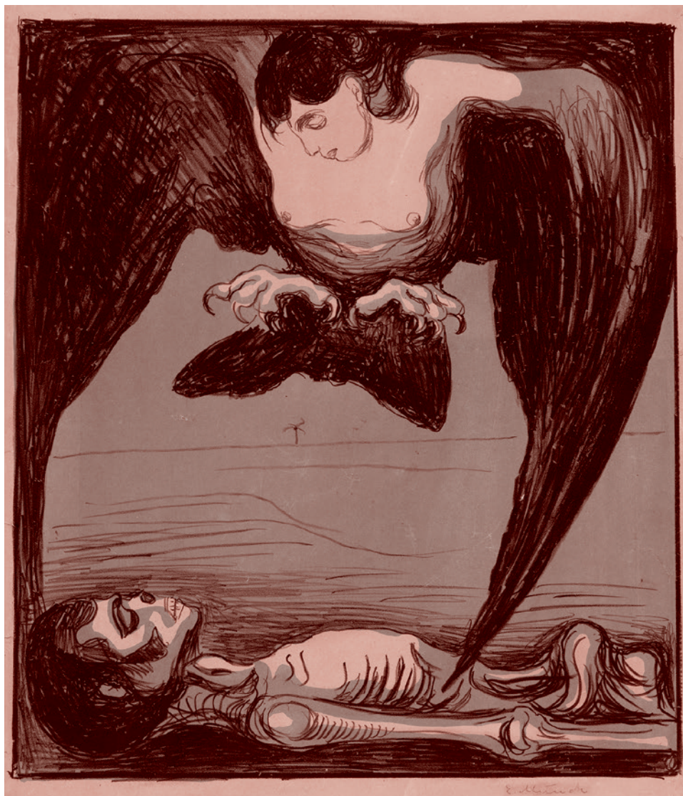
Эдвард Мунк. Гарбуния. 1899

Я говорил об этом, а теперь министр обороны Российской Федерации обратил внимание на то, что ситуация с «Коалицией-СВ», которая могла бы переломить всё, что касается контрбатареинной борьбы, весьма печальна. Что не так быстро производится эта дальноточная самоходная