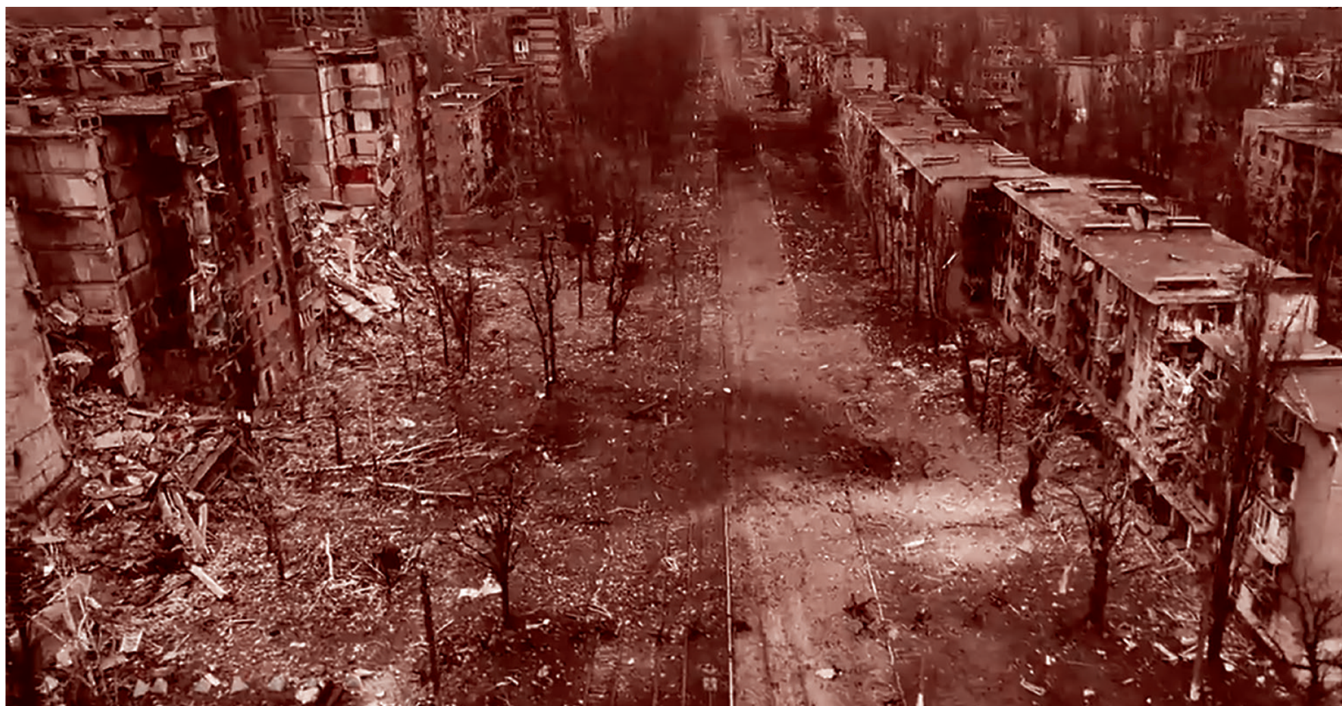
Авдеевка. Февраль 2024