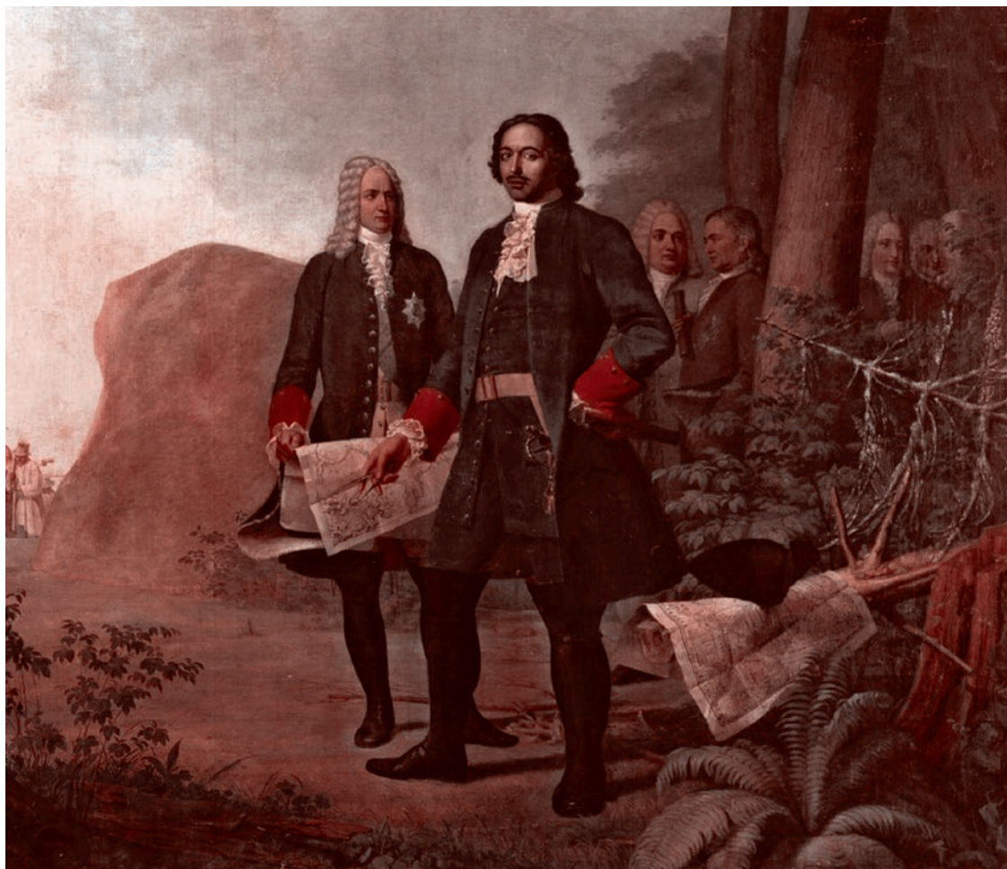
Алексей Венецианов. Петр Великий. Основание Санкт-Петербурга. 1838

Всё они сделают, никто Украину не бросит. Вся паника, что ее «бросают» — это типичная истерика, пиар-ход. Никто ее не бросит. Рано или поздно деньги будут выплачены, Европа раскошелится, русские деньги будут экспропрированы и поделены между западными бандитами и украинскими бандитами. И часть из них пойдет тоже на дело. Этот переход в оборону может длиться долго. Война такая, что мы всё время слышим: «взят такой-то дом, такие-то лесные посадки», «отодвинулись туда-то». Это суперпозиционная война, которая не является повтором Первой мировой или любой другой. Это сетевая война, при которой ты только двинул какое-нибудь крупное соединение, а его накрыли — и всё кончилось.