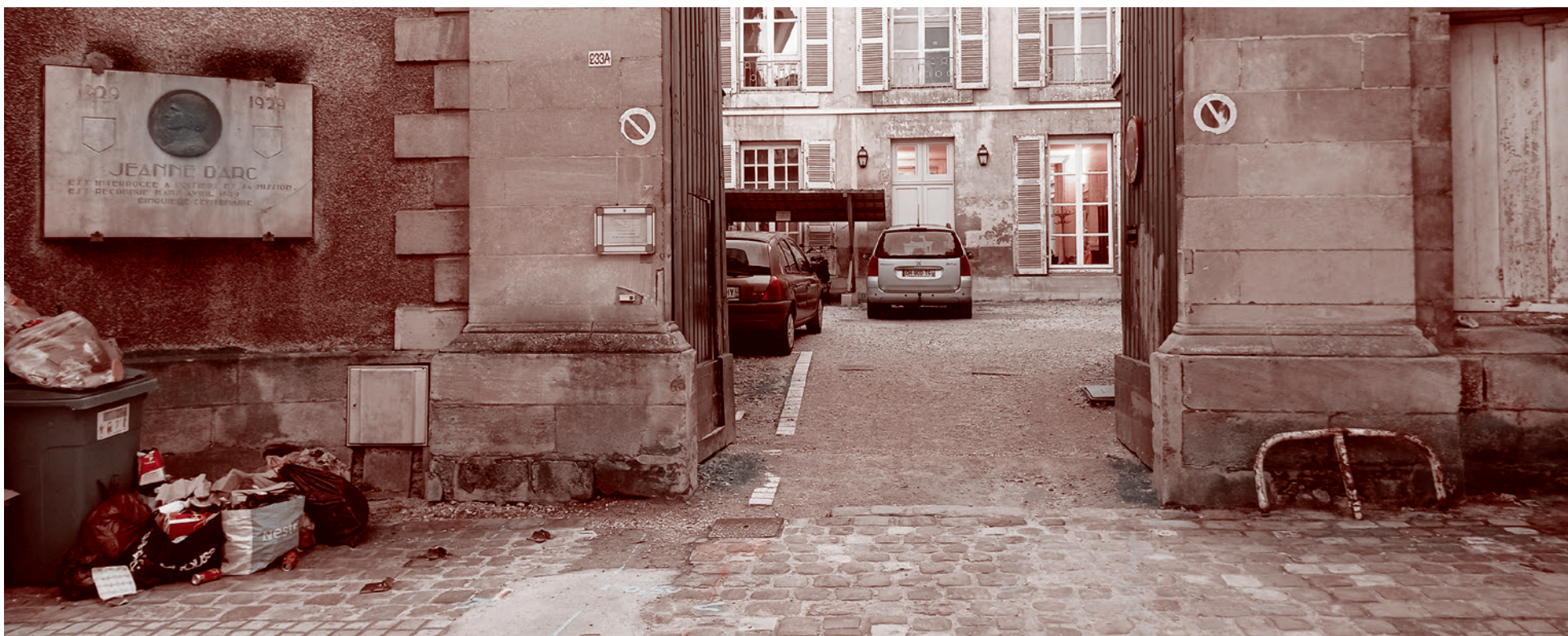
Улица в Пуатье с мемориальной доской Жанне д'Арк. Франция. 2024

Публикуем статью Жан-Пьеро Рео для ИА Красная Весна