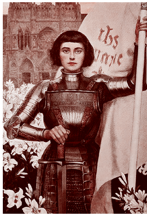
Альберт Линч. Жанна д'Арк. 1903

Газета «Суть времени» зарегистрирована Федеральной службой по надзору в сфере связи, информационных технологий и массовых коммуникаций (Роскомнадзор) Свидетельство ПИ № ФС77-50554 от 9 июля 2012 года