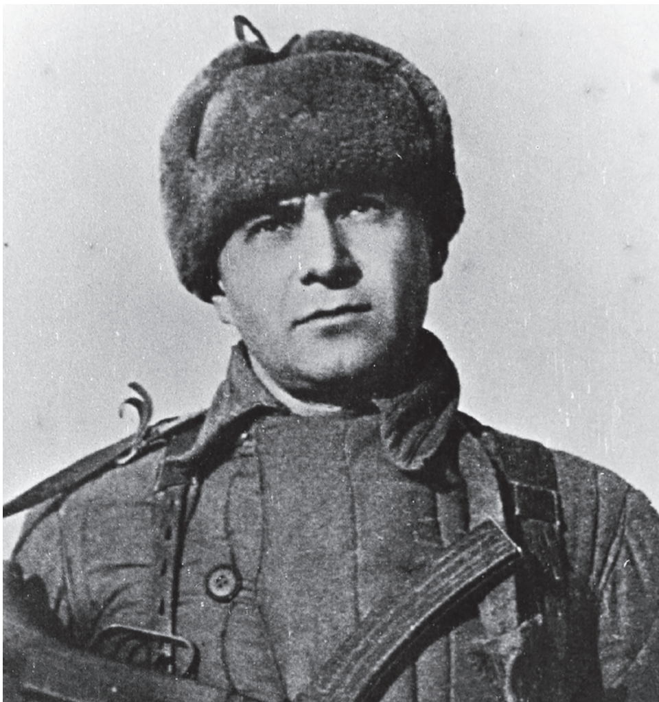
Цезарь Львович Куников. Архивное фото