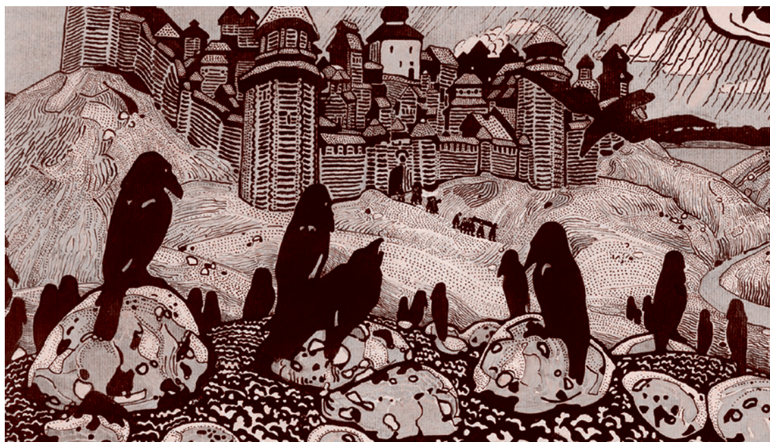
Николай Режилов. Вороны. 1901

Второе. Я чувствовал эту ренацификацию, я думал, может, Израиль как-нибудь дернется на это — ну уж слишком много всё-таки евреев потеряли. И я имел возможность из бесед с самыми разными представителями элиты Израиля все-таки понять, какая власть-то в Израиле? Яс-