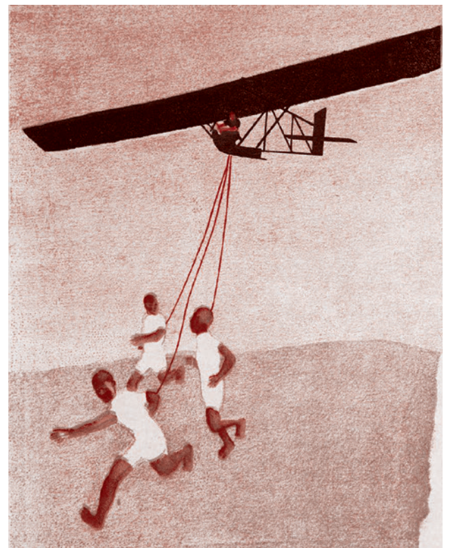
Александр Дейнека. «Планер запускают» 1930. Рисунок для детской книги «В облаках»

Однако при всей ее вредности для дела, не стоит недооценивать роль безответственности как приятного бонуса для сотрудника при трудоустройстве! Конечно, сотрудник отдела кадров никогда об этом не скажет, но и мы живем не в вакууме: эта информация давно перестала быть секретом. Особенно для тех, кто искал себе вариант «непыльной работы». Один этот бонус в сознании большого числа людей перевешивал низкие зарплаты и в значительной мере стабилизировал ситуацию в ВПК, превращая резкий коллапс в плавную стагнацию. И без внешних воздействий эта тишь да гладь могла бы продол-