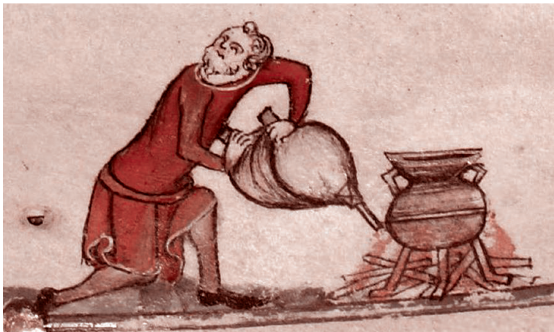
Человек раздувает огонь под трехногим котлом. Средневековая миниатюра. 1300–1340

Я не говорю, что это не так. Я просто говорю, что Европа не кричит «проклятые