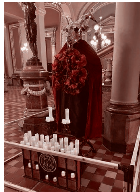
Статуя сатаны в холле Капитолия штата Айова

Прокуратура в Айове предъявила американцу, обезглавившему статую сатаны в здании законодательного собрания штата, обвинения в преступлении на почве ненависти, сообщило издание Des Moines Register.