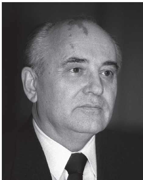
Михаил Горбачёв. 1991

Сергей Кургинян: Она не может существовать ни на какой основе, кроме неонацистской — в большей или меньшей степени. Идут огромные митинги против партии «Альтернатива для Германии» — либеральные митинги. Германия показывает свое либеральное лицо. Это либеральная маска. Что произойдет в тот момент, когда нужно будет воевать? Какая группа, какой идеологический кластер готов воевать? Kill a commie for commie («убей коммуниста ради мамы») — это кто будет? Это будет только неонацистская группа, которая в этот момент и выйдет идеологически, одновременно с технической и экономической милитаризацией. И это будет происходить во всей Европе а) потому, что русские «нас будут завоевывать», б) потому, что «Трамп нас бросит».