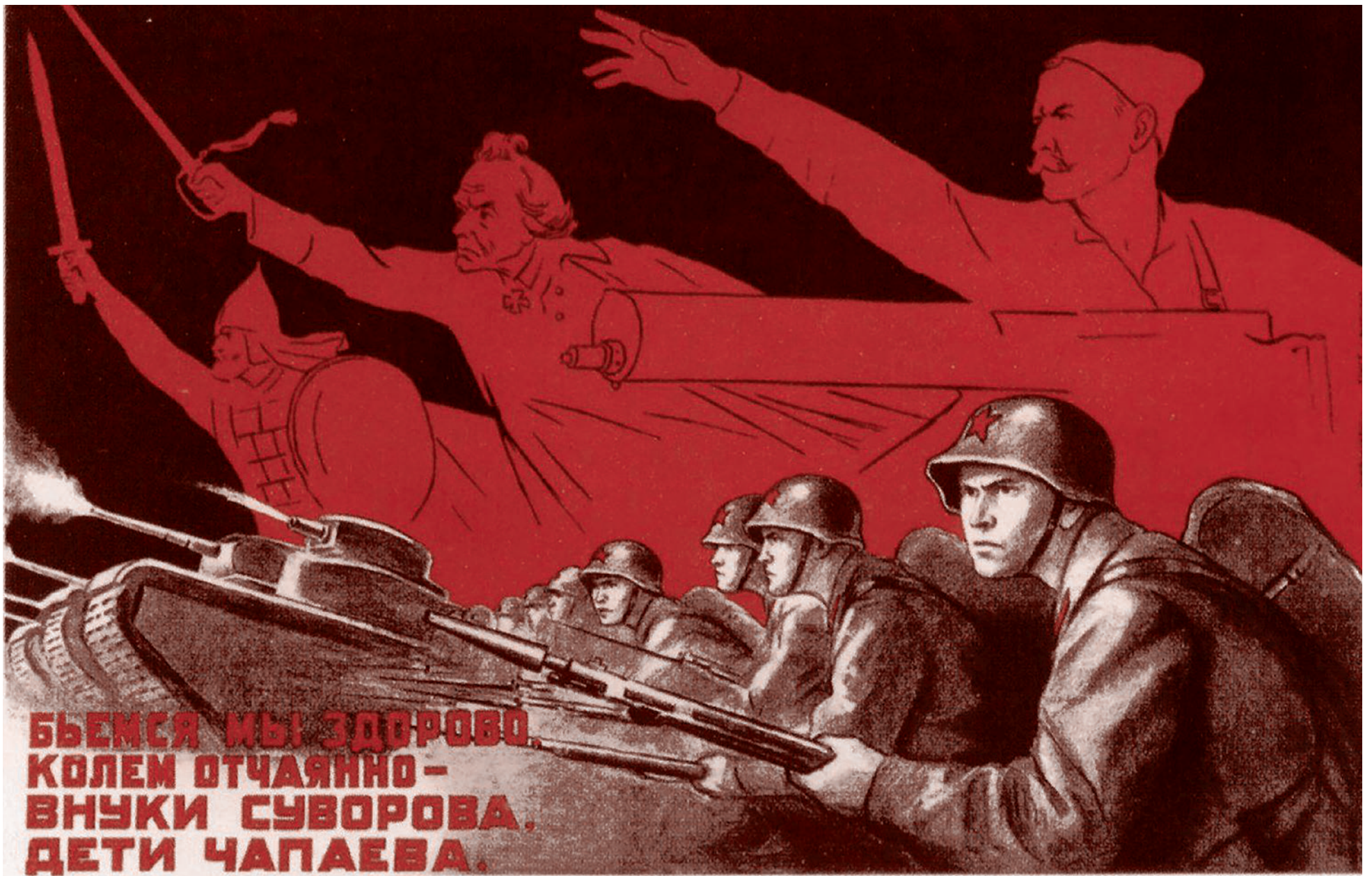
Советский плакат. Бьемся мы здорово, Колем отчаянно - внуки Суворова, Дети Чапаева. 1941