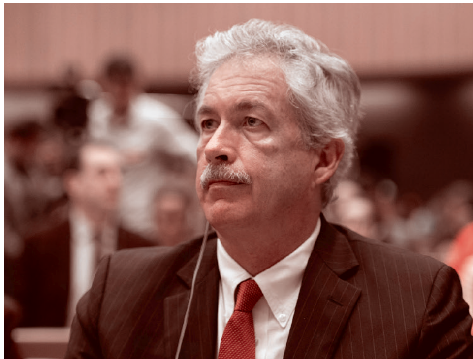
Глава ЦРУ Уильям Бёрнс

«Но экспорт Китая в значительной степени представляет собой цифровую и физическую инфраструктуру. Я писал в исследовании по делам Америки за декабрь 2023 года: точно так же, как ж/д превратили местные продукты в товары мирового рынка в XIX веке, мобильная широкополосная связь превращает маргинализированных людей в развивающихся странах в участников глобальной эко-