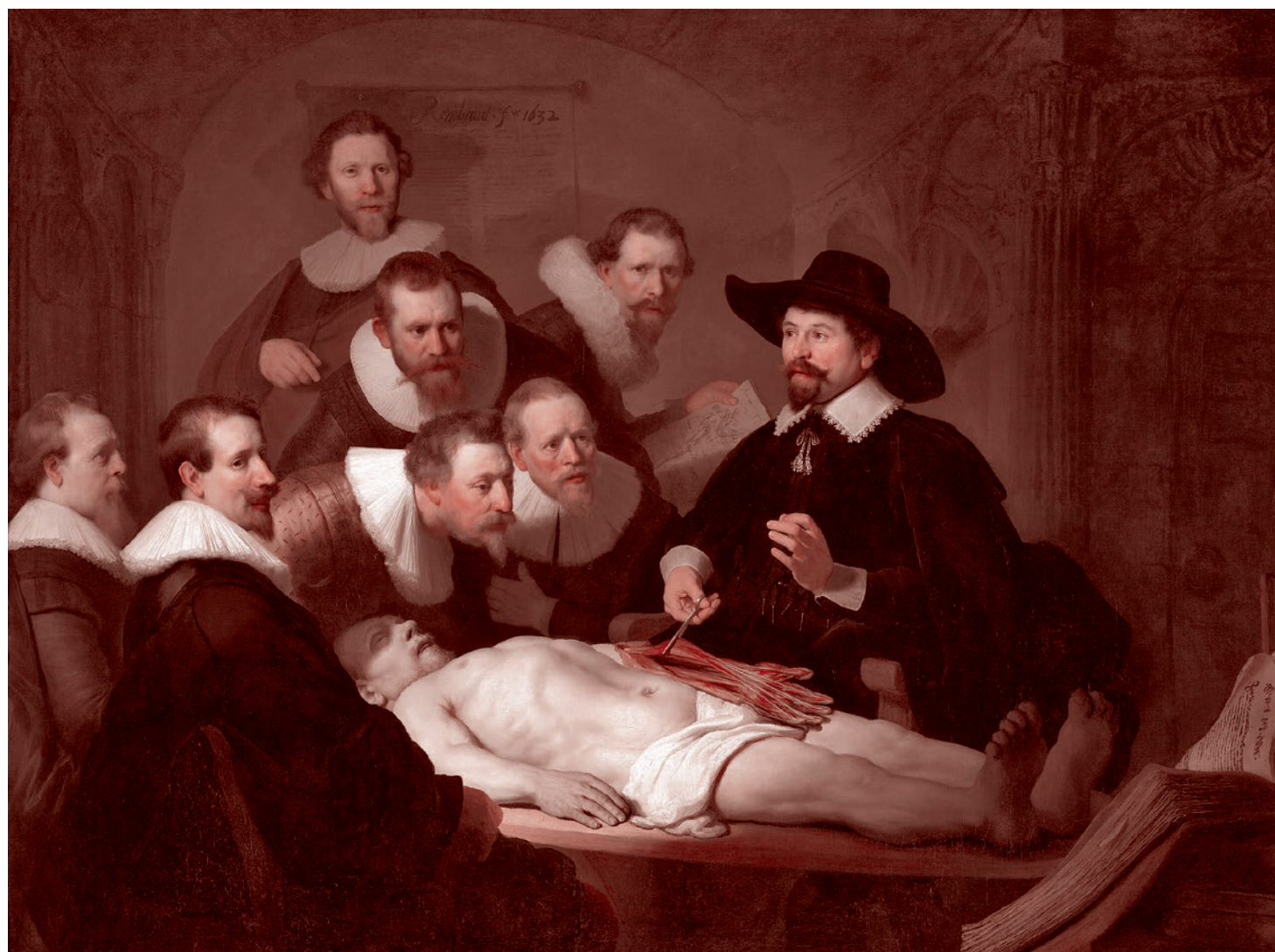
Рембрант. Урок доктора Николааса Тулпа. 1632

Ряд аспектов роли русского языка в функционировании государства и обеспечении прав граждан России уже был проан-