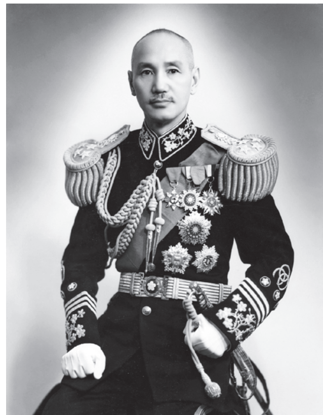
Президент Китайской Республики на Тайване генералиссимус Чан Кайши. 1943

Говорится следующее: «А чем, собственно, Гоминьдан отличается так сильно от Коммунистической партии Китая?» Кстати, все забыли слова Сталина, совсем непростые, что: «Я не знаю ни одного че-