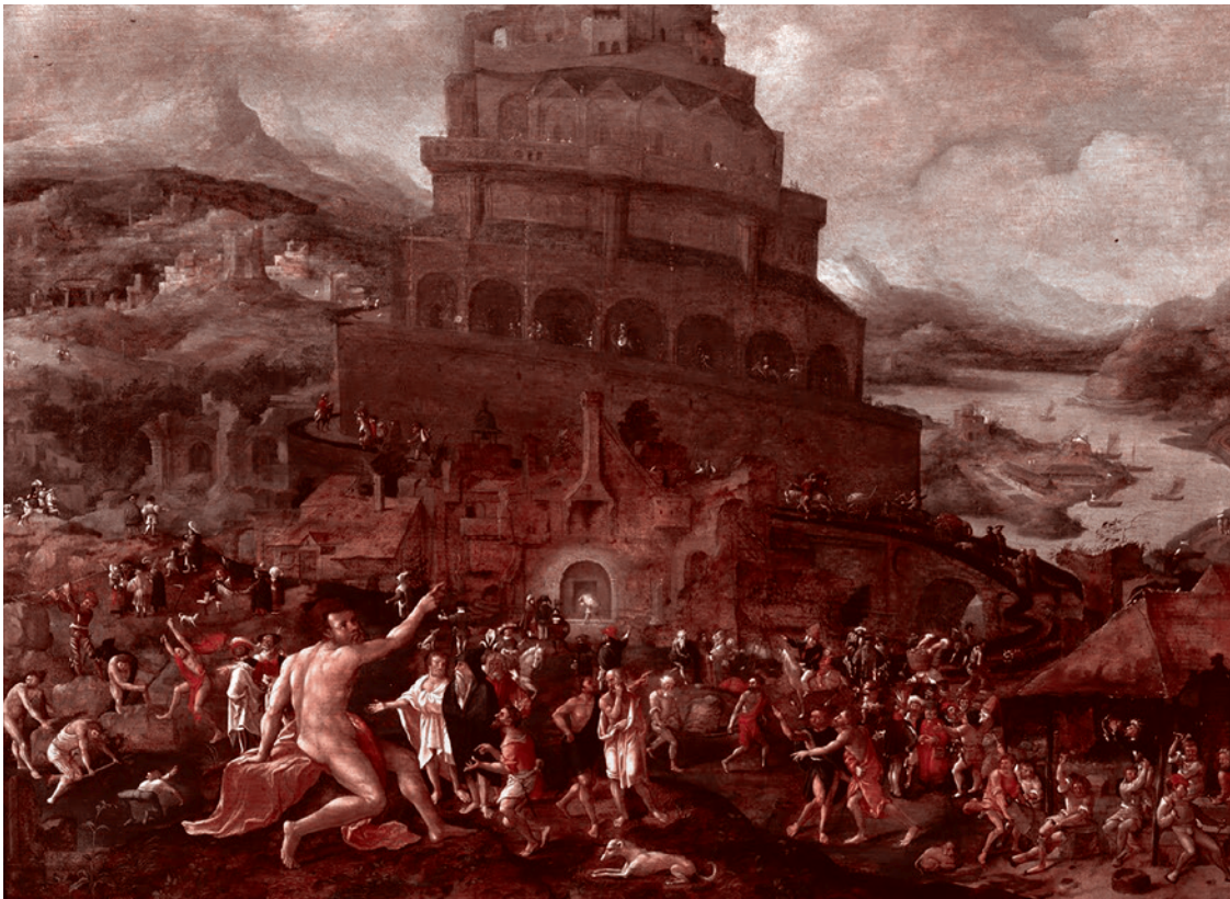
Ян Ван Скорель. Вавилонская башня. 1550

строга рекомендовала употреблять термин трофический только по отношению к эффектам, связанным с увеличением митотического коэффициента и синтеза ДНК в органе или ткани.