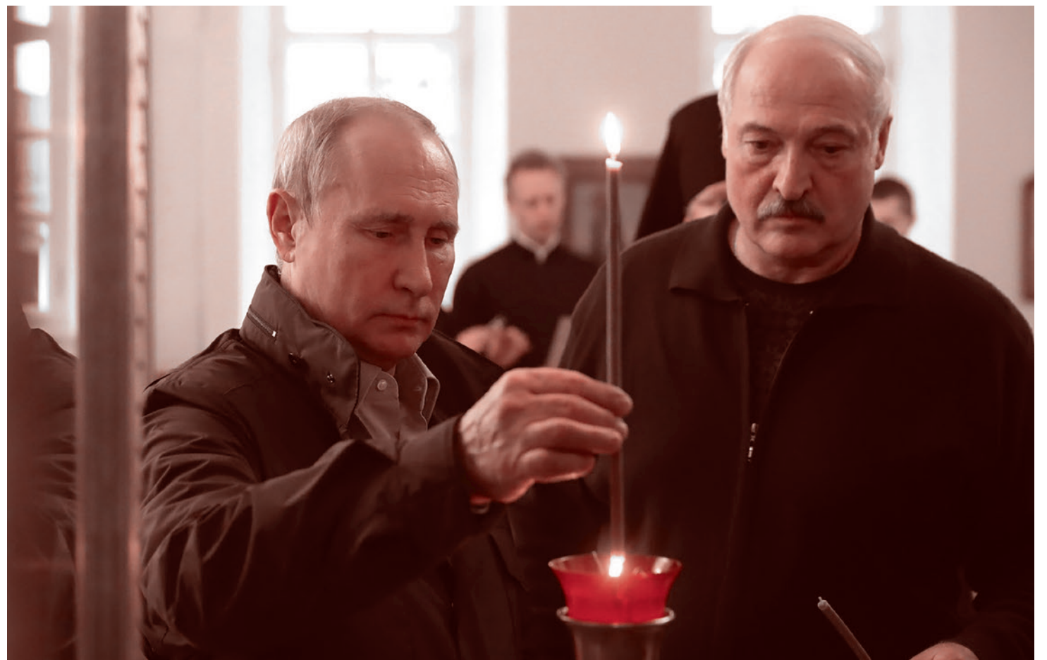
Владимир Путин и Александр Лукашенко в 2019

Сергей Бочков: Вот смотрите, 2024 год — это президентские выборы в России, парламентские — в Белоруссии. И мы уже