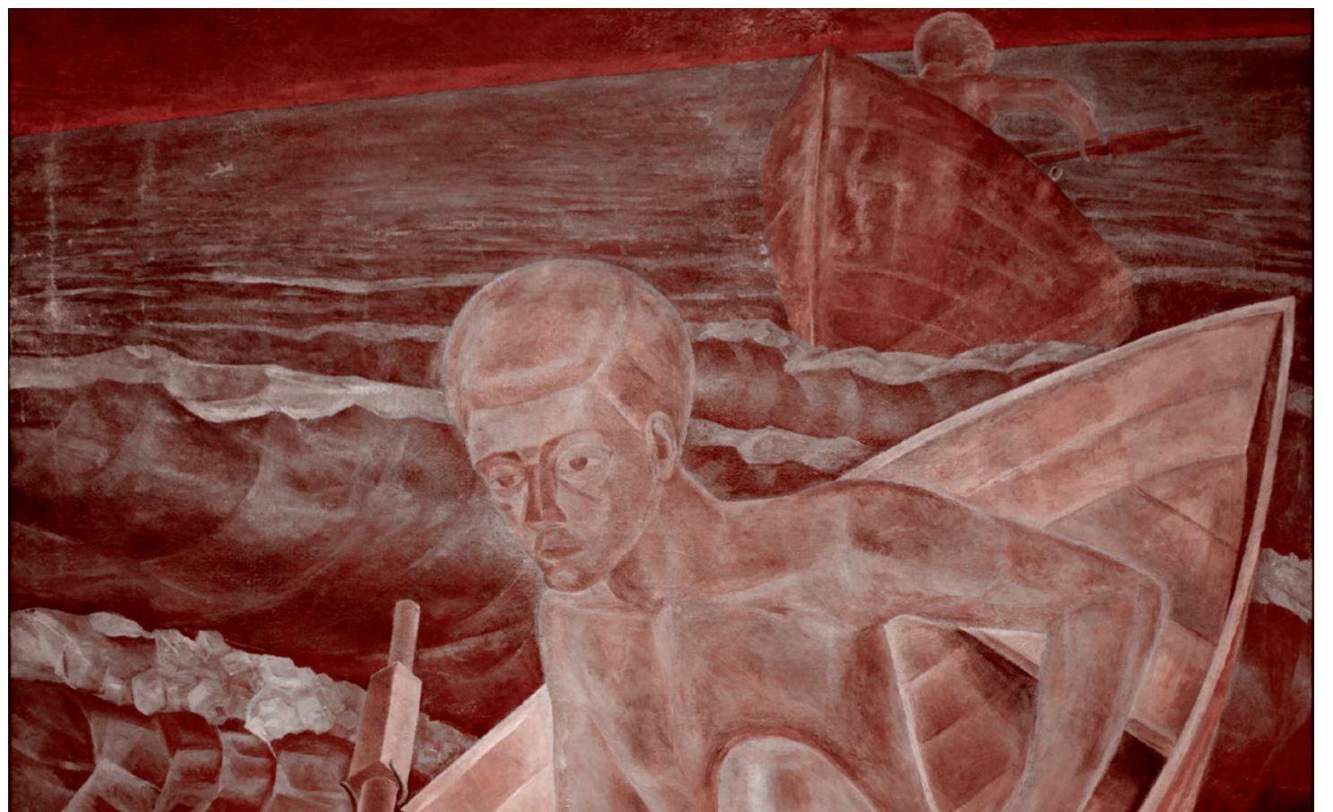
Павел Голубятников. Гроза. 1939