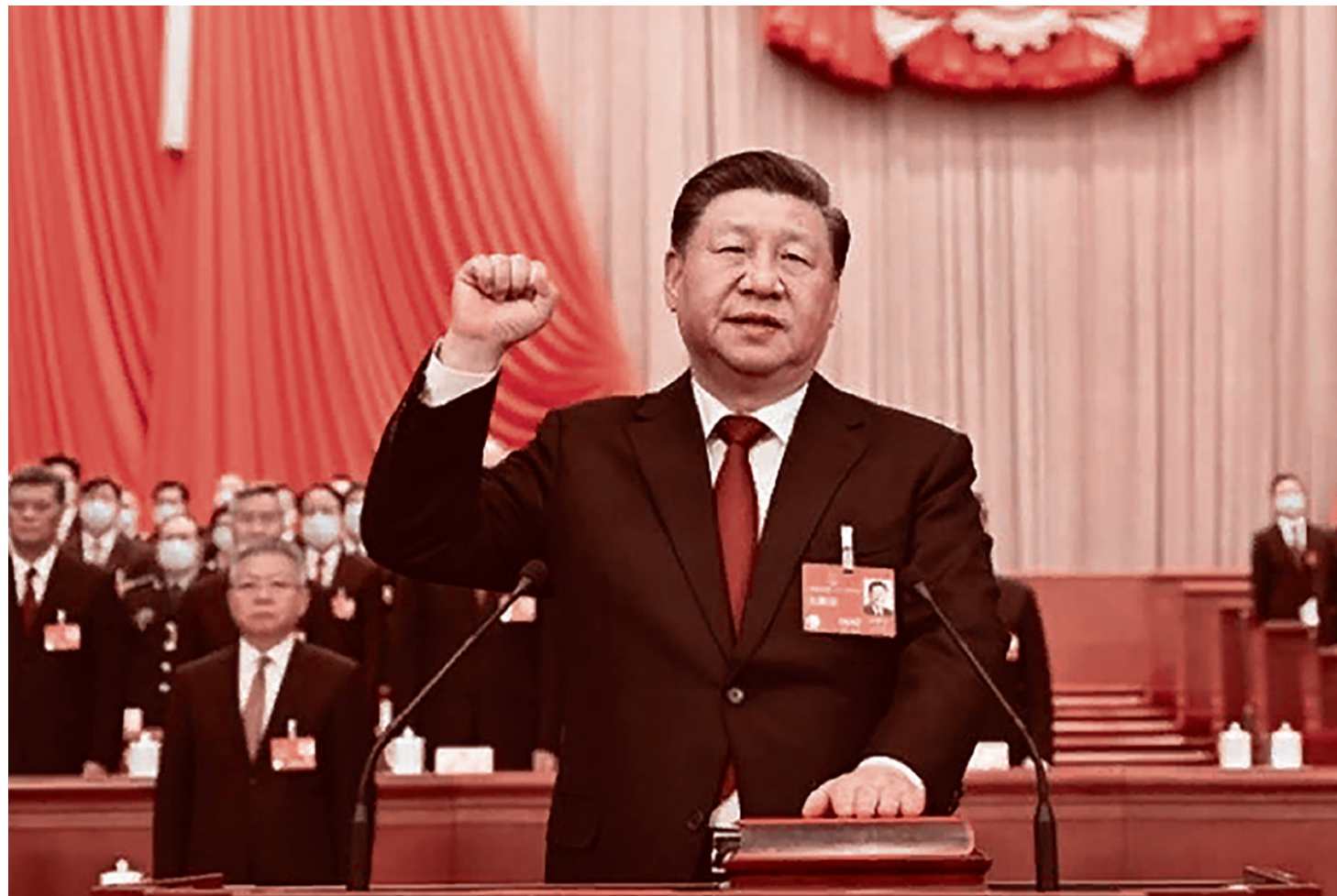
Лидер Китая Си Цзиньпин

Сергей Кургинян: Всего самого лучшего вашей замечательной стране!