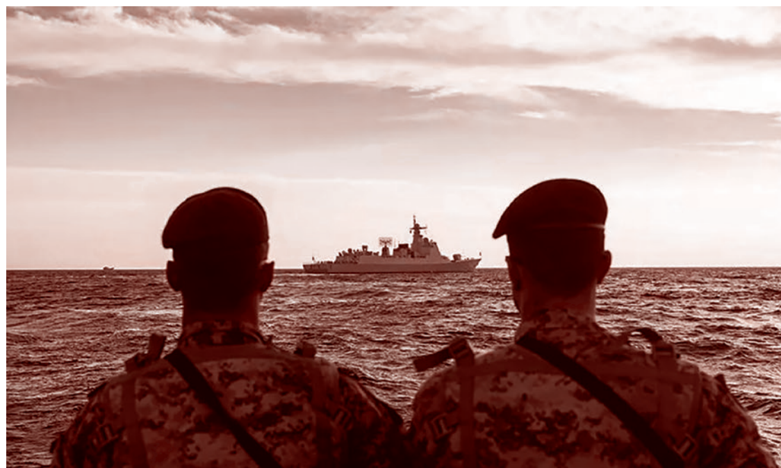
Международные учения «Морской пояс безопасности — 2023»

Столь резкий рост инвестиций России в Иран связан во многом с тяжелыми западными санкциями и изоляцией России от европейского рынка, что сопровождается политическим и экономическим сближением с Ираном, находящимся в сходной