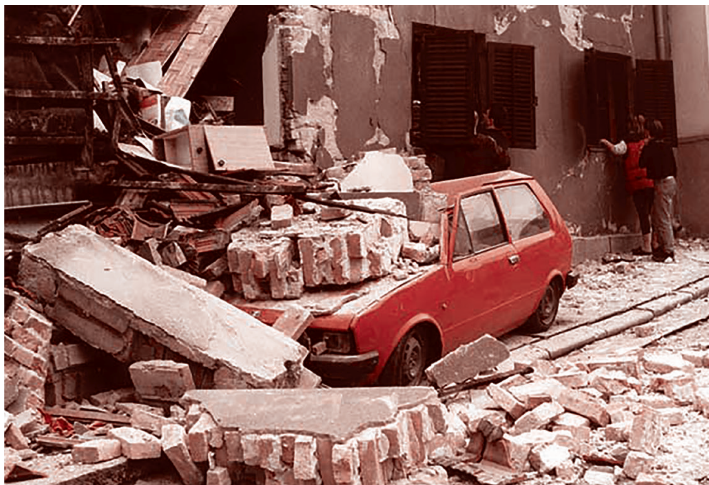
Улица в Белграде после бомбардировки. 1999

А если так, то что означает новая украинская доктрина по отношению к России? Украина будет обороняться. Не думайте, что кто-нибудь в итоге ей не даст денег. Дадут ей все прежде обещанные деньги — раз, и русские деньги экспроприруют и поделают, и они частью поступят на Украину, а частью самим грабителям, вот эти большие деньги замороженные — два. Всё будет, но не сейчас. Украина всё равно