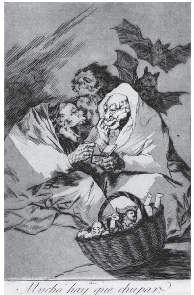
Франсиско Гойя. Эти старухи высасывают соки из младенцев. Из серии Капричос. 1799