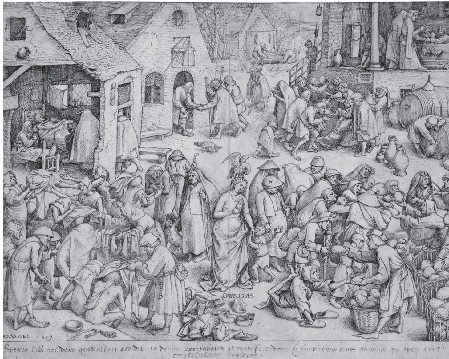
Питер Брейгель Старший. Любовь.1559

— У нас участок линии разграничения в нашей ответственности был 64 километра. Соответственно, по постам ребята стоят, где шесть человек, чуть больше, чуть меньше, по-разному. Ротация приезжает, я в ротацию — один медик. Ты находишься примерно где-то посередине, для того чтобы можно было на другие посты выезжать. Устроено было у нас так — это мы сами свои порядки устраивали. Я так сделала. Объезд идет, приезжает, к примеру, машина с продуктами, я