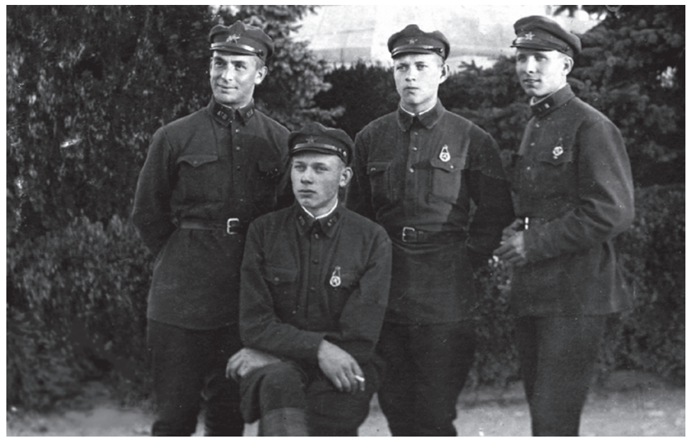
На груди у курсантов ленинградского артиллерийского училища — значок «ГТО СССР». 1933

Сергей Кургинян: Стратегически — никогда. Тактически — когда угодно. Если какая-нибудь «мышь» по фамилии Блинкен возьмет взятку у какой-нибудь нашей особо шустрой частной «мышы» и решит устроить в связи с выборами нечто «приятное», то мы можем ждать чего угодно, любых поворотов. Вырождение огромное, но политическое ядро правящего класса —