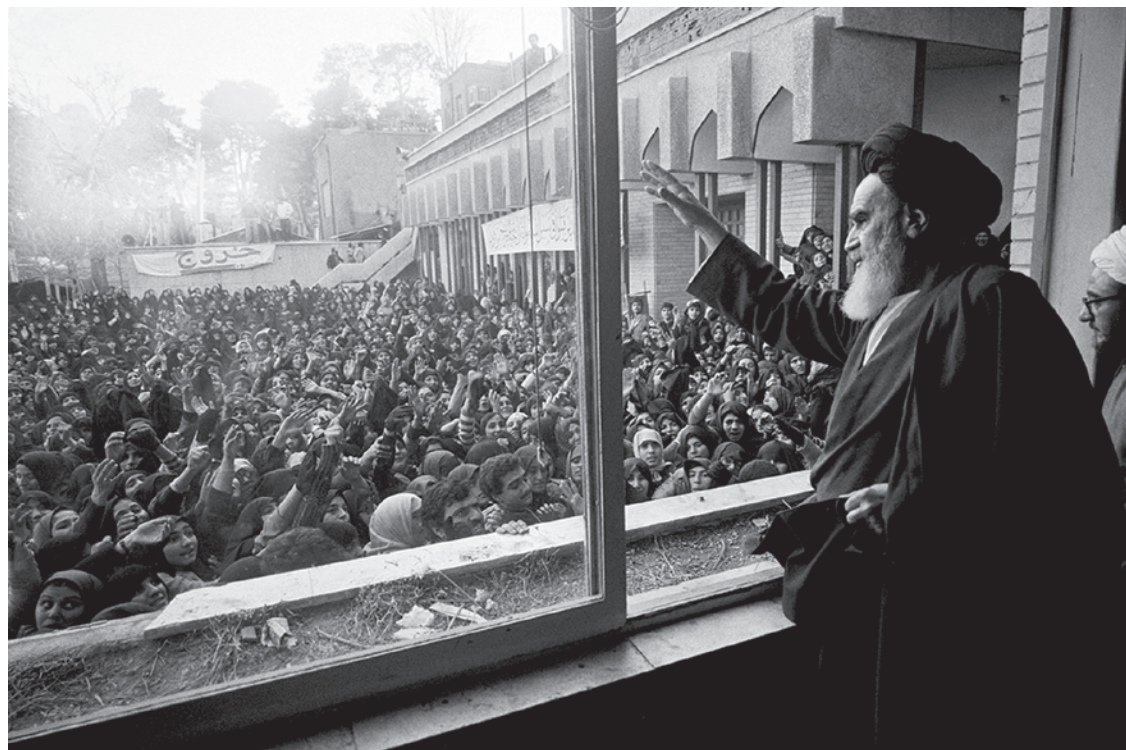
Аятолла Хомейни приветствует своих сторонников