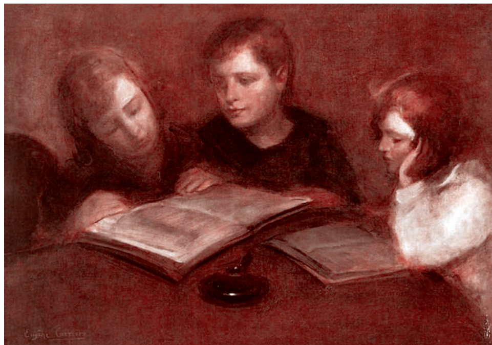
Эжен Каррьер. Девочки за чтением

Это не возвращение к старому, потому что традиционные ценности вне времени. Это просто возвращение нас на путь вневременных ценностей. Только благодаря