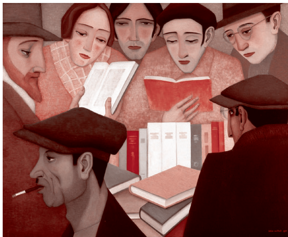
Йохан Ван Хелл. Книжный киоск. 1937

Вот и всё. Я думаю, что очень во многом это результат отсутствия литературы как привычной культуры человека, результат отсутствия чтения классической ли-