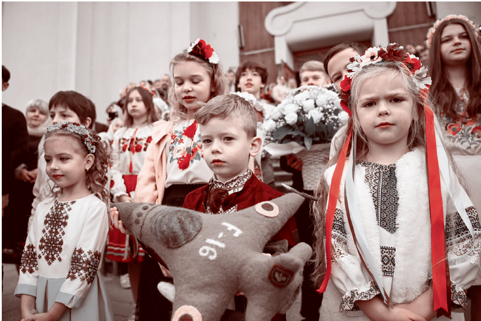
Дети прихожан самозванной Православной церкви Украины молятся о даровании Украине истребителей F-16

с целью захвата этого храма. В «собрании» участвовали представитель Львовского областного совета и «священник» ПЦУ.