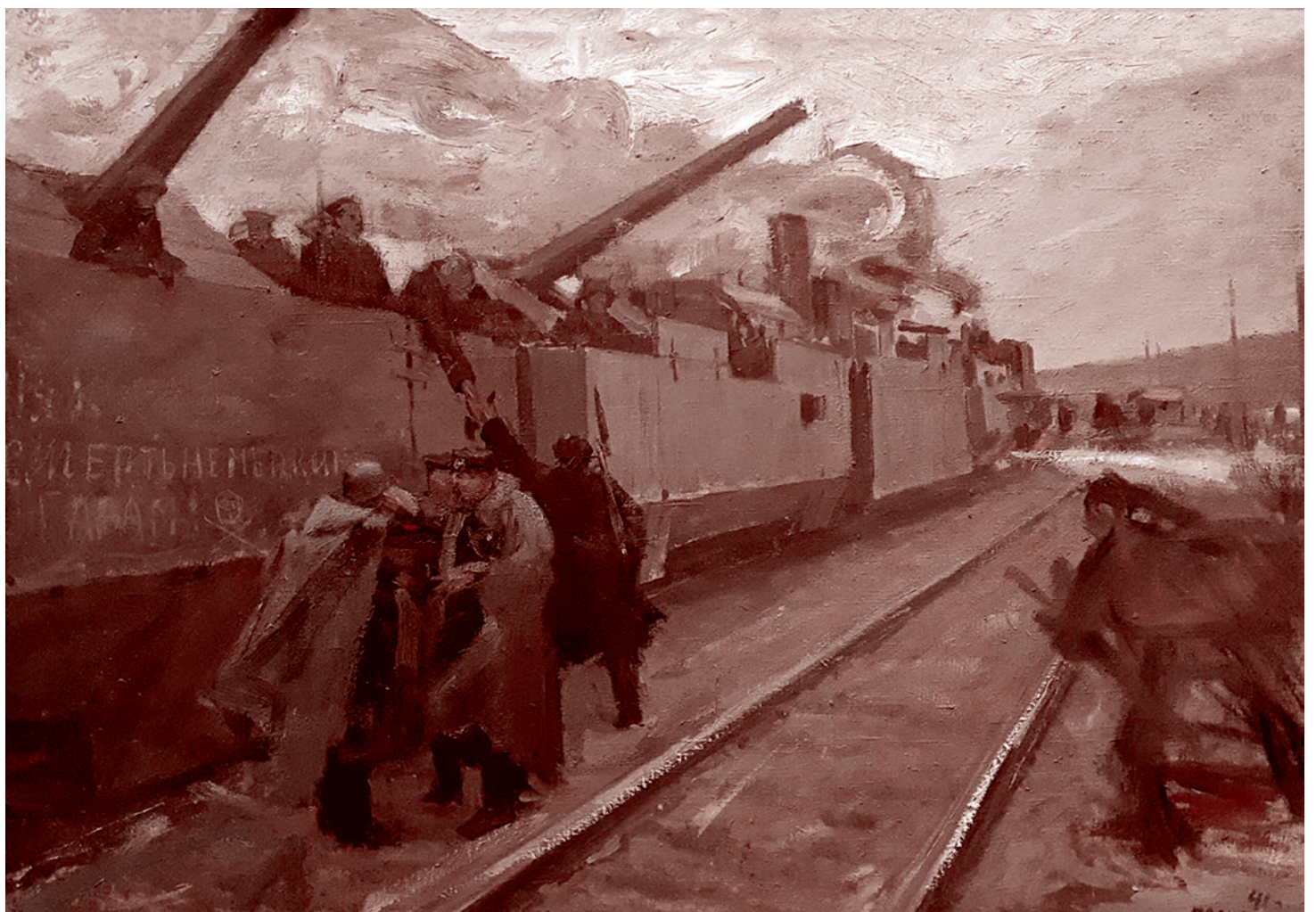
Фёдор Решетников. Бронепоезд «Железник». 1941

Но я знаю, что руководители The New York Times не бываю бывшими, потому что они, помимо всего прочего, всегда церэшники, и что это люди довольно масштабные. И когда начались разговоры о том, что у Японии должно быть ядерное оружие — а это значит, что оно обязательно должно