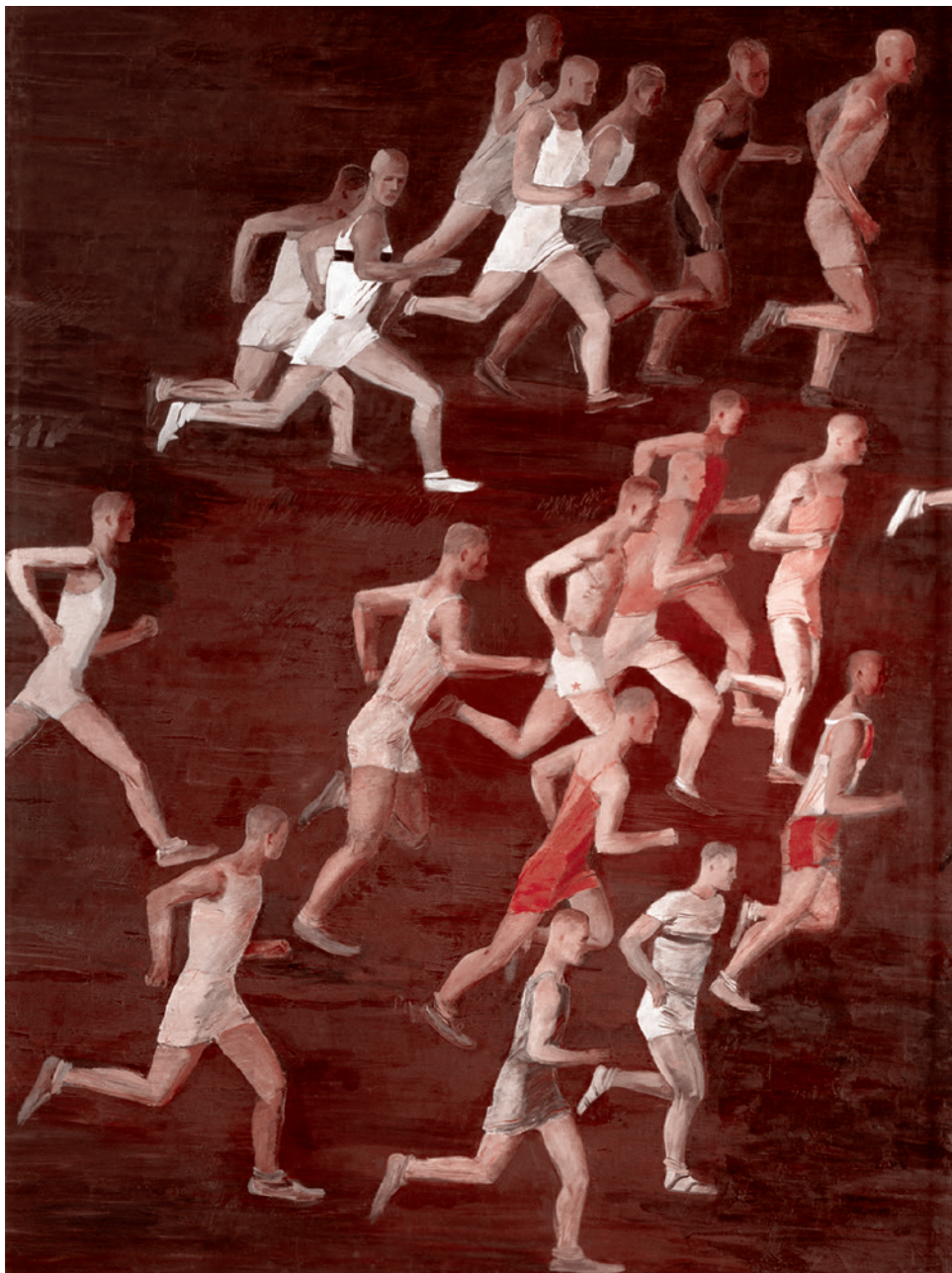
Александр Дейнека. Бег. 1933

Сергей Кургинян: Да, конечно. А как иначе? Глаза боятся, а руки делают!