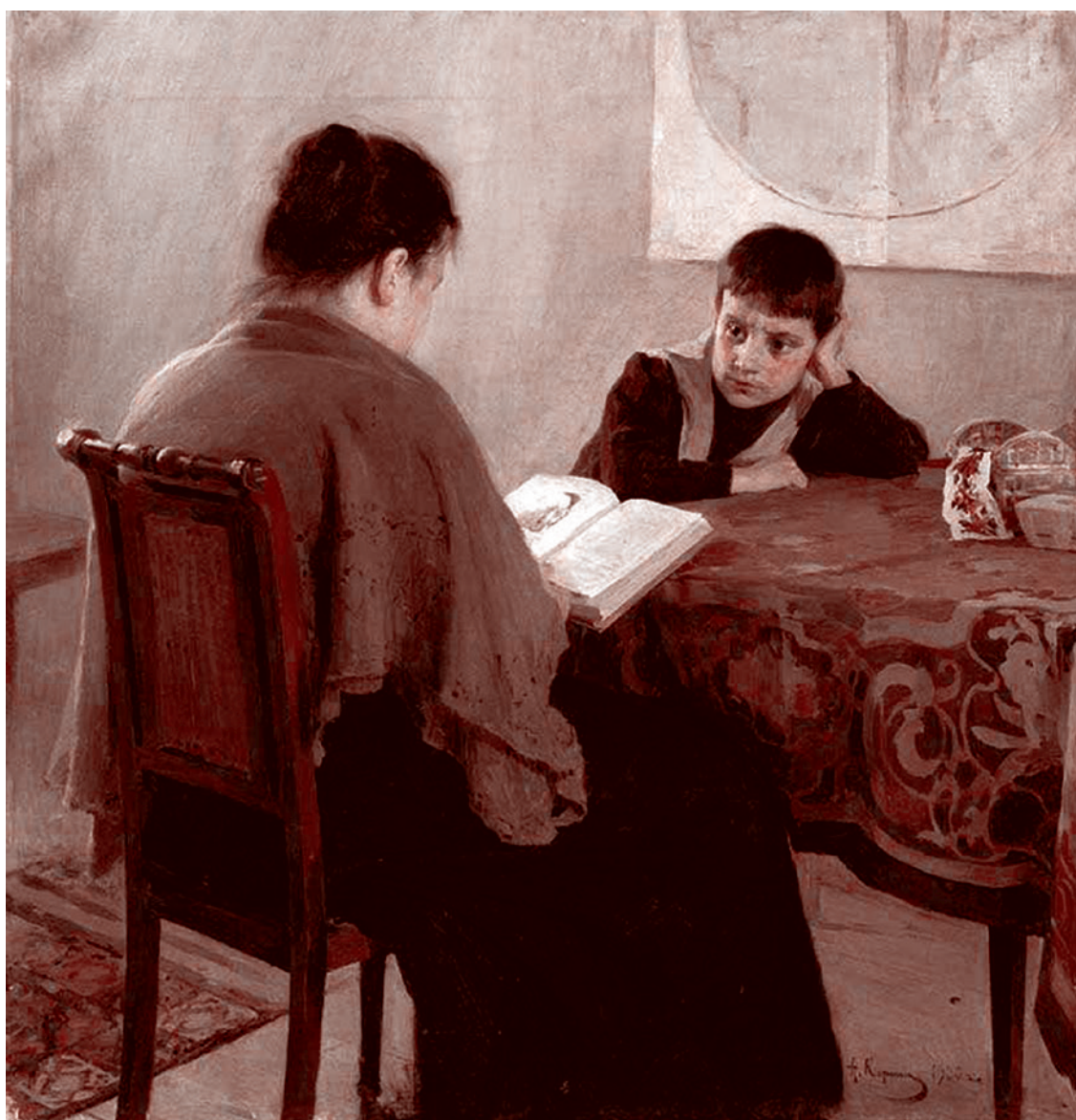
Алексей Корин. За книгой. 1900