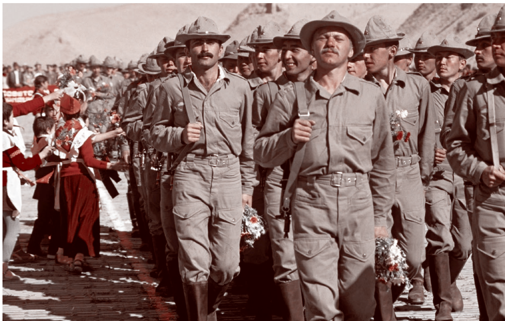
Советские войска в Афганистане

Улучшение ситуации началось только в середине 1980-х годов. В сентябре 1986 года после шестилетнего перерыва возобновила работу Советско-иранская торговая палата. В декабре в Тегеране состоялось X заседание постоянной советско-иранской комиссии по экономическому сотрудничеству.