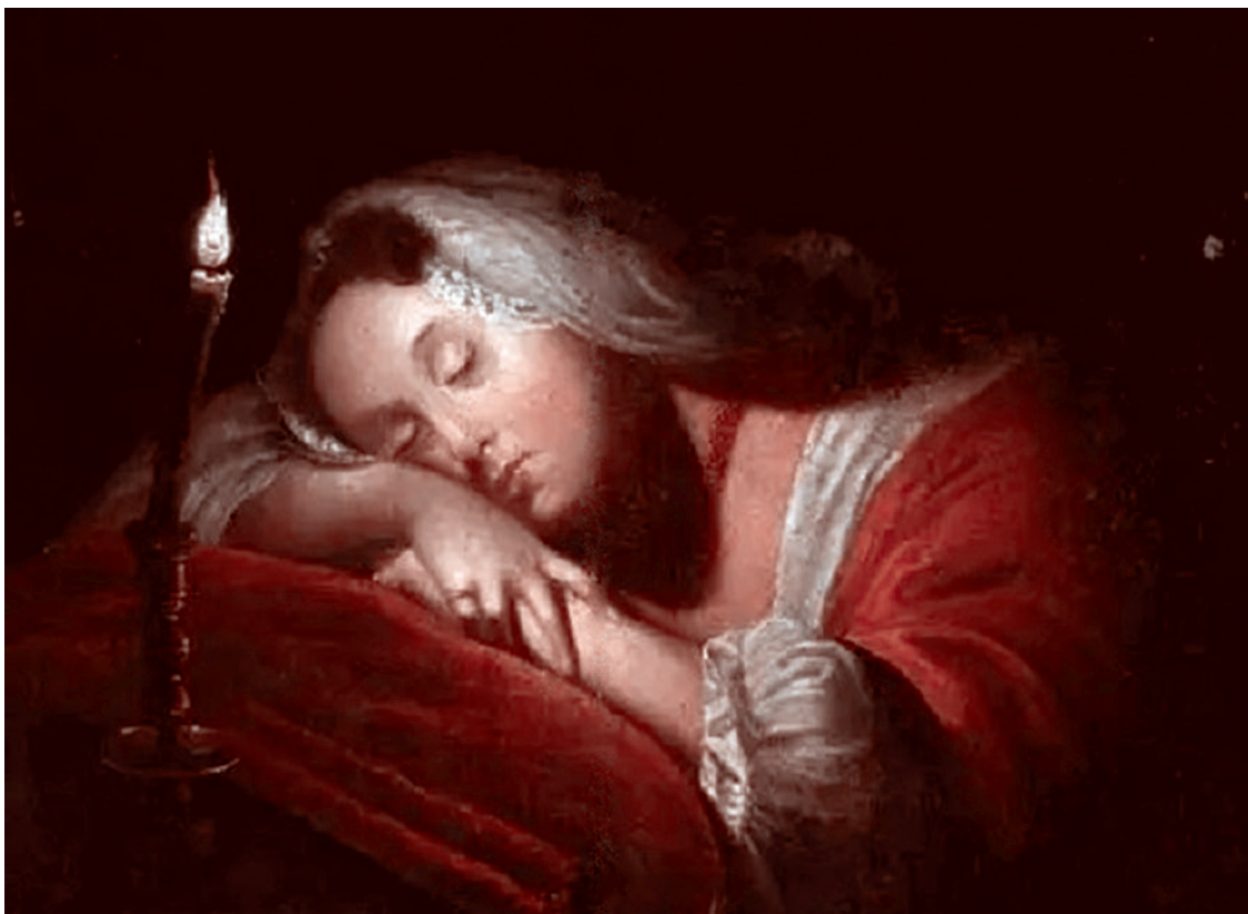
Павел Федотов. Спящая красавица со свечой (фрагмент). 1840-е

Главная империя мира — вот эта глобальная империя под названием США — она, конечно, загнивает, очень сильно загнивает, совершает дикое количество ошибок. Но она не умирает — она корчится. И я хочу сказать дополнительно, что когда она умрет, — а это очень нужный этап развития человечества, — то наступит не тишь да гладь да божья благодать, как кое-кто нас уверяет. Многополярный мир не будет более справедливым. Он не будет волочь в такой ад, в который волочет этот однополярный мир, но там будет дикое количество конфликтов, и неустойчивость будет огромная. Так что готовиться надо к