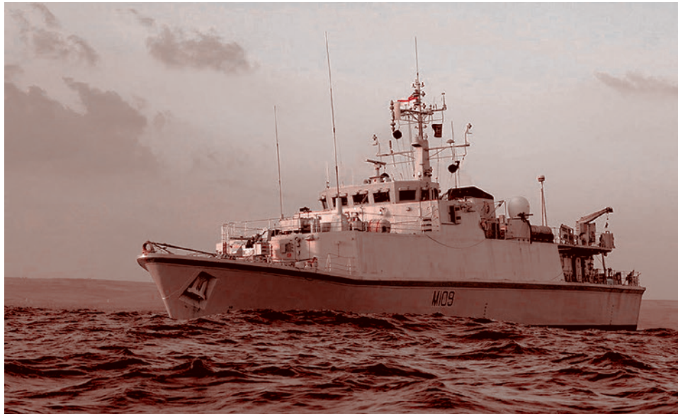
Британский минный тральщик типа Sandown

Турция проинформировала союзников о том, что не пропустит через свои проли-