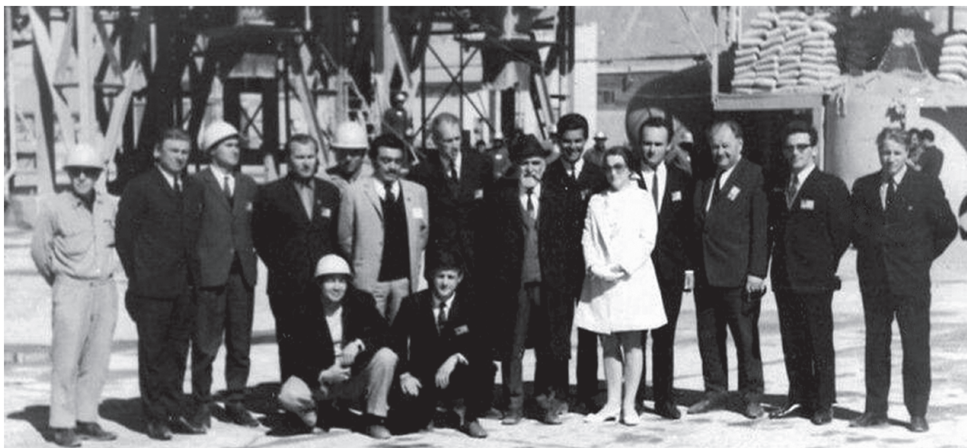
Советские и иранские специалисты на Исфаханском металлургическом заводе