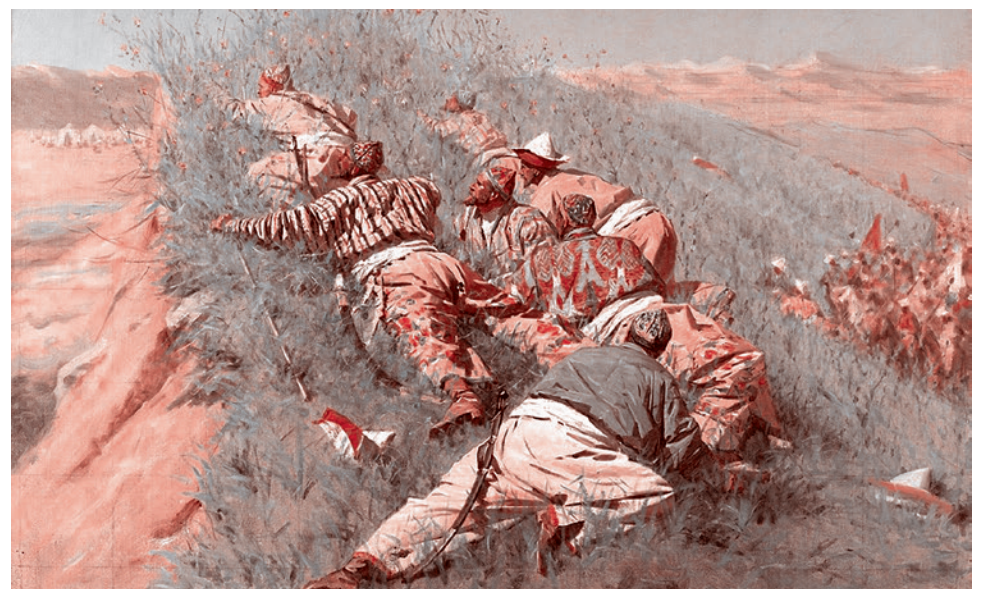
Василий Верещагин. Высматривают. 1873

Газета «Суть времени» зарегистрирована Федеральной службой по надзору в сфере связи, информационных технологий и массовых коммуникаций (Роскомнадзор) Свидетельство ПИ № ФС77-50554 от 9 июля 2012 года