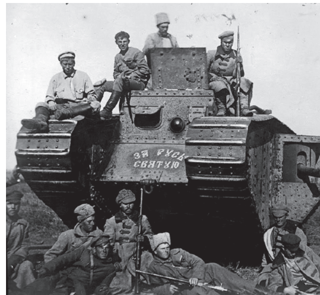
Танк английского производства, захваченный войсками 51-й стрелковой дивизии под Каховкой 14 октября 1920 года