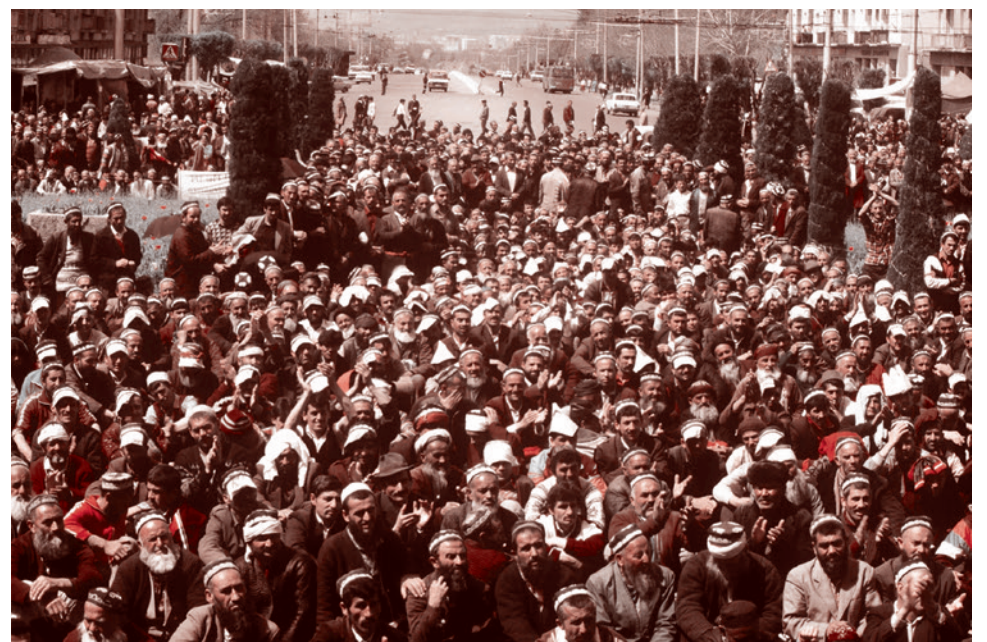
Митинг на площади Шохидон. Таджикистан. 1992