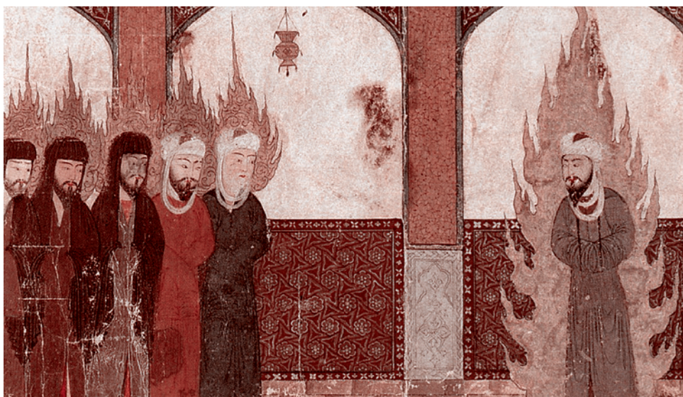
Средневековая персидская рукопись, изображающая Мухаммеда, бедующего молитву Авраама, Моисея и Иисуса