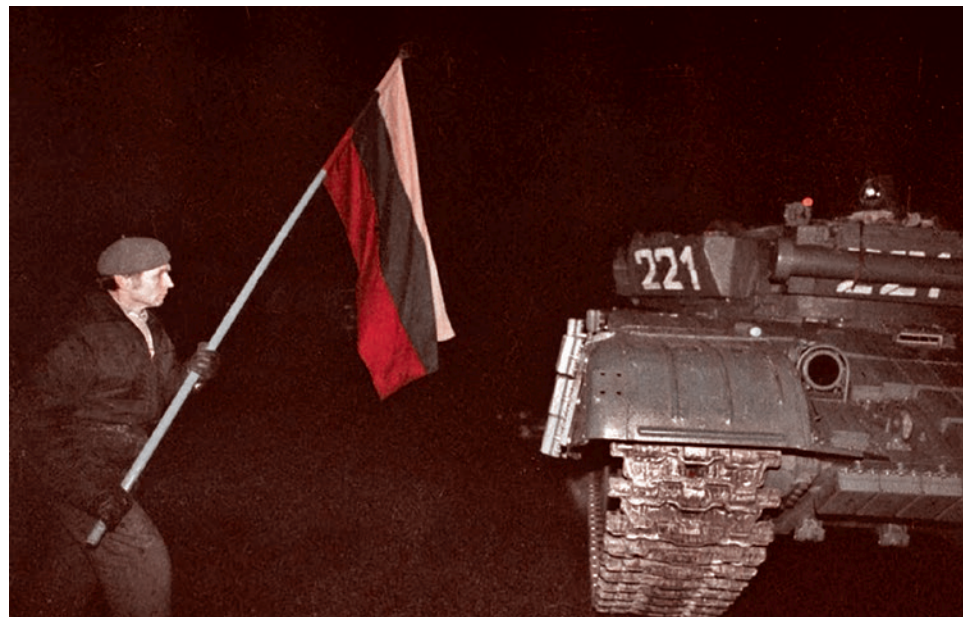
Один из протестующих с литовским триколором в руках около советского танка. Вильнюс. Ночь 13 января 1991 года

И наконец, как проигрывались в эпоху перестройки подобного рода финты? Это делал Михаил Сергеевич Горбачёв. Он как делал? Он войска вводил в Литву и тут же выводил. Залезли — ушли. Вот это и есть специальная игра на проигрыш. Всё, что мы видим сейчас, и всё, что мы знаем по