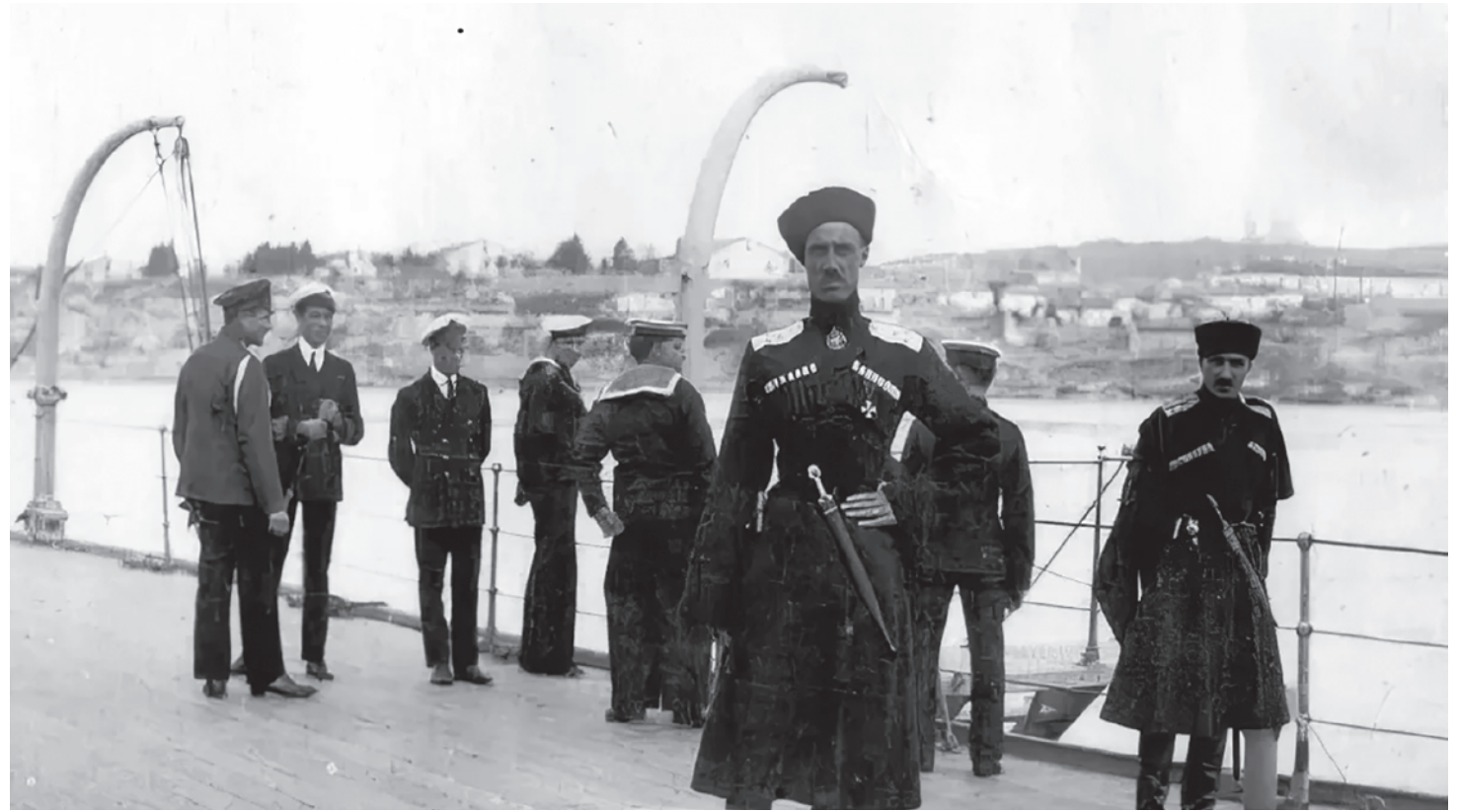
Командующий армией белогвардейцев генерал-лейтенант барон Пётр Врангель

Врангель отмечал, что «хотя в дальнейшем англичане и продолжали чинить нам различные препятствия, но путем личных переговоров в Севастополе, Константинополе и Париже, большинство грузов удавалось, хотя и с трудом, доставлять в Крым». Сомнительно, что при наличии строгого запрета Лондона