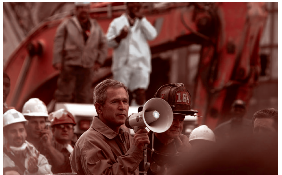
Президент США Джордж Буш обращается к спасателям на площадке Всемирного торгового центра

Тут же папа, Буш-старший, буквально — знаю, что говорю — за эти высказы-