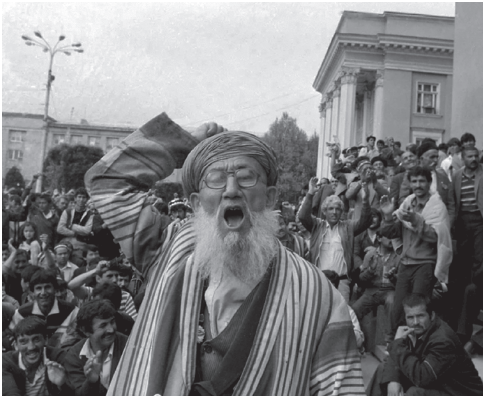
Протесты в Таджикистане. 1992