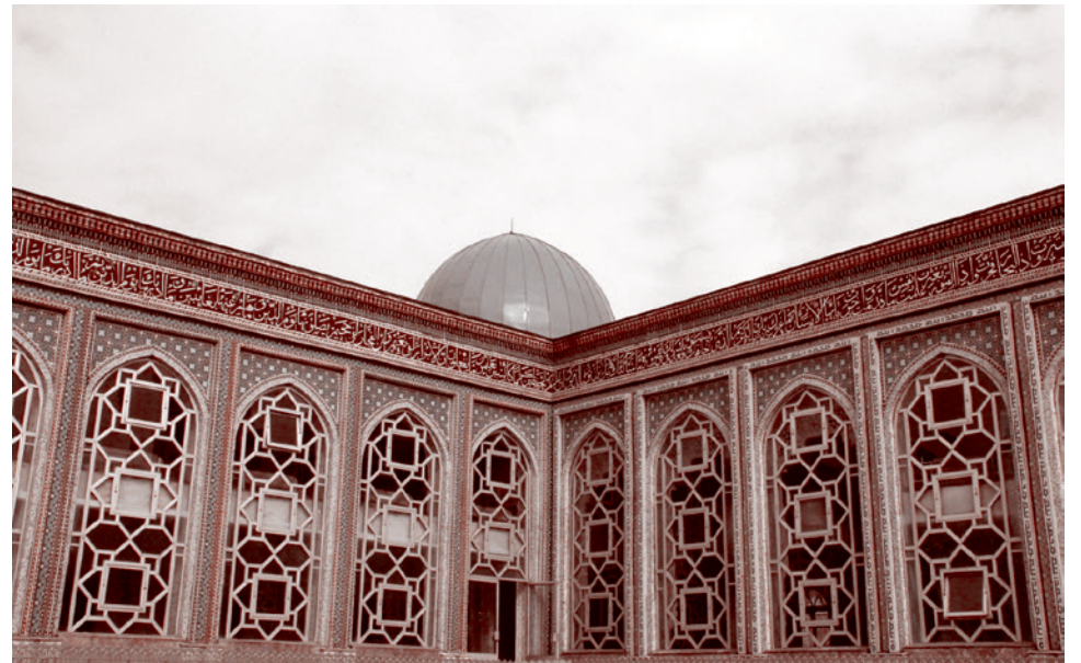
Большая мечеть. Душанбе. Таджикистан

Седьмое. Необходимо бороться за понимание подлинного смысла таджикской трагедии и ее геополитического значения для нашей страны. Надеемся, что эта работа станет скромным вкладом в подоб-