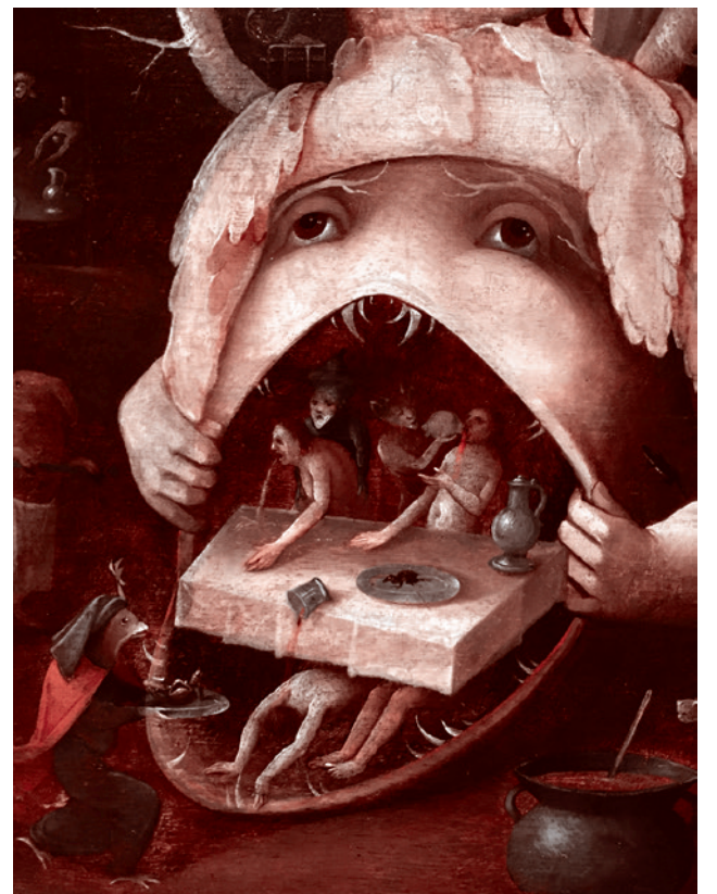
Последователь Иеронима Босха. «Видение Тондейла». Конец 1400

Что происходит, когда человек не очень умен, а должен банковать? Чем он подменяет ум? Это известно: он подменяет его хитростью. Вот это всё мы видим на существующей поляне. Поскольку поляна такая, прошу прощения, дерьмовая, то на ней возможно многое. По этому поводу в одной, может быть, и не слишком хорошей, но в данном случае полезной для понимания песне говорилось: «Никогда ханжой я не был, слышишь, не был, // Но сейчас поверю я в любую небыль».