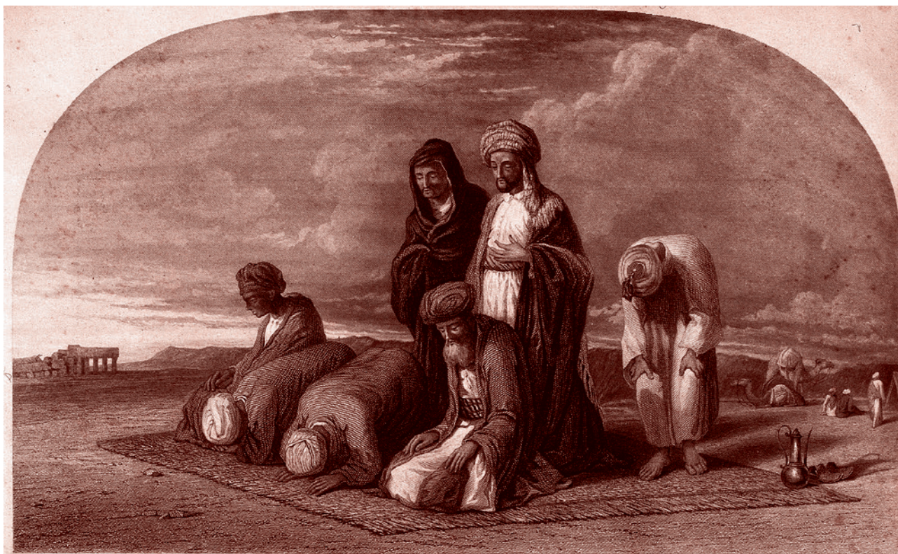
Уильям Джеймс Мюллер. Мусульмане молятся в Мекке. 1899

Ислам — одна из великих мировых религий. Ислам имеет свою модель человека, свои представления о том, что есть благо для человека и всего общества, и как следует жить человеку и всему обществу, чтобы к этому благу приблизиться. Он, как и другие великие мировые религии, обращен к духовной составляющей человека, к тому, чтобы, ответив на вопросы о происхождении, существовании и предназначении человека, способствовать развитию этой духовной составляющей. Можно иметь разные мнения о том, насколько эти представления и методы, которыми они реализуются, соответствуют представлениям и методам других мировых религий, но нельзя не согласиться с тем, что ислам сыграл важную роль в истории развития человечества, создав целую исламскую цивилизацию, состоящую из очень разных и самобытных наро-