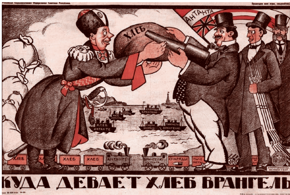
Плакат. Куда дебает хлеб Врангель. 1920