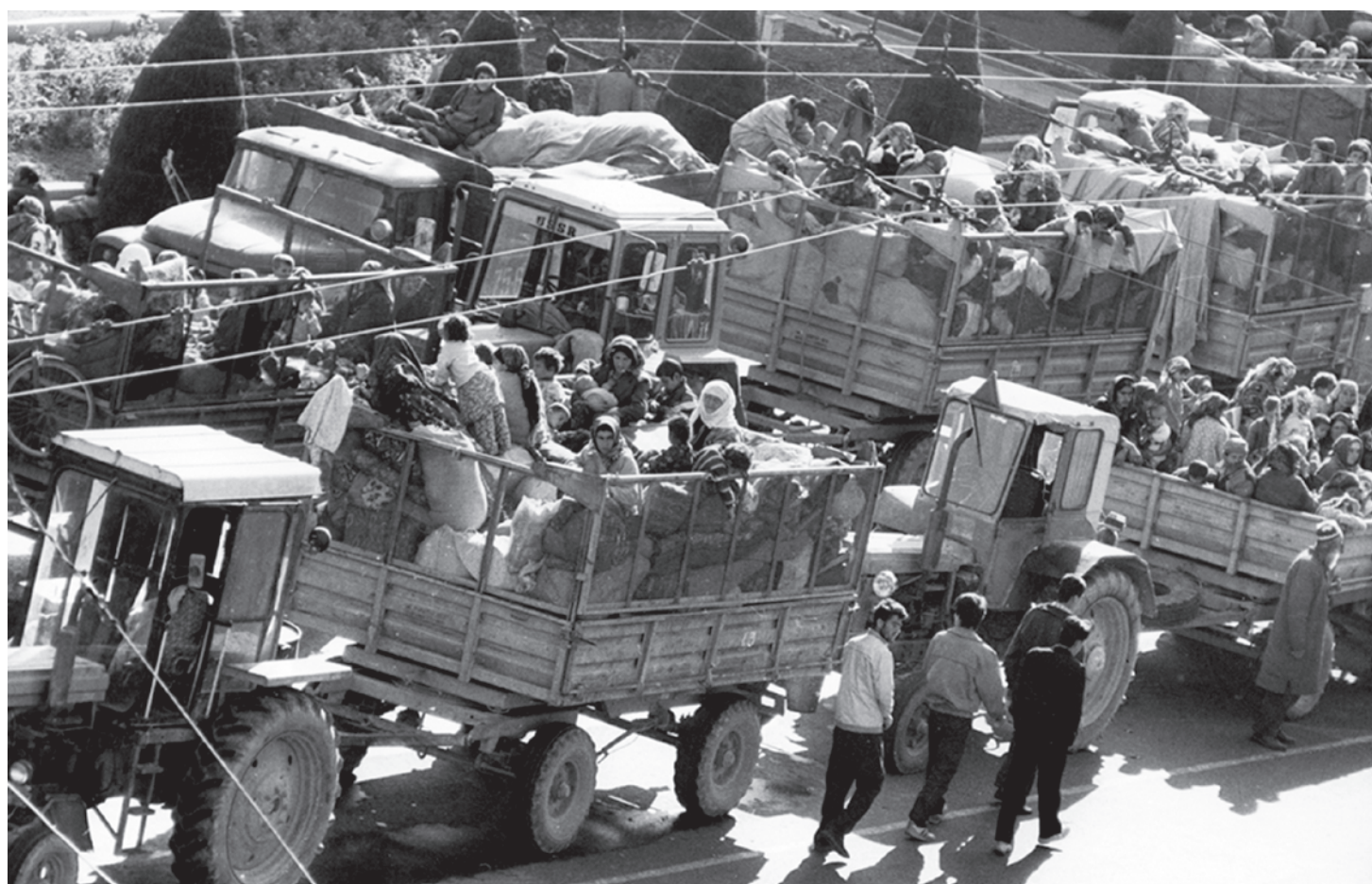
Беженцы из южных районов Таджикистана прибывают в Душанбе на тракторах. 1993

И здесь мы возвращаемся к нашей сценарной гипотезе. Если после всего изложенного мы не сумели убедить политиков различных ориентаций, обеспокоенных судьбой России, судьбой ислама и судьбами мира, что ж, остается ждать развития событий и надеяться на собственную ошибку.