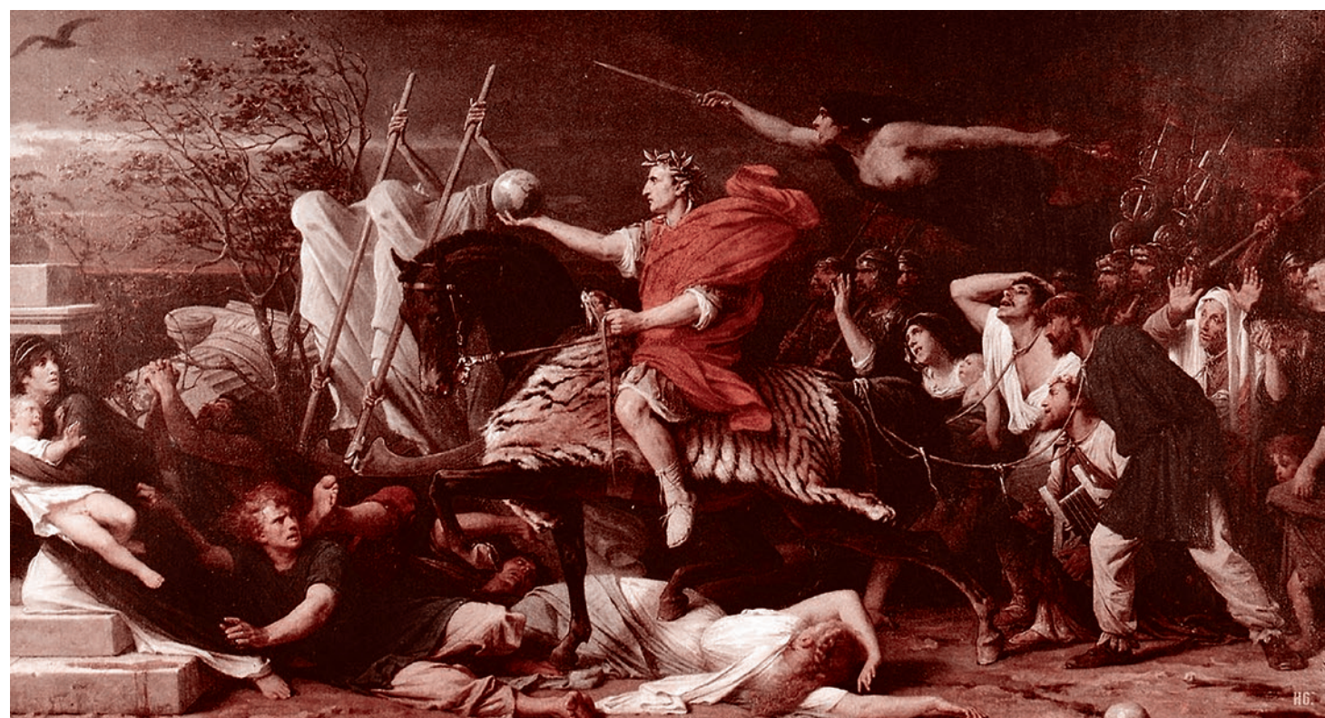
Адольф Ивон. Цезарь пересекает Рубикон. 1875