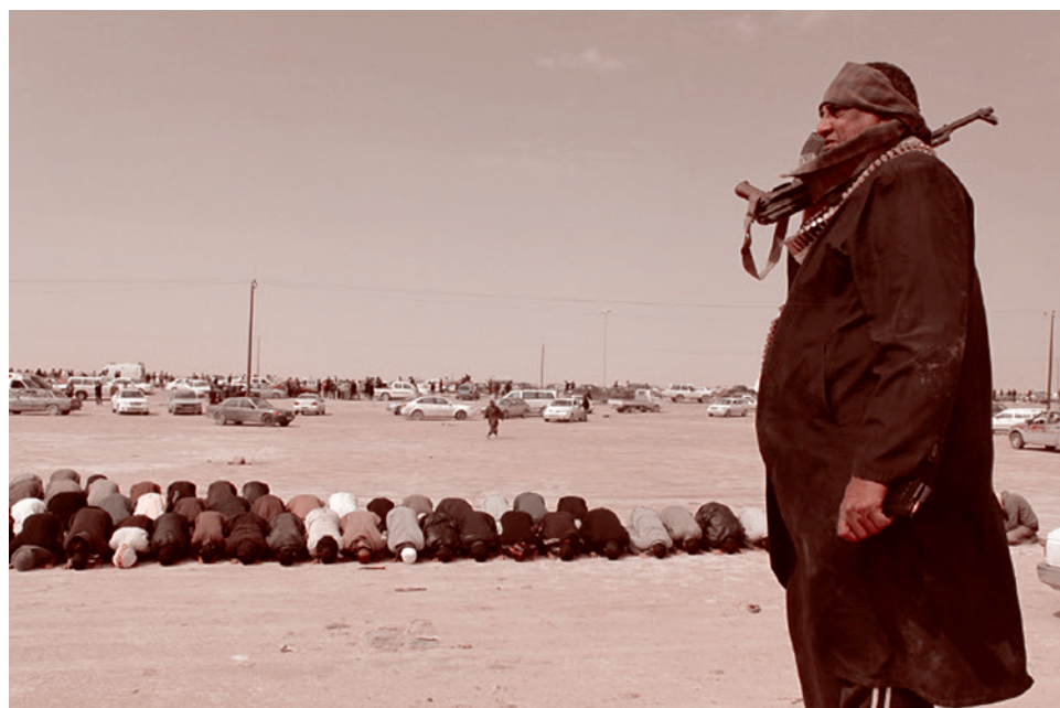
Исламисты в Африке