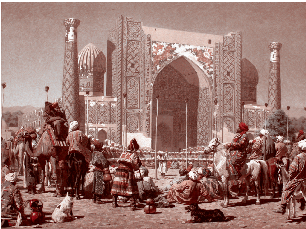
Василий Верещагин. Торжествуют. 1872

Что может помочь исламизму справиться с этой задачей? Прежде всего — отсутствие конкуренции со стороны традиционного для подударных стран ислама, способного поставить под вопрос исламизма на истину в последней инстанции. А также низкий авторитет государственной власти в этих странах (чаще всего вызванный отсутствием жизненных перспектив у молодежи и сильной социальной несправедливостью), когда невозможно оказать поддержку своим религиозным лидерам, не компрометируя их в глазах паствы. А также — предательство управленческих и силовых элит этих государств, решивших «поиграть» с исламизмом в своих интересах. Мы могли наблюдать всё это во время «арабской весны». Там, где религиозные и светские власти не потеряли авторитета у народа, а силовики не предали, «арабская весна» как-то не задалась.