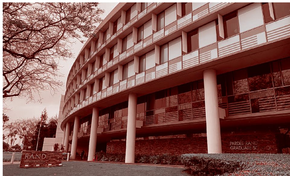
Штаб-квартира RAND Corporation в Санта-Монике

Сергей Кургинян: Когда-то давно вместе с одним преподавателем, еще в институте, мы занимались стратегической теорией игр. А преподаватель был очень талантливый. И на каком-то этапе его пригласили работать в военное ведомство. Он там начал показывать, что вот строишь математическую модель войны, и возникает линия фронта в виде всюду разрывной функции, на что какой-то генерал сказал, ну вот в этих местах и надо рвать фронты.