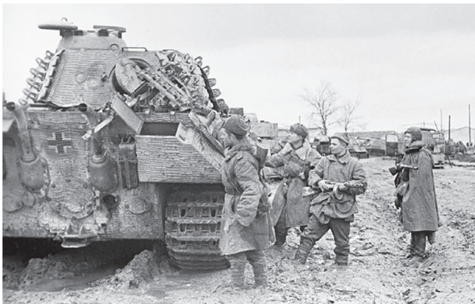
Корсунь-Шевченковская операция. Советские солдаты осматривают захваченный в Умани танк «Пантера». 10 марта 1944 года

Начали моделировать все прежние операции. Могу сказать, что с точки зрения математики Корсунь-Шевченковская операция оказалась самой оптимальной. Сидел этот слегка поддатый преподаватель — военнообязанный, но не в погонах еще, — а рядом сидел трехзвездный генерал, который, посмотрев на все эти модели, сказал, что вот тут надо бы провести эксперимент. И преподаватель понял, что экспериментом называется ядерная война, после чего быстренько отманеврировал назад, в гражданскую сферу.