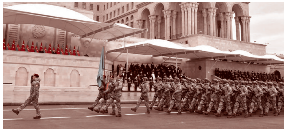
Бойцы «Яшмы» проходят перед президентами Азербайджана и Турции на Параде Победы по случаю победы Азербайджана в войне в Нагорном Карабахе. 10 декабря 2020 года. Баку

территориях» Украины. Наш МИД на это, слава богу, наконец-то хоть как-то отреагировал. До этого мы не давали никакой реакции на их поведение. А в чем оно выражалось? Сначала придумали неких борцов за охрану природы, протестовавших против разработки каких-то рудников, которых никто не разрабатывает. Начали блокировать наших миротворцев. Ну, а у миротворцев функции-то ограниченные, они не имеют права применять оружие. Хотя пара очередей над головами защитников природы могла бы привести тех в чувство. Вполне. Но этого сделано не было.