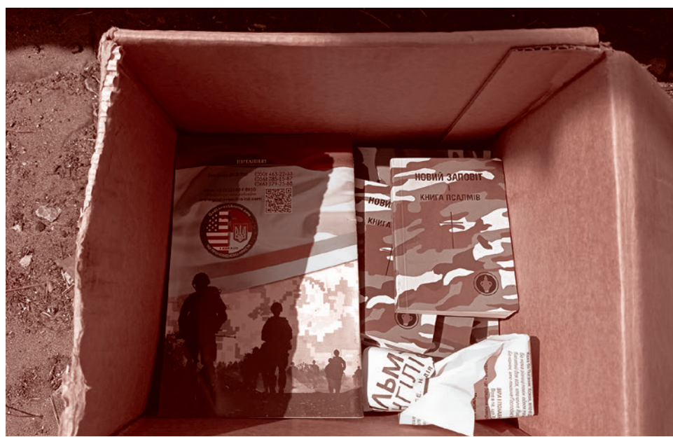
Агитационные боевой листок ВСУ и завет секты Гедион

Корр.: Расскажи, в каком формате сейчас работает ваша библиотека в Донецке?