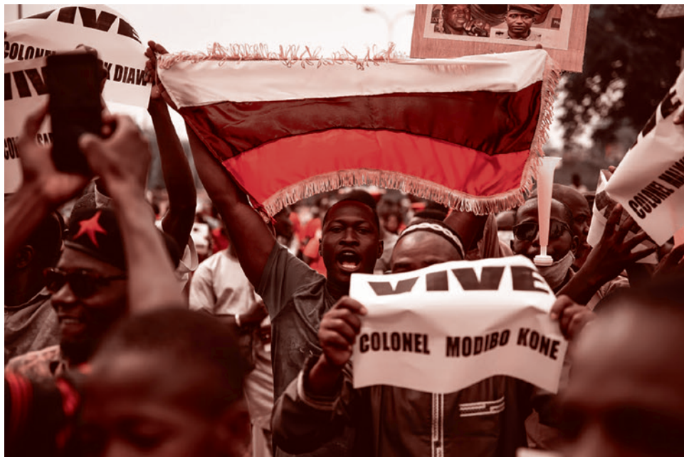
Протесты в Мали