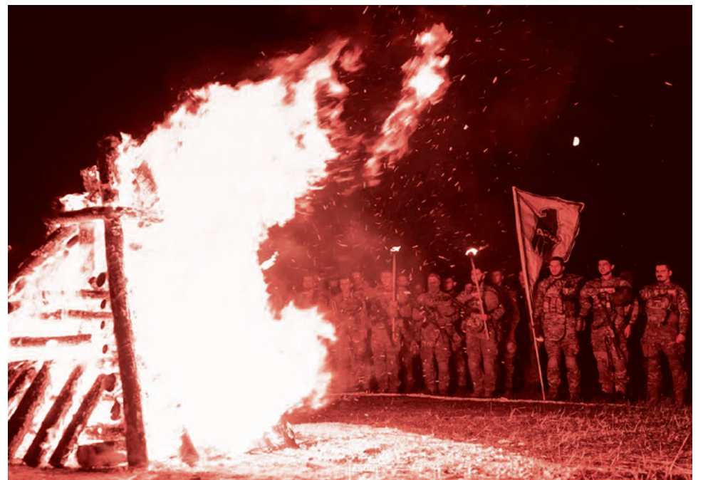
Украинский нацбатальон проводит магический ритуал в «день осеннего равноденствия», 22 сентября 2023

У Украины нет экономики, у Украины нет своего военно-промышленного комплекса. Украина превращена в милитаризованное гетто. Главный ресурс, который она продает, — это пушечное мясо. Это пушечное мясо есть, оно в цене, им управляют бандиты и клоуны. Над ними стоит вот эта сосредоточенная ненавидящая, по-настоящему нацистская группа. Она большая, то есть она составляет примерно 2% населения. Она властвует как хочет. Над этим стоят западные группы. Всё, Украины как суверенного государства нет, я не знаю ни одного человека, который считает, что она есть, ни одного. Может быть, президент этой Украины настолько сильно стимулирует себя известными веществами, что ему снится суверенитет, но его — нет.