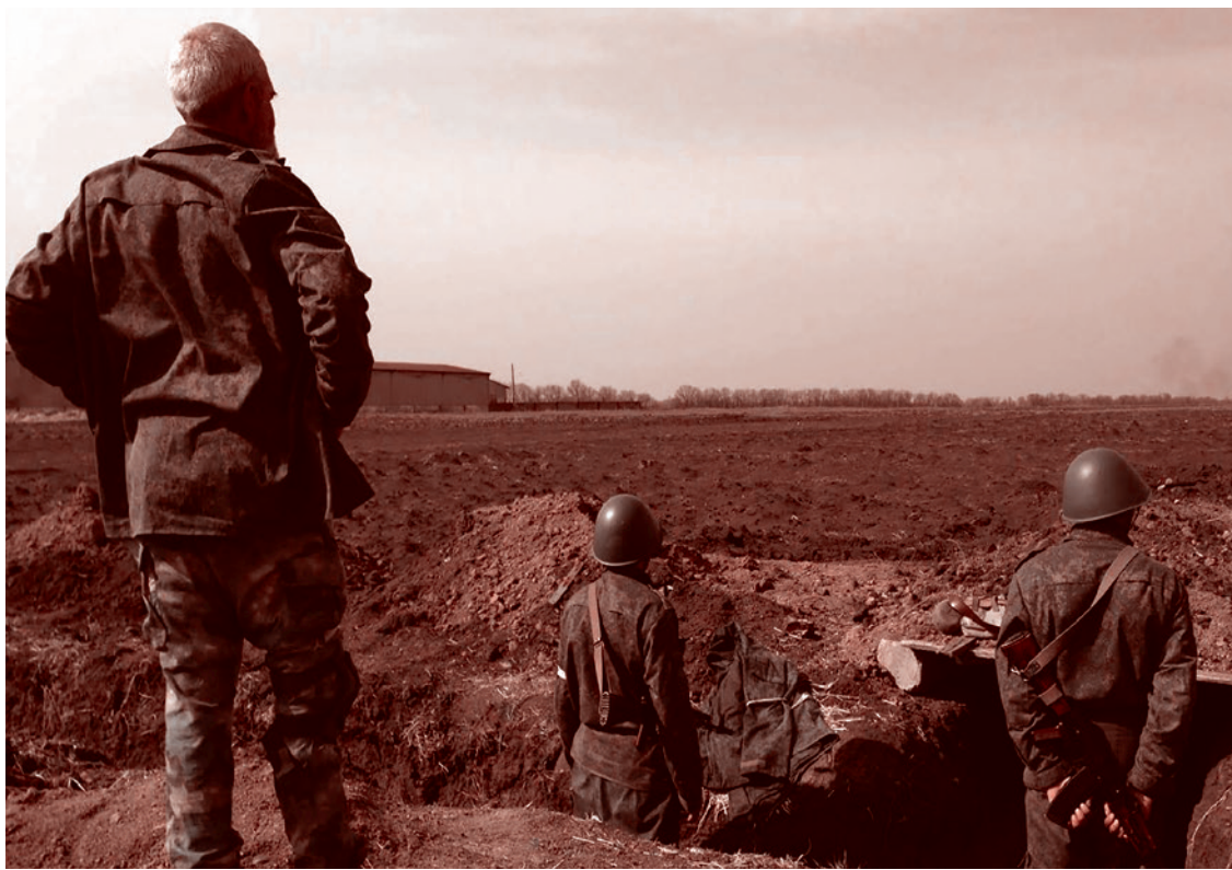
Картины войны. ДНР