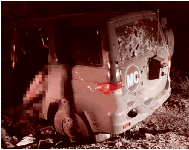
Машина Российского миротворческого контингента (РМК), расстрелянная азербайджанскими военными

спецназа «Яшма», который брал Шушу, был лезгин — полковник. Правда, потом его начали преследовать азербайджанцы, пытались подделывать победу под себя. Тем не менее часть нацменьшинств нетюркского происхождения поддалась азербайджанской агитации: какой-то взлет у них был из-за победы и ее празднования. Праздновали специфически, правда, и мыслительные процессы в этих головах своеобразные. Размещая на параде флаги государств, которые помогли одержать победу, — а это были Турция, Пакистан и Израиль — они поставили пакистанский флаг рядом с флагом Израиля. Что для пакистанцев было жутким оскорблением.