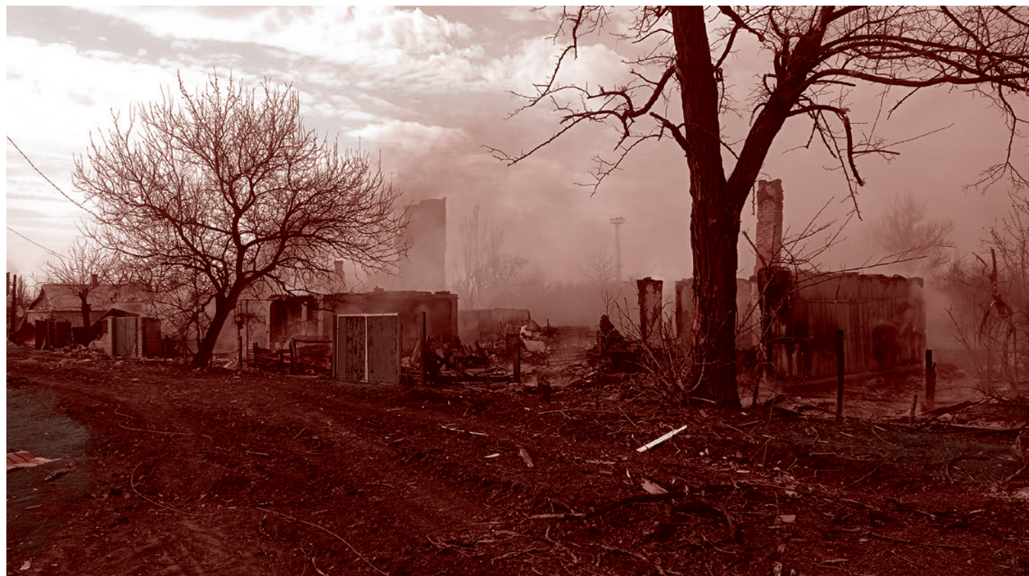
Разрушения после боев. ДНР