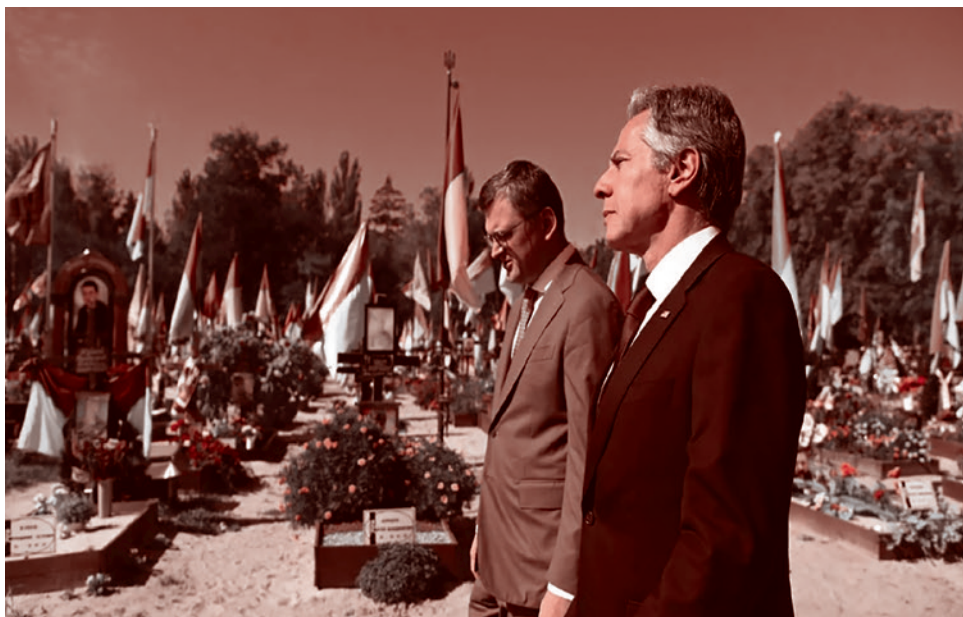
Госсекретарь США Антони Блинкен в ходе посещения Киева

Работино взято и так далее, — они никоим образом не имеют отношения к тому, что планировалось. Там близко не пахнет ничем сокрушительным, никакой фронт никто не прорвал, никакой дезорганизации нет. Идет позиционная война на истощение: туда, сюда, здесь, там и так далее.