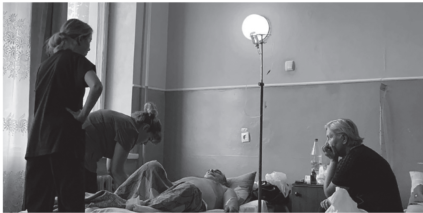
Картины войны. ДНР

Газета «Суть времени» зарегистрирована Федеральной службой по надзору в сфере связи, информационных технологий и массовых коммуникаций (Роскомнадзор) Свидетельство ПИ № ФС77-50554 от 9 июля 2012 года