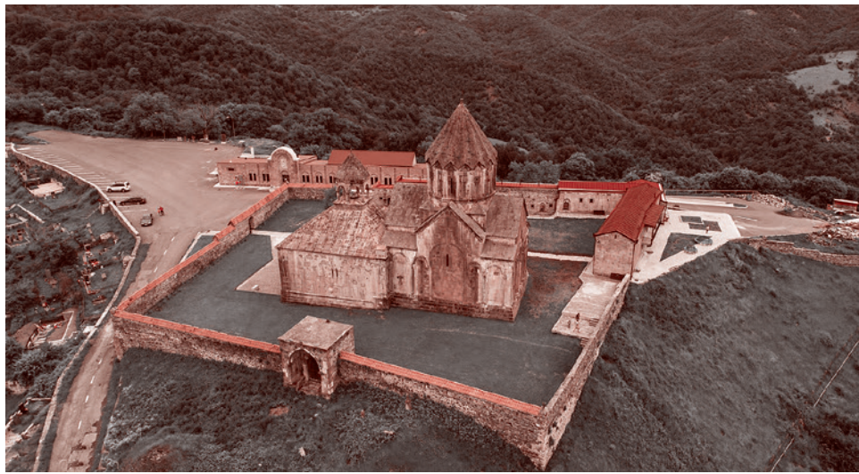
Гандзасарский монастырь в Нагорном Карабахе

нечно, предстоит выяснить в совместной российско-азербайджанской комиссии, надо выявить, кто стрелял, кто нанес удар, и наказать виновных. Потому что миротворцы не подлежат атаке в любом случае, тем более что, как только Армения избрала вот этот смертельный для себя путь — признание территориальной целостности Азербайджана с включением Карабаха в его состав — характер миротворческой миссии изменился. Они вооружены только легким оружием, то есть неспособны, не могут даже чисто технически проводить серьезные военные действия. Они могут только сдерживать силы тех или иных сторон.