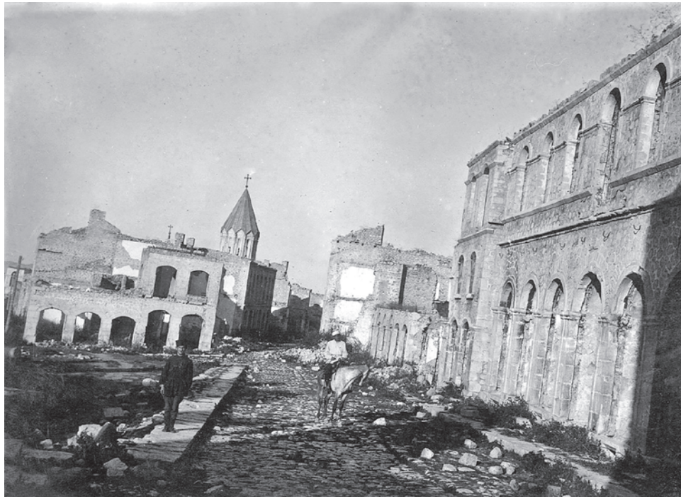
Руины Шуши после резни, 1920

Что происходило до этого? Почему я так настроен? Потому что мне хорошо известны предыдущие конфликты, которые шли между армянами и кавказскими турками, или кавказскими татарами, как прежде называли в России азербайджанцев (кавказские татары, татары, бакинские татары и так далее). Первая резня была в 1904 году, когда были вырезаны армянские кварталы в городе Шуше. Эти кварта-