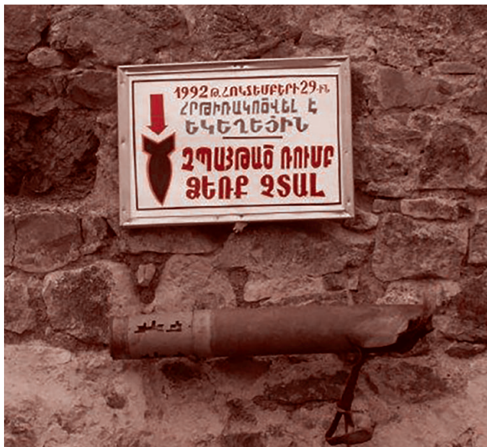
Внешняя стена Гандзасара. 2005 год. Надпись на армянском на табличке — «Церковь была обстреляна 29 октября 1992 года. Невзорвавшийся снаряд. Руками не трогать»