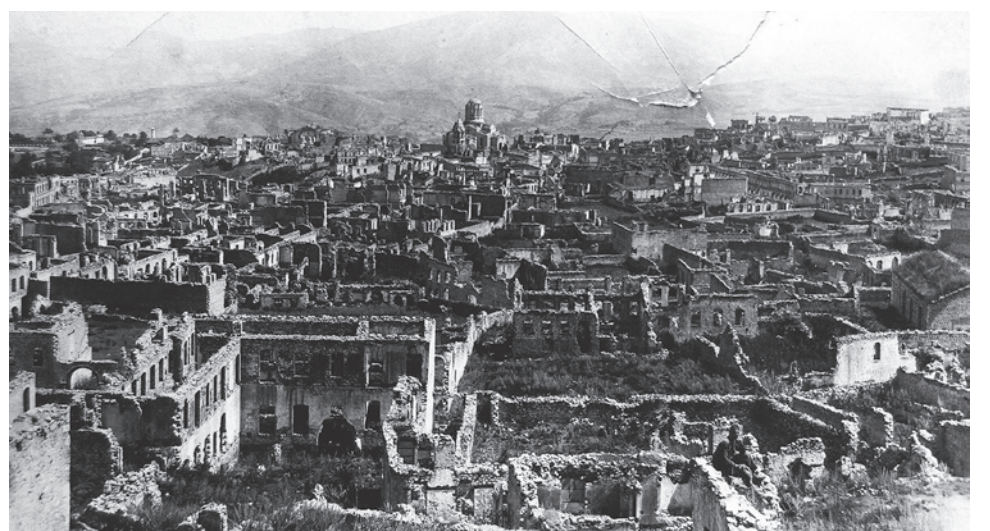
Армянские кварталы города, разрушенные азербайджанскими вооруженными силами в марте 1920 года