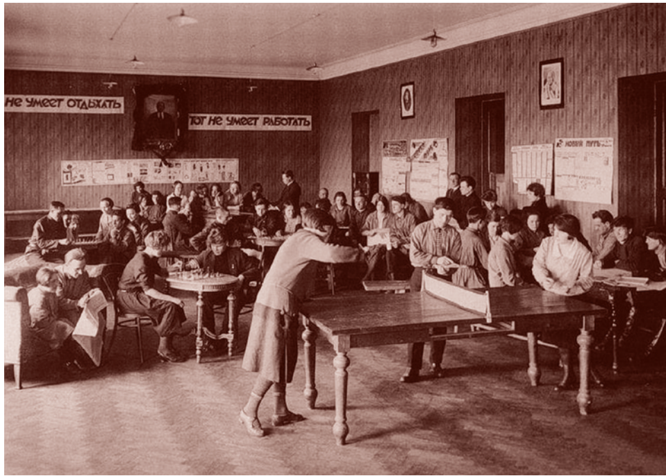
В комнате отдыха жилищно-бытового кооператива на Адмиралтейской наб., 1927–28 г.

Недавно в СМИ было заявлено о запуске проекта «Россия удивляет», который, используя статистическую и социологическую информацию, должен давать объективную картину темпов и направлений развития страны за последние 10–15 лет. Авторы проекта (ВЦИОМ, Фонд «Общественное мнение», Институт маркетинга «ГФК-Русь» при поддержке Института социально-экономических и политических исследований ИСЭПИ) намерены развеять негативные мифы и вымыслы о России.