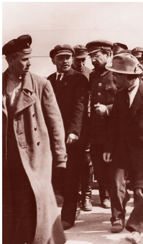
Ленин и Луначарский, 1920 г.

И уже на Втором Конгрессе Коминтерна в Москве в 1920 году (после встречи делегатов Коминтерна и лидеров Пролеткульта)