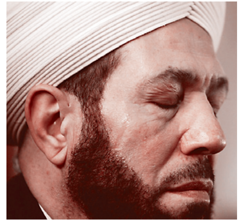
Верховный муфтий Сирии Ахмад Бадреддин Хассун

Между тем армия моджахедов в Сирии растет. Как заявил в конце октября побывавший в Москве верховный муфтий Сирии Ахмад Бадреддин Хассун, правительственные