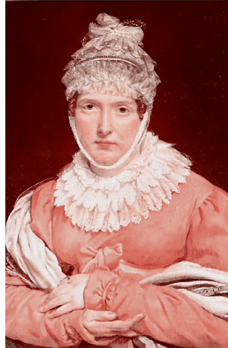
Жан-Луи Гро. Портрет Жюли Рекамье (1825)

Но пусть читатель сходу не пытается негодовать по поводу словосочетания «гуманистический туман». По поводу того, что этот туман называют серым и гнилым. Что именно под воздействием этого тумана, по утверждению Блока, не только увяла плоть, но и погас дух (как мы видим, ключевой вопрос о погашении духа волновал великого поэта столетия назад ничуть не меньше, чем он волнует нас сейчас). Пусть читатель сначала обратит внимание на ключевую мысль Блока, согласно которой есть он, этот вполне земной демиург, ведающий и управляющий марионетками всех стран (то есть правительствами) и сознательно насылающий на народы этот туман.