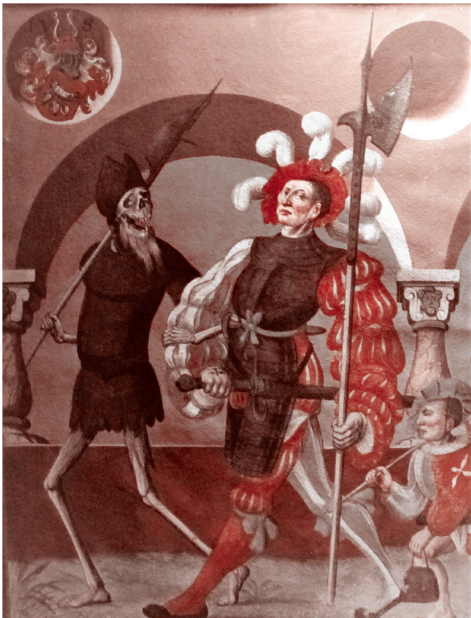
Альбрехт Дюрер. Наемник и смерть. Фрагмент картины «Смерть, наемник и проститутка» из цикла «Танец смерти». 1649

ступление президента Российской Федерации, Верховного главнокомандующего Владимира Владимировича Путина». Как говорится, что написано пером — не вырубишь топором. Владимир Владимирович дал свою оценку происходящему. Что в таких ситуациях особенно важно, — оценка эта достаточно жесткая, без полутонов.