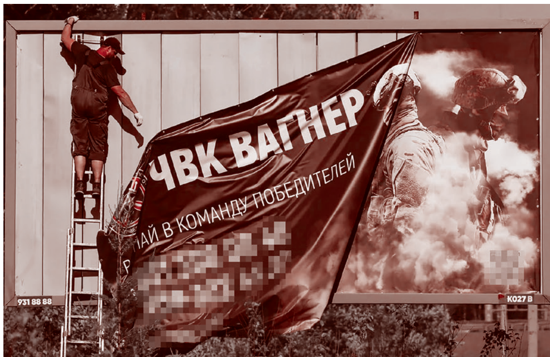
Рабочий снимает баннер, рекламирующий службу в частной наемной группе «Вагнер», на окраине Санкт-Петербурга

Он подчеркнул, что сейчас нет необходимости в форсированной отправке добровольцев на фронт. «Во-первых, хочу отметить их высочайшую мотивацию, они, как добровольцы, естественно, рвутся в бой, но мы не можем этого делать, крайней необходимости в этом нет. А второе — они должны пройти серьезную подготовку, чем собственно и занимаются на восьми полигонах. С ними занимаются 645 инструкторов», — доложил министр.