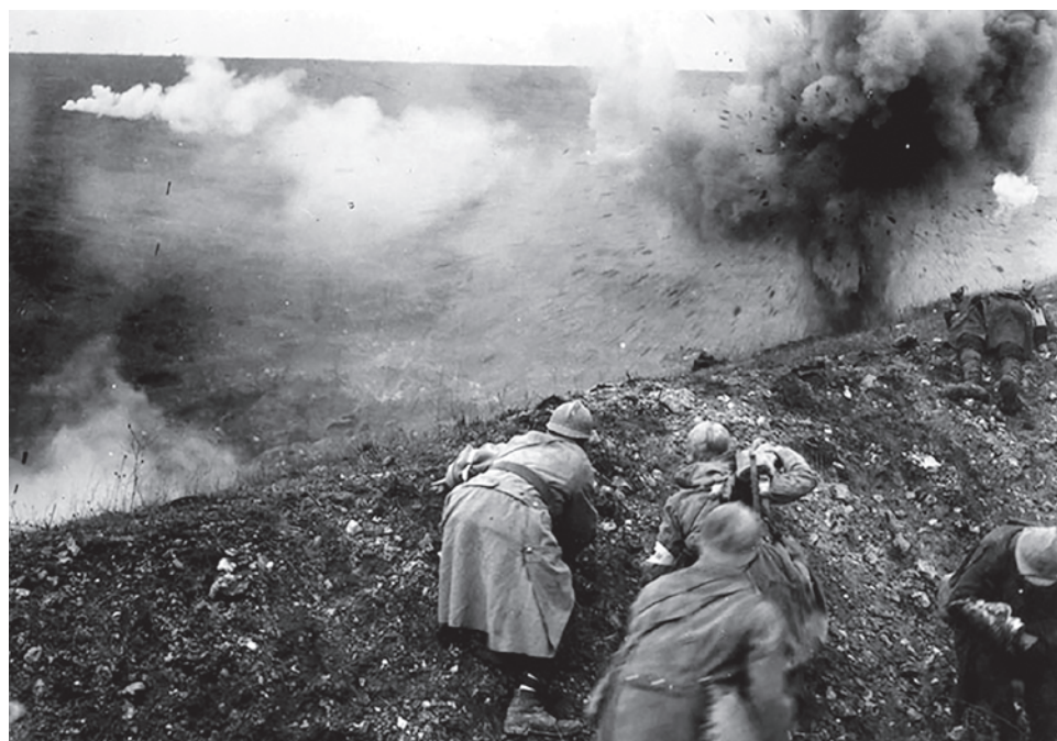
Битва под Верденом