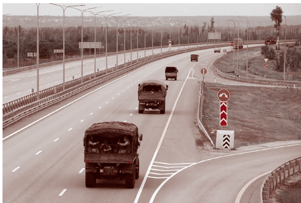
Военная колонна частной группы наемников «Вагнер» движется по трассе М-4, недалеко от Воронежа

Анна Шафран: Сергей Ервандович, к вопросу о модели взаимоотношений общества и государства. Мы же должны себе отдавать отчет в том, что та модель управления, которую пытались выстраивать от-