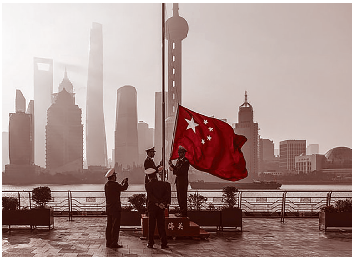
Поднятие флага. Китай

Мы проиграли Первую мировую не потому, что завелись на войне смутяны. Ленин был достаточно ничтожной силой в феврале 1917 года. Если уж кто монархию и сносил, так это кадеты и прочие крупнейшие партии, все эти военно-промышленные комитеты, все эти родзянки и так далее. Но они-то потом ничего не построили. Огромный урок состоит в том, что когда наша русская буржуазия — в отличие от французской в 1789 году — берет власть, как в феврале 1917-го, она как корова на льду, она не умеет с этой властью обращаться так, как обращалось Законодательное собрание Франции в 1789