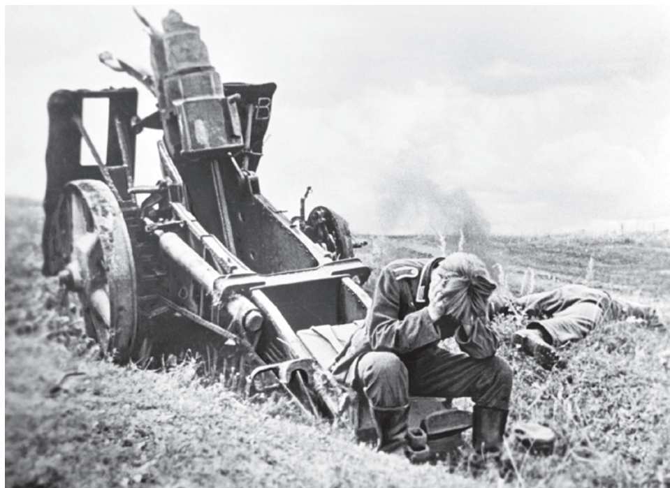
Немецкий солдат на Курской дуге у разбитой пушки. 1943

То, что сейчас нужно было бы — это союз почитателей Деникина и Буденного. Это противоречие надо было бы каким-то способом сложить в определенный консенсус, который создаст абсолютную непрерывность нашей традиции. И отбросит из нее коллаборационистов — тех, для кого идеология, способ существования их Отечества — выше самого Отечества.