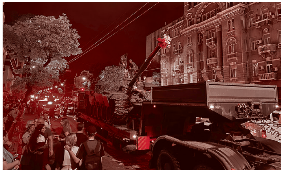
Танк с цветами в пушке на Будёновском проспекте в Ростове-на-Дону после окончания мятежа