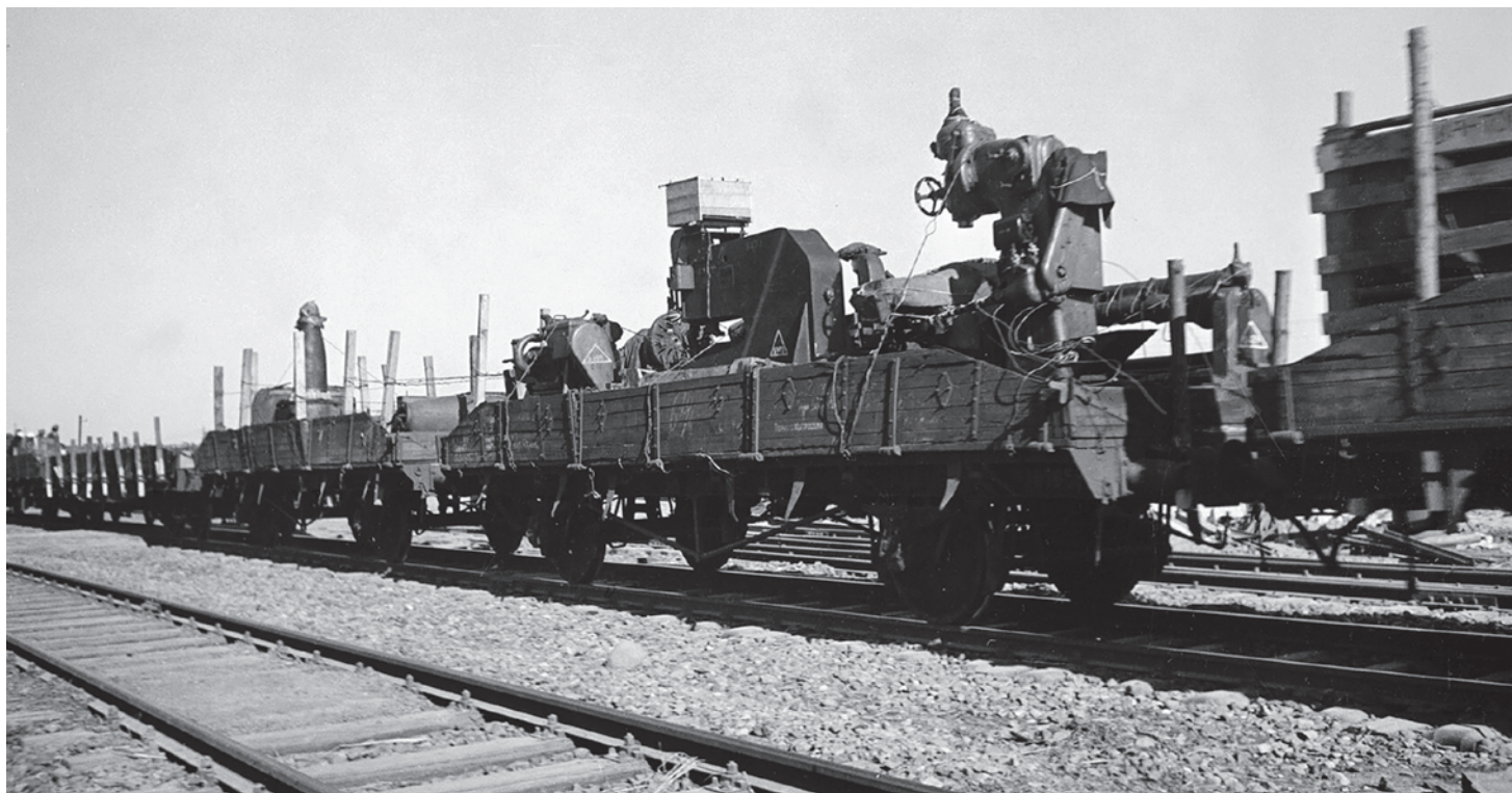
Поезд с эвакуированным оборудованием завода идет на восток. 1941

были тотально военными, люди воевали по 40 лет, уже невозможно было — при условии большего или меньшего технического соответствия — их победить.