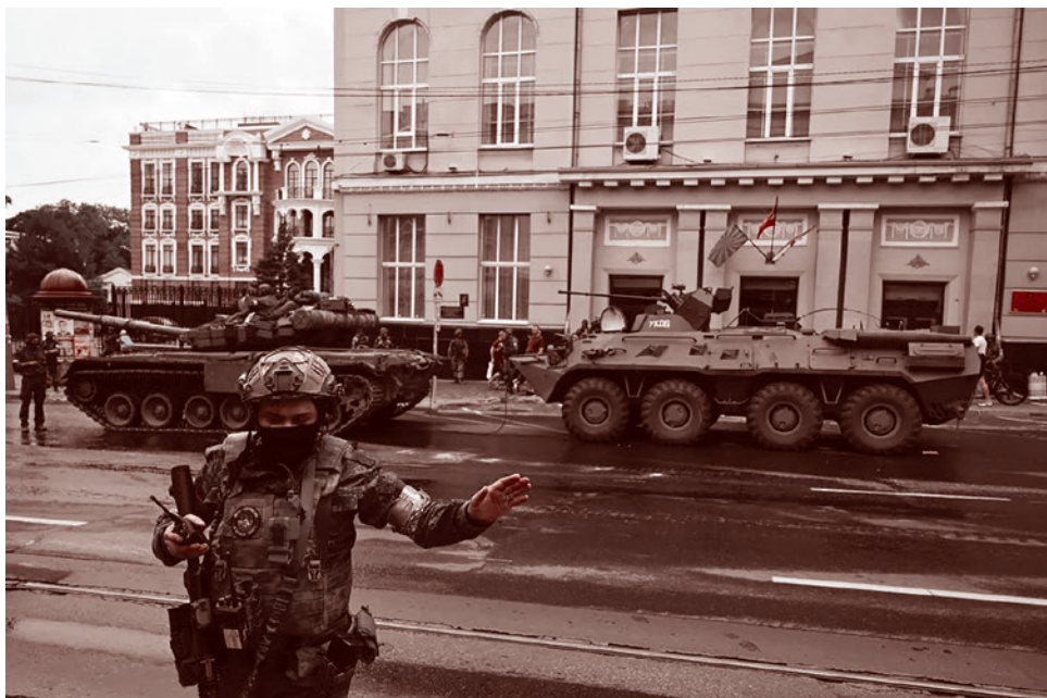
Бойцы Вагнера патрулируют улицу в Ростове-на-Дону. 24 июня 2023