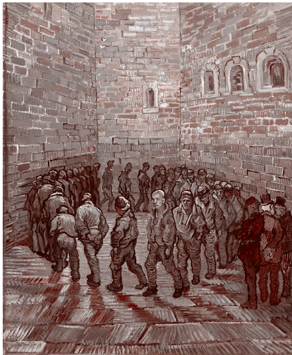
Винсент Ван Гог. Прогулка заключённых. 1890

В России отношение граждан к этой технологии крайне отрицательное. Но, несмотря на неприятие обществом, власти Перми всё же решили накинуть на своих граждан эту цифровую паутину. И мы по-