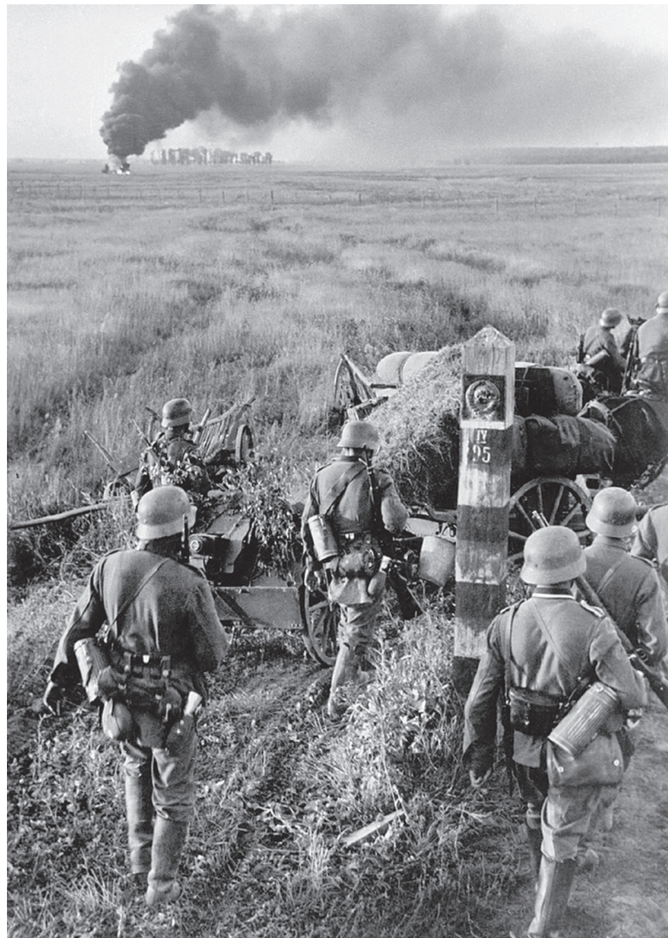
Немецкие войска пересекают советскую границу в современном Червоноградском районе Львовской области Украины 22 июня

Мы были военной страной. В этом смысле я говорил и повторяю, от этого очень многое зависит. В 1979 году я вместе со своим руководителем находился на одном из военных объектов, и вдруг сообщают, что Народно-освободительная армия Китая послала большой корпус, чтобы разобраться с Северным Вьетнамом, с которым китайцы тогда поссорились. Северный Вьетнам был за нас, а китайцы не вполне. И когда было объявлено об этом, мой руководитель сказал: «Раз мы живы, значит всё в порядке — ядерная война не началась». А позже мы узнали, что вьетнамские товарищи отдельно попросили нас в это не вмешиваться. И экспедиционный корпус, посланный Народно-освободительной армией Китая — отношению к Китаю с глубочайшим уважением, — был отброшен пограничными войсками Вьетнама. Почему? Потому что образ жизни, организация вьетнамского общества уже