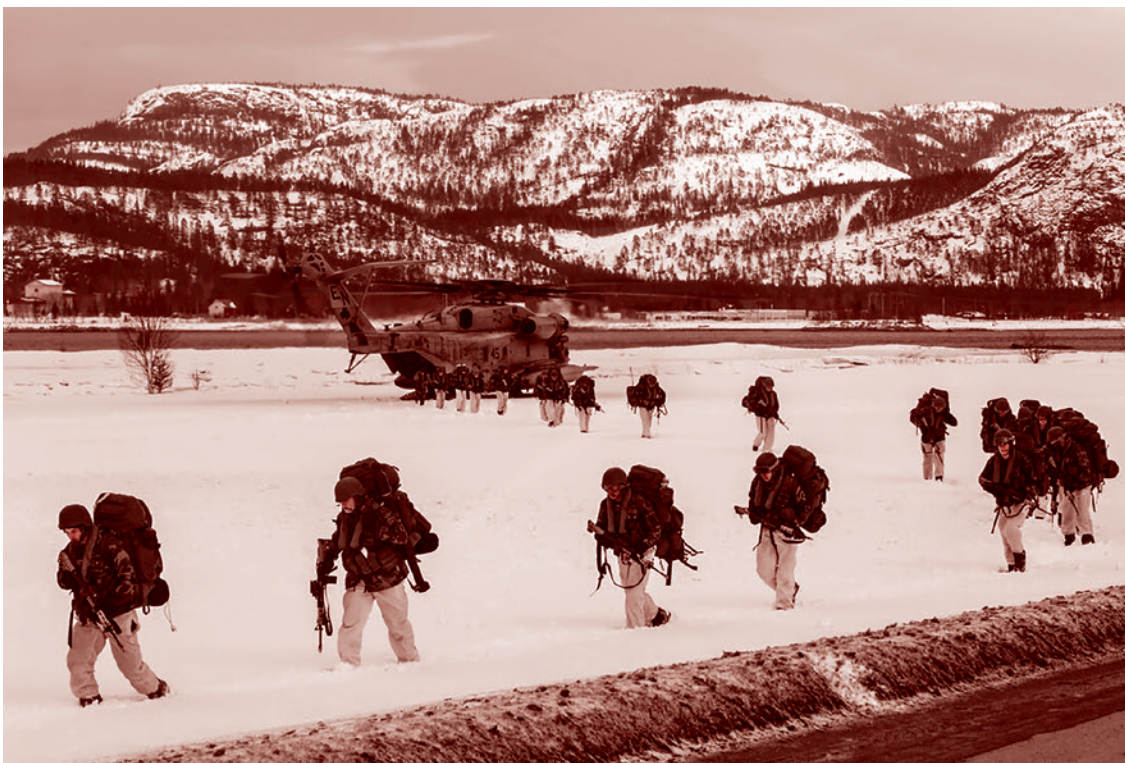
Норвежские, голландские и британские военнослужащие США во время учений. Норвегия, 2016

У нас были иллюзии, что то, что мы создали, способно одним мизинцем решать задачи. А оказалось, что мы втянулись в конфликт, по всем параметрам похожий на Первую мировую войну. Первый же параметр — это позиционность. В Великой Отечественной войне позиционность была сегментом, понимаете? Оборона под Москвой закончилась ударами сибирских частей, резервов и отбрасыванием немцев на сотни километров. Великое сражение под Сталинградом окончилось котлом, Курская дуга сходу была иллюзорно-