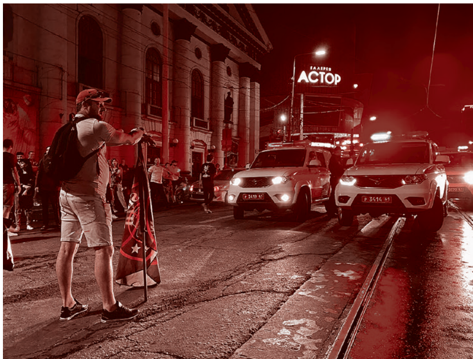
Военный мятеж Евгения Пригожина в Ростове-на-Дону 24 июня 2023 года. Человек с флагом ЧВК Вагнер напротив машин полиции

Теперь о повестке дня. Вот что мне безразлично — это как именно проводится кадровая политика в Министерстве обороны. Я в этом чужой. Я заведомо знаю, что я в этом ничего не понимаю. И пусть этим занимается то узкое сообщество, которое построено вокруг Верховного главнокомандующего. Я просто понимаю, что если какие-то претензии имели серьезные основания, то они давно должны были быть рассмотрены. И не под давлением Пригожина, а по сообщениям военной контрразведки и других ведомств. А если эти претензии фиктивны, то нельзя, чтобы в момент, когда люди отдают жизнь, им орали, что их начальник Генерального штаба... даже не буду перечислять, в каких именно уничижительных выражениях его определяют. Он может быть снят или уважаем. А в режиме поношения он не дол-