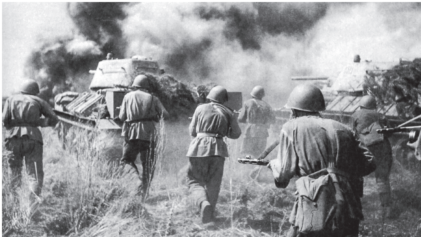
Курская битва. Танкисты во взаимодействии с пехотой контратакуют противника. Воронежский фронт. 1943

Сергей Кургиян: Я никогда не отойду от своих красных убеждений, они не имеют ничего общего с тем кондовым, что творилось, скажем, при Брежнев, и вообще они довольно-таки своеобразные, но вот какие есть, такие есть. Но я в рамках этих убеждений с уважением отношусь, прежде всего, к генералу Деникину как к представителю белогвардейской элиты, а также к генералу Корнилову. Ко всем не коллаборационистам, понимаете? Ко всем, кто не встал чуть позже на сторону Гитлера,