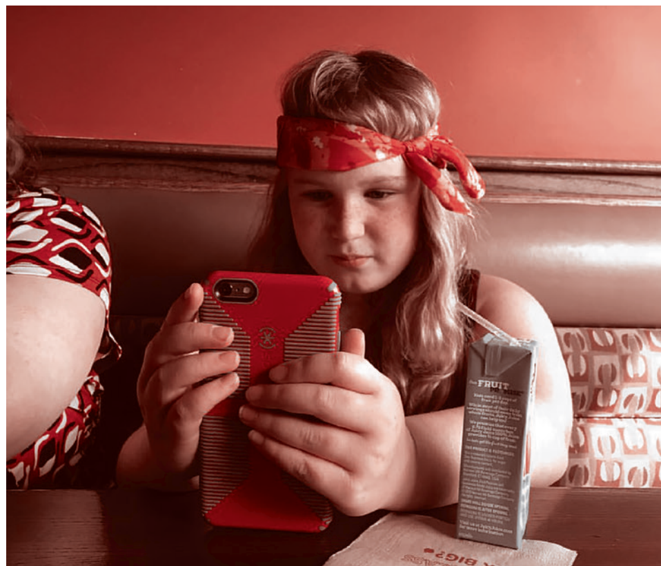
Девочка со смартфоном

Подрастающее поколение всё больше желает жить только для себя, а не для других, поэтому даже заводить семью многие не хотят. Девальвируются и другие «традиционные ценности», на первый план выходят деньги и свободное время, как способ идеального (полупаразитарного) образа жизни.