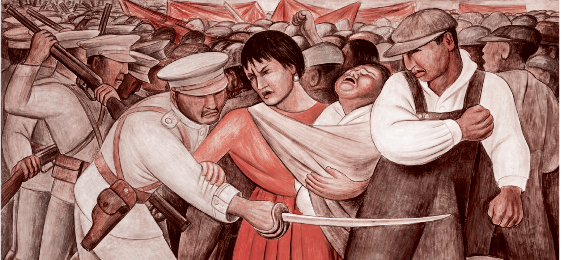
Диего Ривера. Восстание (фрагмент). 1931 г.