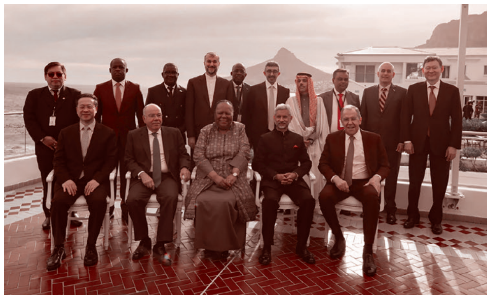
Встреча министров иностранных дел стран БРИКС в столице ЮАР Кейптауне