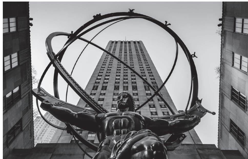
Статуя Атланта, держащего Земной шар на руках, перед Рокфеллеровским центром в Нью-Йорке