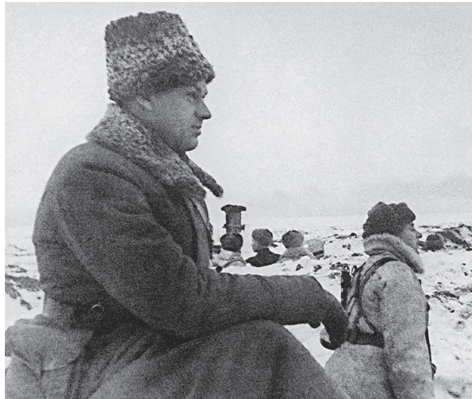
Генерал Константин Рокоссовский на наблюдательном пункте под Сталинградом