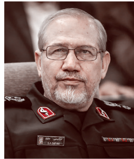
Главный военный советник верховного лидера Исламской революции аятоллы Хаменеи генерал Яхья Рахим Сафави