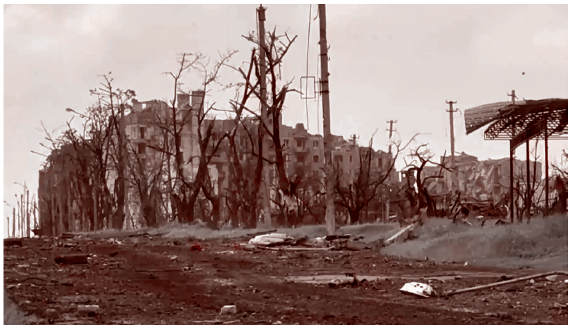
Укренрайон «Самолет» в Артёмовске

Поэтому в этом смысле национальная стратегия — самая главная. Национальная стратегия изменилась после СВО? Вместе с таким крахом трека? У нас есть новые стратегические приоритеты? Есть субъект, который будет продвигать эти приоритеты? Я должен заметить хоть что-то меняющееся в этих приоритетах? Я должен это заметить в «Яндексе»? Я должен это заметить