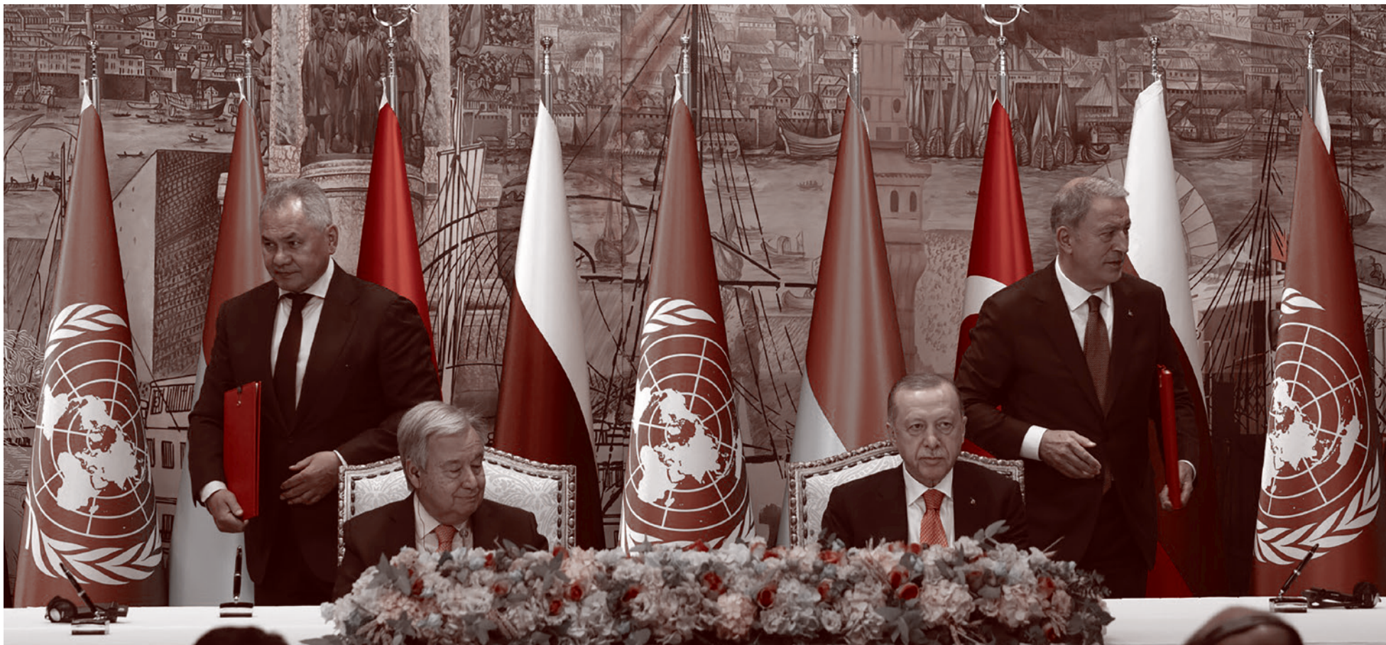
Подписание зерновой сделки в Стамбуле. 2022

Газета «Суть времени» зарегистрирована Федеральной службой по надзору в сфере связи, информационных технологий и массовых коммуникаций (Роскомнадзор) Свидетельство ПИ № ФС77-50554 от 9 июля 2012 года