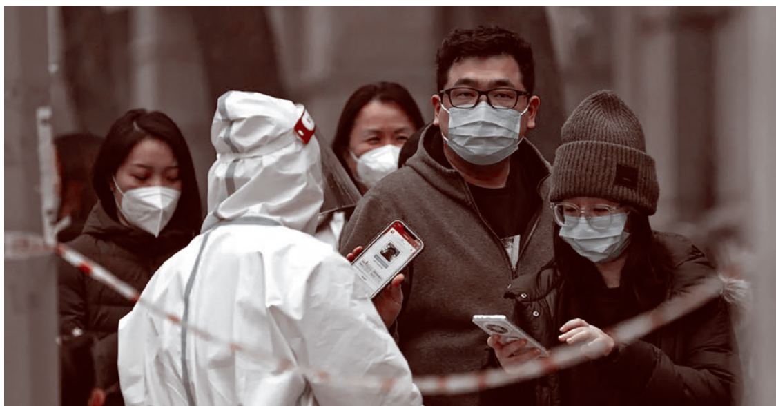
Медицинский работник проводит проверку граждан. Китай