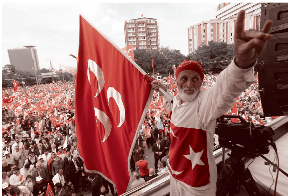
Акция Серых волков. Участник с флагом движения показывает пальцами его символ — волчью голову

Они зачем о нем орут? Чтобы окончательно трек не изменился? Они зачем, эти люди, которые ближе, чем я, соприкасаются с этим самым Западом, которые поднатерели в том, как именно ведется политика под столом и как деньги перегоняются из одного кармана в другой. Они зачем врут, что возможен договорняк? Они не слышали, что сказали только что в Хиросиме? Им сказа-