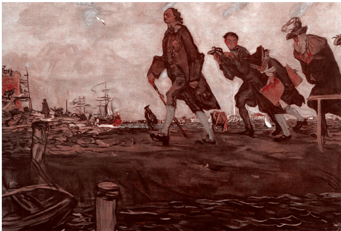
Валентин Серов. Петр I. 1907