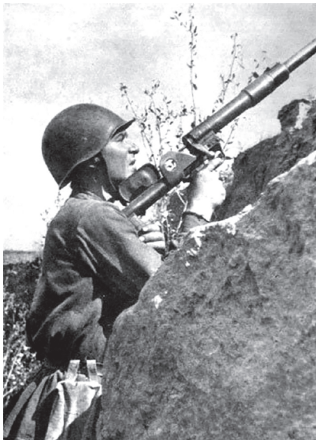
Боец с противотанковым ружьем. 1942

Сильный противник был не единственным неприятным обстоятельством для готовившейся к наступлению группы советских войск. Другой неприятностью стало отсутствие эффекта внезапности. Скрыть подготовку в принципе было очень сложно в открытой степной местности, тем более в условиях немецкого превосходства в воздухе. Однако нужно сказать, что особенных мер штаб фронта и не предпринимал, хотя имел на руках соответствующие рекомендации от Жукова, который совсем недавно (в конце июля — начале августа) руководил подготовкой Погорело-Городищенской операции на Западном фронте. Несмотря на то, что достичь всех поставленных целей тогда не удалось, в ходе нее