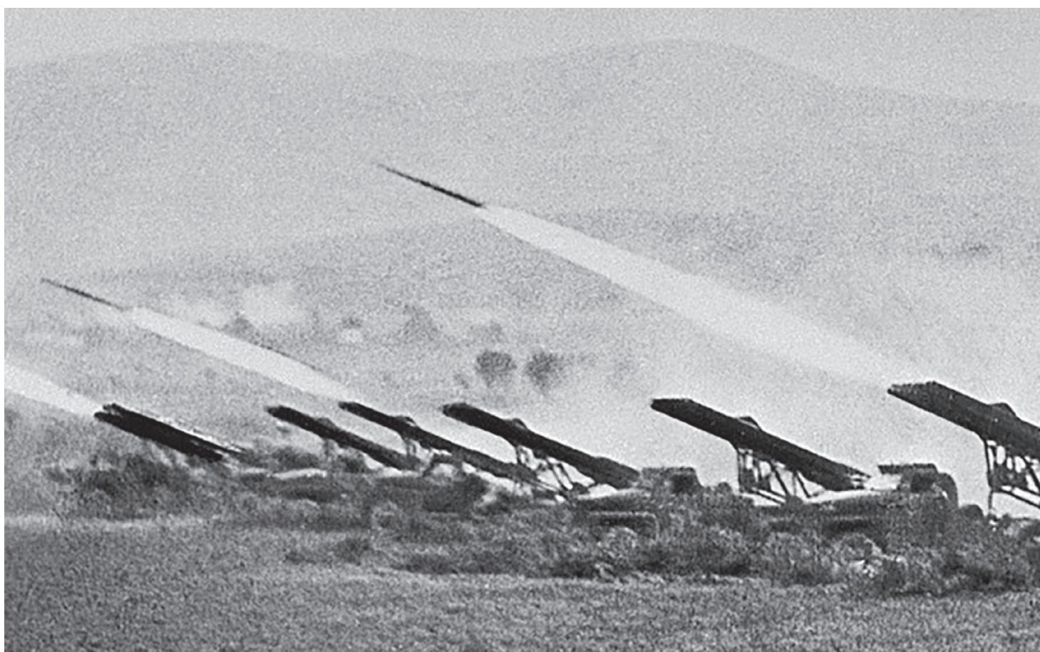
Батарея пусковых установок «Катюша» ведет огонь по немецким войскам во время Сталинградской битвы. Октябрь 1942

Мы оставили северную группу войск в начале сентября (смотрите статью в 510-м номере газеты), когда выдохся второй каскад советских контрударов по немецкому фронту. Незамедлительно стало готовиться новое наступление, цель которого была всё та же — пробиться к осажденному городу. Назначенной датой начала операции стало 17 сентября. Ресурсы, выделенные для нее Ставкой, впечатляют. Это около пяти полнокровных стрелковых дивизий, мощное пополнение для танковых корпусов и бригад, десять артполков усиления, в которые вошли: 24 пушки 122-мм, 40 гаубиц 122-мм и 66 пушек-гаубиц 152-мм. Также в войска прибыло около сотни установок реактивной артиллерии БМ-8 и БМ-13 (знаменитые «Катюши»). С воздуха наступление Сталинградского фронта поддерживали 118 истребителей, 84 штурмовика и 21 бомбардировщик 16-й воздушной армии. Нужно обратить особое внимание на усиление огневой мощи наступающих войск — как мы помним, именно преимущество немцев в артогне стало одним из главных факторов неудачи предыдущего контрудара.