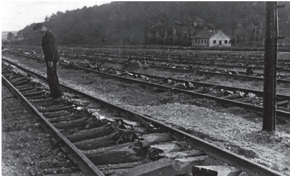
Разрушенные фашистами железнодорожные пути. Югославия. 1944

Они его прервали или что? Что возникло-то?!