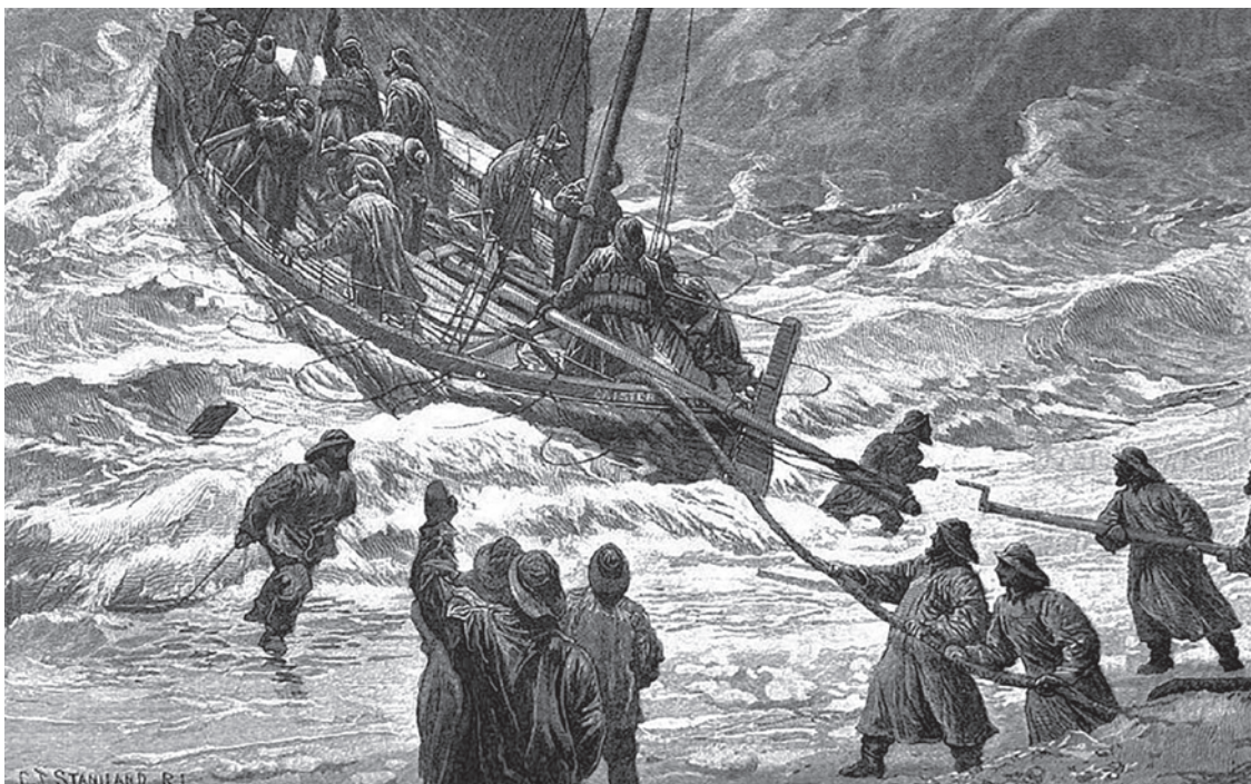
Чарльз Джозеф Станиленд. Спуск на воду. 1886