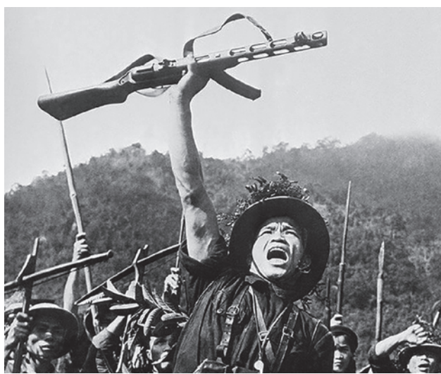
Бойцы вьетнамской армии. 1960-е

Что, у них был какой-то особый военно-промышленный комплекс? Что, у них было что-то другое? У них дух был, кото-