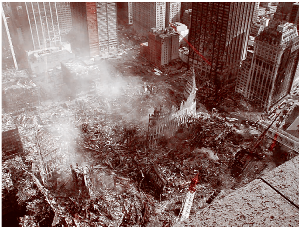
Обломки Всемирного торгового центра в Нью-Йорке. 2001

Ч то есть общего у терактов 11 сентября 2001 года с коронавирусом и реакцией Западной истерией и реакцией Западной на спецоперацию по денацификации Украины? То, что предпринятые меры были диспропорциональны вызову и решали другую задачу, нежели та, что была озвучена официально.