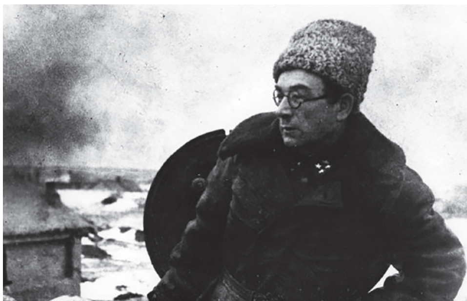
Командующий 7-м танковым корпусом РККА генерал-лейтенант Павел Ротмистров в башенном люке танка KV-1 в Котельниково

Нам сегодня может показаться, что одни сутки — это пустяк. Однако нужно обратиться к контексту тех дней. В разгаре первый штурм Сталинграда, стартовавший