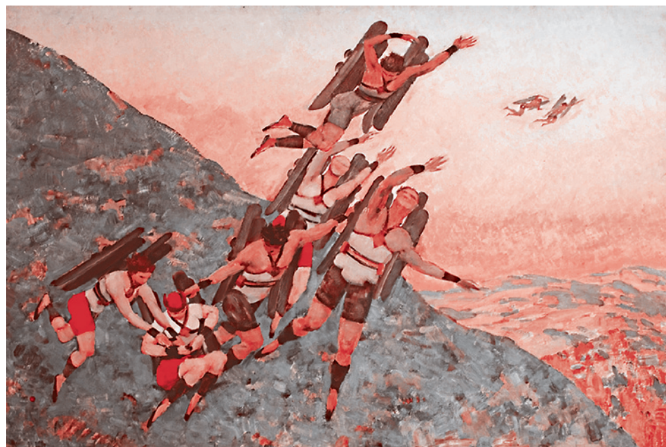
Константин Юон. Люди будущего

Началась новая эра. Точнее, эра обновления гуманизма, придания ему нового потенциала надежд и чаяний. «Вот-вот советские коммунисты выявят и доформируют эту самую человеческую сущность, — говорили западные как осторожные, так и неосторожные гуманисты. — Вот-вот они, преодолев отчуждение, соединят ее с человеком. И вот тогда начнется новая эра, эра подлинной человечности, эра человеческой эмансипации, по Марксу».