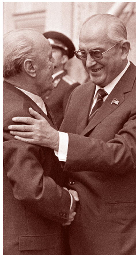
Ю. В. Андропов

Венгерские события 1956 года привели к тому, что данный Отдел был разделен в феврале 1957 года на Международный отдел ЦК КПСС по связям с коммунистическими партиями капиталистических стран (возглавивший его Б. Пономарев сохранял этот пост вплоть до 1986 года) — и Отдел ЦК КПСС по связям с коммунистическими и рабочими партиями социалистических стран. Руководителем последнего стал Ю. Андропов, бывший во время венгерских событий послом в Венгрии.