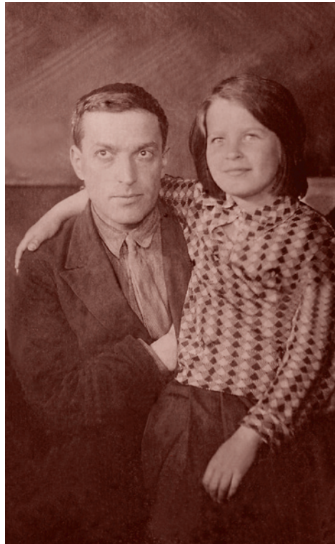
Лев Выготский с дочерью Гитой, 1934 г.

И что же нам предлагают поборники инклюзивного образования? Они предлагают (и уже осуществляют!) закрытие