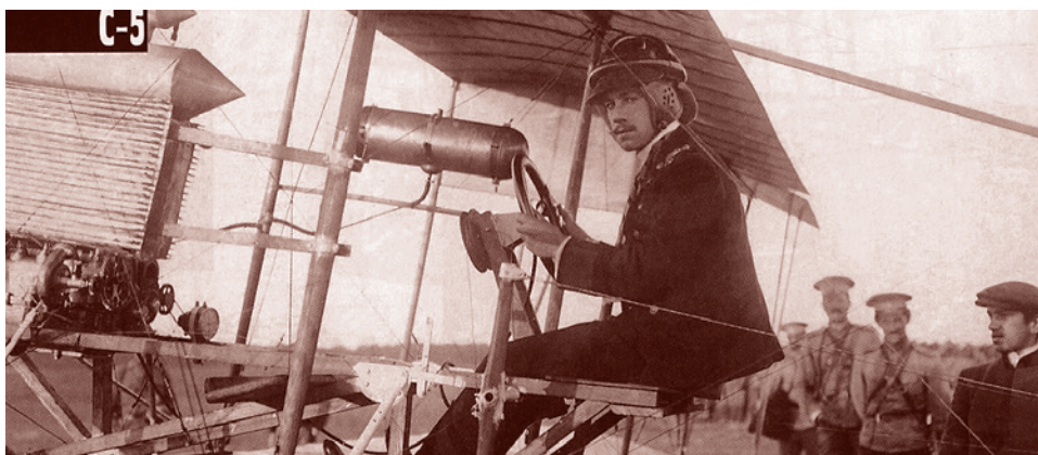
Игорь Сикорский на испытаниях своего самолета, 1910 г.

В новейшее время, в эпоху промышленной и военно-технической революций, функции военных инженеров невероятно расширились. Технический специалист, изобретатель и конструктор в одном лице, инженер стал одной из главных фигур, без которой в войнах