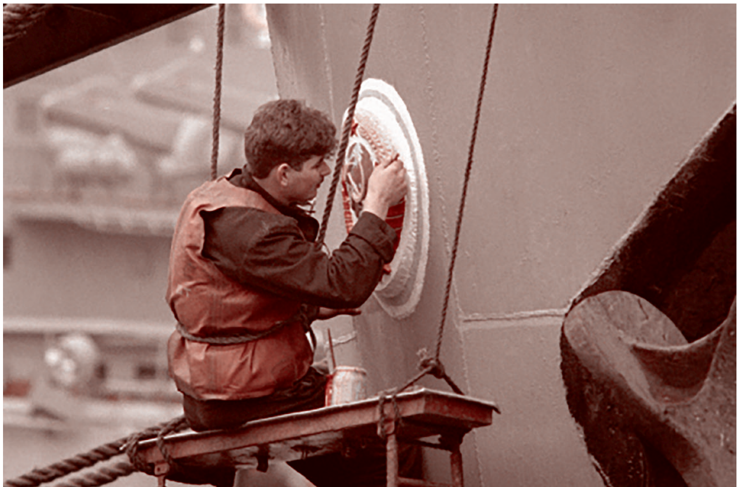
Матрос обновляет красками герб СССР на корме корабля Черноморского флота. 1992