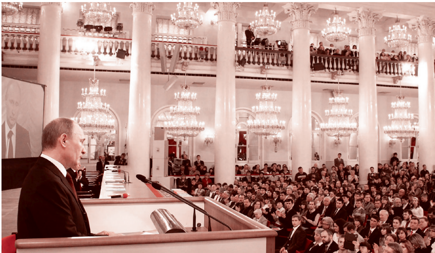
Владимир Путин на первом съезде Родительского Всероссийского Сопротивления (РВС). 2013

Сергей Кургинян: Во-первых, я не убежден, что оно может быть без ядерного эксцесса. Я вспоминаю Александра Зиновьева, «Хомо советикус». В этой книге он написал: «Секретарь обкома в бунке-