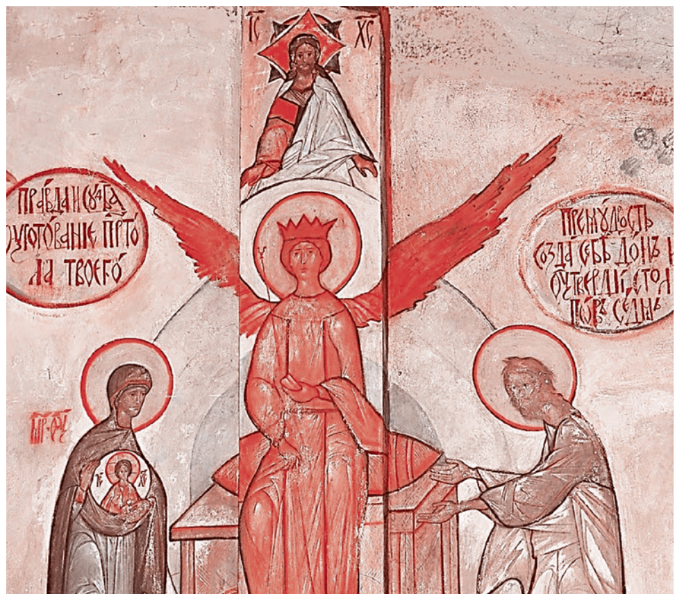
София Премудрость, фреска Григория Круга в церкви Казанской иконы Божией Матери в Муазне. 1964–1966

Четкое разделение этих двух видов магии дает, в частности, французский юрист Жан Боден, чья работа «Демонomania» стала одним из самых значимых текстов эпохи охоты на ведьм. Боден различает магию как «науку о вещах божественных и естественных» и магию как «дьявольское колдовство». И пишет, что такое разделение проводили еще в Древнем Риме, в частности, уже упоминавшиеся нами Плотин и Порфирий.