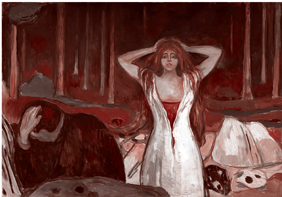
Эдвард Мунк. Пепел. 1894

почувствовал животный страх перед своей собственной хрупкостью. «Стало очевидно: болезнь поражает людей в любом возрасте и с хорошим здоровьем», — вспоминает он. Это настолько его поразило, что он заболел и три месяца был прикован к постели.