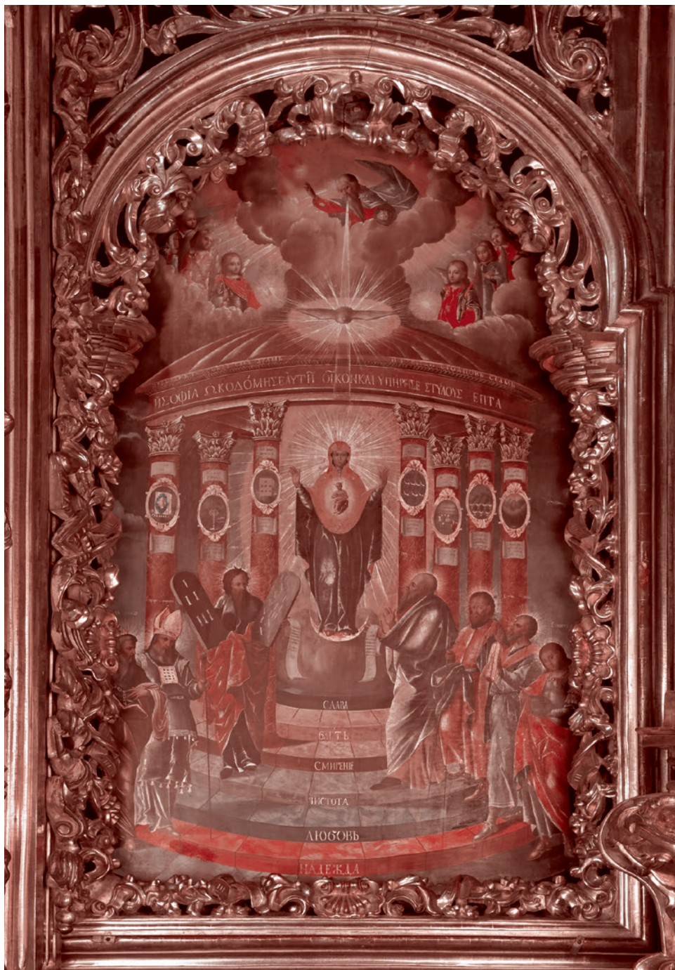
Икона София — Премудрость Божия (Киевская). 1700

Здесь в первую очередь необходимо упомянуть религиозного философа конца XIX века Владимира Соловьева. Он пони-