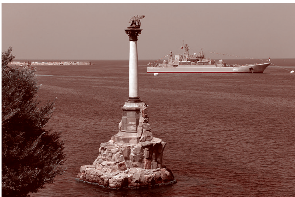
Черноморский флот. Севастополь