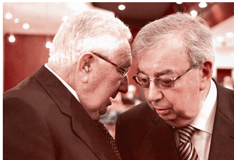
Евгений Примаков и Генри Киссинджер