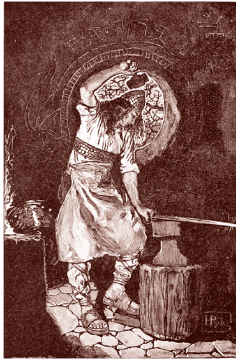
Создание Бальмунга. Г. Пайл, 1899 г.

Так Зигфрид правит меч над горном: То в красный уголь обратит, То быстро в воду погрузит — И защитит, и станет черным Любимцу вверенный клинок... Удар — он блещет, Нотунг верный, И Миме, карлик лицемерный, В смятении падает у ног!