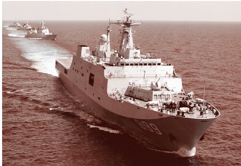
Китайский десантный корабль Jinggangshan

16 августа саудовский король Абдалла осудил «иностранные» (то есть западные) вмешательства в дела Египта и объявил о поддержке властей Египта в их борьбе