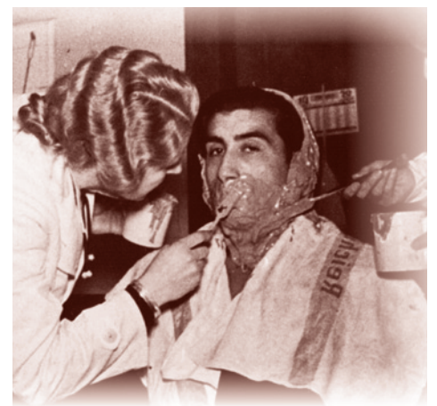
Изготовление модели головы в отделении Института расовой гигиены