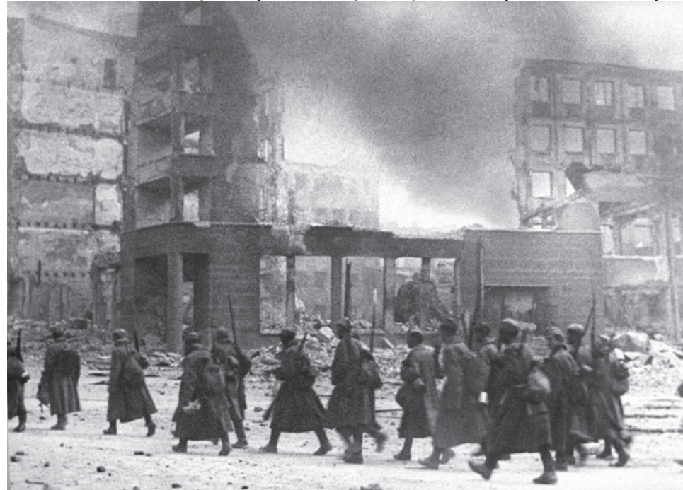
Эммануил Евзерихин. На новую позицию. Сталинград, 1942. Семейный архив