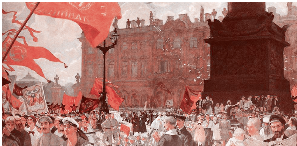
Праздник в честь открытия II конгресса Коминтерна 19 июля 1920 года. Демонстрация на площади Урицкого. Б. Кустодиев, 1921 г.

Борьба Сталина с объединенным оппозиционным блоком неизбежно становилась и борьбой с Коминтерном, поскольку Зиновьев с момента образования Коминтерна в 1919 году являлся бессменным Председателем Исполнительного комитета Коминтерна (ИККИ) и имел в Коминтерне своих сторонников. А Троцкий был чрезвычайно популярен в этой международной организации как один из ее основателей и идеологов. Осенью 1926 года Троцкого исключили из числа кандидатов в члены ИККИ, а Зиновьева отстранили от должности Председателя ИККИ (сам этот пост был упразднен). Окончательный разгром