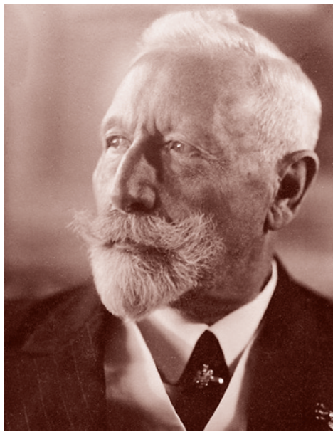
Кайзер Вильгельм II

Тем не менее, Бисмарк, пока он оказывал решающее влияние на политику германской