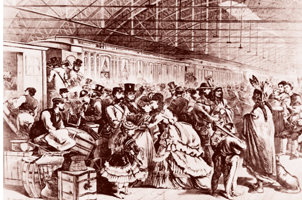
Железнодорожная станция в Чикаго. Отправление поезда. Гравюра, 1880 г.