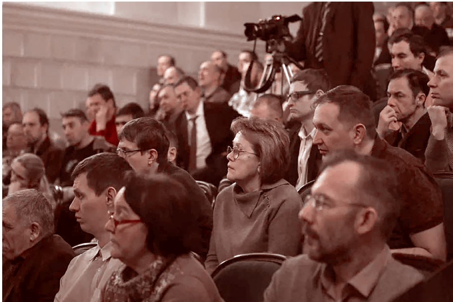
Участники внеочередной конференции движения «Суть времени»

Нельзя загадывать наперед, какова будет направленность всего этого на новом этапе. Но какой бы она ни была конкретно, она, безусловно, будет. И, безусловно, потребует всё большего и большего задействования того, что начато в нашей коммуне и что должно быть продолжено в ней на новом этапе с гораздо большей активностью.