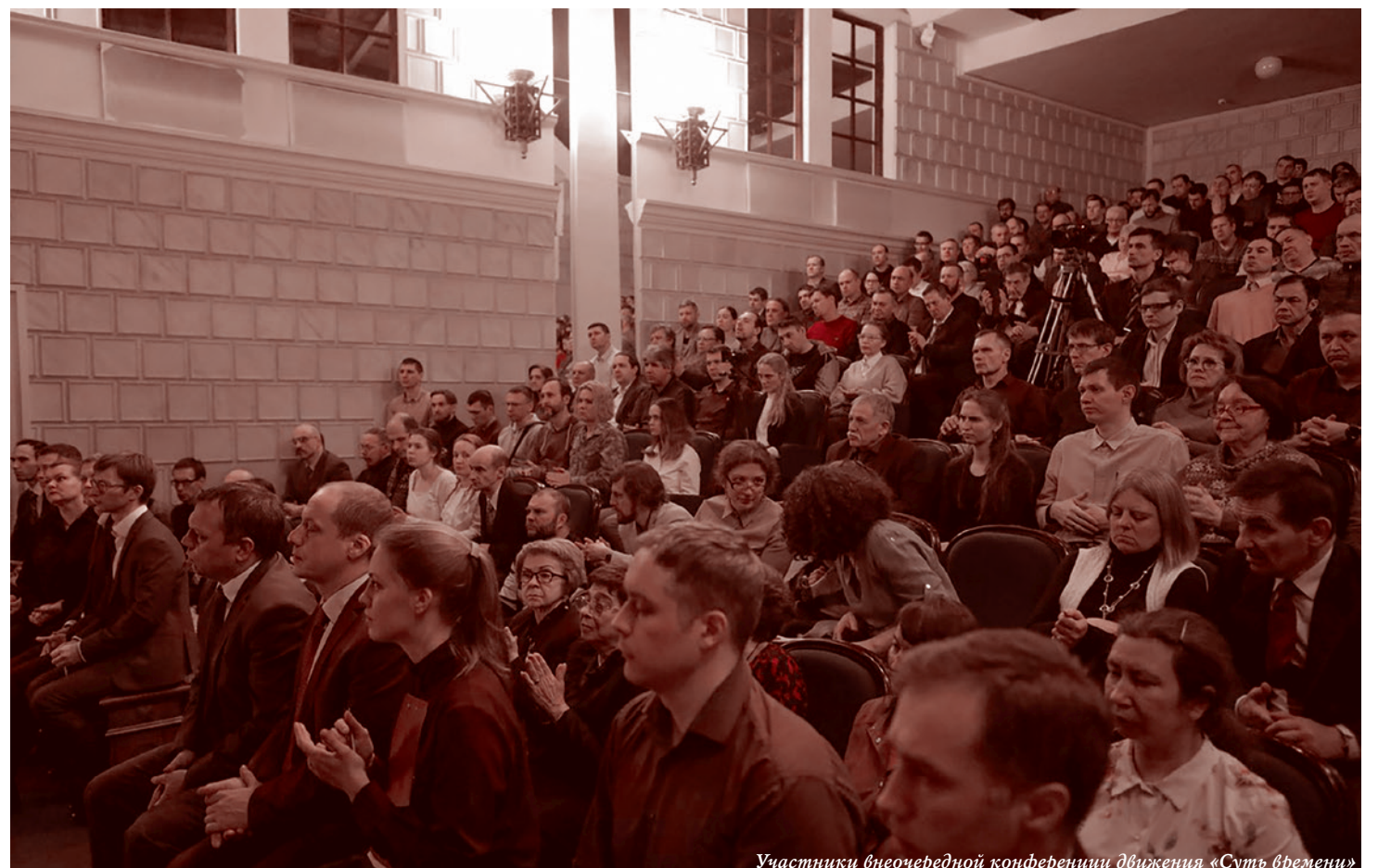
Участники внеочередной конференции движения «Суть времени»