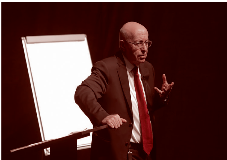
Лидер движения «Суть Времени» Сергей Ербандович Кургиян

Но уже тогда, когда были показаны передачи «Измена под красной маской», а это было много лет назад, я обратил