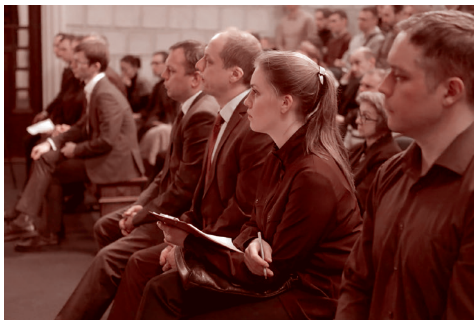
Участники внеочередной конференции движения «Суть времени»

Для того чтобы большевики могли вывести Россию из катастрофы, должно было найтись тридцать тысяч больших людей, которые позволили себя убить в Гражданской войне, сжечь в паровозных топках, как Лазо. Это делали большие люди. Это маленький человек сделать не может.