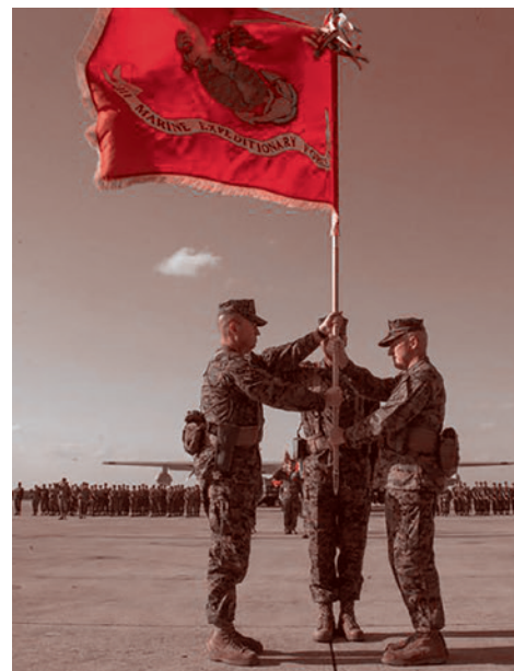
Аэродром морской пехоты Футэнма, Окинава — III экспедиционный корпус морской пехоты, силы быстрого реагирования США в Тихом океане

Страны Запада стремятся в ускоренном порядке передать Украине современные вооружения и, в частности, танки, опасаясь наступления ВС РФ весной. С такой оценкой выступила газета The New York Times. По ее информации, «западные чиновники всё больше опасаются, что у Украины есть лишь узкое окно возможностей для под-