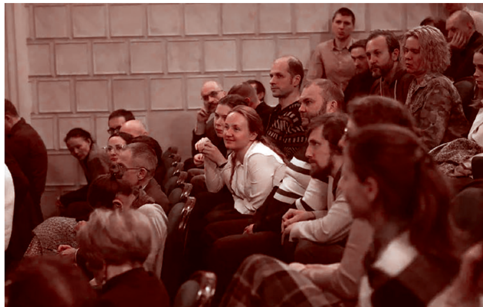
Участники внеочередной конференции движения «Суть времени»

Как только ты осознаешь, что имеет место новая историческая ситуация (а от такого осознания пытаются уйти очень многие), ты понимаешь, что если она постучалась к