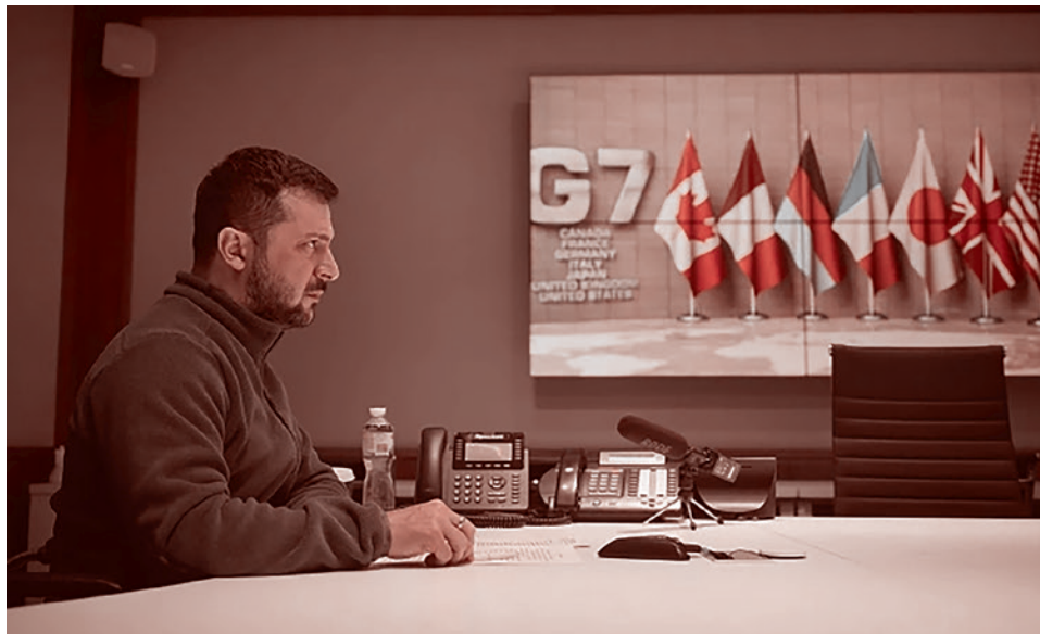
Зеленский на онлайн-встрече с главами государств G7

В начале декабря Франция вместе с европейскими и украинскими партнерами объявила о создании «специального три-