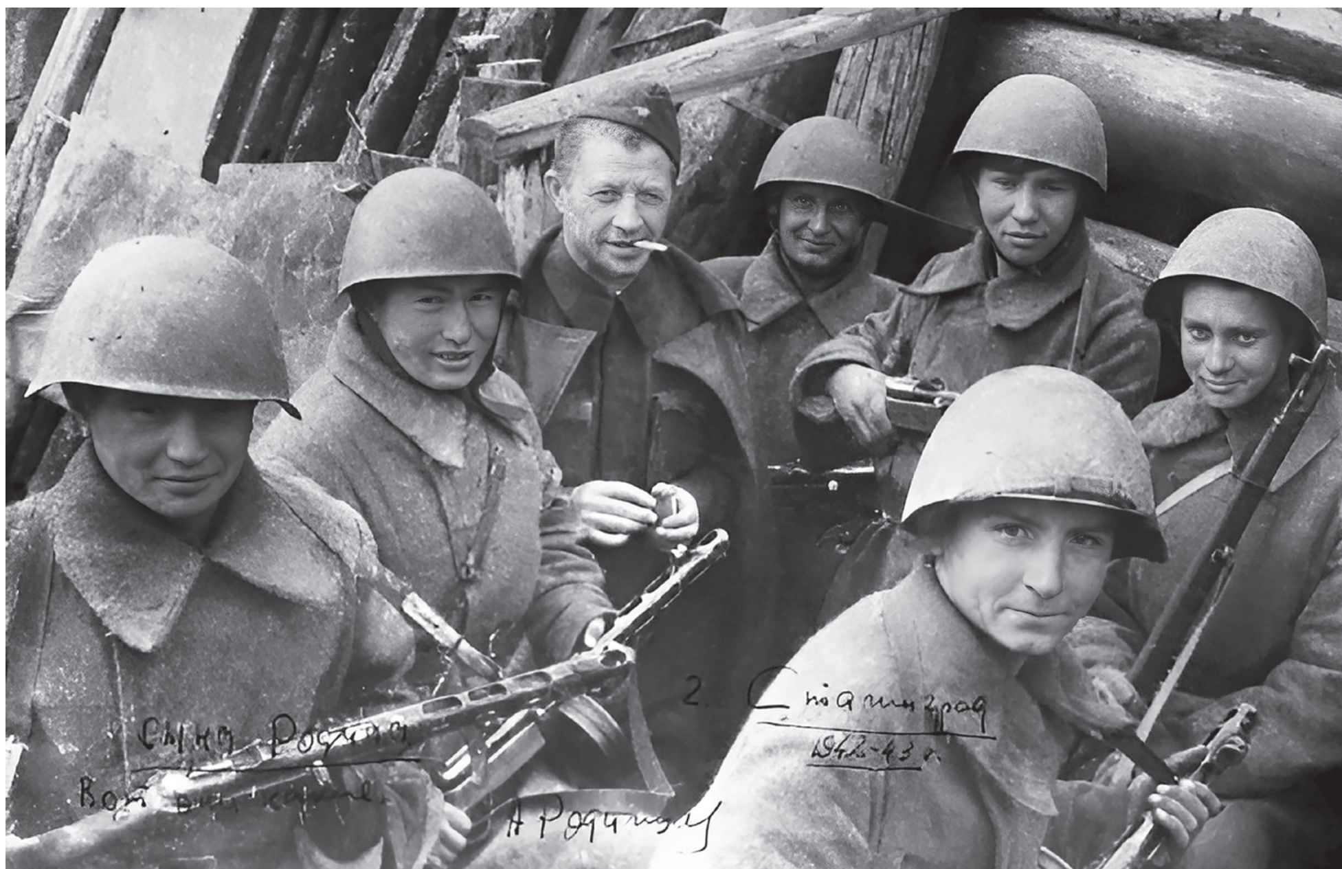
Бойцы 13-й гвардейской стрелковой дивизии со своим командиром Александром Родимцевым

При описании первого и последующих штурмов Сталинграда мы обязаны обращать особо пристальное внимание на планы и логику действий врага — ибо именно немцы владели тогда инициативой, и от направленности и напряженности их атак в большой степени зависел ход боевых действий.