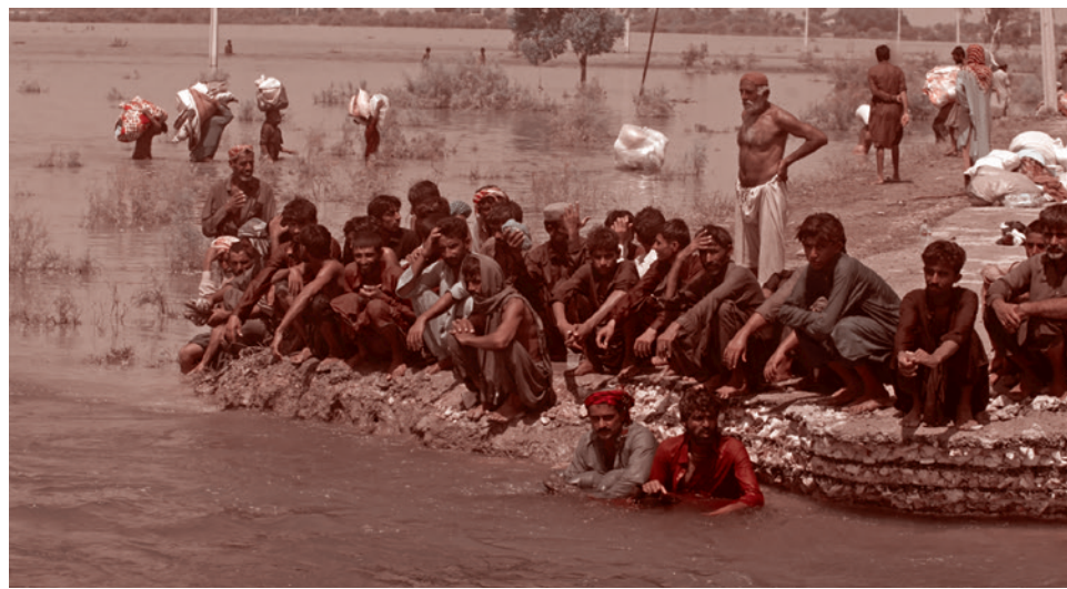
Наводнение в Пакистане

Однако в МВФ не торопились с решением, ожидая выполнения всех предварительных требований, и особенно отмены государственных субсидий на топливо, которые составляли для населения 60 рупий (около 25 руб.) за литр нефтепродуктов. Без денег МВФ рупия стремительно отправилась в «штопор»: курс доллара вырос с 200 (86 руб.) до 240 рупий — на 20%. В итоге к концу мая МВФ удалось «дожать» решение об отмене субсидий. Последствия не заставили себя ждать, и цены на все