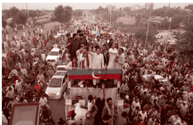
Имран Хан на марше протеста в Исламабаде. Пакистан. 2022