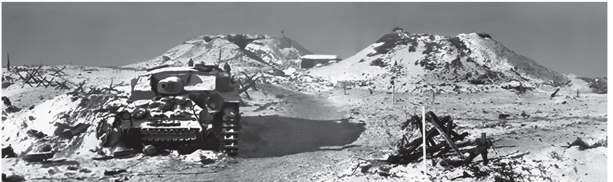
Вершина Мамаева кургана. На зимнем фото (сделано после взятия советскими войсками высоты в январе 1943) видны злополучные «баки» — предельно сложная цель для штурма

поселков (что тоже важно, но к обороне от немецкого штурма не имеет прямого отношения). Как я уже писал ранее, к потрепанным еще в излучине Дона соединениям в конце августа присоединились свежие части, оказавшиеся в «нужное время в нужном месте». Старые «донские» дивизии по своей численности на 11 сентября колебались от буквально нескольких сотен человек до 2–3 тысяч (при штате в 13 тысяч), при этом крайне скудным было и вооружение: не хватало ручных и станковых пулеметов, минометов, ПТР. Артиллерия отсутствовала вообще или насчитывала единицы орудий. Ряд самых небоеспособных дивизий вовсе не приняли участие в обороне и были отведены за Волгу на переформирование. Единственным полнокровным соединением в составе 62-й армии оказалась 10-я дивизия НКВД, насчитывавшая 8615 человек. Однако очевидным ее минусом была слабость артиллерии — всего двенадцать 45-мм орудий. Серьезной силой являлись вновь включенные в армию стрелковые бригады: в них доставало и людей, и вооружения. Танковые корпуса, также оказавшиеся в Сталинграде транзитом, понесли уже немалые потери в контрuderарах по немцам, но всё же еще что-то из себя представляли. К примеру, в 23-м танковом корпусе на 10 сентября насчитывалось 38 Т-34.