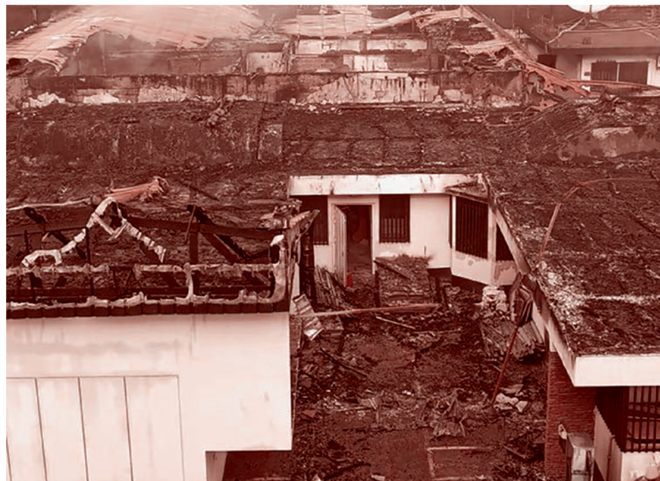
Последствия пожара в штаб-квартире Европейского Союза в Банги

Ежемесячный счет за электроэнергию сейчас в среднем составляет около $260 —