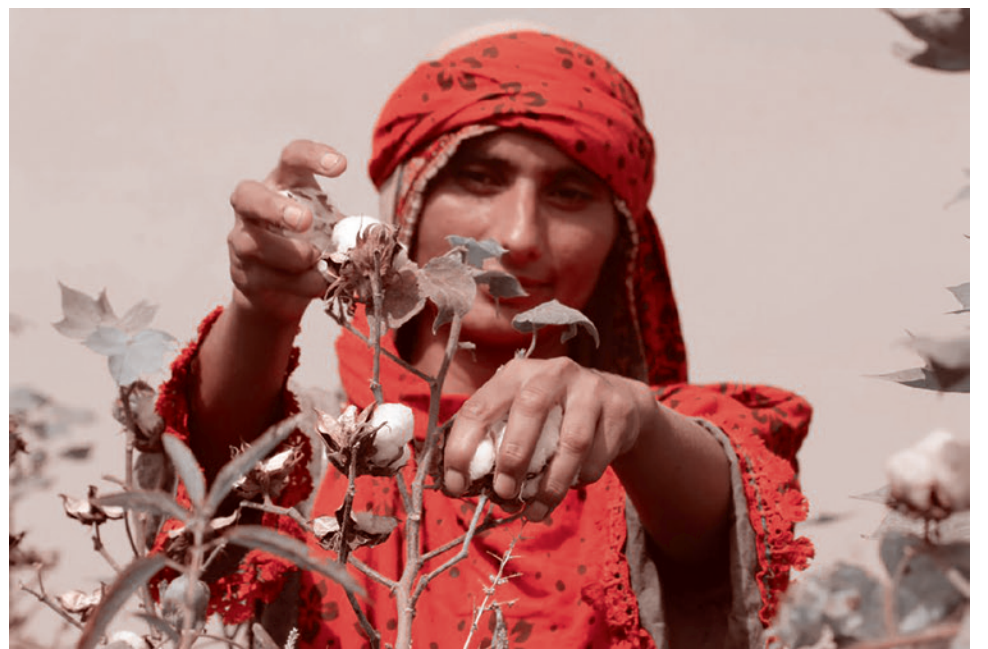
Женщина собирает хлопок. Пакистан

В свою очередь, правящая коалиция в лице премьер-министра Шехбаза Ша-