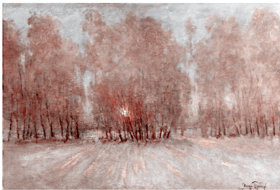
Игорь Грабарь. Восход солнца. 1941

И в том, что это не понято, виноваты нынешние поколения, потому что уже при Советах всё это извращалось. По остаточному принципу — культура, образование, гуманитарная сфера, главное — машины. Но важны не машины, а человек, который их производит. Он — во главе угла, он — высшая производительная сила, его надо создавать. А создает его духовное про-