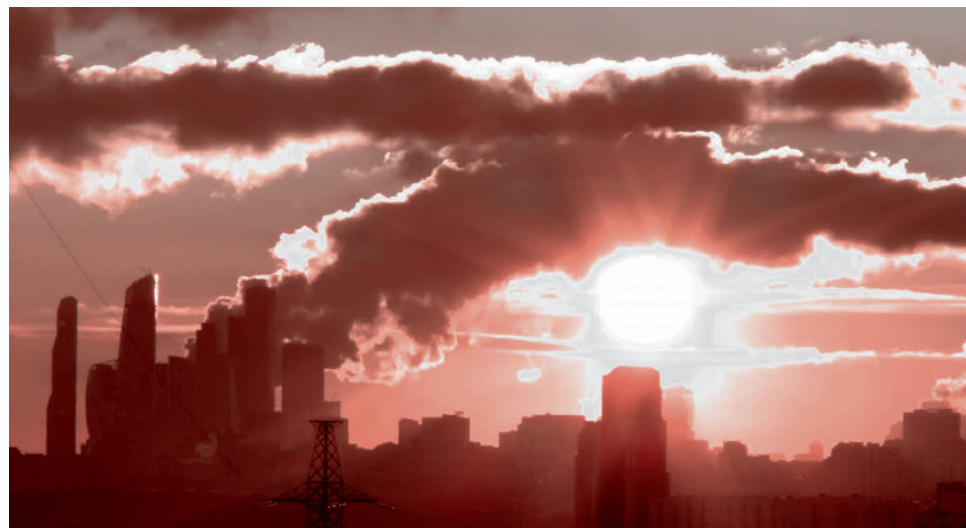
Зимний восход над городом

Уже 50-летний, он спал под двумя одеялами, слушая ночные крики в темной украинской столице. Когда выходил утром на улицу (он давно лишился преподавательской работы), то совершенно не специально, как человеку в похмелье, ему приходила мысль, что в больницах и роддомах сейчас те, кто ни в чем не виноват, распла-