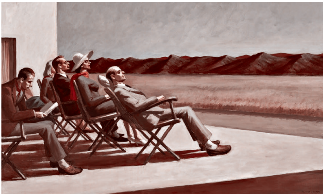
Эдвард Хоппер. Люди на солнце. 1960

Люди рвутся в неизведанное не потому, что они боятся боли и им нужно удовольствие, а потому, что они не скоты. «Сведи к необходимому всю жизнь, — это король Лир, — и человек сравняется с животным». Гамлет: «Вот он, гнойник довольства и покоя, прорвавшись внутрь, он не дает понять, откуда смерть». Гнойник довольства и покоя. Блок гово-