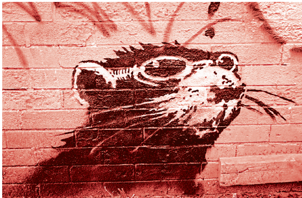
Граффити в Чикаго

Но черта с два ты от этого долга куда-нибудь улизнешь дольше, чем на один день. Выезжая в субботу, 19 октября, на работу для того, чтобы писать статьи в очередной номер газеты «Суть времени», я заглянул в комнату супруги, чтобы попрощаться, и увидел, что супруга прикована к компьютерному экрану.