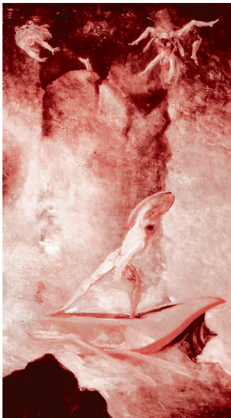
Иоганн Генрих Фюссли. Одиссей между Сциллой и Харибдой (фрагмент). 1794

Лично я убежден в том, что марксизм содержит в себе огромный не до конца раскрытый (а то и вообще не раскрытый) потенциал. Что марксизм не холоден, а горяч (вспомним «Апокалипсис», в котором Сидящий на троне, обращаясь к ангелу Лаодикийской церкви, говорит: «Знаю дела твои; ты не холоден и не горяч; о если бы ты был холоден или горяч! Но так как ты тепл, а не горяч и не холоден, то извергну тебя из уст моих»).