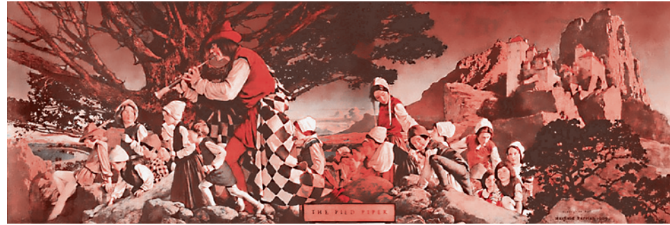
Максфилд Пэрриш. Гамельнский крысолов. 1909

Итак, с конца сентября началось форсированное укомплектовывание «армии Навального», которая должна будет наступать несколькими колоннами (помните, у Толстого — «Ди эрстэ колоннэ марширт, ди цвайтэ колоннэ марширт?»). Навальному и его хозяевам срочно понадобилась «цвайтэ колонна», состоявшая из специфических радетелей за права русского народа. И эту «цвайтэ колонну» стали срочно сколачивать.