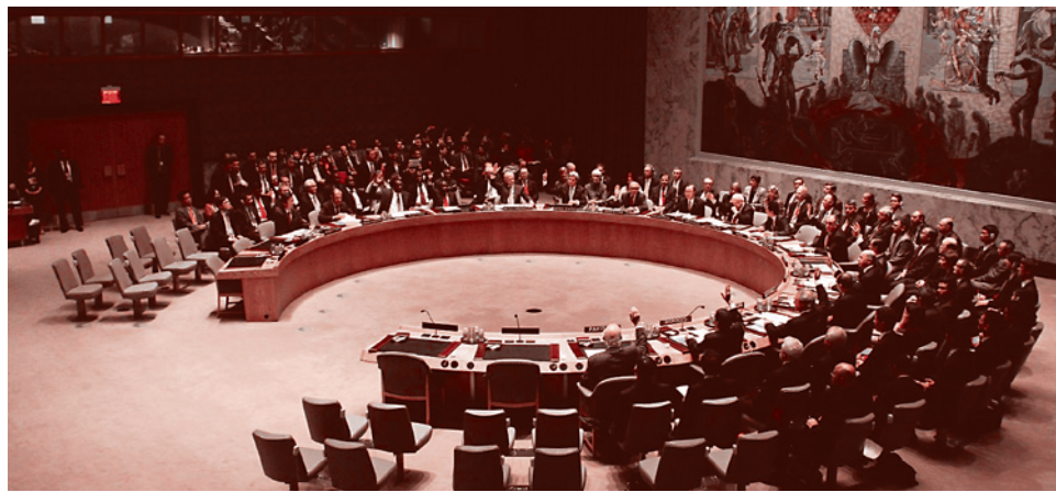
Совет Безопасности ООН единогласно принимает резолюцию по Сирии в поддержку плана ОЗХО. 27 сентября 2013 г.

«Приведены убедительные доказательства того, что видео и фото жертв химатаки в пригороде Дамаска 21 августа были сфальсифицированы заранее. Аудиторы продемонстрировали показания многочисленных свидетелей, единогласно утверждавших, что химоружие в районе Восточной Гуты было применено именно боевиками. Результаты проведенных активистами расследований