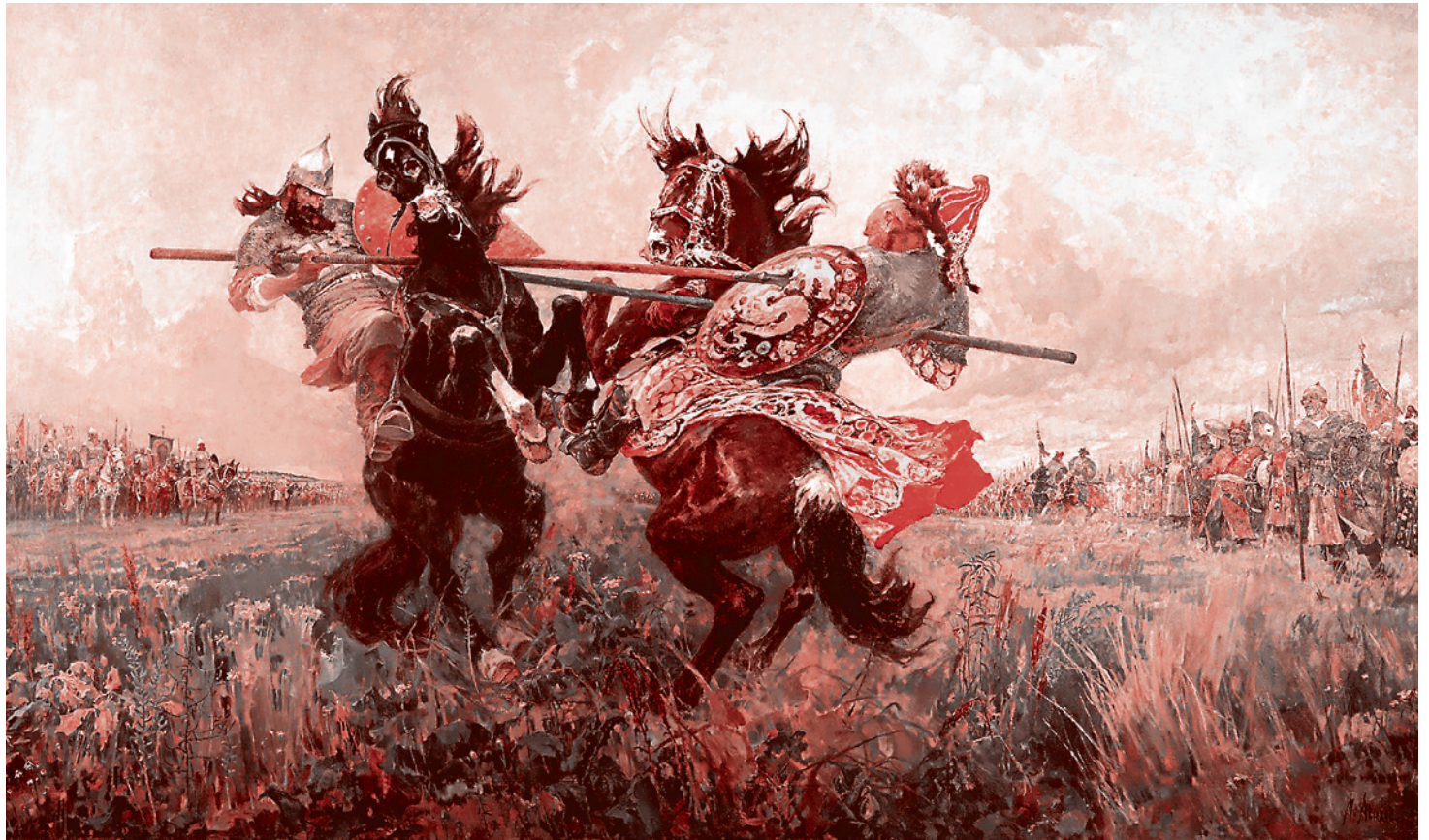
Михаил Авилов. Поединок на Куликовом поле. 1943

Навязывание Руси «особых взаимоотношений с Ордой» — явно последовательно проводимая в Концепции идея. Так, после расплывчатого упоминания об имевшей место на Руси борьбе с крестоносцами в Концепции впервые упоминается имя Александра Невского. Упоминается оно конкретно так: «Александр Невский: его взаимоотношения с Ордой»... Неплохо? То есть надо ли понимать, что не своей блестящей победой над крестоносцами, а своим вынужденным союзом с Ордой (при известной невозможности воевать на два фронта) в основном стал интересен Невский?!