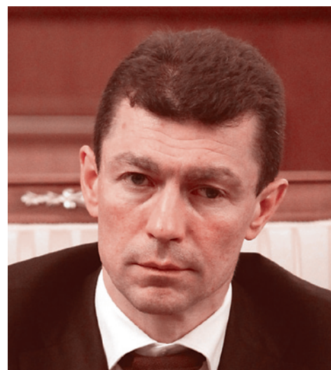
Министр Максим Топилин. Думает о том, кого бы еще лишить медицинской помощи

Неслабо?! Скажите, могло бы прозвучать подобное предложение в какой-нибудь цивилизованной западной стране? Вряд ли! А если бы и могло, то, очевидно, кресло под таким министром зашаталось бы. А у нас? Общество фактически его не заметило. Разве что некоторые журналисты развернули дискуссию на тему о том, какую именно категорию нетрудоустроенных граждан следует лишить