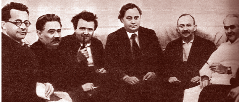
Секретариат ИККИ, избранный на VII конгрессе Коминтерна. Справа налево — В. Пик, О. Куусинен, Г. Димитров, К. Готвальд, Д. Мануильский, П. Тольятти. 1935

Никакой абстрактной конспирологичности в этом утверждении нет. Нами выявлены конкретные фигуры, разрабатывавшие эту концепцию на Западе. Мы показали, что эти фигуры обладали необходимыми возможностями. И, наконец, в ходе перестройки были