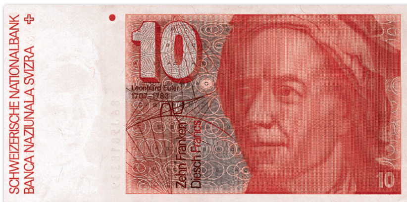
Банкнота в 10 швейцарских франков с изображением Леонарда Эйлера

Уже в самом начале XVII века началось развитие светского образования. Появились новые учебники (самый знаменитый — «Арифметика, сиречь наука числительная» Леонтия Магницкого, вышедший в 1703 году), стали создаваться новые типографии в Москве, Петербурге и других городах для печатания учебной, научной и специальной литературы. Вслед за книгопечатанием организовалась книготорговля, в 1714 году была открыта первая публичная библиотека, а в 1719 году — первый русский естественнонаучный музей — Кунсткамера.