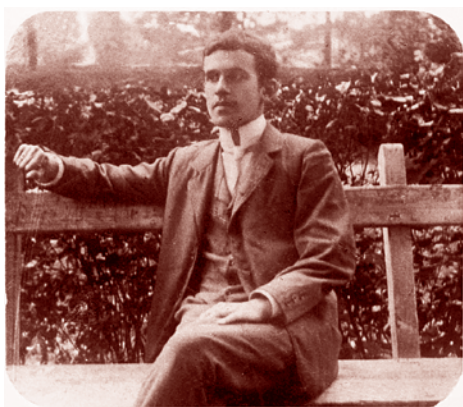
Отто Вейнингер 1880–1903

Вейнингер — отпрыск богатой еврейской семьи, родившийся в Австро-Венгрии, выпускник факультета философии Венского университета, эрудит, получивший в 22 года степень доктора философии и овладевший к этому возрасту рядом древних