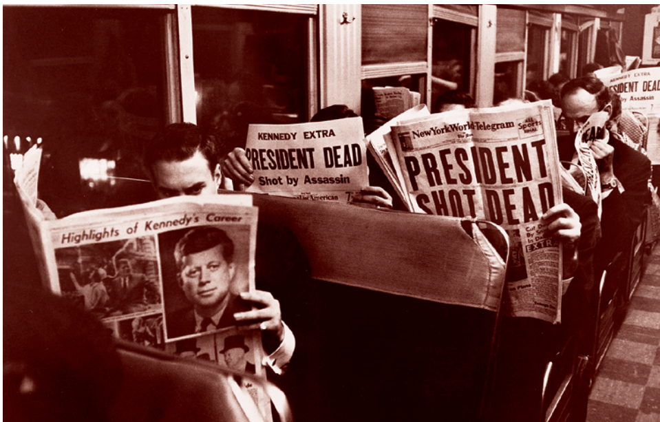
Пассажиры в Нью-Йорке читают об убийстве Джона Кеннеди

Существуют сведения, в том числе из интервью личной секретарши Джона Кеннеди Эвелин Линкольн, что на Кеннеди было оказано давление, чтобы тот предложил вице-президентство Джонсону. Было яко-