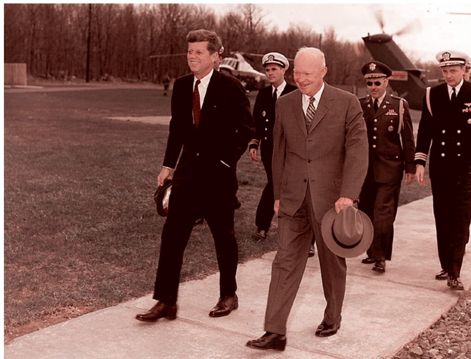
Президент Джон Кеннеди встречается с генералом Эйзенхауэром 22 апреля 1961

Эта ситуация была опасной и сковывала американского президента. Но с ней можно было справиться. Попавший в свое время в более опасную ситуацию Франклин Рузвельт проявил гениальную способность к эквилибристике и выстроил систему, при которой спорящие представители разных лагерей приходили к нему как к арбитру. Пусть менее талантливый, но обладающий инстинктом самосохранения Гарри Трумэн не мешал одной группе победить и неукопнительно следовал ее рекомендациям. Эйзенхауэр тоже вполне определенно выбрал одну сторону и дал ей свободу действовать по своему усмотрению, осторожно противостоя своей консервативной оппозиции — сторонникам отбрасывания. И только уже накануне перехода в разряд политических пенсионеров он сказал по телевидению про опасность усиления военно-промышленного комплекса для американской демократии. Демарш, ко-