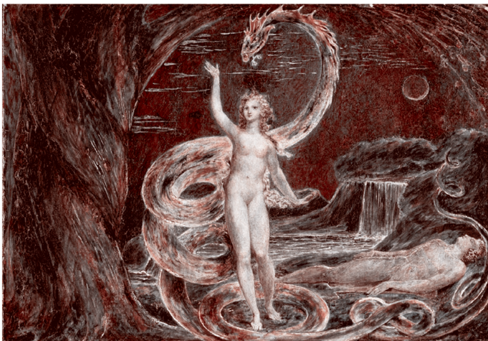
Уильям Блейк. Ева, соблазненная змеем. 1799–1800