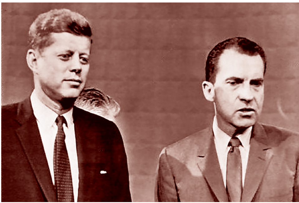
Кеннеди и Никсон перед первыми президентскими дебатами

Патриарх клана Кеннеди в Америке Патрик и его жена Бриджет прибыли из Ирландии в Бостон в 1849 году. Патрик накопил солидное состояние за счет импорта виски. Их младший сын Патрик