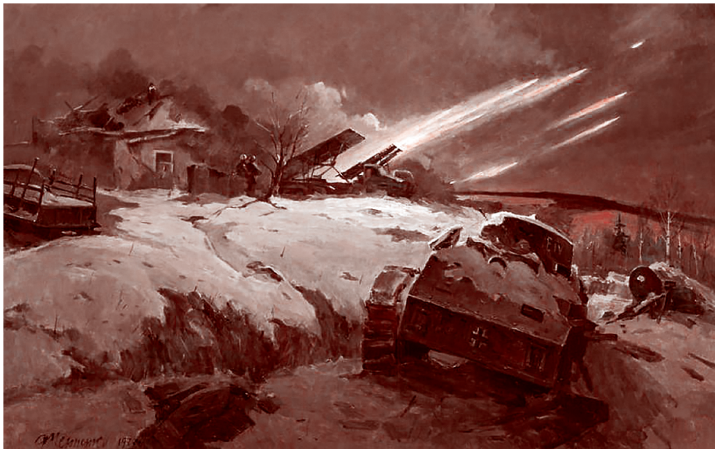
Фёдор Устыенко. Ответ гвардейцев минометчиков. 1949

Если это всё так, и мы хотим жить в буржуазном государстве, так давайте достраивать то, что делает буржуазия. А она делает think tank'и — огромные зоны мозговых центров, которые важнее бюрократии. Она делает частные военные компании — не одну-две, а много. Частные разведывательные компании. Бюджет ЦРУ уже меньше, чем бюджет частных разведывательных компаний Соединенных Штатов. Притом что частные разведывательные компании, конечно, подчиняются ЦРУ и всей этой бюрократии. Но их же