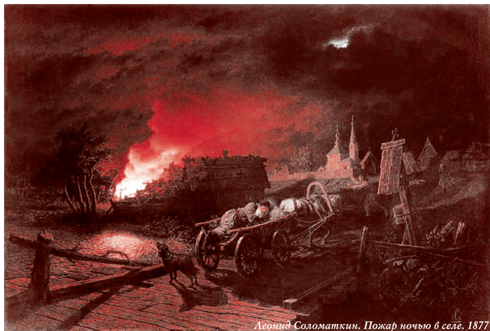
Леонид Соломаткин. Пожар ночью в селе. 1877