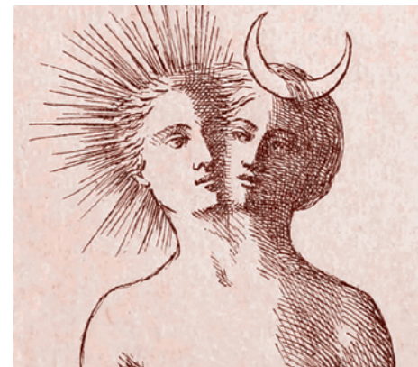
Регис (лат. Rebis) буквально «две вещи» — конечный продукт Великого Делания, олицетворяющий «союз противоположностей».

Вейнингер вообще считает бытие женщины целиком и полностью сосредоточен-