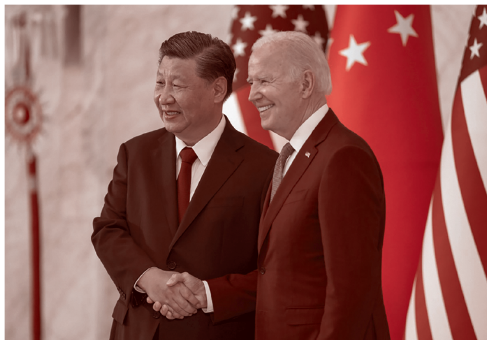
Встреча Си Цзиньпина и Джо Байдена на полях саммита G20 на Бали