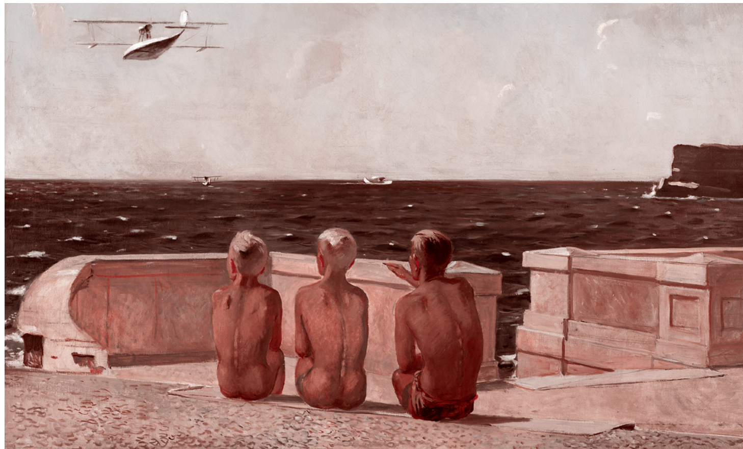
Александр Дейнека. Будущие летчики (фрагмент). 1937

Следующая треть — группа, которая просто ходит в школу. Открытой не хамит, но и не рвется учиться — они заканчат 9 классов, или их «дотащат». А вот третья часть детей представляет особый интерес. О потерянном поколении 1990-х написано уже много. Я не хочу абсолютизировать,