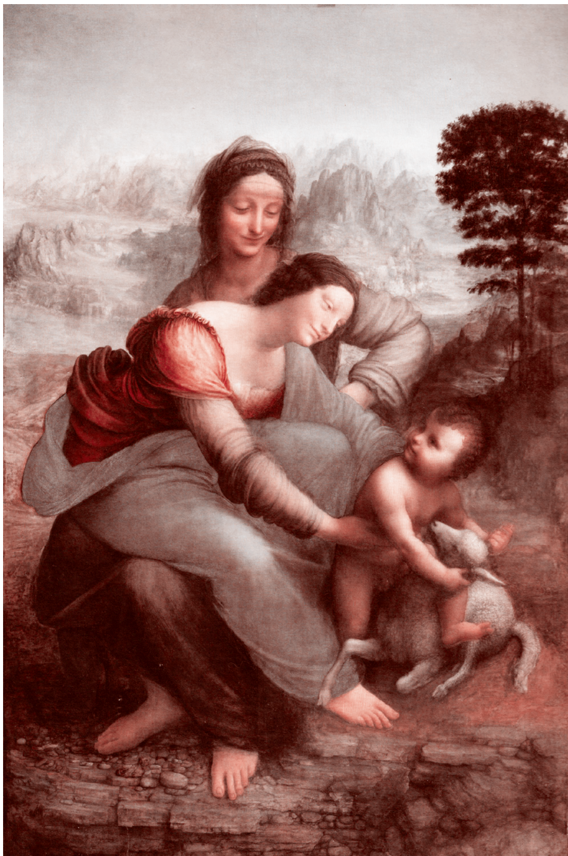
Леонардо да Винчи. Святая Анна с Мадонной и младенцем Христом. 1508–1510

В этой книге доказывается необходимость глубокого осознания опасности и пагубности колдовства, а также лживость и греховность тех, кто пытается отрицать существование колдовства и ведьм. Последние прямо объявляются еретиками. Авторы уделяют огромное внимание опровержению мнения, распространенного в прежние века, о том, что Бог не может допустить широкой свободы зловерных действий дьявола и ведьм в мире. Они настаивают, что по Божьему попущению ведьмами устраиваются самые разные типы злодейств, о которых подробно рассказывают. Среди них, помимо наведения порчи и насылания болезни, — совокупление с демонами, придание людям облика зверей и даже лишение мужчин полового члена. Также разбираются способы врачевания пострадавших. В последней части книги авторы формулируют процессуальные