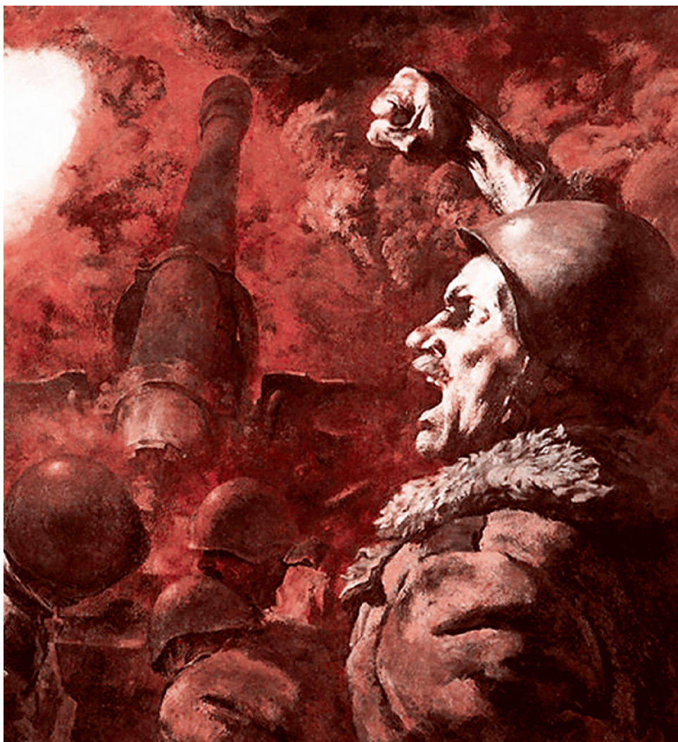
Дмитрий Обозненко. Возмездие. 1984

Юрий Гроеров: Действительно надо, причем очень, очень быстро.