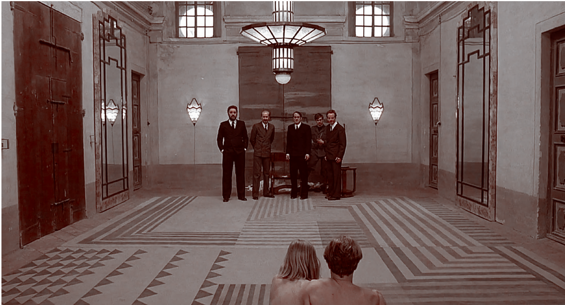
Фашисты президент, судья, герцог и епископ развращают своих пленников. Кадр из фильма «Салò» Пьера Паоло Пазолини. 1975

Сегодня, когда ни у кого уже нет сомнений в том, что Россия вступила в войну с совокупным Западом, для нас крайне важно осмысление противоречий, породивших это противостояние. Первоочередные цели войны лежат на поверхности — мы защищаем своих людей и самих себя. Однако почему мы оказались поставлены в такую ситуацию, что нам пришлось это делать? С чем была связана последовательная антироссийская политика западных стран, не прерывавшаяся даже в период 1990-х годов, когда мы были, мягко говоря, невероятно покладисты и во всем стремились Западу подражать?