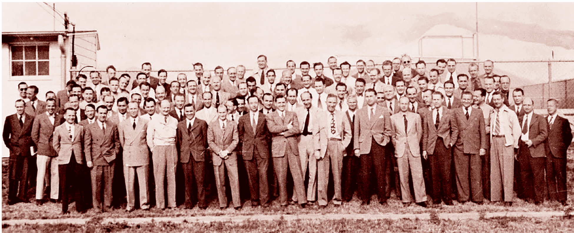
Операция «Скретка». Группа из 104 ракетостроителей в Форт Блисс, Техас. 35 из них работало в White Sands Proving Grounds, Нью-Мексико

1952 года. При этом Хант, Мерчисон и Ричардсон были вполне вхожи в дом Линдона Джонсона, а Дж. Эдгар Гувер был его ближайшим соседом.