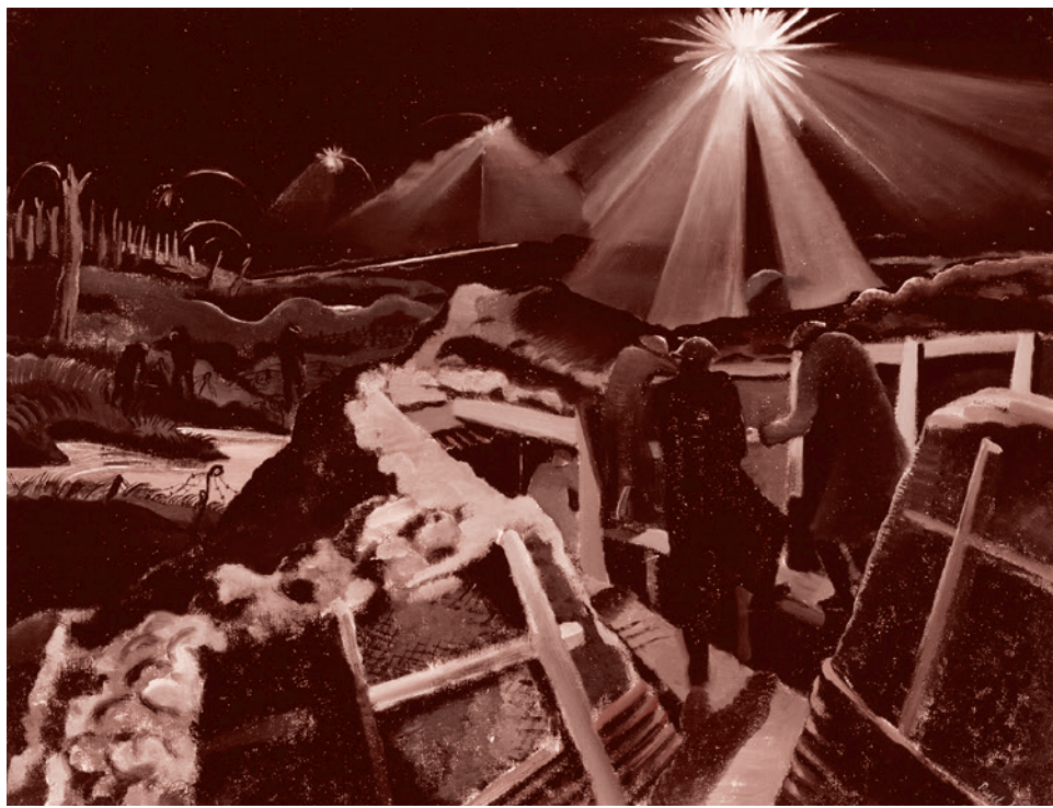
Пол Нэш. В ночи. 1918

Теперь, что происходит с нами, с моей точки зрения. Во-первых, эта операция... Знаете, на людях могут быть красивые костюмы, но потом, когда происходит, скажем, медицинский осмотр, костюмы снимают. И у системы костюмы были очень красивые. Говорилось, что наша армия первая в мире, непобедимая и легендарная. Когда сняли костюмы, выяснилось, что это не вполне так. Но! Это же не значит, что ее нет. Или что она абсолютно гнилая. Была бы она абсолютно гнилая, мы бы не выдержали даже того противостояния, которое