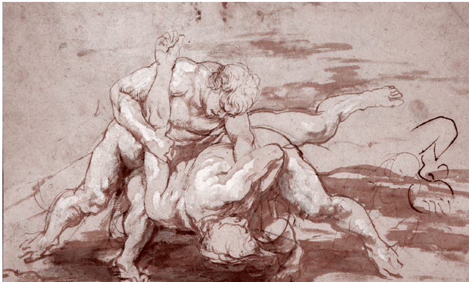
Питер Пауль Рубенс. Борьба. 1600-е