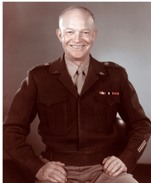
Дуайт Дэвид Эйзенхауэр