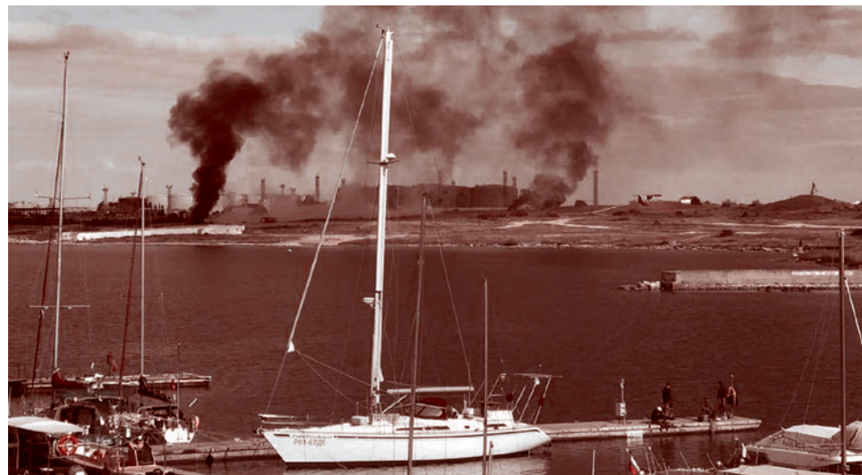
Атака ВСУ на базу Черноморского флота в Севастополе

Атака на Севастополь ожидалась, но никто не мог сказать, как она будет выглядеть,