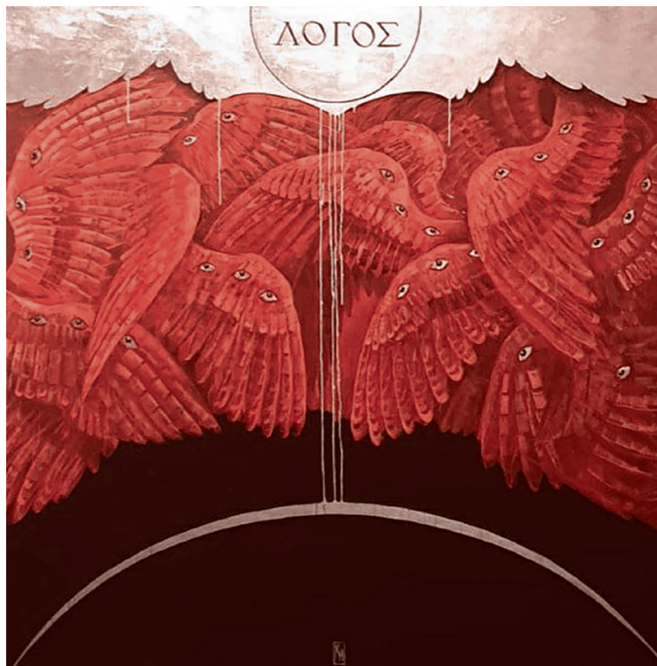
Кэти Меладзе. Логос. Первый день творения

Полемику внутри «Современника» между авторами — дворянами (Тургеневым, Гончаровым, Толстым) и революционно настроенными разночинцами (Чернышевским и Добролюбовым) — можно сравнить лишь с публицистическими баталиями французской революции, когда мысль, идеи двигали общественное чув-