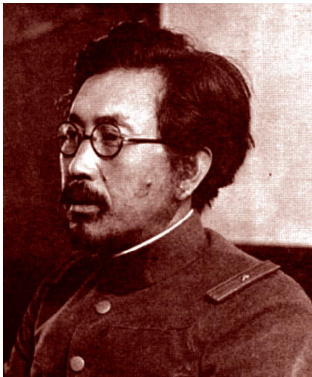
Сиро Исии — командир отряда 731