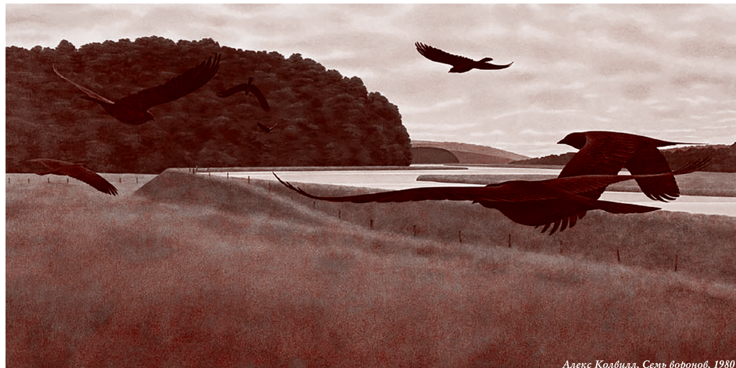
Алекс Колвилл. Семь воронов, 1980