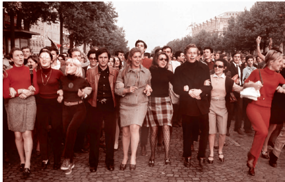
Майские события во Франции 1968 года

Классическая русская журналистика XIX века не имеет ничего общего с западной. Она в полной мере продолжает «мессианство» русской литературы, для которой Слово и впрямь было Бог.