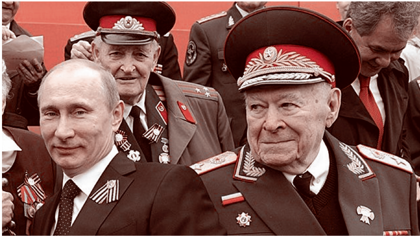
Генерал Бобков рядом с президентом Путиным на праздновании Победы. 2012

Вопрос номер два. Замечательные слова сказал президент России — я всё говорю искренне, никакой иронии тут нет — заме-