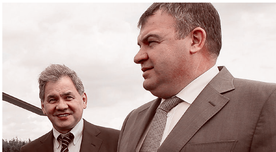
Министр обороны Сергей Шойгу и его предшественник Анатолий Сердюков

У нас сейчас гребут людей под гребенку. Нужно в каждом крупном комиссариате — а мелкие лучше убрать, вполне достаточно ста таких крупных комиссариатов — нужно ввести должность, которая позволяет выставлять категорию физиче-