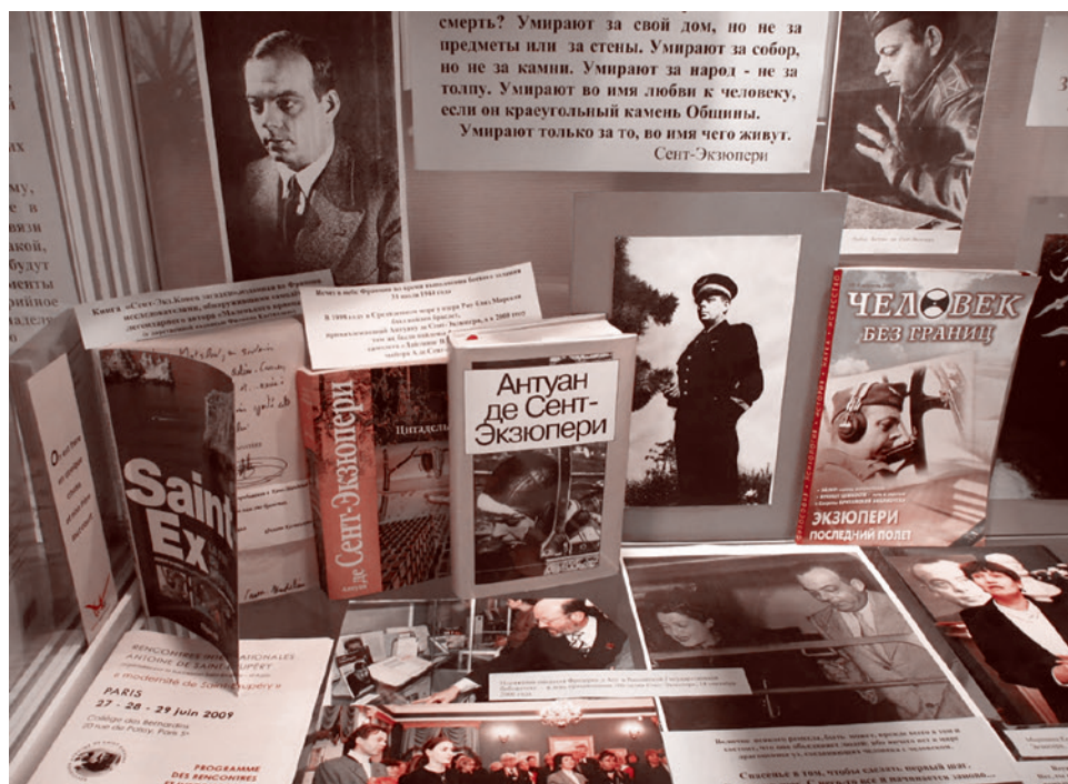
Книги и фотографии музейной экспозиции Фонда «Мир Сент-Экзюпери». Библиотека — Культурный центр им. А. де Сент-Экзюпери

чески «пятой колонны», превратившей специализированное учреждение культуры в «доходный дом» для получения внебюджетных доходов и профанации творчества всемирно известного писателя-летчика. В условиях проводимой СВО на Украине это можно расценивать как саботаж установок президента о всемерном развитии патриотизма. Авиаполк «Нормандия — Неман» и его летчики, вместе с именем Сент-Экзюпери, в любой политической обстановке являются символами дружбы и исторических традиций между Россией и Францией.