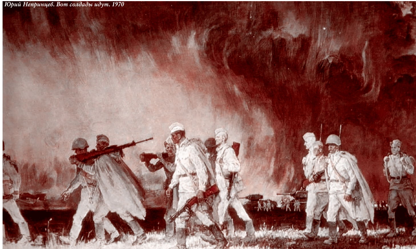
Юрий Непринцев. Вот солдаты идут. 1970