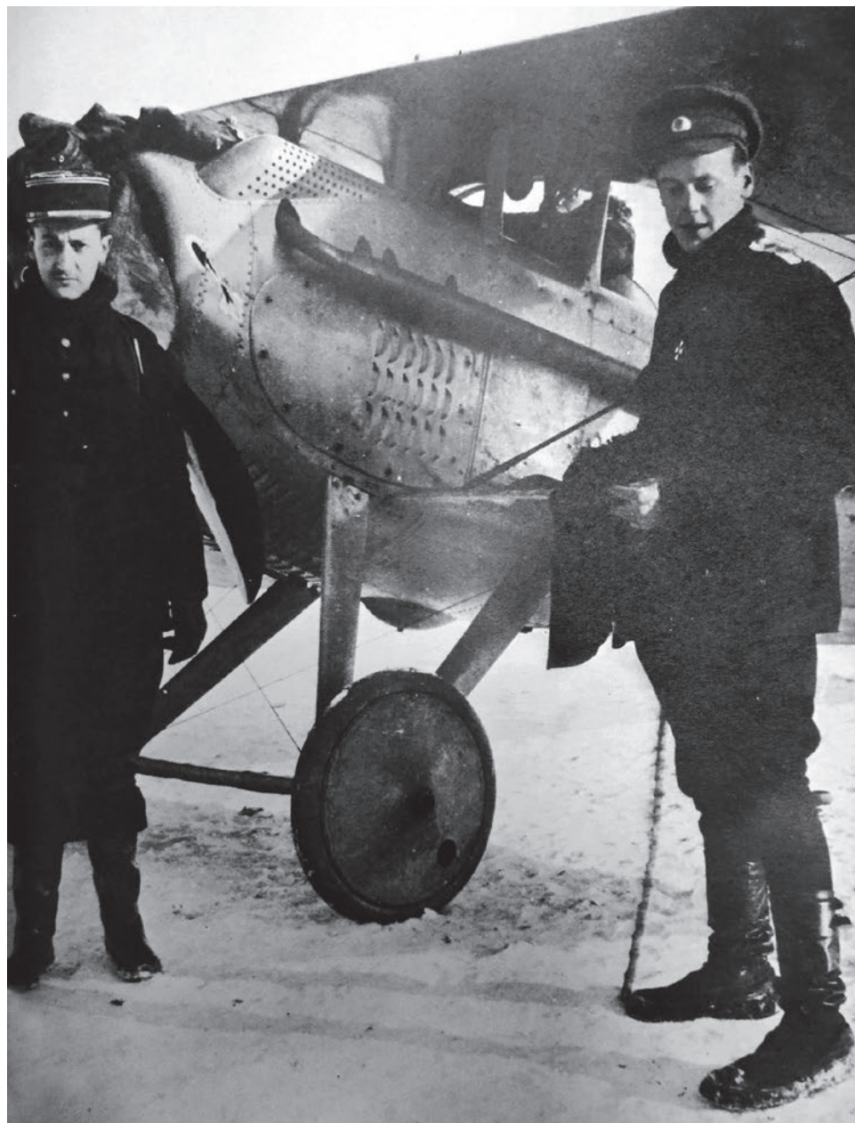
Легендарный французский летчик Жорж Гинемер — командир эскадрильи «Аисты» (слева), известный русский летчик Иван Орлов (справа)

В 2020 году созданную усилиями летчиков и космонавтов Библиотеку — Культурный центр им. А. де Сент-Экзюпери авиакосмической специализации, получившую за 11 лет работы многочисленные благодарности и награды, ставшую местом общения наших военных и гражданских летчиков, Героев страны, космонавтов, ученых, ветеранов ВВС и реального, а не в отчетах, патриотического воспитания молодежи, вынудили прекратить свою деятельность и эвакуировать уникальные материалы, целевой книжный фонд и медиатеку, три музейных экспозиции и оформление, собираемые несколько десятилетий. Это произошло с помощью бюрократических интриг чиновников под эгидой московского департамента культуры, а факти-