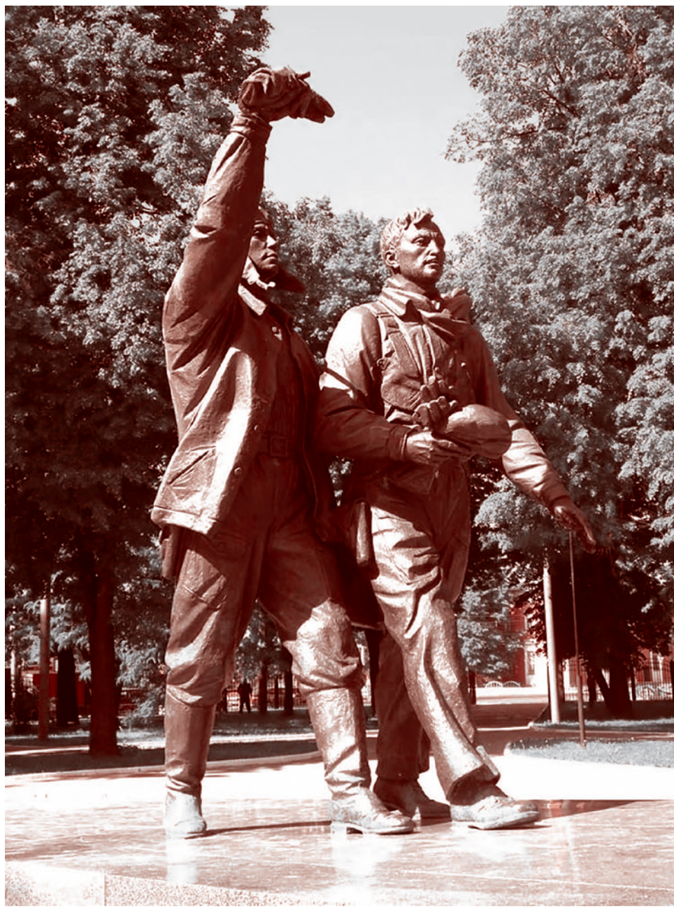
Памятник французским летчикам и русским механикам авиаполка «Нормандия — Неман». Москва, Лефортово

В СССР «Нормандия» прибыла в качестве сформированной боевой единицы. 25 ноября 1942 года было подписано соглашение об участии французских воинских частей в военных операциях в Советском Союзе. Оно начинается с фразы о том, что в СССР направляются сформированные боевые единицы.