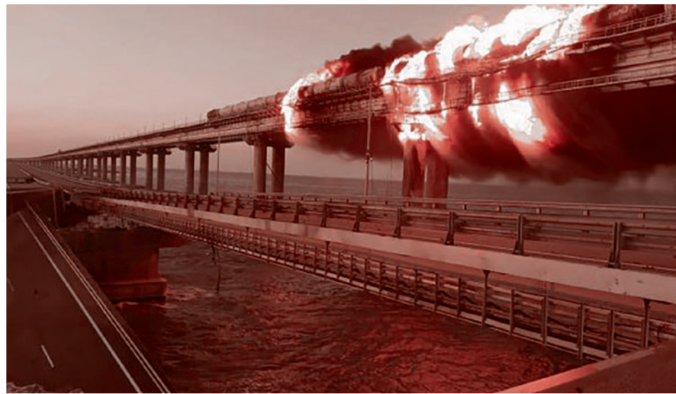
Пожар на Крымском мосту.

Аналогичного признания, но уже со стороны представителя правительства