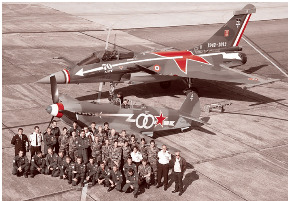
Современный французский самолет — истребитель «Рафаль» и советский самолет Як-9, на котором воевали летчики «Нормандии — Неман» в годы Второй мировой войны