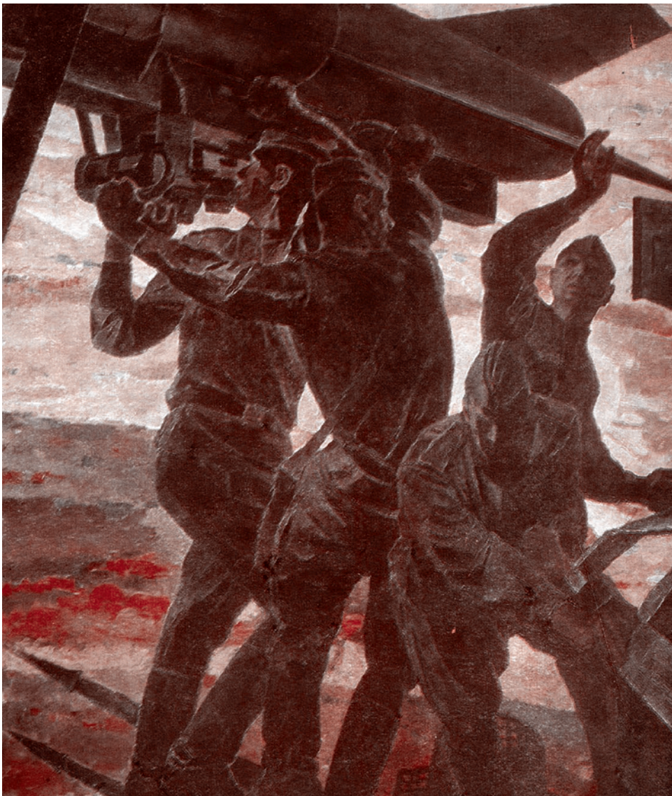
Николай Овечкин. Тревога. 1969

скую и психическую: сильно мотивирован, неустойчив, слабо мотивирован, не мотивирован. И собирать надо лучшее, это лучшее надо правильно учить.