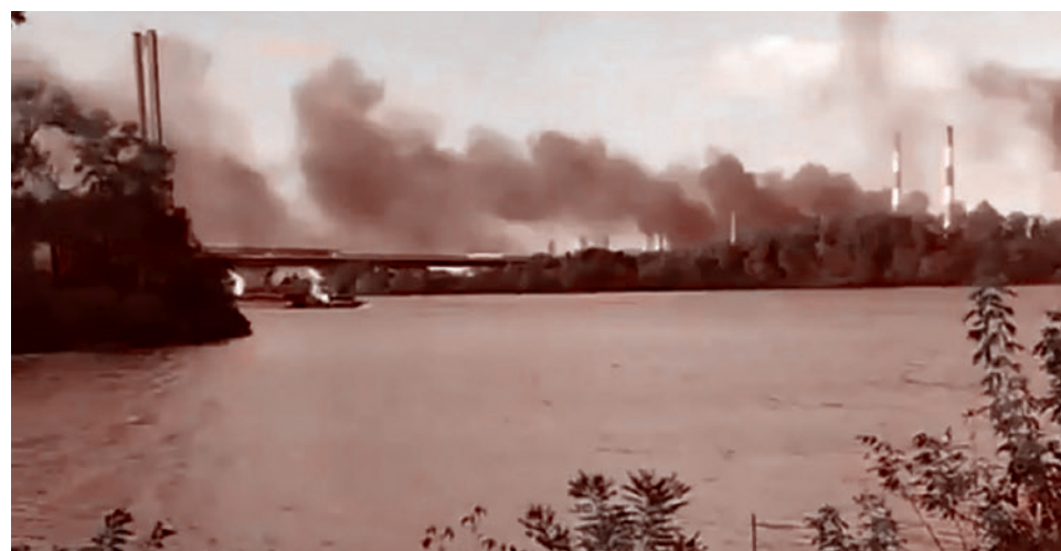
Последствия удара по киевской ТЭЦ

«Высокопоставленный украинский чиновник подтвердил российские сообщения о том, что за нападением стоит Украина. Чиновник, говоря на условиях анонимно-