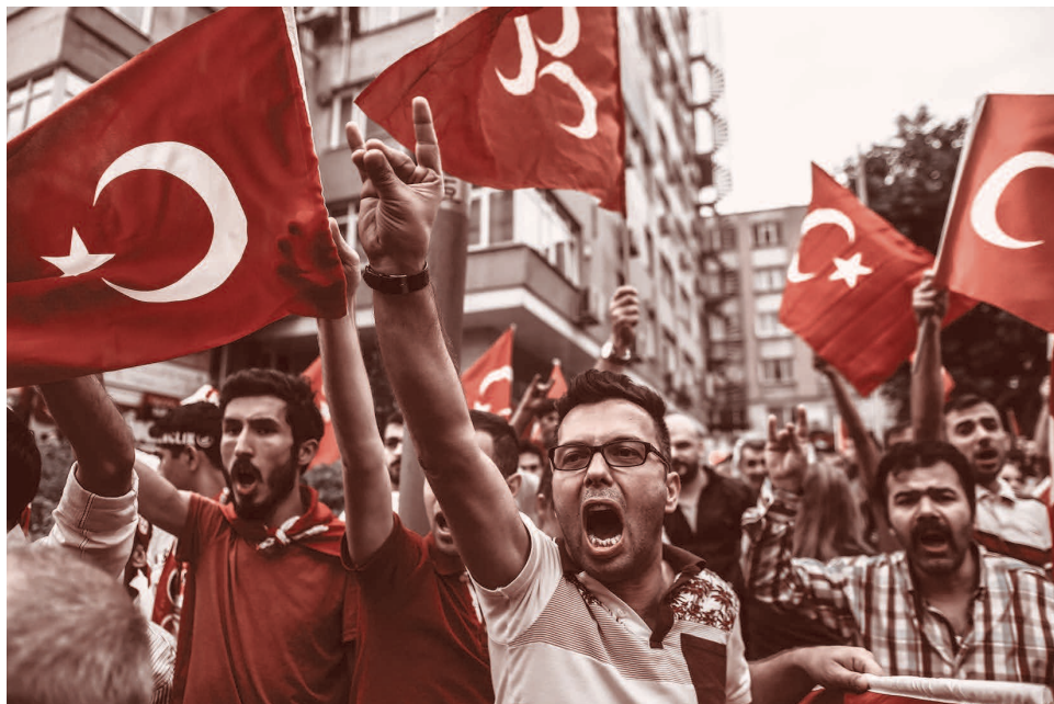
Демонстрация «Серых волков» в Стамбуле

И, наконец, последнее. Я никогда не понимал до конца, хорошо зная Европу, как американцы ее держат за одно место. Вот чем? Ну понятно — базами, понятно — деньгами. Еще чем-то, понимаете? Там есть что-то особое. Она особым образом не суверенна. Поэтому они и рассматривают это как свое хозяйство. Америка сказала «надо», Европа ответила — «есть». Она может чуть-чуть повыпендриваться, но только чуть-чуть. «Наши европейские коллеги не хотят, но ничего, мы их сейчас перевоспитаем. Шольц плохой, да? Сделаем хорошего. Он там недостаточно хорошо работает на Украину? Найдем такого, что будет работать».