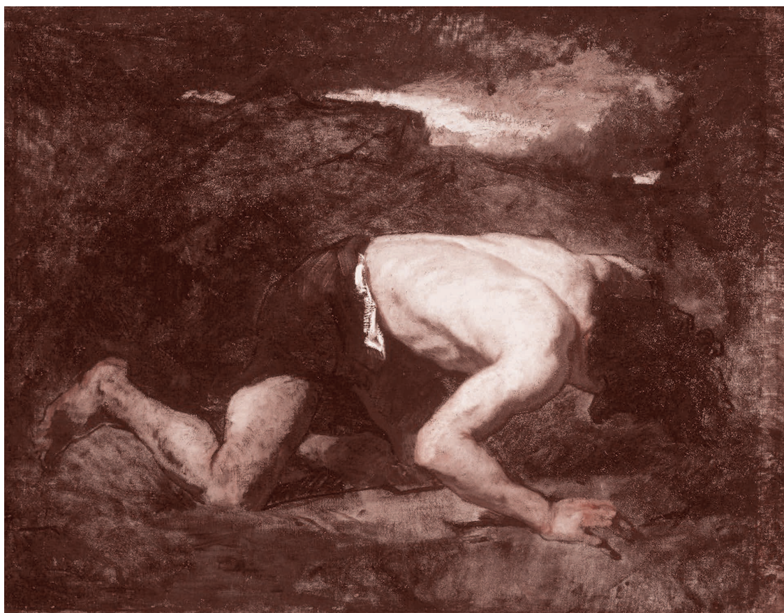
Томас Кутюр. Беглец. 1857

В этой связи удивительно ли, что «генералы информационных войн» и «инженеры человеческих душ» не только последние годы, но и даже последние месяцы вместо нормальной работы с населением бляели что-то невнятное. Не смогли нормально проартикулировать, что это не «Россия напала», а Украина пошла на эскалацию — готовила вторжение в Донбасс, концентрировала войска, в феврале начала артподготовку (из карт ОБСЕ ясно, куда стреляли), 19 февраля Зеленский шантажировал Запад, требуя от НАТО гарантий безопасности (т. е. прикрытия при вторжении в Донбасс) и угрожая сде-