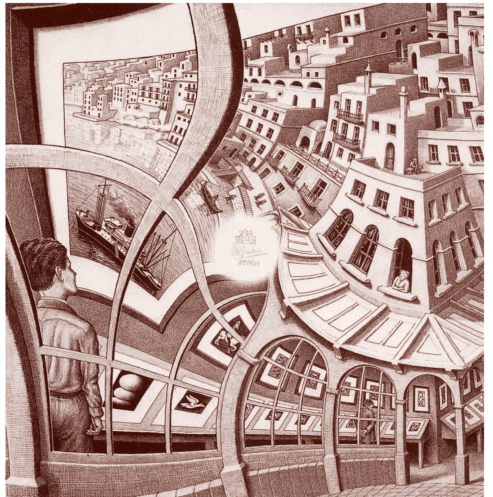
Морис Эшер. Картинная галерея. 1956

РБ: Прикольно, обычно вроде наоборот. Давай вот, попробуй сформулировать