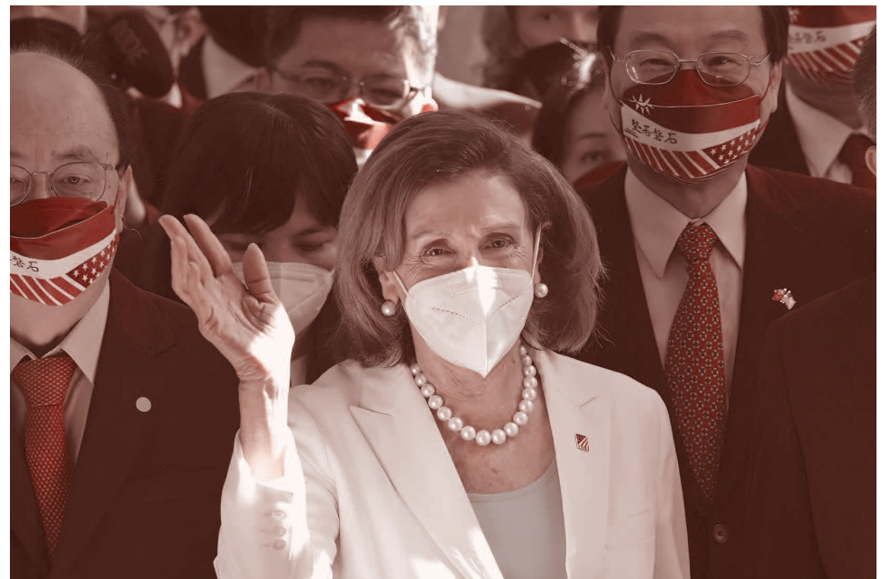
Визит Нэнси Пелоси на Тайвань. Август 2022

Китайцы никогда не торопятся. Они всегда действуют только тогда, когда им выгодно, И ничего не забывают и ничего не прощают.