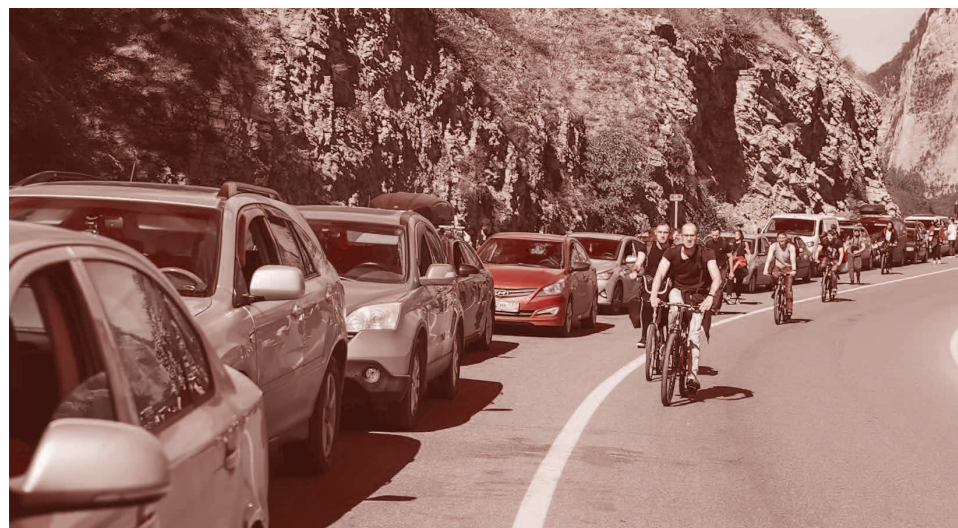
Люди на велосипедах объезжают колонну из 3,5 тыс. автомобилей, пытающихся попасть из России в Грузию. 27 сентября 2022 года

Зинин признался следователям, что устроить стрельбу он решил из-за гибели 19-летнего лучшего друга во время специальной военной операции на Украине. Помимо этого, после объявления частичной мобилизации в России повестку получил его двоюродный брат — 21-летний Василий Гуров. Ранее отмечалось, что и сам 25-летний Зинин должен был быть мобилизован.