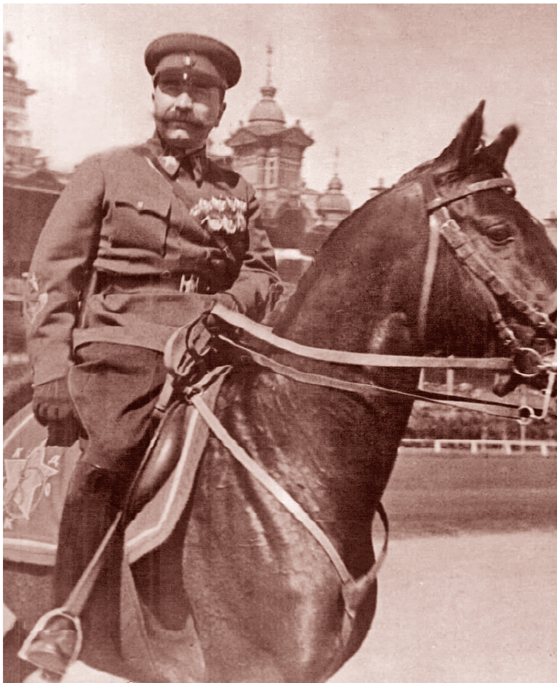
Советский полководец Семён Будённый

Смысл заключается в том, что сознательно создается эта мерзкая «средняя война», в которой вами расплачиваются за то, какие будут в дальнейшем параметры мирового процесса. Это эксперимент над