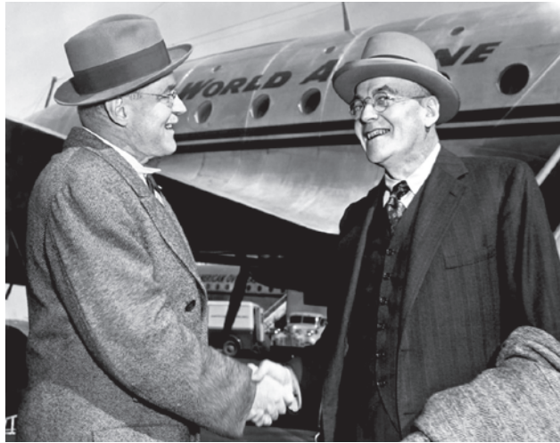
Алан Даллес встречается со своим братом Джоном Фостером Даллесом (справа), эксперта по внешней политике Республиканской партии, когда он прибывает в Нью-Йорк. Октябрь 1948

Узкий круг «мудрецов» по своей структуре и поведению служит отличным примером работы CFR в качестве интегрирующего звена между американской деловой элитой (Гарриман, Ловетт, Ачесон, Макклой) и экспертным сообществом (Кеннан и Боулен). Вплоть до конца президентства Линдона Джонсона эта «шестерка» была главной группой советников по внешней политике для президентов из обеих партий. Она открыла двери и для следующего поколения внешнеполитических «мудрецов», яркими представителями которого были Збигнев Бжезинский и Генри Киссинджер. (Продолжение следует.)