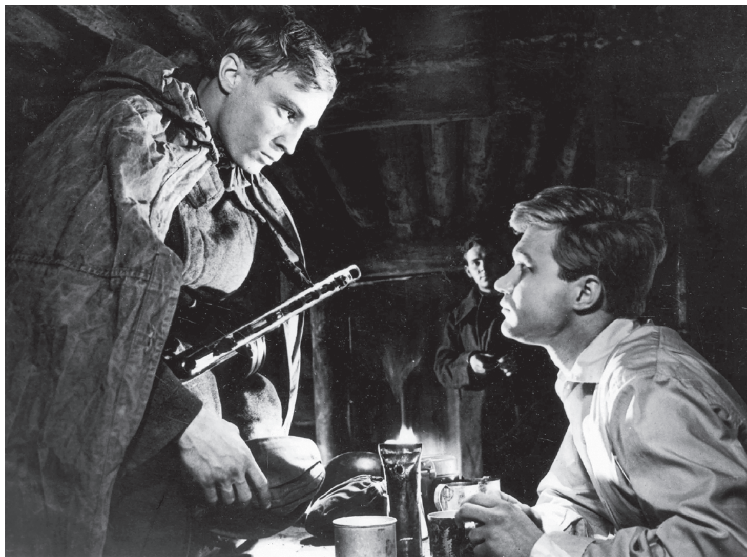
Встреча сына с погибшим отцом. Кадр из фильма Марлена Хуциева «Мне 20 лет». 1964

Однако стоило Горбачеву начать перестройку, и в скором времени народ дружно затосило от всей этой символики и от ее обилия. По большому счету, это произошло только потому, что власть сумела убедить народ в несправедливости советского бытия. Причем дутых ужасов сталинских репрессий было недостаточно, ведь осуждение культа личности не привело к мгновенному отказу от собственного пути в 1956-м (хотя, безусловно, дало мощный толчок к его формированию), и к этой теме добавили яростное поругание Ленина. Но и на этом власть не смогла бы полностью разочаровать народ так, чтобы он со-