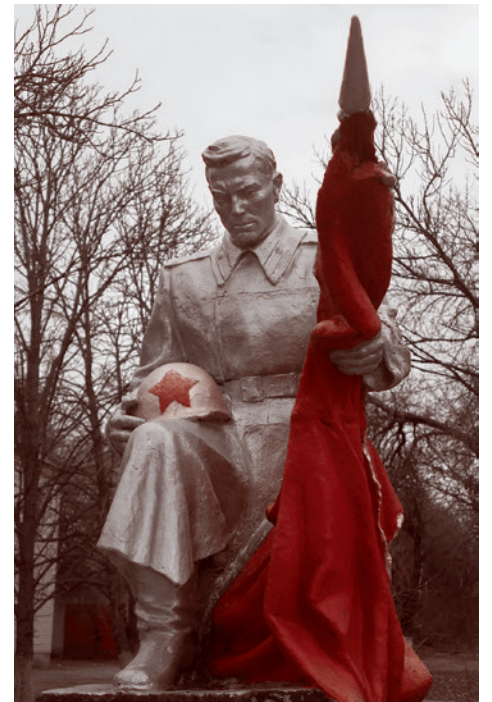
Село Червоное Поле. Февраль 2022

низаторов как бы вообще непростительно, но — факт.