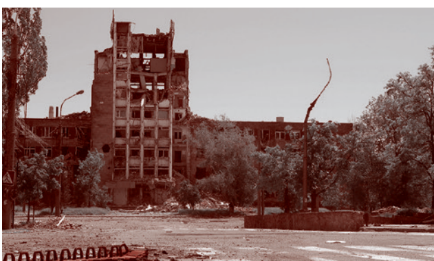
Район площади Освобождения