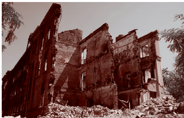
Школа напротив автовокзала