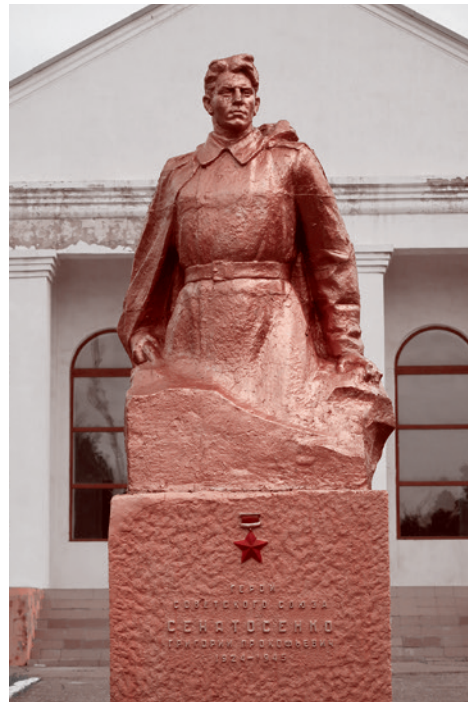
Село Боевое. Май 2021