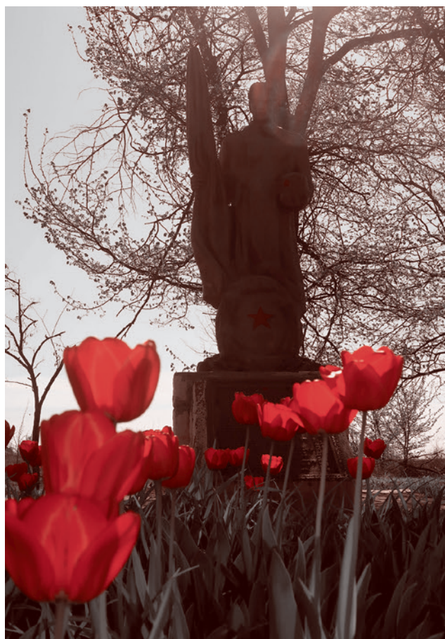
Памятник погибшим при освобождении Талаковки от немецких захватчиков

На обратном пути, оторвавшись от остальных (разница в физподготовке никому не пропала, а катить медленно мне неудобно), заехал на памятник погибшим при освобождении Талаковки от немецких за-