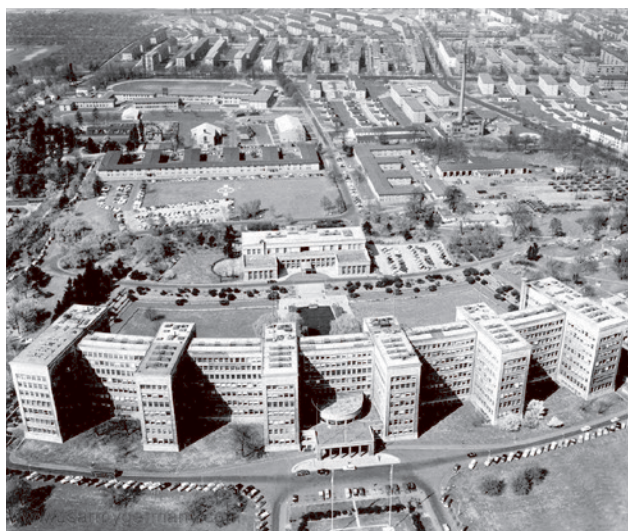
Здание компании IG Farben