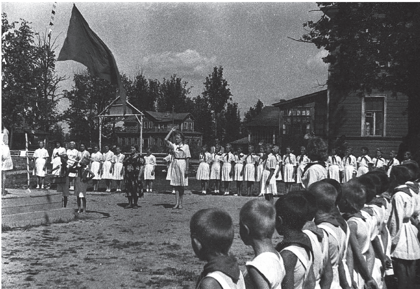
Поднятие красного знамени в советском лагере

Но вернемся к символам. Власть даже Мавзолеем Ленина на День Победы не решилась открыть. Хотя от такого простого действия до реального поворота лицом к народу нужно еще тридевять земель в железных башмаках пройти. И процесс, скорее, идет в обратном направлении — например, в Хабаровске в этом году на День Победы тоже закрыли памятник Ленину по примеру Мавзолея. И представители власти, начиная с президента, продолжают обвинять большевиков в том, в чем им больше следовало бы спросить с себя — в пренебрежении интересами России из-за следования догматам, транслируемым с Запада.