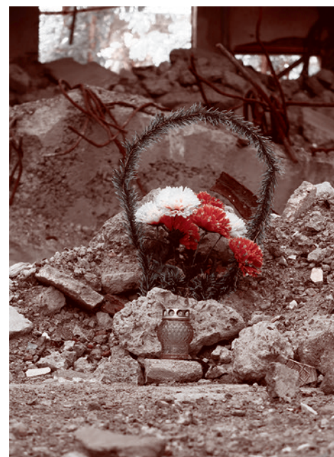
На железнодорожном вокзале. Июнь 2022