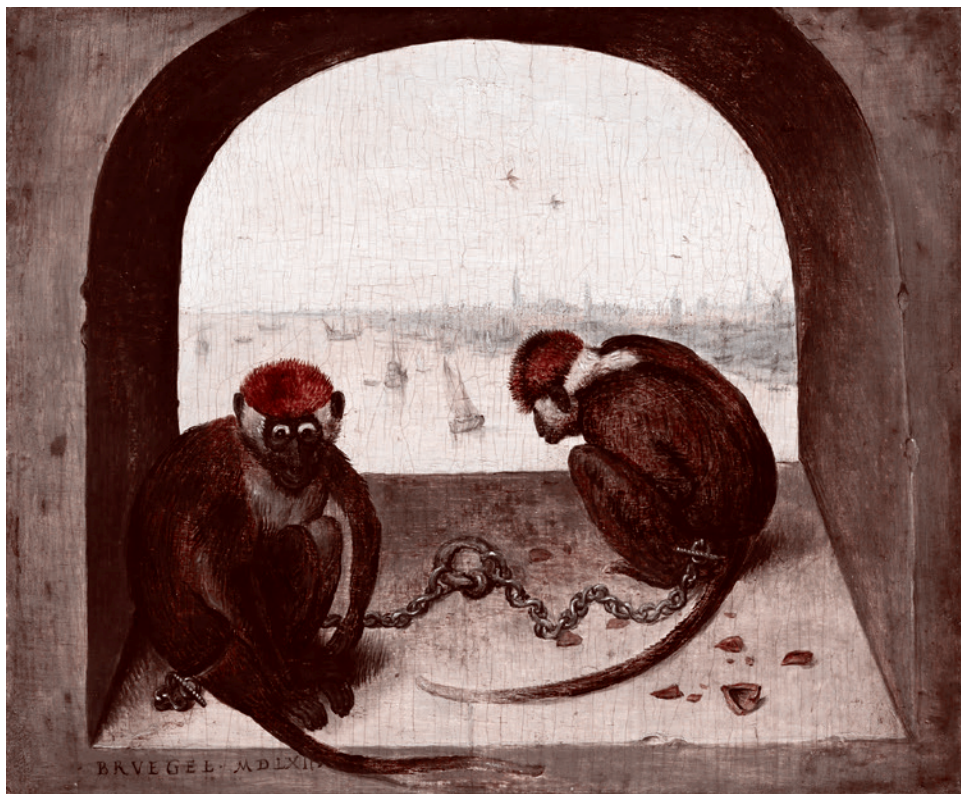
Питер Брейгель Старший. Две прикованные обезьяны. 1562

Кроме того, имеет место глобализация, мировое разделение труда. В нем надо занимать достойное место, но не пытаться упражняться на «совковский» манер, добиваясь какой-то самодостаточности. Хватит! Доупражнялись! Нарвались!