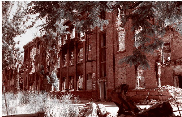
Школа напротив автовокзала