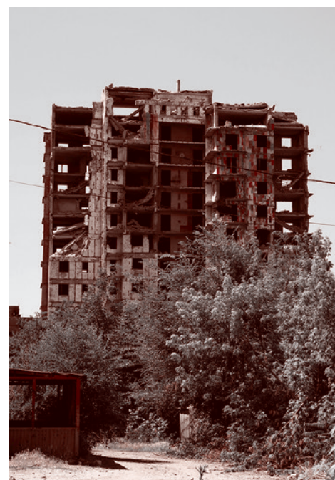
Дом рядом с автовокзалом