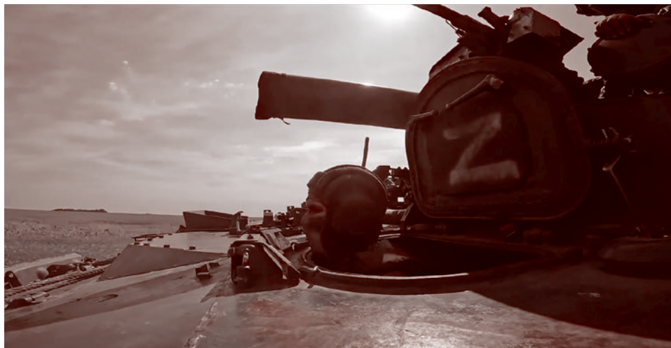
Расчет 240-мм самоходных минометов 2С4 «Тюльпан» Западного военного округа

«О Балаклее могу сказать только то, что можно действительно назвать