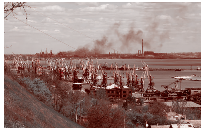
Краны морского порта