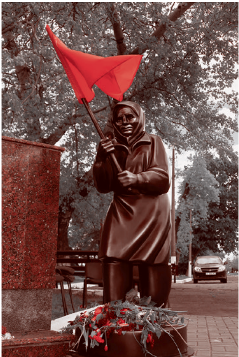
Скульптура бабушки со знаменем Победы