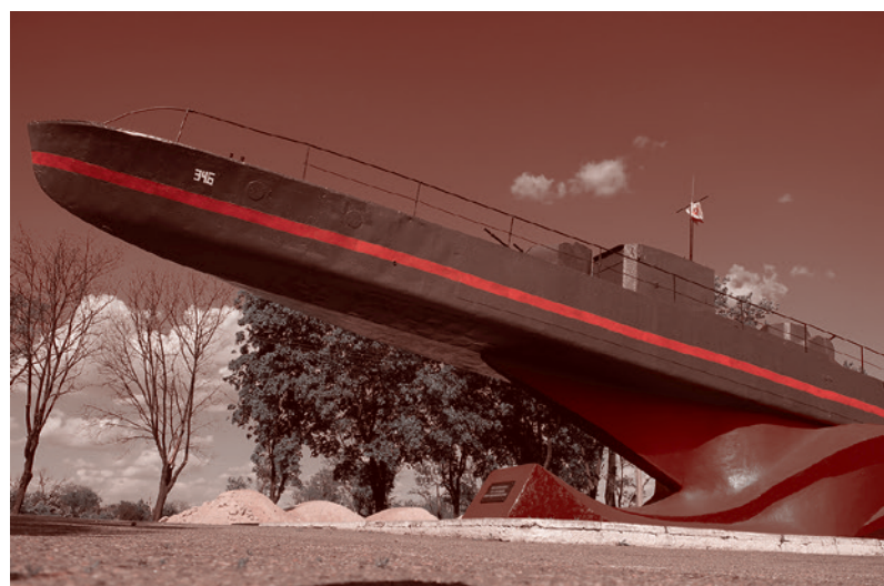
Памятник морякам-освободителям Мариуполя от фашистов

Как же вызвать желание перемен? Продемонстрировать примеры лучшего устройства общества, вызвать доверие людей внутри себя, между собой и между народом и властью. Чрезмерная бюрократизация, постоянная необоснованная перемена правил вызывают ощущение, что по-прежнему «не бумажка для человека, а человек для бумажки». Это способно повлечь за собой отторжение всего нового, даже светлого; за этими сухими деревьями перестает быть виден живой, благоухающий жизнью лес. Всякое доверие крайне легко потерять, но не всегда возможно вернуть, — это игра с ненулевой суммой, в особенности когда значительное число жителей в лучшем случае ультраскептики (а есть еще затаившиеся противники, коих не так мало, как хотелось бы), не верящие ничему, кроме дел,