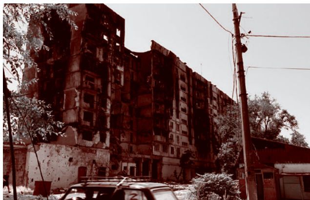
Дом рядом с автовокзалом