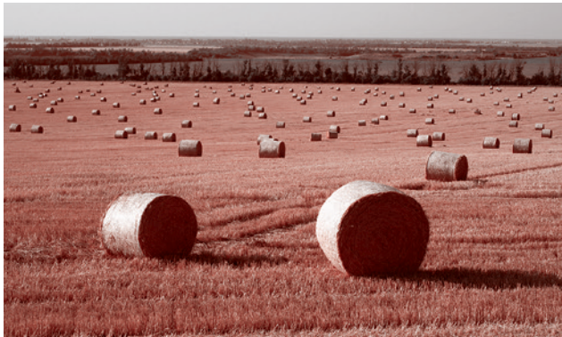
30 июля 2022