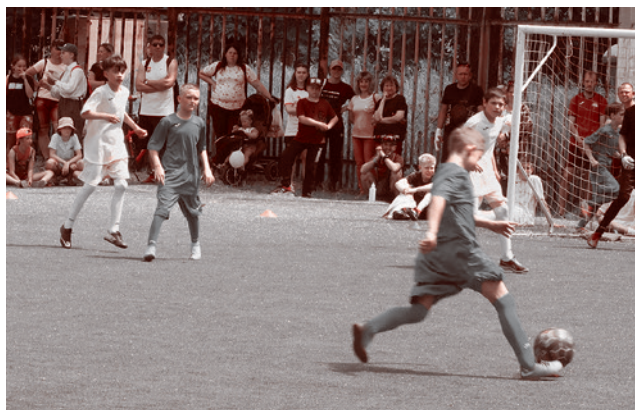
Футбольный матч на День защиты детей

Одиннадцать лошадей в прямом смысле слова прошлись копытами по осколкам войны. В этом отношении людям намного проще: мы хотя бы понимаем, что происходит и почему, но поди объясни это животным, в особенности таким пугливым, как лошади. Было попадание в крышу конюшни — ранило одного жеребца, едва не перебило спину; четыре лошади от взрыва оглохли, но у трех из них слух уже вернулся. Вороной Кордон всё еще контужен, хотя вроде есть признаки, что тоже слышит. Крыша по-прежнему боится ливня и ветра, и трудно представить, каково будет зимой. Некоторые лошади настолько истощали, что трудно признать в бедняжке Весте, в роду у которой были