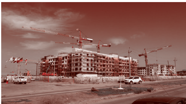
Стройка по ул. Куприна. 29 июля 2022