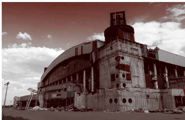
Спортивный комплекс «Ильичевец»