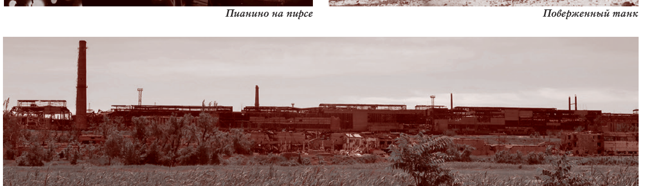
«Азовсталь». Июнь 2022