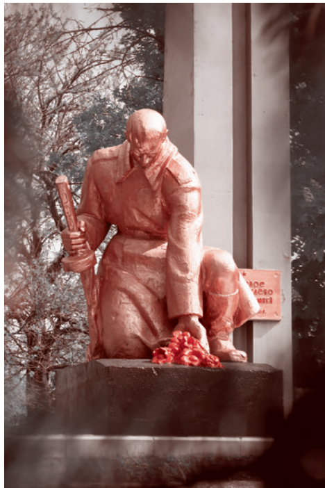
Село Боевое. Май 2021