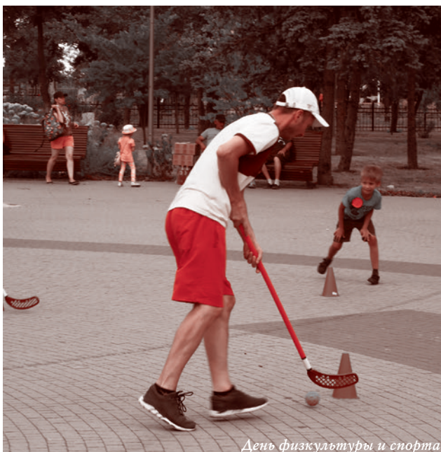
День физкультуры и спорта

Грядет осень, дни становятся всё короче, а электричество вернулось еще не везде. Те же, кто нуждается в стационарном интернете, в том числе муниципальные и коммунальные службы, а также райотделы внутренних дел, его подчас также не имеют, что создает трудности горожанам: от необходимости выжидать в длинных очередях до неразберихи и необходимости подачи заявок повторно. А есть еще школьники. Как им готовить уроки? А если вдруг удаленная форма обучения, тогда как?