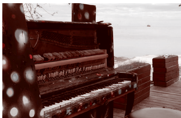
Пианино на пирсе