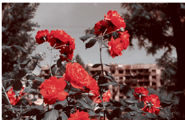
Розы цветут несмотря ни на что