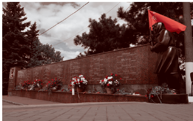
На площади Воинов-Освободителей

выполненных не ради одной только заметки в газете, а на совесть, словно делаешь это для самого себя.