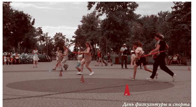
День физкультуры и спорта