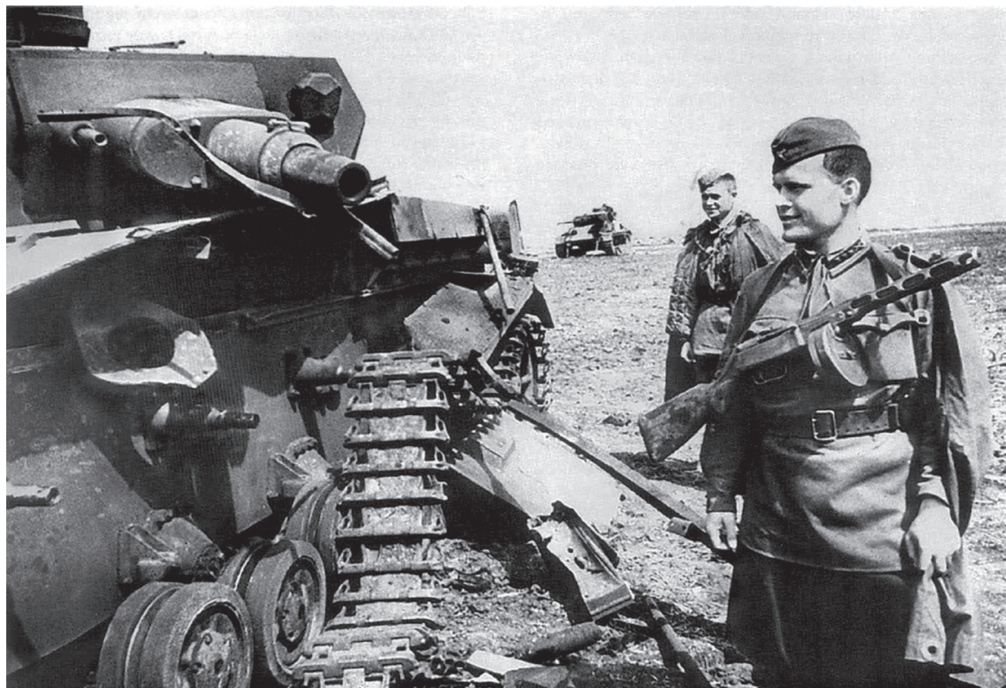
Советские артиллеристы осматривают подбитые немецкие танки Pz.Kpfw. IV (на переднем плане) и Pz.Kpfw. III. Юго-Западный фронт. 1942

Меньше чем через минуту танк сильно качнуло, и под днищем раздался сильный металлический скрежет раздавленного орудия. Разбрасывая бревна и доски, наш танк протаранил сарай насквозь! С громовым «Уррр-а-а!» уже шла в штыковую наша пехота. И немцы дрогнули, не приняв штыкового боя, ста-