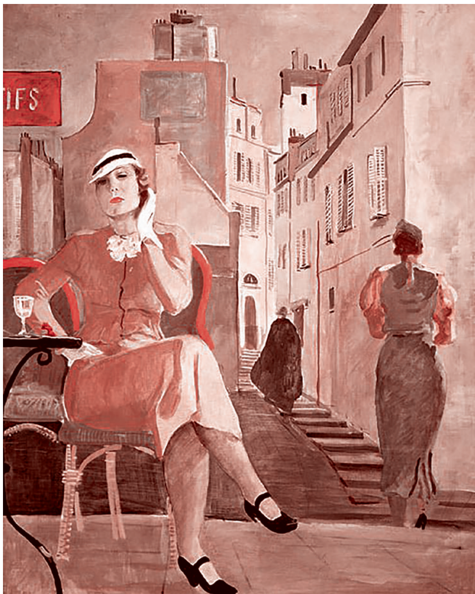
А. Дейнека. В кафе. 1935

И надо отдавать себе отчет в том, какую психологическую базу в сознании населения создавали на протяжении всего постсоветского, да и позднесоветского, так называемого перестроечного, периода.