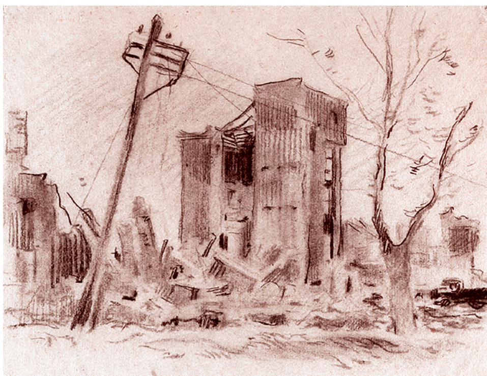
В. Сигорский. «Разрушенный дом»

какой пенсии не хватит. Но зато квартплату пока платить не заставляют. Не знаю, что будет дальше... С другой стороны, за что платить, если нет ни газа, ни воды