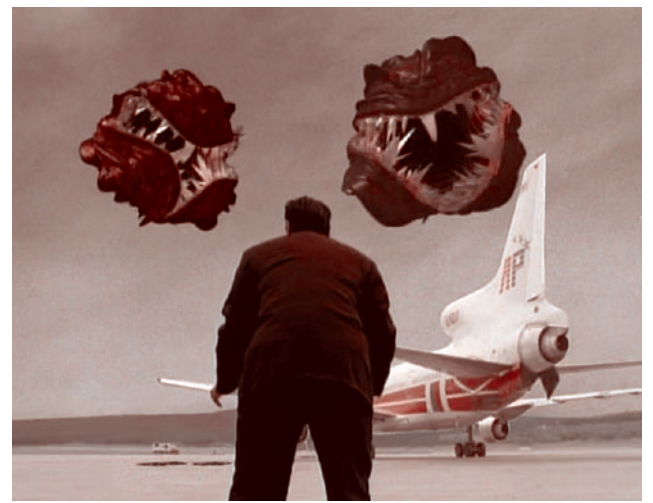
Кадр из мини-сериала «Лангольеры»

Почему в вопросе об образовании школьников и студентов определяющим фактором должна быть коммерческая выгода разработчиков и продавцов видеоигр, а не здоровье молодежи? Интересы общества и интересы бизнеса в данном случае