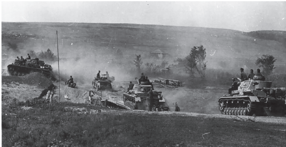
Танки немецкой 16-й танковой дивизии движутся на Сталинград