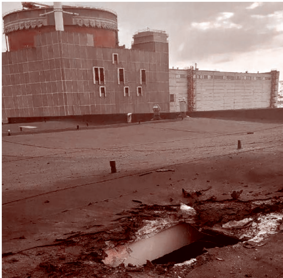
Повреждение кровли Запорожской АЭС.

Боевой квадрокоптер Revolver 860 предназначен для поражения минами супотных сил противника.