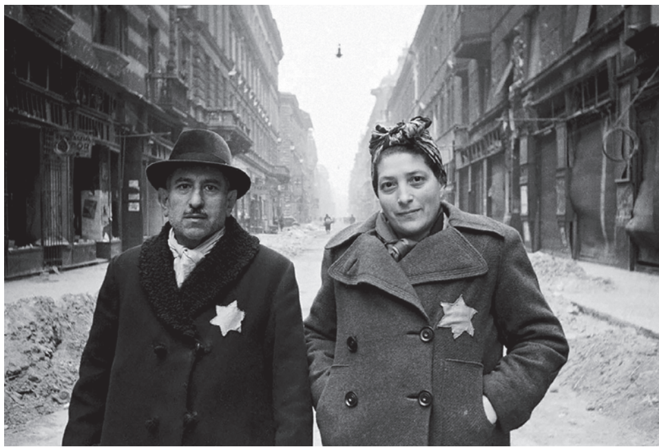
Освобожденные из будапештского гетто. 1945

Если кто-то думает, что это дешевая эксцентрика, то этот кто-то совсем не знает Корчинского. Не знает его покровите-