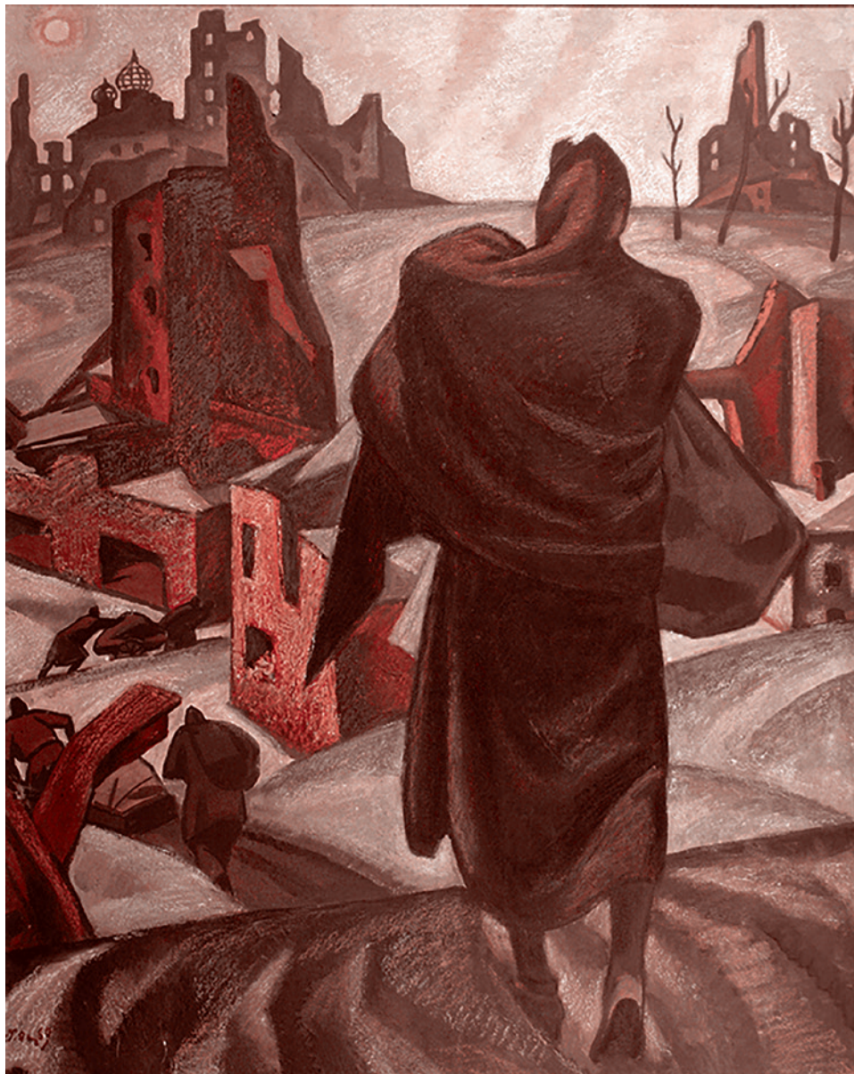
П. Оссовский. «Год 43-й». Из цикла «Рубежи жизни Родины». 1969

Когда вернулась в Харьков, было, конечно, очень страшно. Дома разрушены. Окон нет. Пусто, безлюдно. Потом харьковчане начали потихоньку возвращаться, из Западной Украины в основном. Но в принципе жить можно пока, гуманитарную помощь кое-какую дают и пенсию, как ни странно, выплачивают. Пенсия у меня небольшая, но сколько мне надо... Правда, вот лекарства... Но всё равно, тех, которые мне нужны, в аптеках нет. Продукты, конечно, сильно подорожали, но мне пока хватает. Конечно, если есть гречку, то ни-