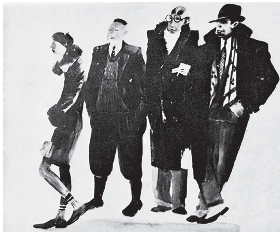
А. Дейнека. Золотая молодежь. 1928

Вся та сложность, на основе которой можно было бы создать то, во что можно «переобуться», убила в ходе регресса. Подражатель — это существо намного более простое, нежели тот, кто предлагает альтернативы. Альтернативы его неубеди-