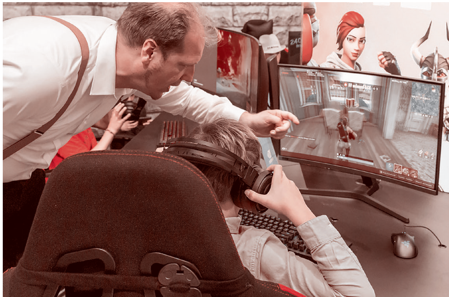
Обучение видеоигре Fortnite

В 2017 году председателем ИРИ стал председатель комитета Государственной Думы по информационным технологиям и связи Леонид Левин. Примечательно, что тогда же, в 2017 году, он выступил на Национальном рекламном форуме и рассказал о драйве-