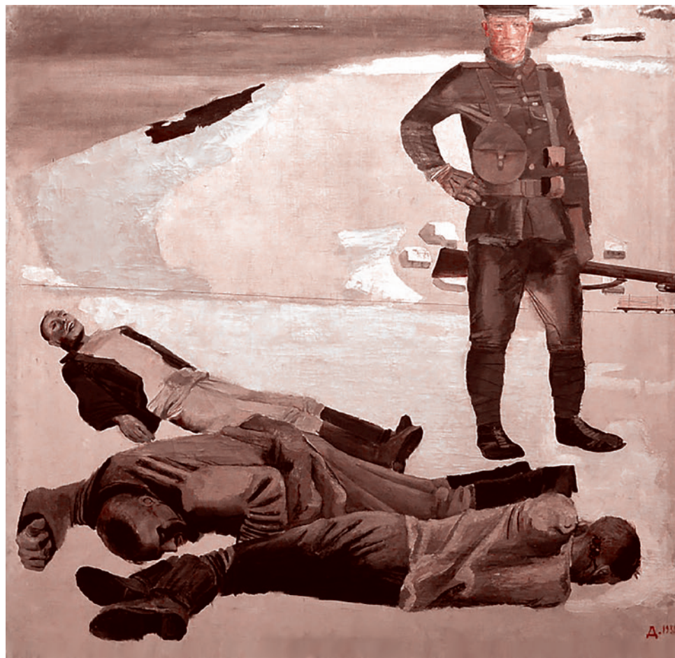
А. Дейнека. Наемник интервентов. 1931

Сказать же: «Я ненавижу русских» — это нарушение абсолютного запрета для дипломата, работающего в России. И апел- ляция к тому, что русские не просто хаят, а относятся к категории людей, неспособ-