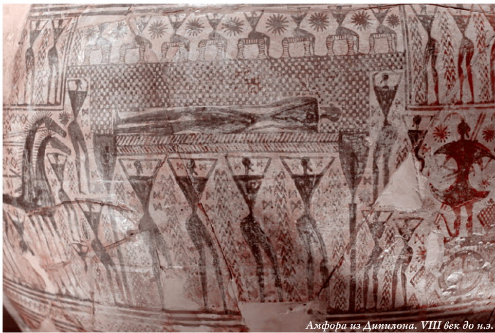
Амфора из Дипилона. VIII век до н.э.

уж точно помнят. И элита упрощения, то есть регресса, не может утвердиться без вытеснения с территории власти всего сложного. Да и зачем оно нужно? То есть, конечно, есть элементы сложности в воровстве. И их надо осваивать, а то тебя обнесут. Но остальное-то не нужно.