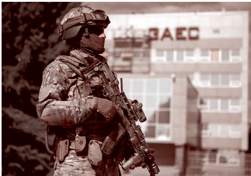
Военнослужащий ВС РФ на территории Запорожской АЭС в Энергодаре