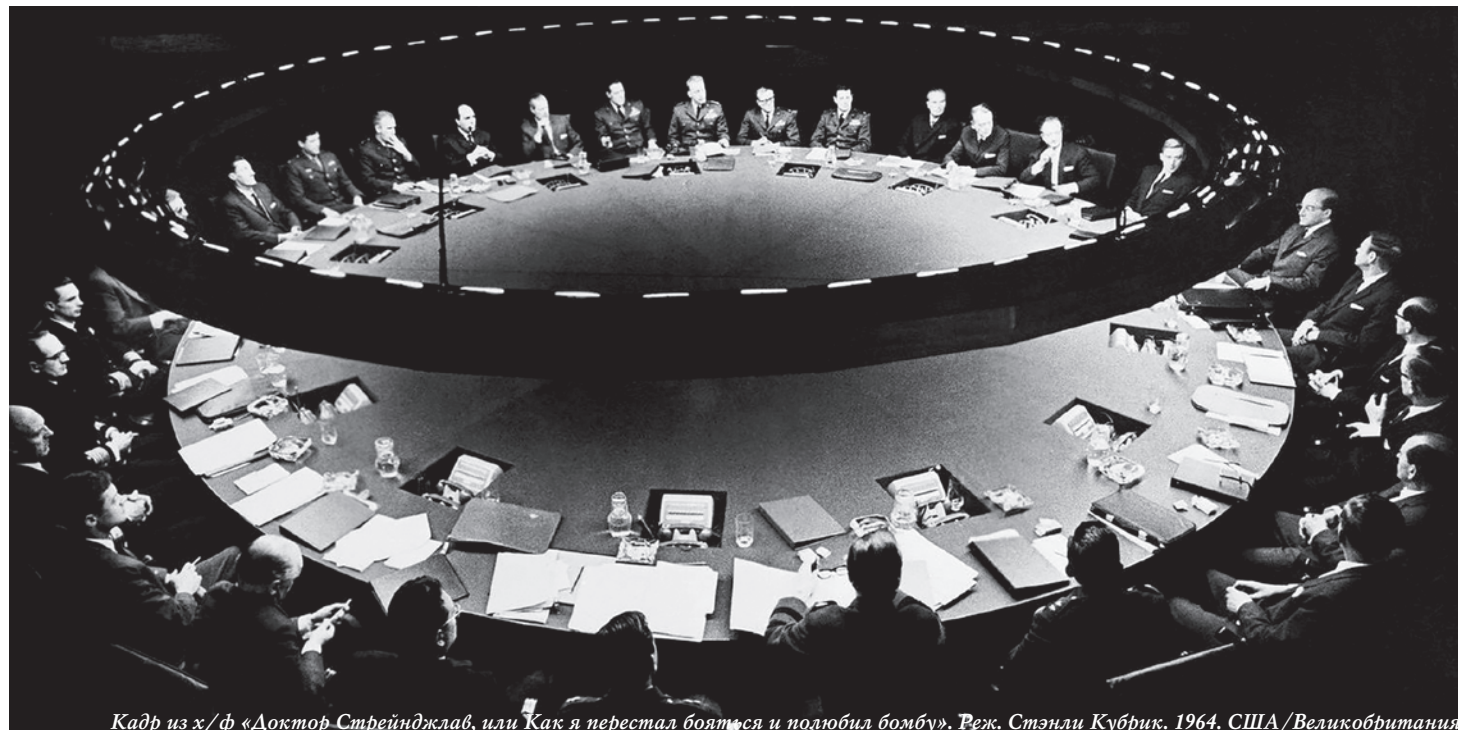
Кадр из х/ф «Доктор Стрейнджлав, или Как я перестал бояться и подлюбил бомбу». Реж. Стэнли Кубрик. 1964. США/Великобритания

Потенциал дальнейшей эскалации на Украине вызывает у нас серьезные опасения. Хотя большую часть своей активности Россия, несомненно, направит против украинских сил, также будет иметь место горизонтальная эскалация конфликта — то есть его расширение с включением других действующих лиц, прежде всего США и их союзников по НАТО. Горизонтальная эскалация становится всё более вероятной, хотя и не является неизбежной.