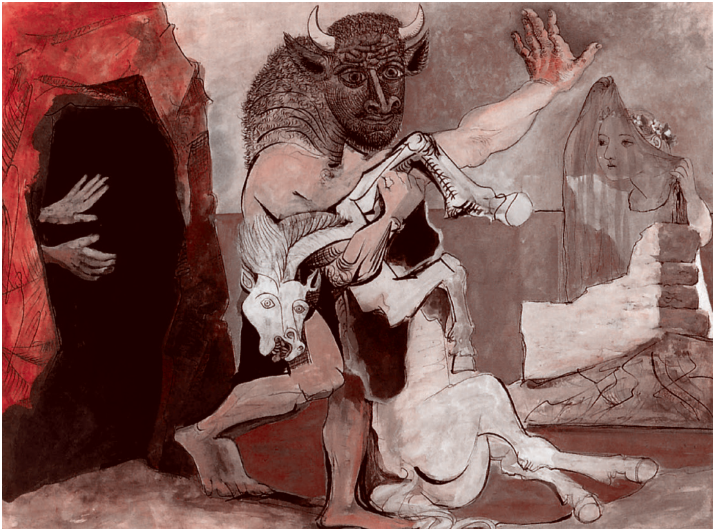
Пабло Пикассо, Минотавр с мертвой лошадию перед пещерой, 1953

Как тут сочеталась внутренняя потребность в упрощении и интересы западного хозяина — это другой вопрос. Важно, что некий коллективный детина долбанул всем этим административно-рыночным, политическим, идеологическим упрощенчеством по сложности так, что она разлетелась