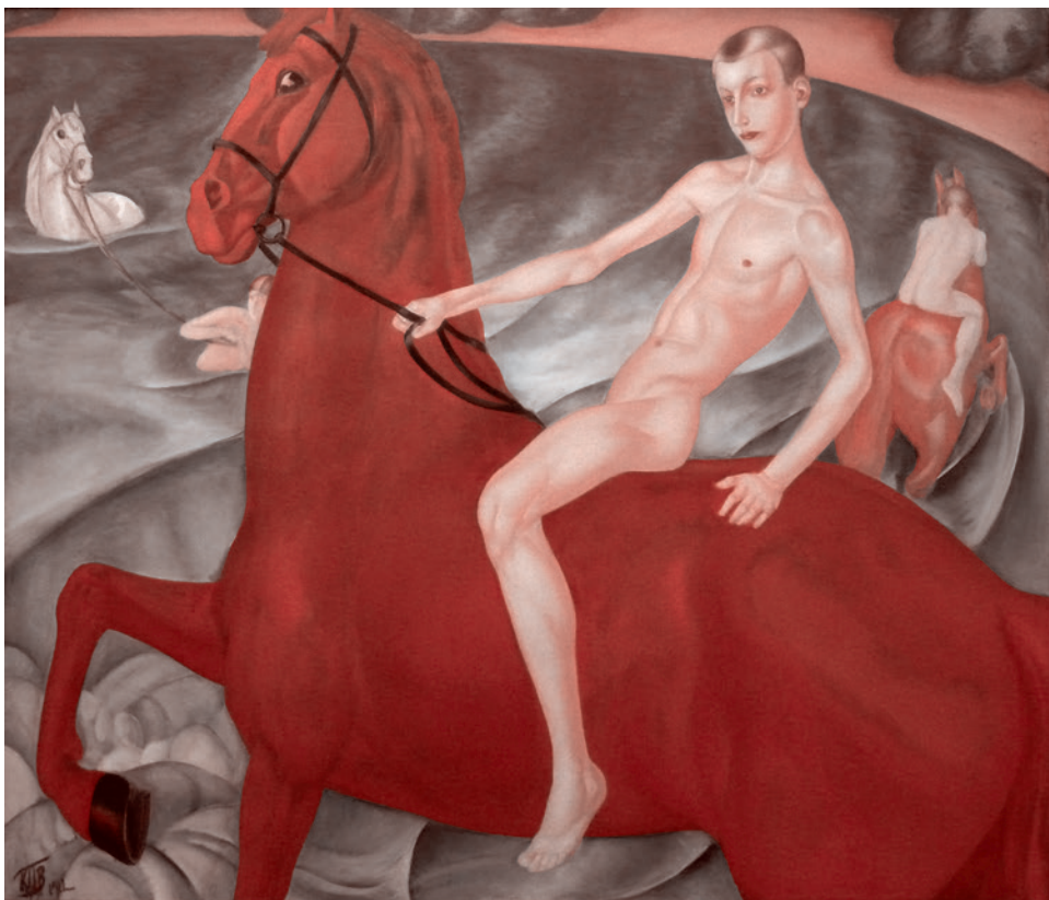
Кузьма Петров-Водкин, Купание красного коня

И, наверное, можно было попытаться снова это преодолеть, если бы не известное явление, одно-единственное, с которого всё началось. А явление это состояло в том, что всё сложное слишком дорого стоит и оно нам не по карману. Конечно, в этом была правда. Да, конечно сложное