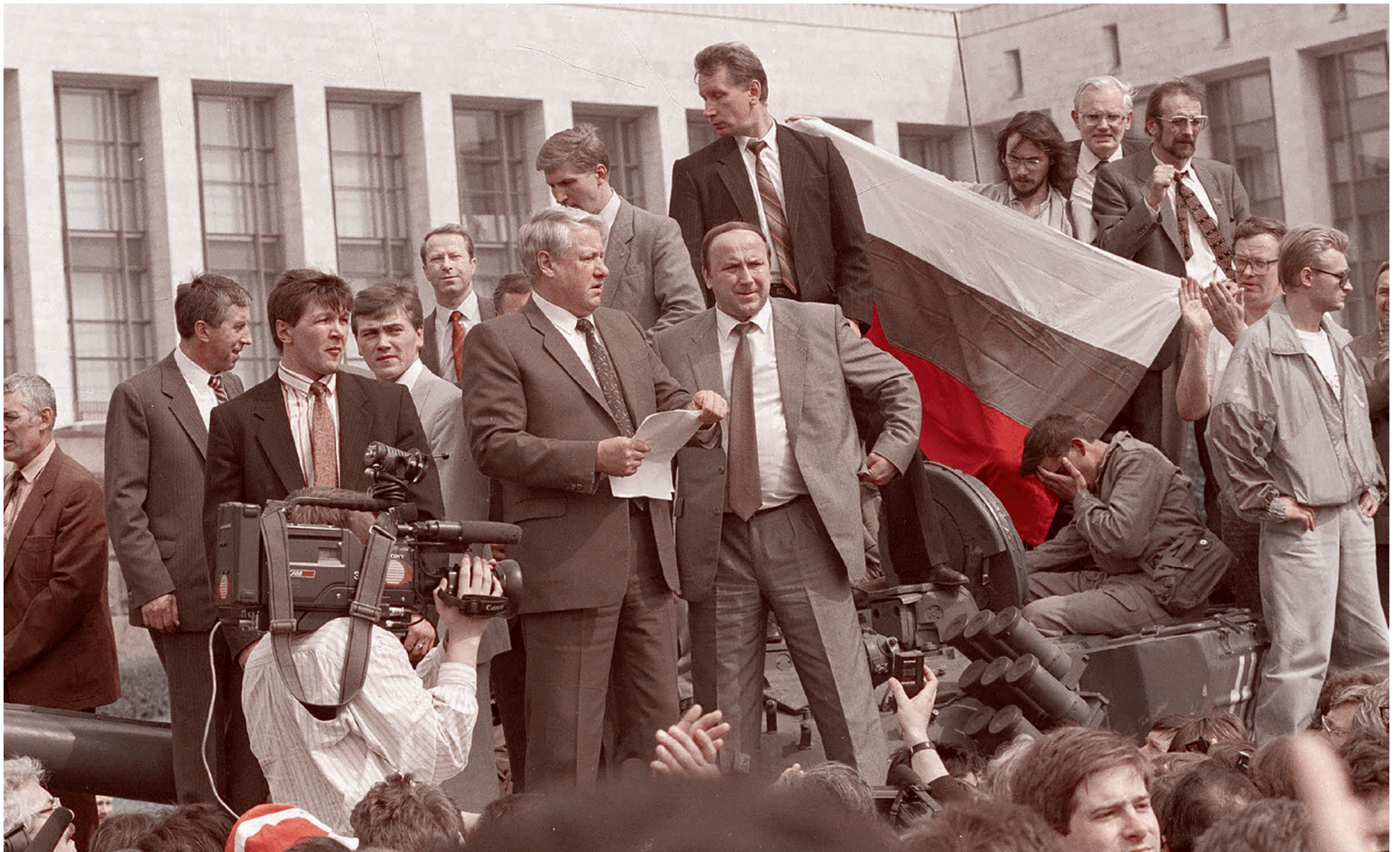
Борис Ельцин, Александр Коржаков и Виктор Золотов у Белого дома в августе 1991 года

Газета «Суть времени» зарегистрирована Федеральной службой по надзору в сфере связи, информационных технологий и массовых коммуникаций (Роскомнадзор) Свидетельство ПИ № ФС77-50554 от 9 июля 2012 года