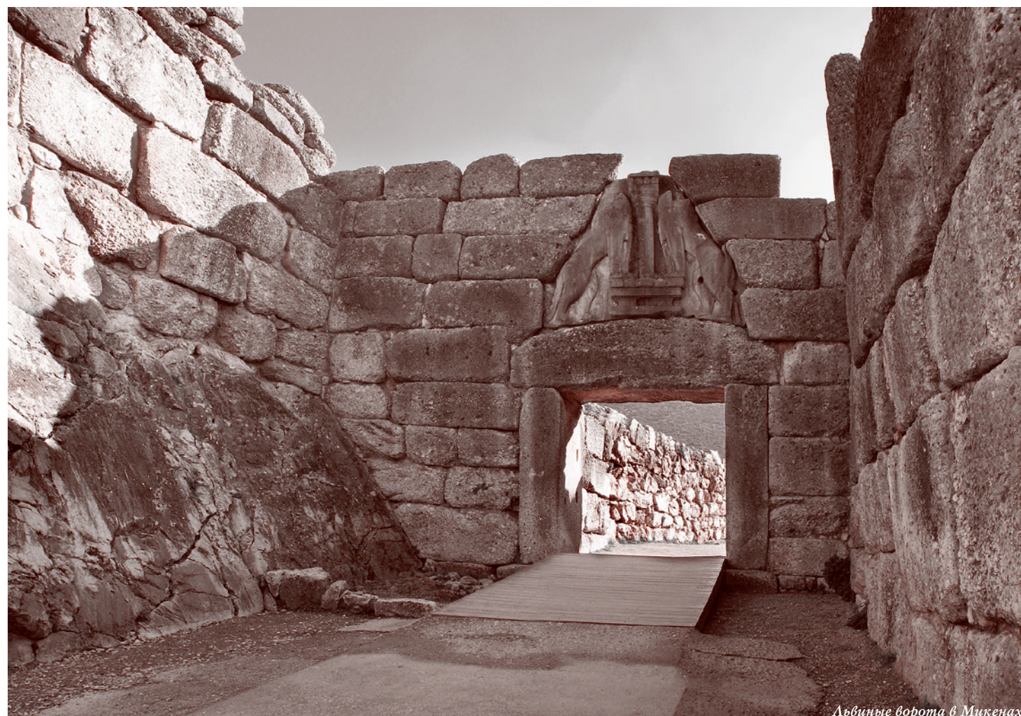
Львиные ворота в Микенах