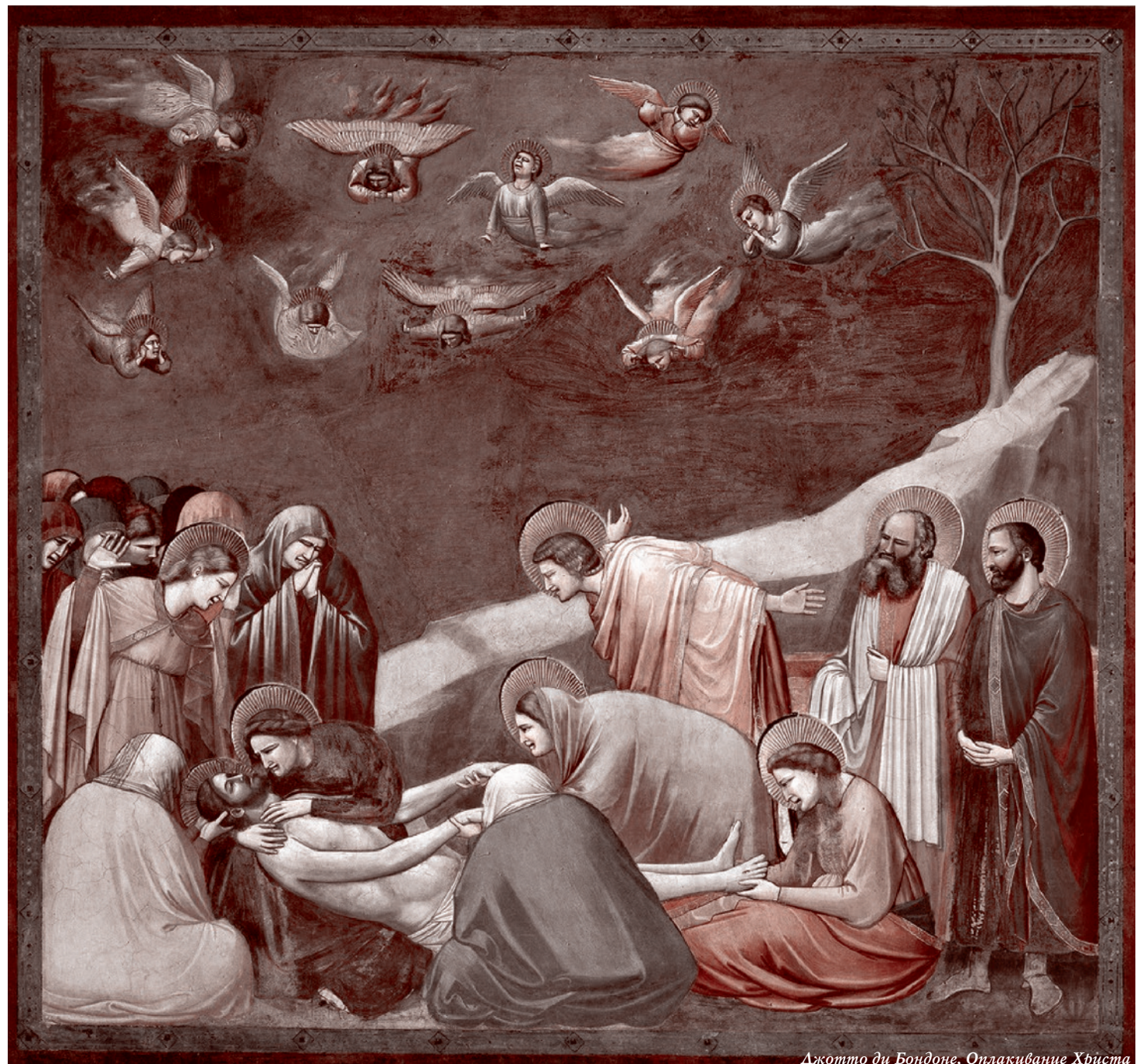
Джотто ди Бондоне, Оплакание Христа

Римская цивилизация со всеми ее водопроводами и прочим отнюдь не является предметом моего восхищения. В ней это крито-минойское изысканное злое начало, как мне кажется, просвечивает, — в цирках и многих других ее проявлениях. Но ведь понимаешь, что это была цивилизация. А потом ты видишь, как на ее месте образовалась типичная деградиционная свалка. И что обитатели этой свалки копошатся почти как звери, и выбираются из постримского регресса через много столетий. Столетий чего? Регресса.