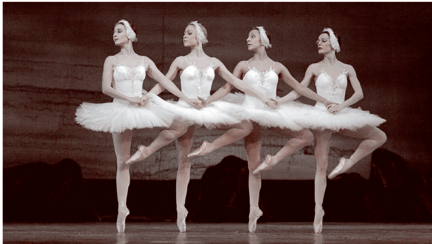
Балет «Лебединое озеро»

Вскоре отсутствие реальной деятельности стало меня угнетать. Я привыкла, что моя работа в ВЭИ была четко струк-