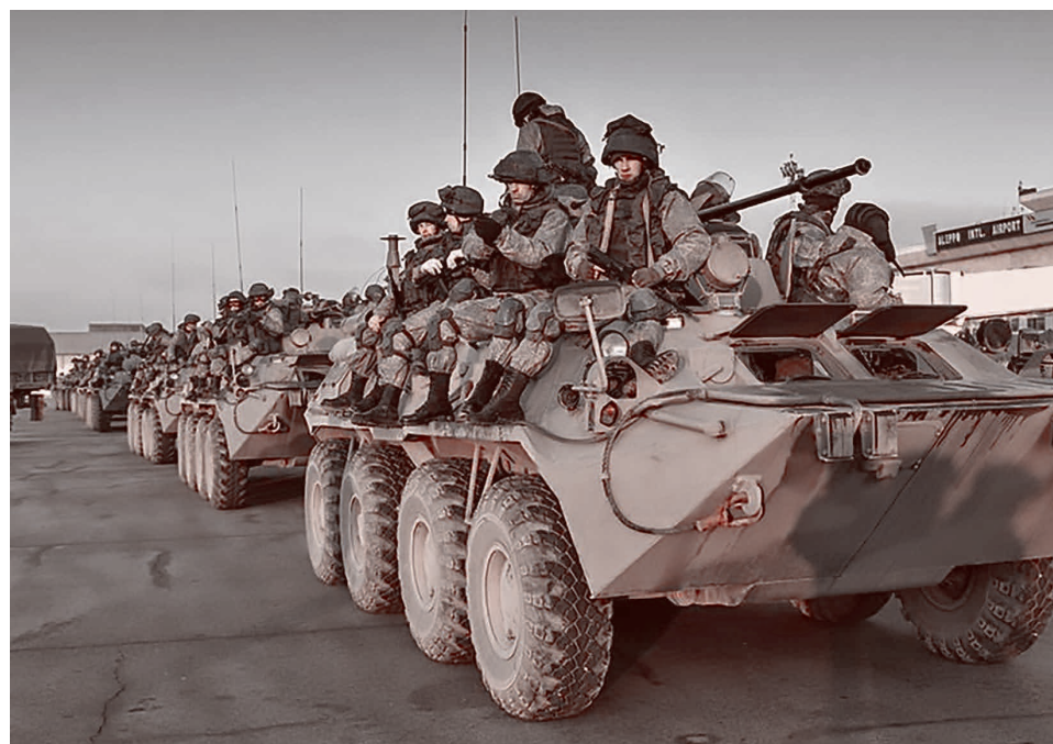
Российские военнослужащие

Стюарт обвинил администрацию Байдена в том, что ее действия контрпродуктивны для тех, кто пытается решить проблему нефтегазового сектора.