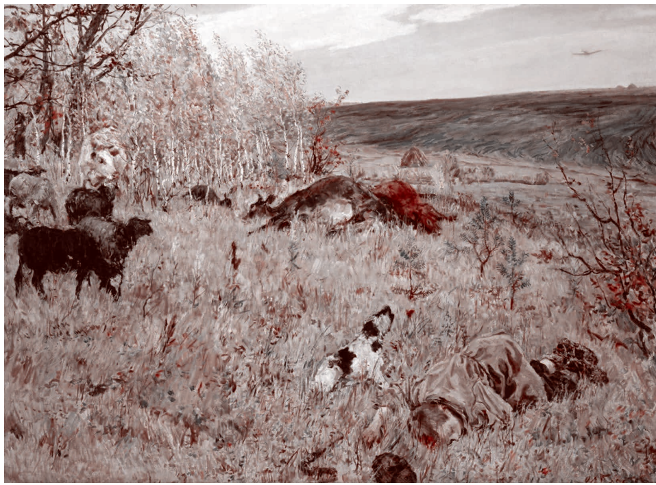
Аркадий Пластов. Фашист пролетел. 1942

дополненной реальности и навести на него высокоточные системы поражения.