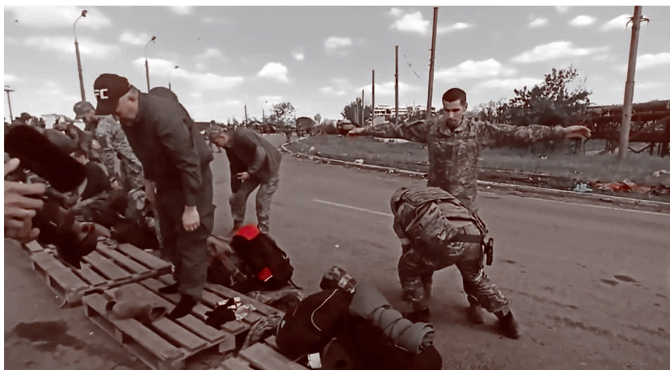
Обыск сдавшихся боевиков (кадр из ролика Министерства обороны России)

Министр обороны РФ Сергей Шойгу доложил Путину о завершении операции и пол-