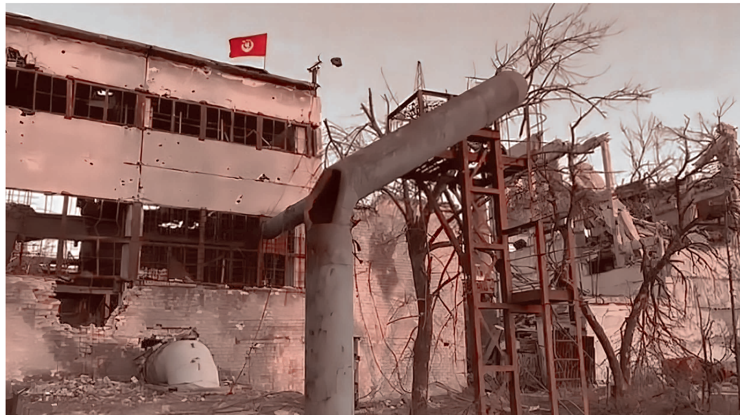
Над «Азовсталью» поднят красный флаг