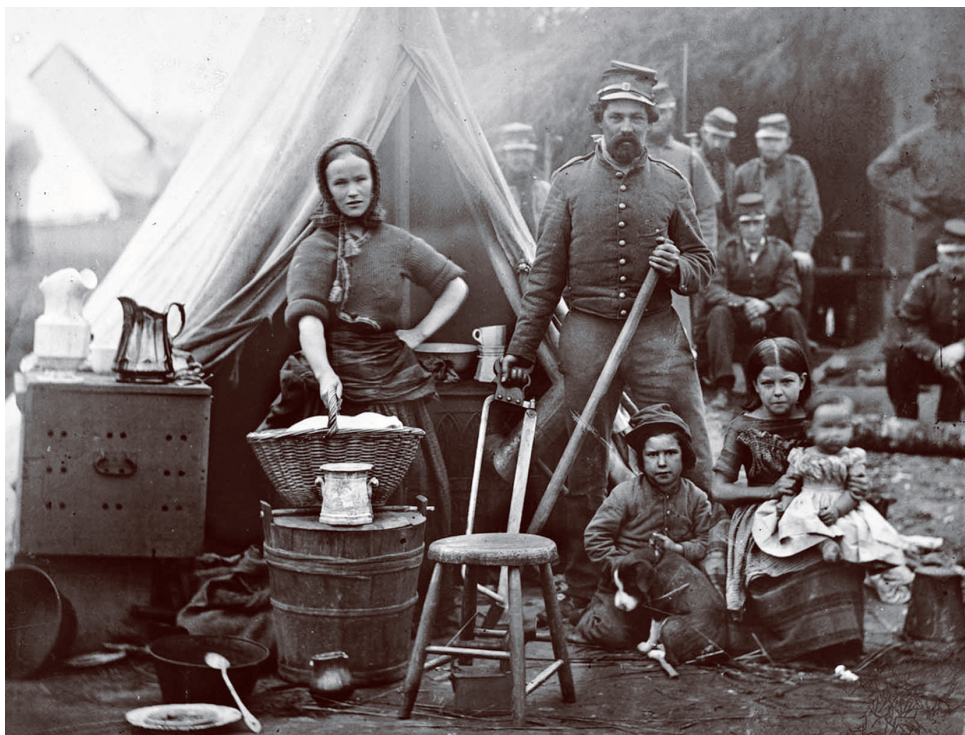
Повседневная жизнь в лагере 31-го пенсильванского полка под Вашингтоном, округ Колумбия, во времена Гражданской войны, 1861 г.

В третьей партийной системе, длившейся с 1854 по 1894, партией укрепления федерального центра и индустриализации стала новая Республиканская партия. В отличие от виггов, республиканцы быстро заняли позицию отмены рабства. А демократическая партия продолжала защищать суверенитет штатов, и главным направлением отстаивания этого суверенитета было право штатов самим устанавливать законы по отношению к рабству.