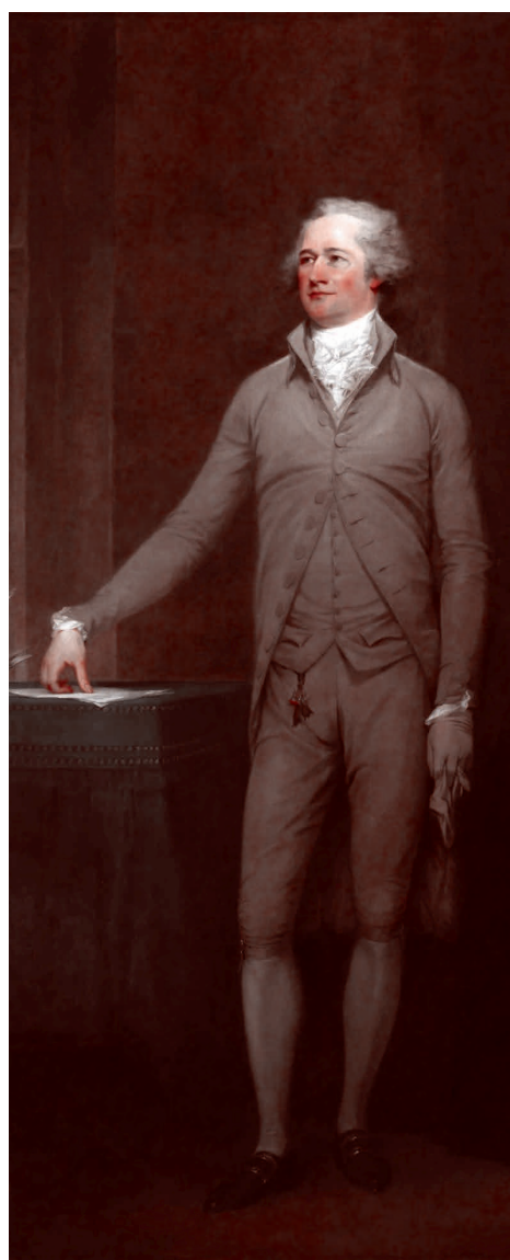
Джон Трамбулл. Портрет Александра Гамильтона, 1792

Виги активно проталкивали меры по экономической модернизации и считали, что США необходим центральный банк, политика протекционистских пошлин и бумажные деньги, против чего активно выступали демократы. Главная слабость вигов заключалась в том, что, будучи коалицией крупного капитала с Севера, готовящегося стать промышленным, и южных плантаторов, они не могли занять внятную позицию по отношению к институту рабовладения. Что в итоге, вместе с политикой экономического протекционизма, подтолкнуло плантаторов к уходу в стан демократов, и далее к упадку вигов на Юге.