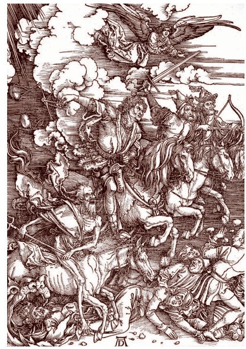
Альбрехт Дюрер. Четыре всадника Апокалипсиса. 1498