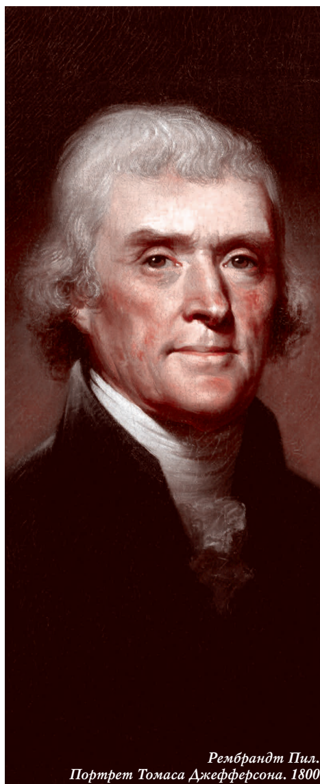
Рембрандт Пил. Портрет Томаса Джефферсона. 1800

Стоит начать с того, что двухпартийная система и политические партии вообще не предусмотрены Конституцией Соединенных Штатов. Конституция