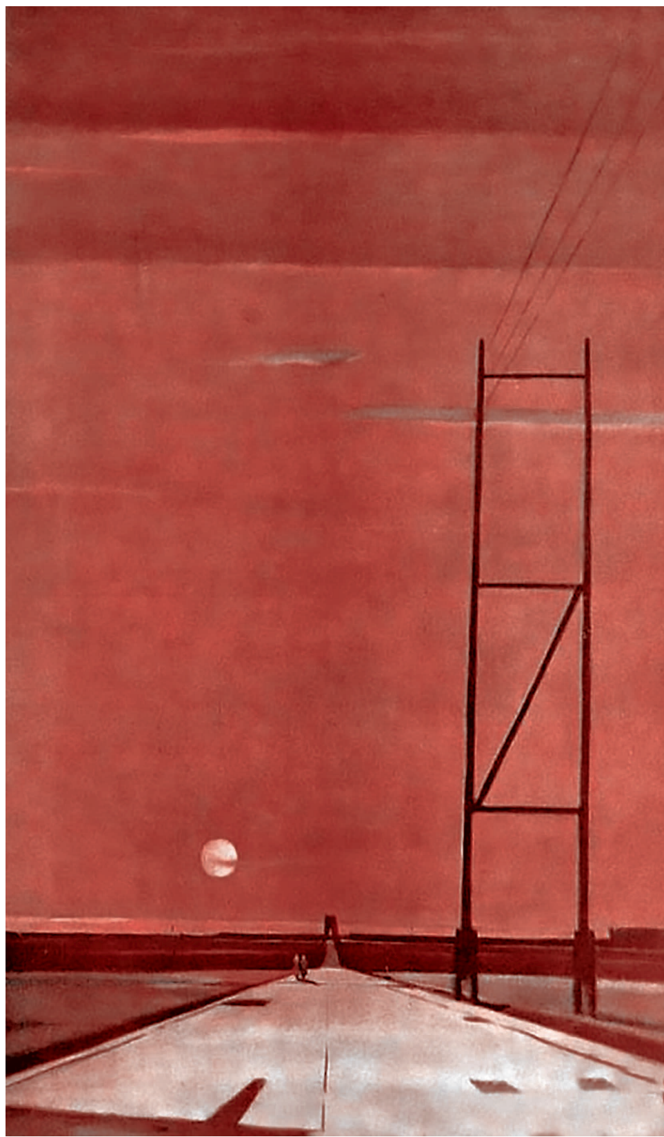
Георгий Нисский. Рокада. 1957

ли «глобализация», а сейчас «глокализация» — соединение глобального и локального. Так вот, мы сейчас, конечно, этим должны заниматься, но при этом не должны терять общую картину. Я лично считаю, что всё началось после падения «Азовстали». Почему? Если помните — мы же забываем довольно быстро — украинцы удивительно легко состраивают мифы. Но когда они их состраивают и нагнетают, то потом, когда это лопаются, возникает обратный эффект. «Это были киборги», — помните, да, в Донецком аэропорту? Потом, когда увидели, как они с дрожащими губами выходят, миф лопнул. Теперь был миф об «Азовстали». Была целая серия мифов. Первый: железные бойцы, которые никогда не отступят, это передовой отряд, равняться на них. Все говорят, да, вы нас