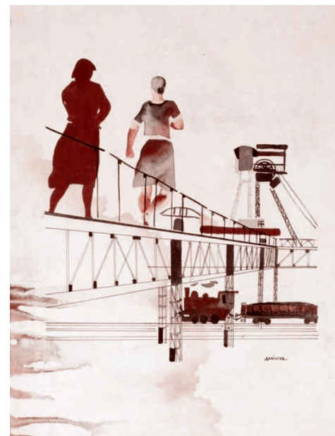
Александр Дейнека. Эскиз «На Донбассе». 1920-е

Во-первых, я поняла: если надо — выдержи. Когда следующим летом работала в ССО «Конаково», то на вопрос доброго парня: «Трудно девочкам жить в палатке?» — ответила искренне: «Что ты! В таких палатках!» Да, большие палатки внутри были обтянуты белой тканью, между ней и брезентом — утепление. Набит ровный деревянный пол — красота!