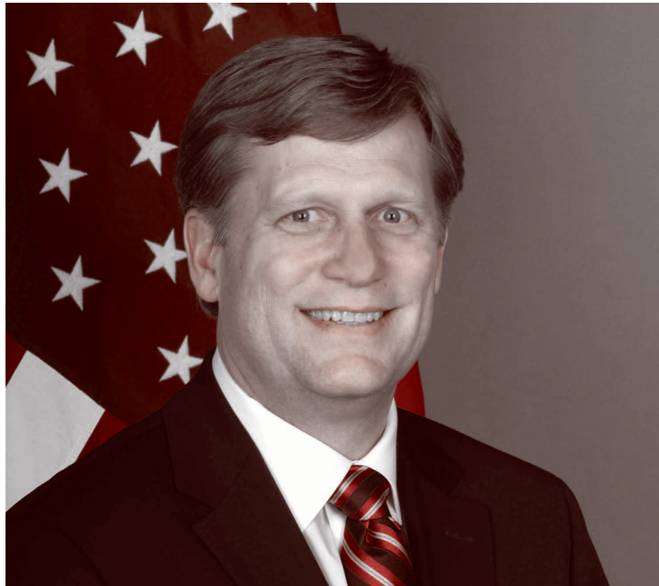
Майкл Макфол

Вячеслав Никонов: Вот он новый реальный мир! «Да, конечно, мы ввали!» — вот собственно в этом и есть реальность этого мира, в котором американцы развели Украину, Европейский союз на любые шаги, ко-