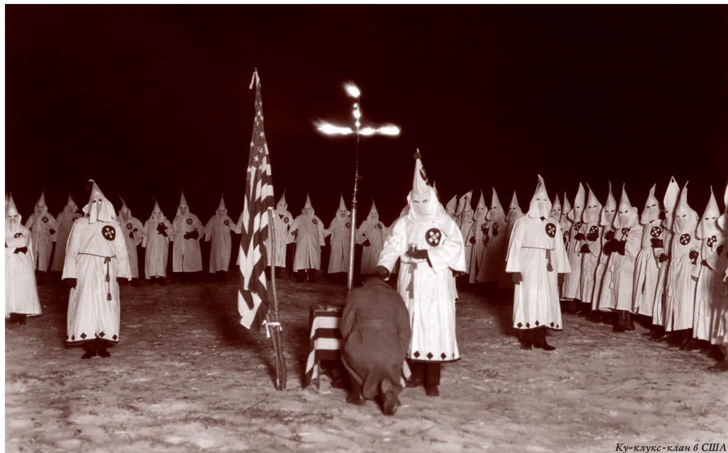
Ку-клукс-клан в США