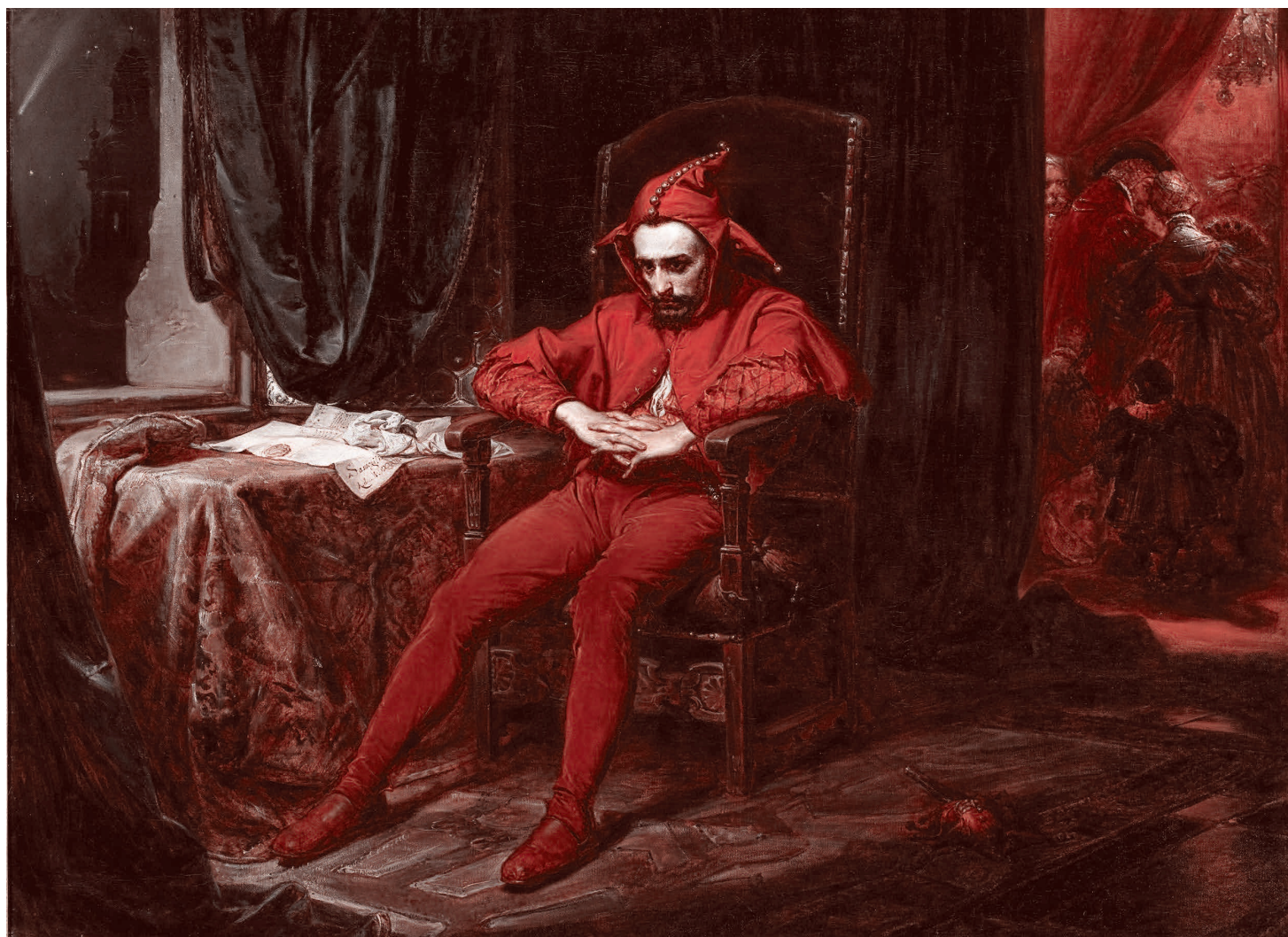
Ян Матейко. Станчик. 1862

либо молчать. Всё остальное считается вражеской пропагандой. Доходит до смешного: в середине мая конгрессмен-республиканец Метт Гейц пожаловался, что когда он и группа его однопартийцев проголосовали против принятия закона о ленд-лизе для Украины, то американская пресса назвала их «путинским крылом Республиканской партии». Хотя они всего лишь хотели сохранить выделяемые Конгрессом деньги для нужд американцев!