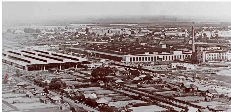
Вид завода Кирскабель 1970–1980. Россия, Кировская область, Верхнекамский район, Кирсинское городское поселение, Кирс

Мы жили в атмосфере «надо». Например, как-то к нам на факультет пришел врач и рассказал, что очень нужна кровь для переливания. Как сейчас помню — большой зал, на сцене молодой врач, его рассказ о больных. Особенно потряс меня ребенок с гидроцефалией — большущая голова всё время дергается на тонкой шейке. И мы поехали сдавать кровь! Была даже маленькая заметка в «Комсомоль-