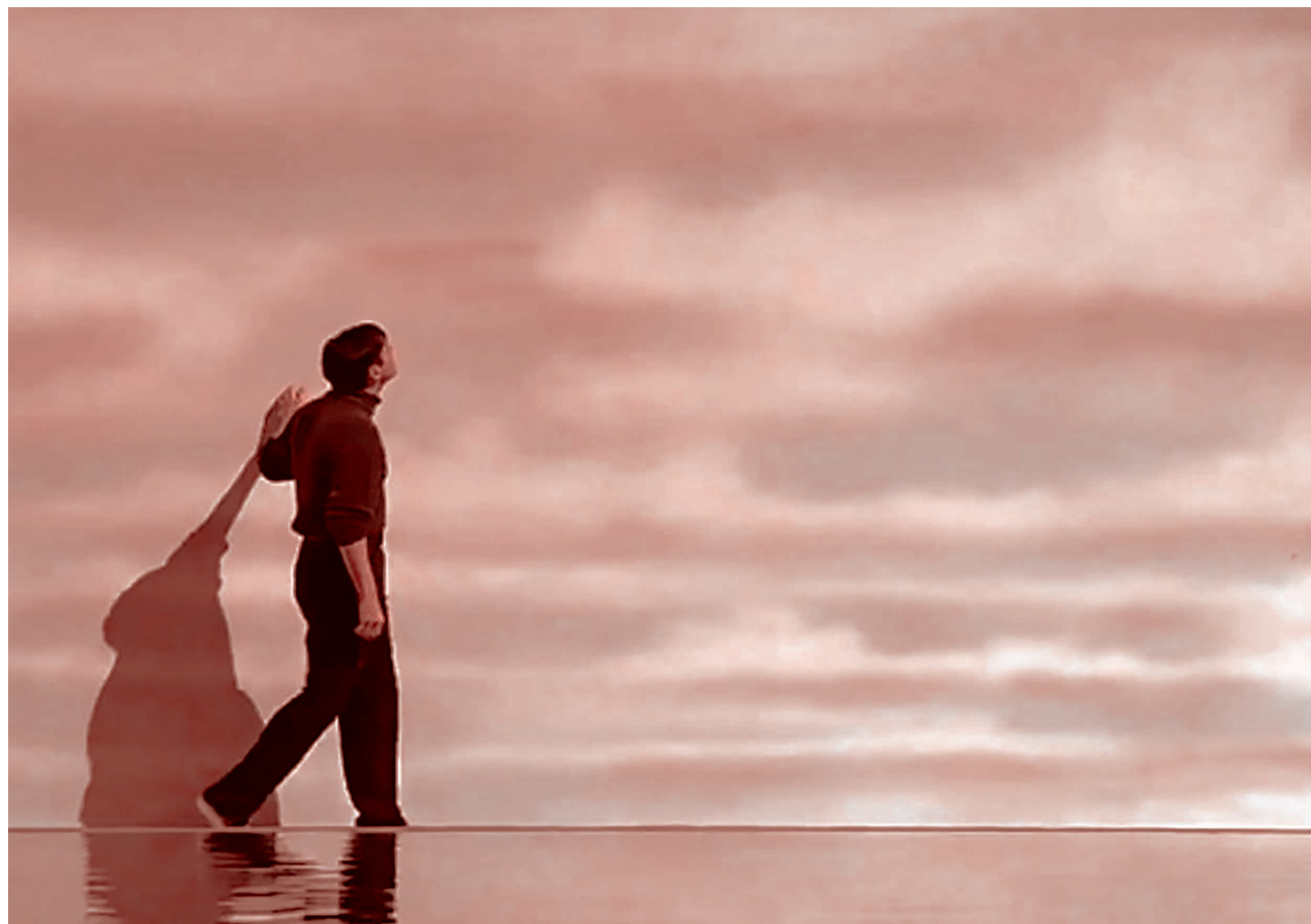
Кадр из фильма «Шоу Трумана». 1998

Напомним, что у Зеленского в 2019 году не было ни своей партии с поддержкой населения и развитой структурой на местах, ни опыта управления хозяйствующими субъектами, вообще ничего, кроме грамотного пиара и идеального попадания в давно перезревший запрос народа на смену правящих элит. Главным преимуществом Зеленского на выборах стала его абсолютная противоположность Порошенко,