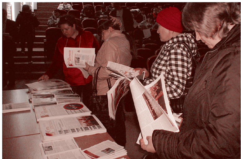
Родители из Красный Брод знакомятся с материалами РВС

В заключении хочу поблагодарить юристов нашего Юридического фронта РВС за помощь и юридическое сопровождение в решении семейных вопросов в нашем Кемеровском регионе.